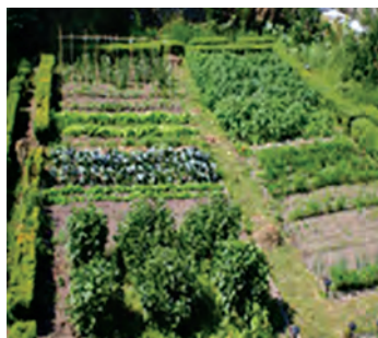
کرت های بادبواره خاکی