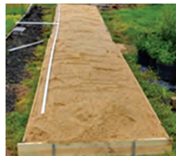
کرت در هوای آزاد بادبواره تخته