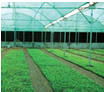
کرت داخل گلخانه

۱- کرت گل کاری: یکی از بسترها، کرت گل کاری می باشد تا در آن گیاهانی به منظور تولید نشای گل های فصلی و پرورش گل های شاخه بریده بکاریم. نحوه درست کردن این نوع کرت مانند کرت سبزی کاری است.