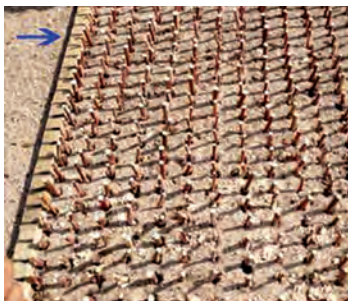
رویش قلمه ها

۱- کرت گل کاری: یکی از بسترها، کرت گل کاری می باشد تا در آن گیاهانی به منظور تولید نشای گل های فصلی و پرورش گل های شاخه بریده بکاریم. نحوه درست کردن این نوع کرت مانند کرت سبزی کاری است.