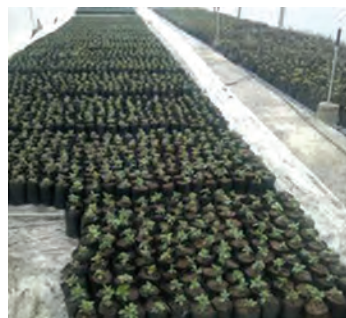
پلاستیک گلدانی پس از کاشت