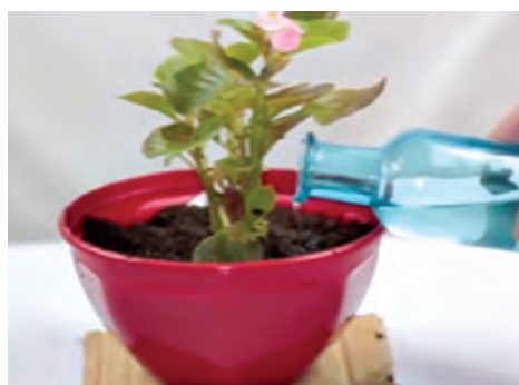
مراحل تعویض گلدان