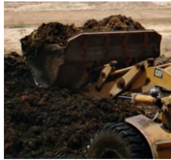
کود دامی پوسیده