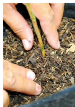
آمیزه‌هایی با پیت ماس برای قلمه کاری