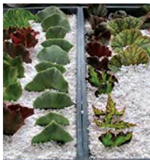
پرلیت برای قلمه کاری