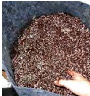
کوکوپیت و پرلیت برای قلمه کاری