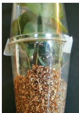
فقط ورمیکولیت برای قلمه کاری