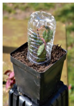
۲ پیمانہ ماسه رودخانه‌ای + ۱ پیمانہ کوکوپیت یا پیت ماس و یک پیمانہ پرلیت برای قلمه کاری