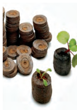
تکه‌های پیت ماس فشرده برای قلمه کاری