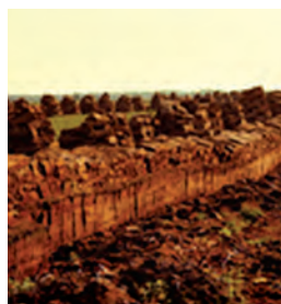
معدن پیت ماس

برخی دیگر از خاک ها را که در مخلوط های خاکی مورد استفاده قرار می گیرد در شکل های زیر می بینید.