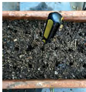
خاک برگ ۱ پیمانہ-ماسه رودخانه‌ای ۲ پیمانہ برای قلمه کاری