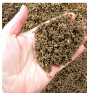
فقط ماسه رودخانه‌ای برای قلمه کاری