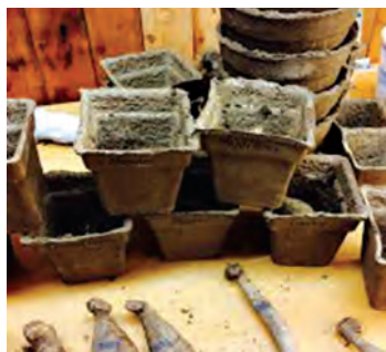
گلدان کاغذی یکبار مصرف