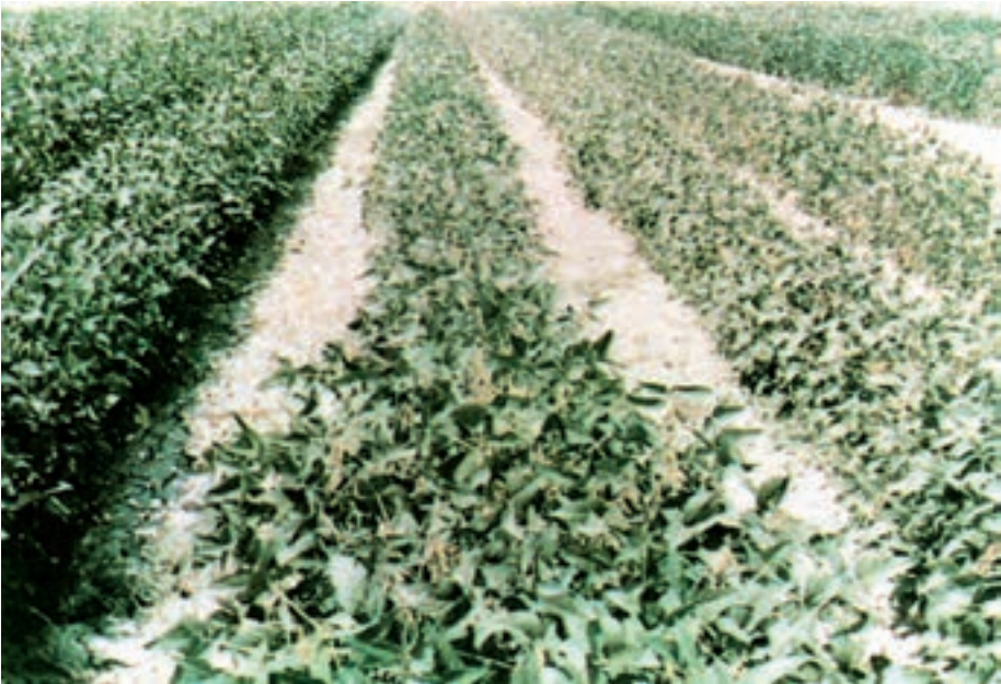
شکل ۸-۳- زراعت سویا به صورت ردیفی

سویا اغلب به صورت ردیفی کشت می‌شود؛ اگر چه در بعضی مناطق کاشت درهم و کرتی نیز معمول است. به هر حال کاشت ردیفی آن همانند اغلب محصولات، بهترین روش کاشت است (شکل ۸-۳).