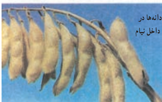
دانه‌ها در داخل نیام