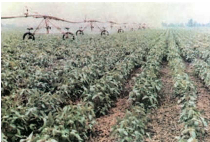
شکل ۹-۳- آبیاری به روش بارانی در سویا

تمام عملیات داشت را به روشی که هنرآموزان شما تأیید می‌کنند، انجام دهید.