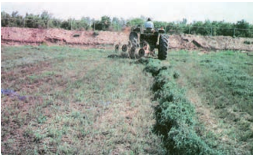
شکل ۷-۲- عملیات ردیف کردن یونجه (ریک)

حدود ۱۲-۲۴ ساعت بعد، یونجه‌های ردیف شده به وسیله‌ی دستگاه دنباله‌بند دیگری به نام بیلر (دستگاه بسته‌بند) بسته‌بندی می‌شود (شکل ۸-۲).