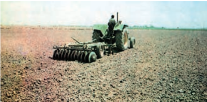
شکل ۲-۲- عملیات دیسک زدن در زراعت یونجه

۱- آماده‌سازی فیزیکی: در آماده‌سازی فیزیکی خاک یونجه، باید دقت زیادی به عمل آورد. زمین یونجه باید یکنواخت، پوک، با ماده‌ی آلی کافی حداقل ۱/۵ درصد و عاری از علف‌های هرز باشد. در موقع تهیه‌ی زمین، باید به شیب زمین و امتداد نه‌رهای آبیاری و زهکشی و هم‌چنین روش آبیاری توجه زیادی داشته باشیم. برای ایجاد تخلخل کافی در خاک، در پاییز حداقل یک ماه قبل از کاشت پس از مصرف حدود ۳۰ تن کود دامی شخم عمیق زده می‌شود. سپس اقدام به نرم و هموار کردن خاک و گاهی فشرده کردن لایه ۲-۳ سانتی متر سطح خاک جهت اتصال بهتر بذور با خاک می‌نمایند. در صورتی که ماده‌ی آلی خاک بالا باشد و خطر سله مطرح نباشد، اجرای اتیواتور نیز مناسب است. در کاشت بهاره به منظور نرم کردن سطح خاک و از بین بردن علف‌های هرزی که ممکن است رویده شده باشند می‌توان از کولتیواتور هم استفاده کرد. شکل‌های ۲-۲ و ۲-۳ عملیات آماده‌سازی فیزیکی خاک را در زراعت یونجه نشان می‌دهند.