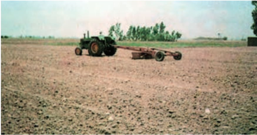
شکل ۲-۳- تسطیح کردن زمین توسط زمین صاف‌کن (لندلولر)