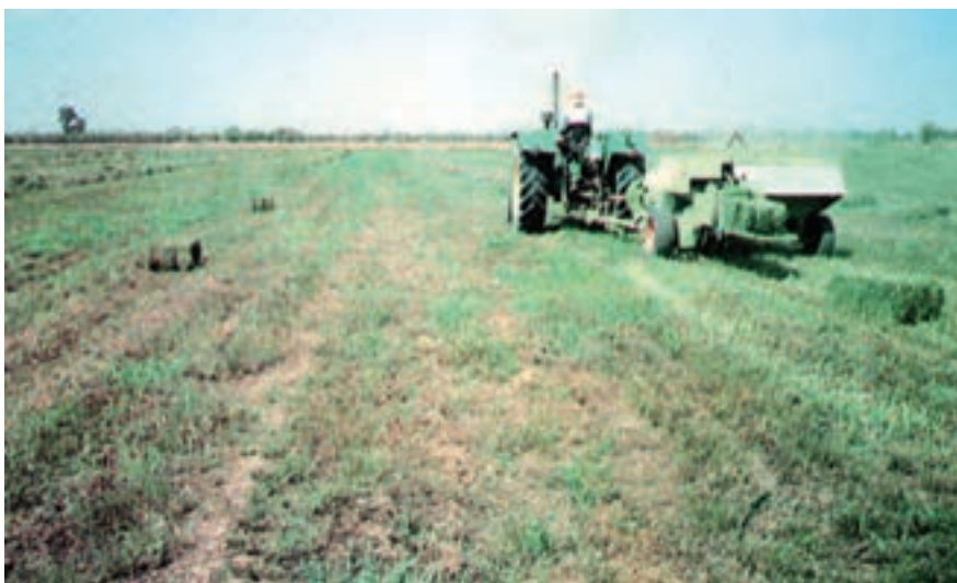
شکل ۸-۲- عملیات بسته‌بندی یونجه با دستگاه بیلر