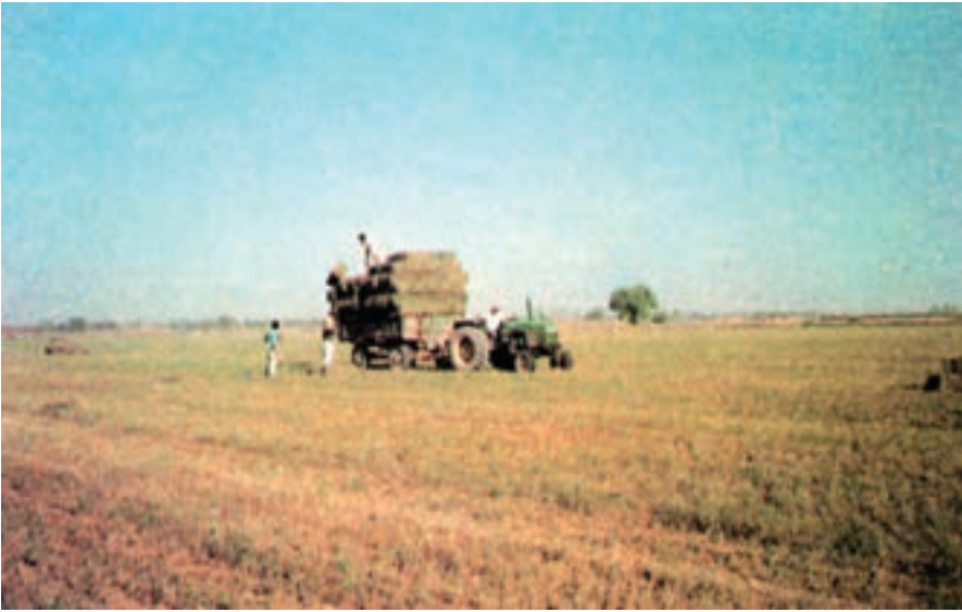
شکل ۹-۲- جمع آوری و انتقال بسته‌ها