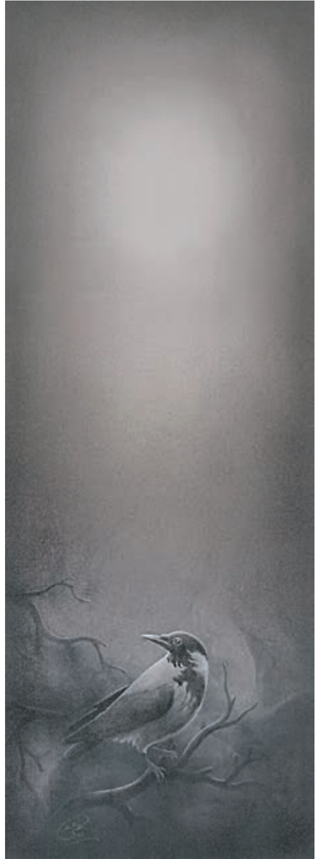
اثر : عبدا... حاجیوند (نقاشی برای همین کتاب)

کادر عمودی برای مرگ در آسمان و افقی برای مرگ در دریا انتخاب شده اند.