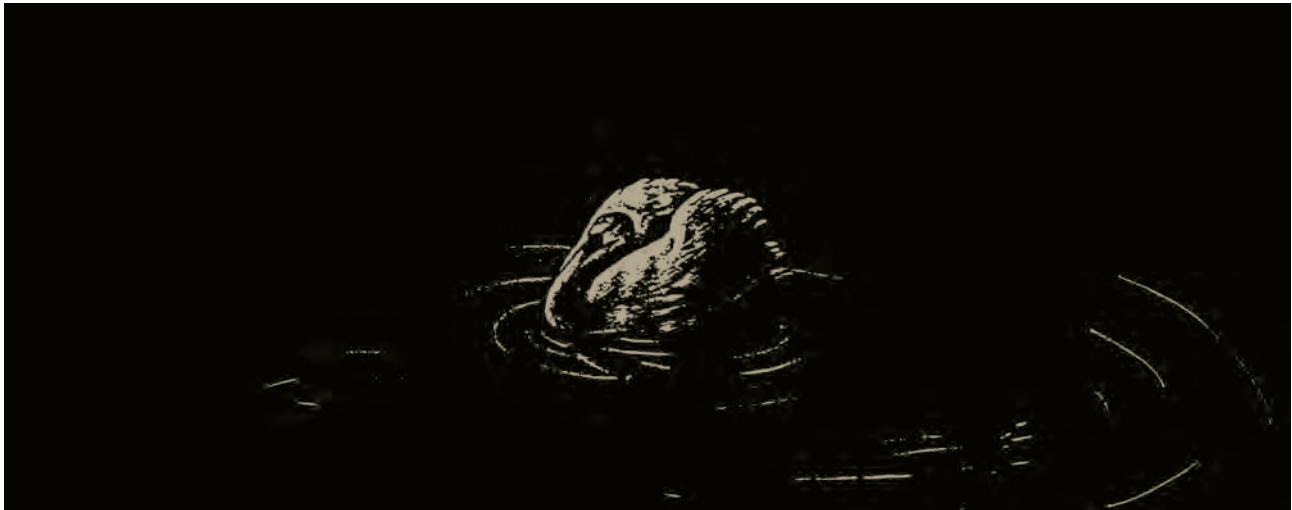
اثر : عبدا... حاجیوند (نقاشی برای همین کتاب)