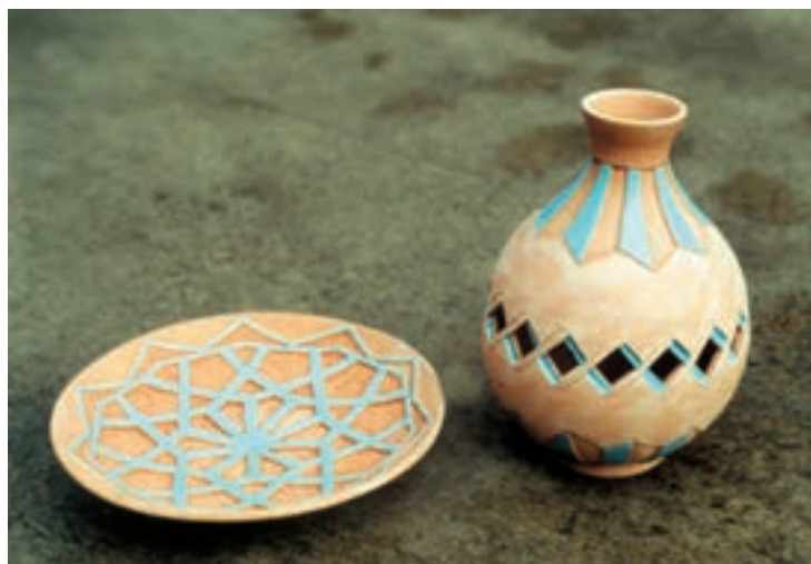
تصویر ۹- تزیین بدنه با ترکیب روش نقش بریده و نقش کنده — ساخت و تزیین: عذرا جوادی، هنرمند کارگاه سفالگری مدیریت پژوهش‌های هنرهای سنتی سازمان میراث فرهنگی کشور