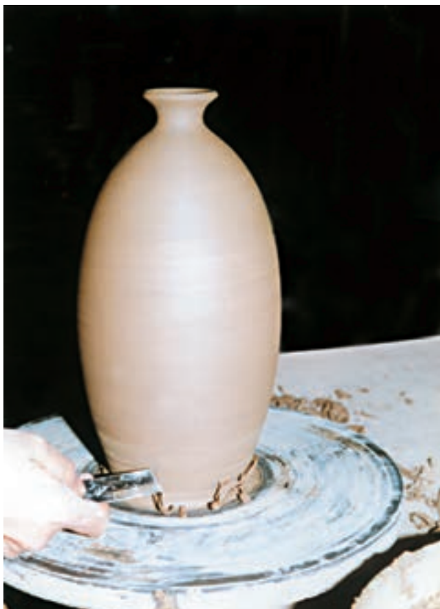
تصویر ۶۱- تراشیدن محل تماس ظرف و سرچرخ برای برداشتن آن

بعد از تراش، بدنه با اسفنج مرطوب یکنواخت و صاف می‌شود (تصویرهای ۶۰ و ۶۱). در پایان ظرف را برای خشک شدن در خشک‌کن، گرمخانه ۱ یا محل مناسب دیگری قرار می‌دهند