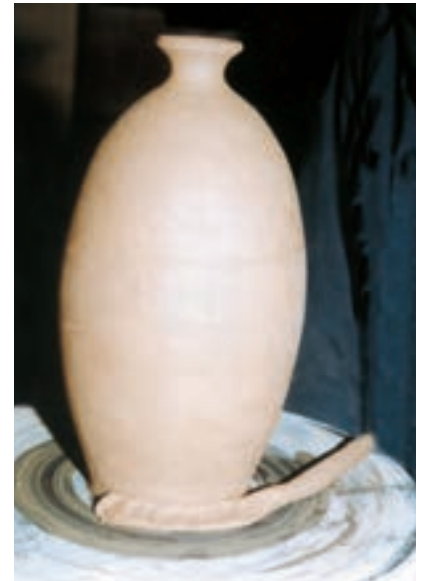
تصویر ۵۵ - قراردادن فتیله گل در محل تماس ظرف و سرچرخ