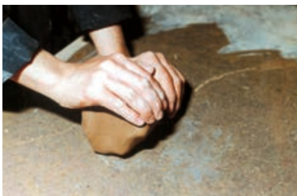
تصویرهای ۷ و ۸ - ورز دادن گل