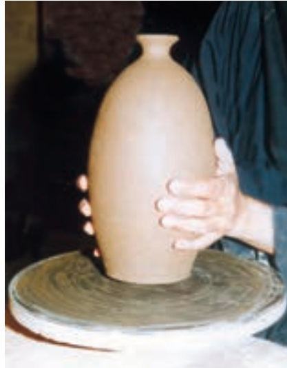
تصویر ۵۴ - قراردادن ظرف روی مرکز سرچرخ

۶- پرداخت: پرداخت مرحله‌ای است که در آن سفالگر اصلاحات لازم را روی بدنه انجام می‌دهد. برای پرداخت، بدنه باید در حالت «نیمه خشک»، «دووم» یا «چرمینه» باشد. در حالت چرمینگی، بدنه رطوبت خود را تا حد زیادی از دست داده و قابلیت شکل‌پذیری چندانی ندارد ولی از استحکام نسبی خوبی برخوردار است، به طوری که با زدن ضربه‌های آرام به بدنه، صدای