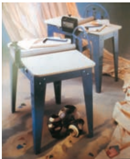
تصویر ۵- نوع دیگری از دستگاه غلتکی لوحه‌سازی ثابت

ساده‌ترین وسیله برای تخت کردن خمیر وردنه است ولی دستگاه مکانیکی لوحه سازی غلتکی نیز وجود دارد که خمیر تخت شده یکنواختی را به وجود می‌آورد. برای بریدن قسمت‌های مختلف بدنه از ابزار برش استفاده می‌شود و بعد از اینکه خمیر،