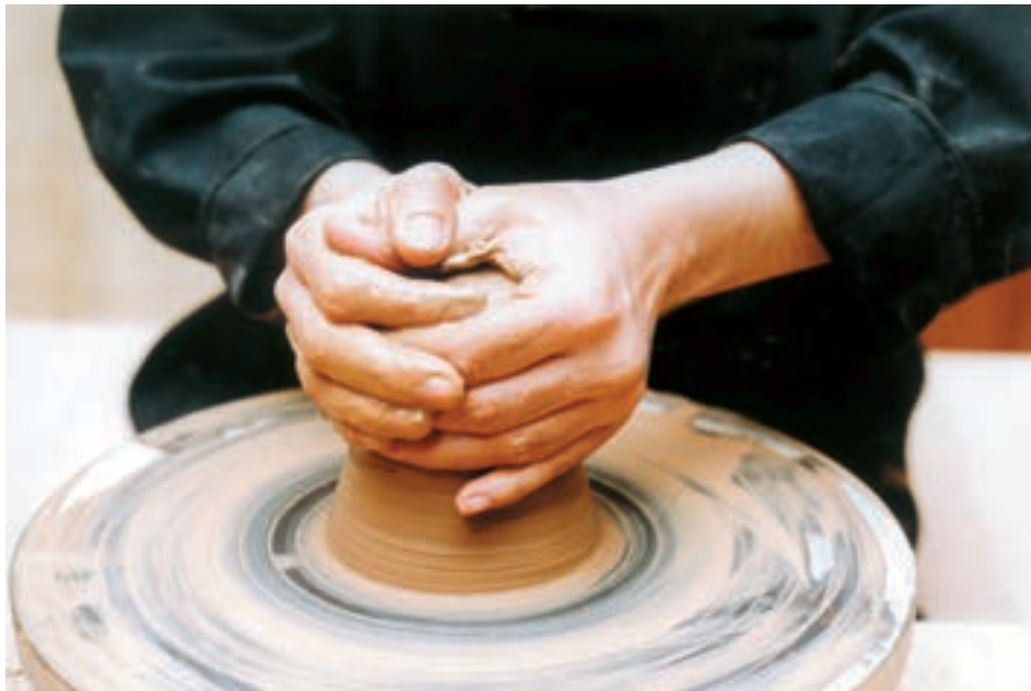
تصویر ۱۲- مسطح کردن سطح فوقانی استوانه توپُر

۳- باز کردن استوانه توپُر: در این مرحله، مرکز سطح فوقانی خمیر را مشخص کرده، کمی آن را مسطح می‌کنند، سپس دو دست را در اطراف چانه قرار داده و با فشار دو انگشت شست بر مرکز گنبد، به تدریج حفره‌ای در آن پدید می‌آورند. با