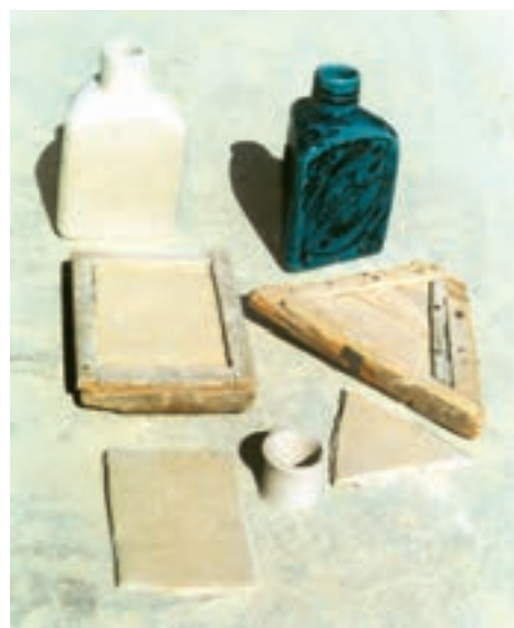
تصویر ۶ - شکل‌دهی به وسیله قالب چوبی - کارگاه بهاری - شهرضا

۳-۲ - شکل‌دهی به وسیله قالب: بسیاری از باستان‌شناسان معتقدند که سفالینه‌های اولیه از اندود کردن سبدهای بافته شده با خمیر گل پدید آمده است. به عبارت دیگر می‌توان گفت که سبد اولین قالبی است که انسان برای ساخت ظروف از آن یاری گرفته است. در این روش، قالب نقش مهمی در شکل‌دهی ظروف دارد. به طوری که با قراردادن ورقهٔ خمیر گل درون قالب و فشار ملایم در تمام سطح، خمیر شکل قالب را به خود گرفته و بدنه‌های زیادی را می‌توان به این ترتیب تکثیر کرد. این قالب‌ها می‌تواند از گچ یا چوب باشد (تصویر ۶). قالب گاهی محدب و گاهی مقعر است و توسط یک تیغهٔ شکل دهنده می‌توان به خمیر روی قالب شکل داد. (مانند آنچه در دستگاه جیگرو جولی اتفاق می‌افتد).