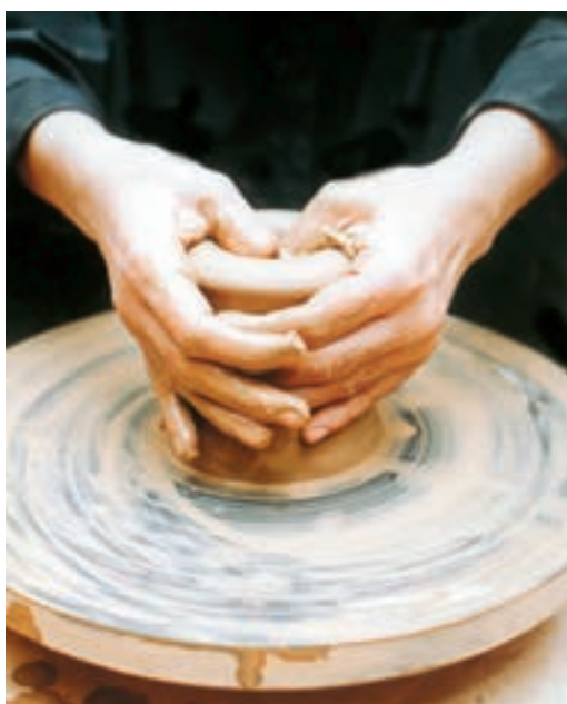
تصویر ۱۳- مراحل بازکردن استوانه توپر