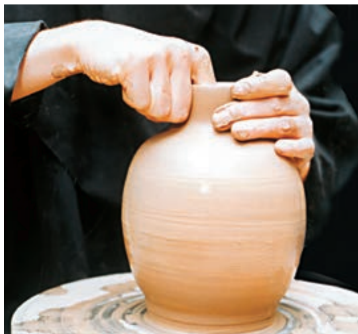
تصویرهای ۴۴ و ۴۵- جمع کردن و شکل دادن گردن کوزه