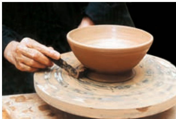
تصویر ۳۱- کم کردن ضخامت پایه کاسه

۴-۱- جدا کردن ظرف از روی سرچرخ: بعد از شکل‌دهی کاسه، برای جداسازی آن از سرچرخ باید دور چرخ را کندتر کرد. سپس با ابزار تراش‌دهنده از قسمت ضخیم پایه کاسته و سپس دوسر مفتول سیمی یا نخ برش، را با دو دست گرفته و در حالت موازی با سطح سرچرخ، از کمی پایین‌تر از قسمت تحتانی