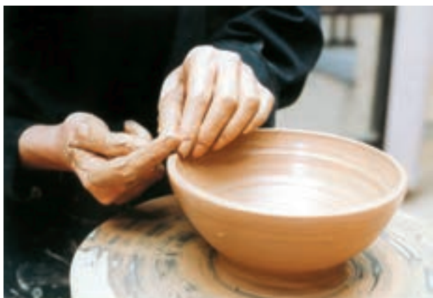
تصویر ۲۵- صاف کردن لبه بریده شده