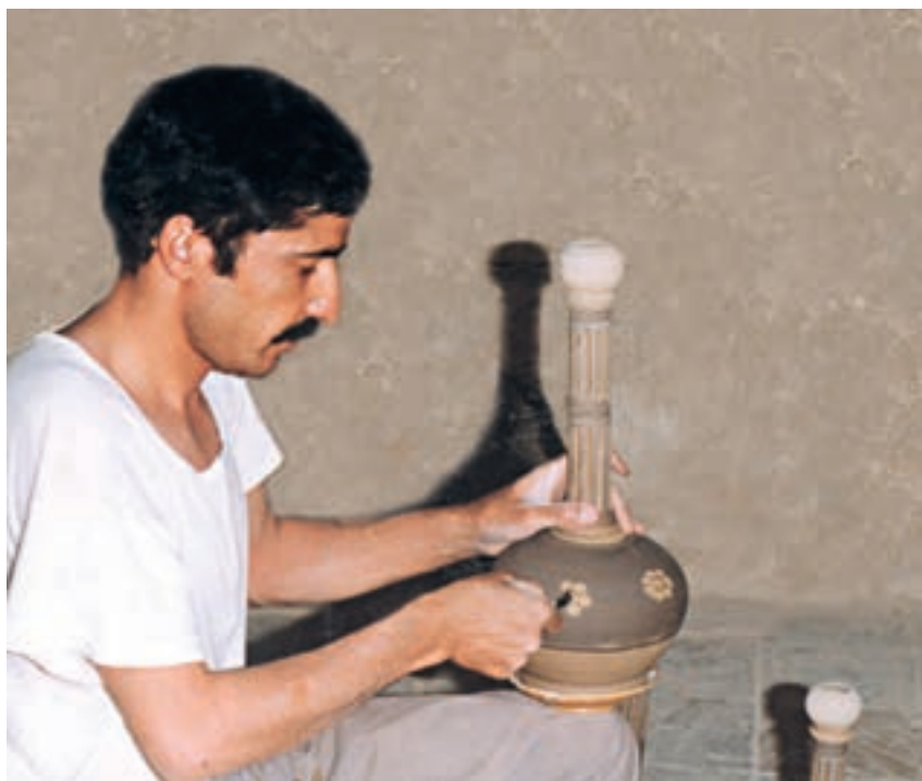
تصویر ۲- مراحل تزیین ظروف به روش نقش کنده - کارگاه سهیلی - شهرضا

در بعضی از مراکز سفالگری سنتی ایران، وقتی بدنه خام به حالت چرمینگی رسید، ابتدا تمام سطح بدنه را با لایه‌ای از دوغاب رنگی پوشانده و هنگامی که آب اضافی خود را از دست داد، با