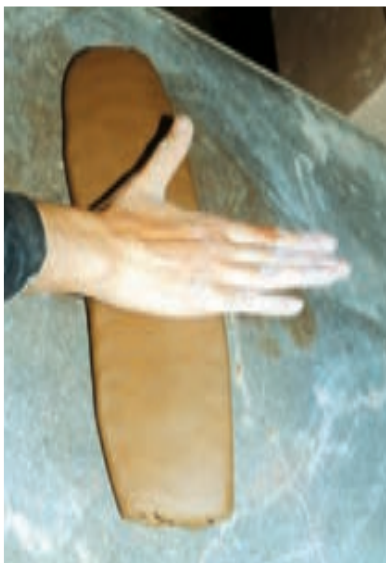
تصویر ۵۷ - آماده کردن کالی

گاهی نیز برای حفاظت لبه‌های ظروف از «کالی» استفاده می‌شود. «کالی» استوانه‌ای سفالی به اندازه متناسب با سری یا ته بدنه یا داخل و خارج ظرف است (تصویرهای ۵۷ و ۵۸). با حصول اطمینان از در مرکز بودن و همچنین محکم بودن کالی و ظرف، در