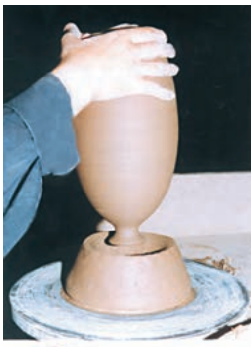
تصویر ۵۸ - قرار دادن ظرف درون کالی