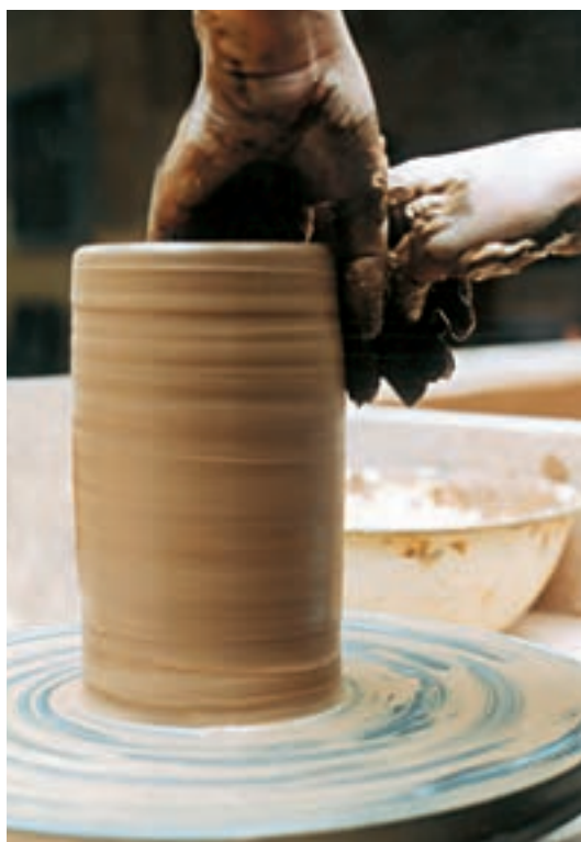
تصویر ۳۵ - ساخت استوانه