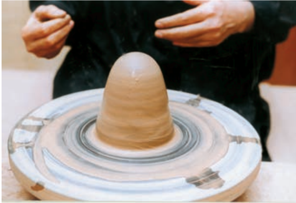
تصویر ۱۱- استوانه توپُر

افزایش فشار انگشت شست و سایر انگشتان بر دیواره، حفره گشادتر می‌شود. از این پس خمیر، شکل ظرف را به خود می‌گیرد (تصویرهای ۱۲ تا ۱۶).