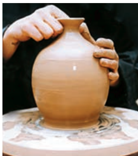
تصویر ۴۸- صاف کردن لبه با انگشتان