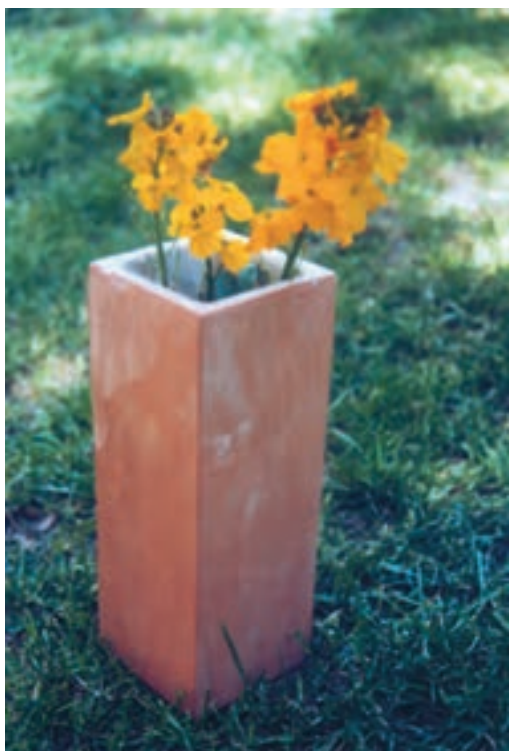
تصویر ۲- بدنه سفالی که به روش مسطح ساخته شده است. سازنده بدنه: موسوی