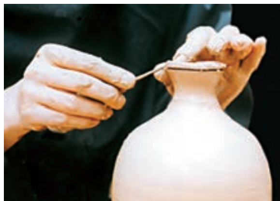
تصویر ۴۶- بریدن لبه کوزه با ابزار برش