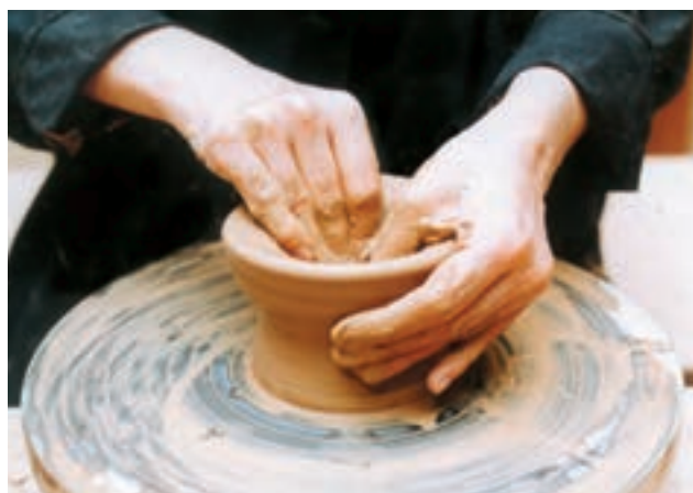
تصویر ۱۶- گشاد کردن دیواره ظرف