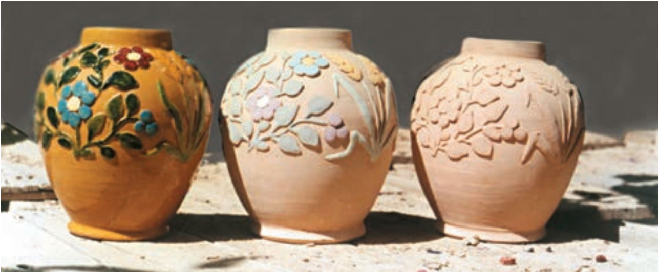
تصویر ۳- مراحل تزئین بدنه به روش نقش افزوده - کارگاه سفالگری سهیلی در شهرضا

است. در روش خمیری، نقش به صورت تکه‌هایی از خمیر و مطابق طرح شکل داده شده و روی بدنه خام چسبانده می‌شود. برای اتصال نقوش، محل موردنظر را خراش داده و با مقداری دوغاب بدنه، دو تکه را با کمی فشار به هم می‌چسبانند. با اطمینان از اتصال نقوش، می‌توان با اسفنج مرطوب لبه‌ها و محل اتصال نقوش را یکنواخت کرد (تصویر ۳).