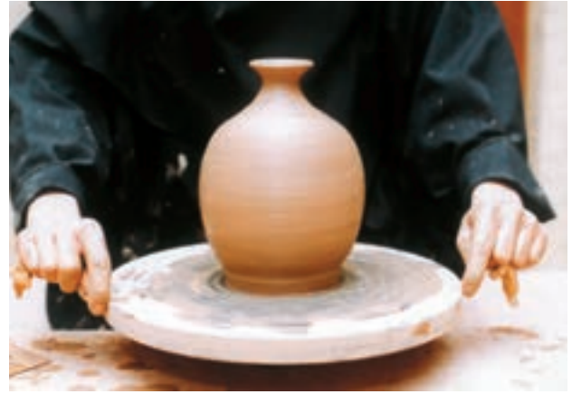
تصویر ۵۲ - جدا کردن کوزه از سرچرخ به وسیله مفتول سیمی

یک حجم توپر شنیده می‌شود. در این حالت می‌توان بدنه یا خمیر را تراشید یا برش داد. برای پرداخت ظرف، ابتدا باید آن را روی سرچرخ محکم کرد. گاهی ظرف را به طور مستقیم روی سرچرخ گذاشته، با قرار دادن گل در محل اتصال آن را به سرچرخ محکم می‌کنند (تصویرهای ۵۴ تا ۵۶).