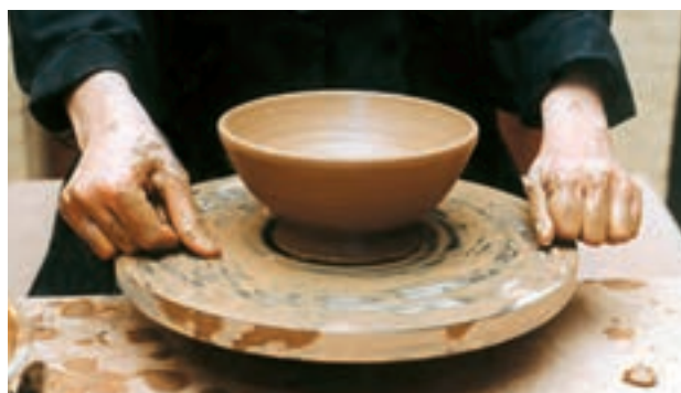
تصویر ۳۲- جدا کردن کاسه از سرچرخ به وسیله مفتول سیمی