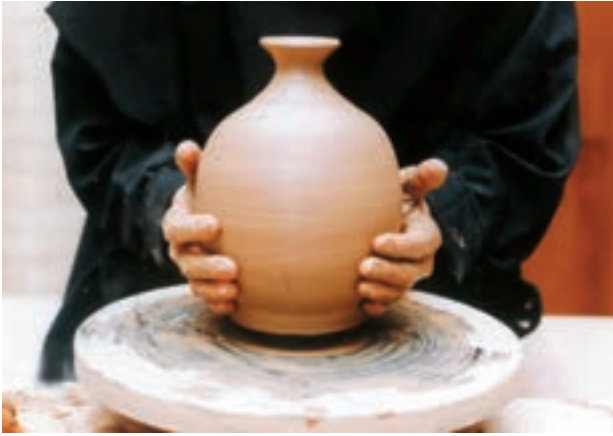
تصویر ۵۳ - بلند کردن کوزه از صفحه سرچرخ

یک حجم توپر شنیده می‌شود. در این حالت می‌توان بدنه یا خمیر را تراشید یا برش داد. برای پرداخت ظرف، ابتدا باید آن را روی سرچرخ محکم کرد. گاهی ظرف را به طور مستقیم روی سرچرخ گذاشته، با قرار دادن گل در محل اتصال آن را به سرچرخ محکم می‌کنند (تصویرهای ۵۴ تا ۵۶).