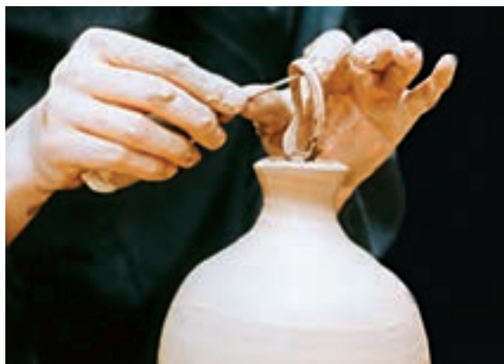
تصویر ۴۷- جدا کردن قسمت بریده شده

باید توجه داشت که ضخامت خمیر گل در قسمت دهانه، باید به اندازه‌ای باشد که بتوان گردن را با شکل دادن آن ساخت. اگر ظرف با گردن بلند مورد نظر باشد، گردن باید به طور جداگانه روی چرخ سفالگری ساخته و سپس با دوغاب غلیظ روی بدنه