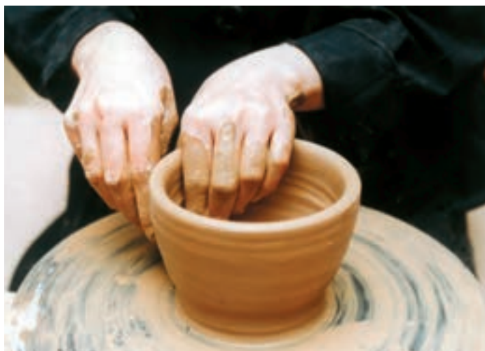
تصویر ۳۴ - قلاج کردن دیواره

۲-۱ - قلاج کردن دیواره: این مرحله مانند قلاج کردن دیواره ظرف دهانه گشاد است. با این تفاوت که دیواره استوانه توخالی بیشتر به طرف بالا کشیده می‌شود. قلاج کردن دیواره از