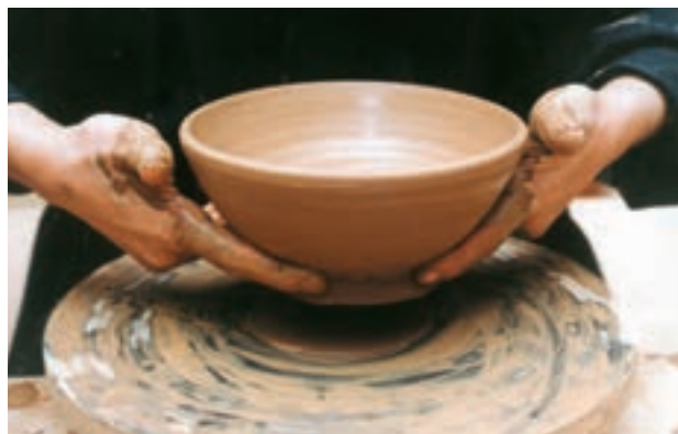
تصویر ۳۳- بلند کردن کاسه از روی سرچرخ