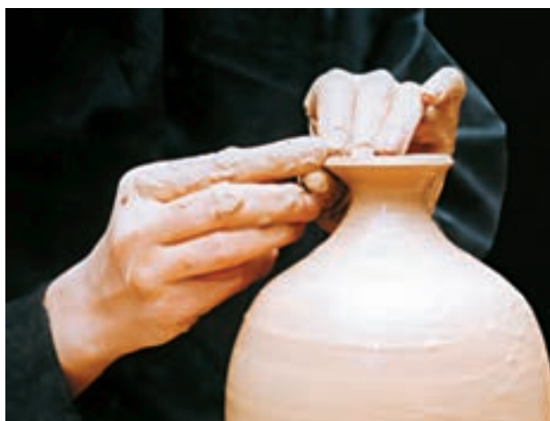
تصویر ۴۹- صاف کردن لبه کوزه