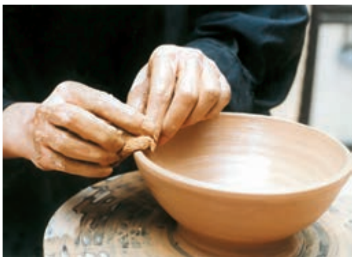
تصویر ۳۰- گرفتن دوغاب اضافه از سطح کاسه و یکنواخت کردن آن