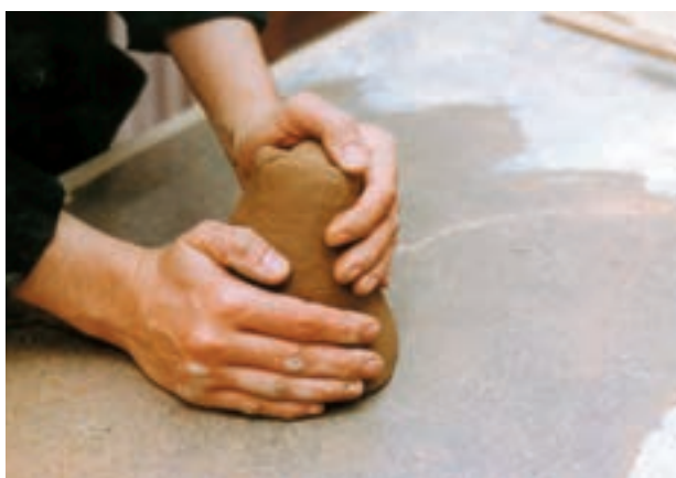
تصویر ۹ - چونه یا چانه گل آماده شده

۳-۲ - شکل‌دهی به وسیله قالب: بسیاری از باستان‌شناسان معتقدند که سفالینه‌های اولیه از اندود کردن سبدهای بافته شده با خمیر گل پدید آمده است. به عبارت دیگر می‌توان گفت که سبد اولین قالبی است که انسان برای ساخت ظروف از آن یاری گرفته است. در این روش، قالب نقش مهمی در شکل‌دهی ظروف دارد. به طوری که با قراردادن ورقهٔ خمیر گل درون قالب و فشار ملایم در تمام سطح، خمیر شکل قالب را به خود گرفته و بدنه‌های زیادی را می‌توان به این ترتیب تکثیر کرد. این قالب‌ها می‌تواند از گچ یا چوب باشد (تصویر ۶). قالب گاهی محدب و گاهی مقعر است و توسط یک تیغهٔ شکل دهنده می‌توان به خمیر روی قالب شکل داد. (مانند آنچه در دستگاه جیگرو جولی اتفاق می‌افتد).