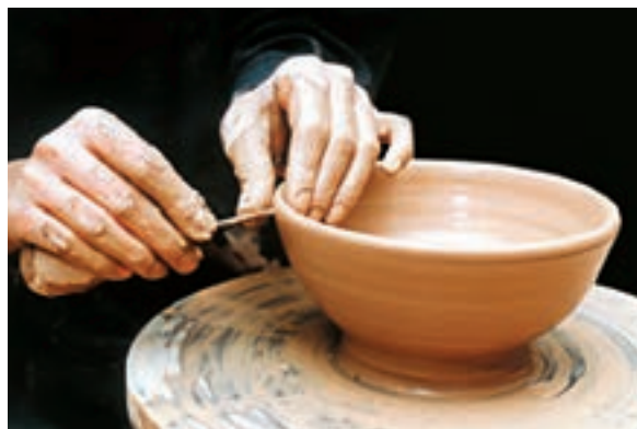
تصویر ۲۲- بریدن لبه کاسه با ابزار برش