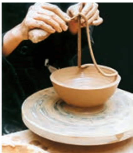
تصویر ۲۳- جدا کردن لبه بریده شده