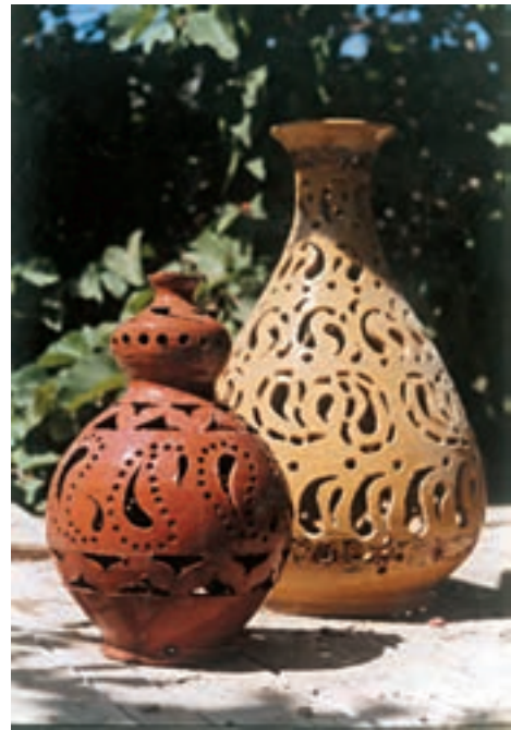
تصویر ۵- تزیین به روش مشبک یا نقش بریده