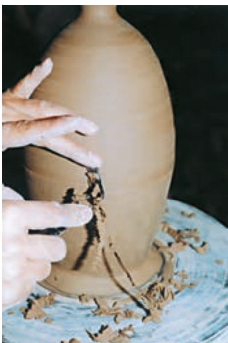
تصویر ۵۹ - تراشیدن قسمت‌های ضخیم بدنه

به هنگام تراش بدنه، از افزودن رطوبت به بدنه خودداری می‌شود و سرعت دوران سرچرخ باید کاملاً کنترل شده و یکنواخت باشد. به هنگام تراش گاهی باید کارد تراش را کنار گذاشت و با