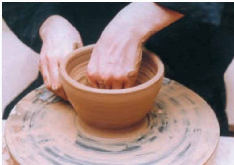
تصویر ۱۷- باز کردن کف ظرف

استوانه طوری قرار می‌دهند که دیواره را حمایت کند و با دست دیگر در حالی که انگشت شست به صورت قائمه (چهار انگشت دیگر جمع شده) و عمود بر دیواره روی کف استوانه قرار گرفته، می‌فشارند تا قاعده ظرف به اندازه لازم گشاد و یکنواخت شود (تصویر ۱۷).