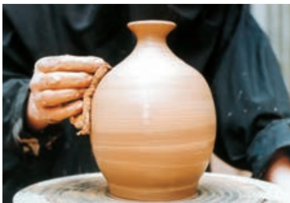
تصویر ۵۱- صاف کردن سطح کوزه با اسفنج