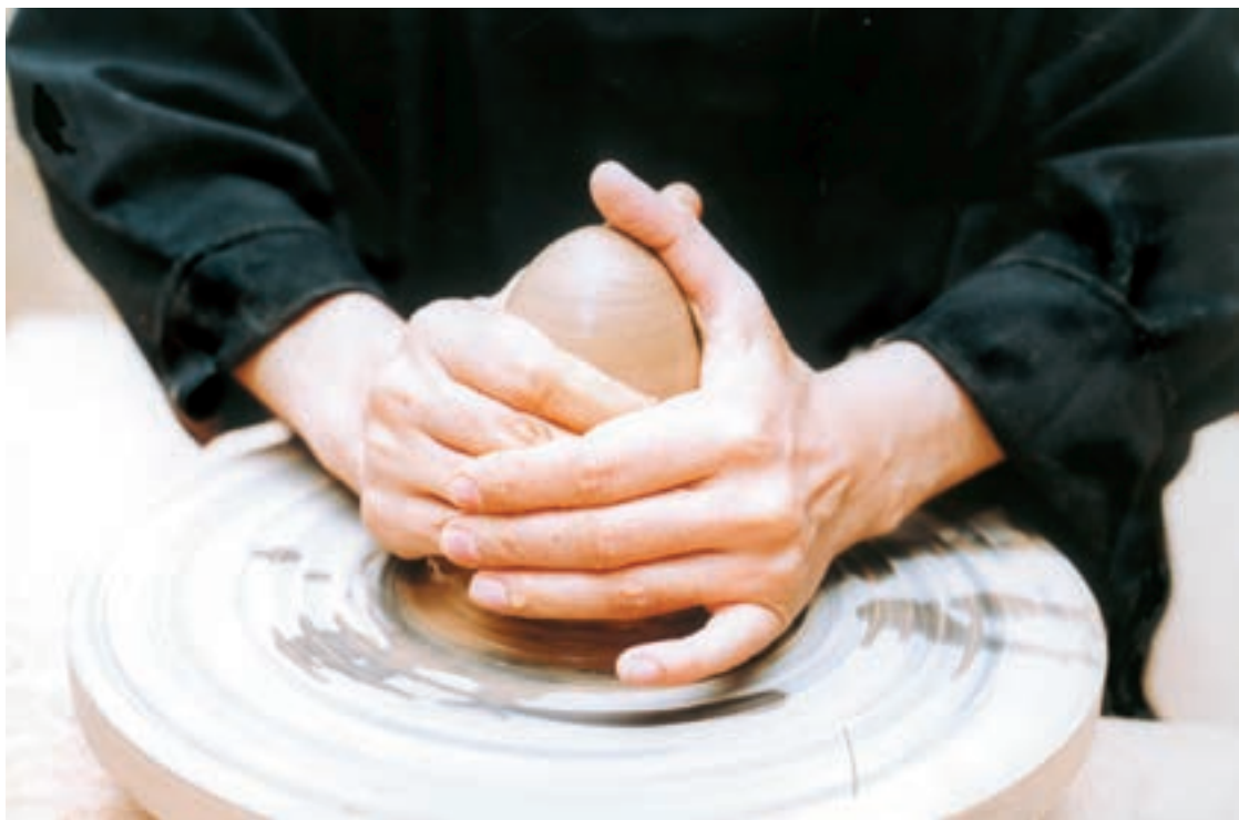
تصویر ۱۰- مرکزیت دادن به چانه

چانه را با ضربه در مرکز سرچرخ قرار داده و برای محکم شدن چانه گل، انگشت اشاره را در محل اتصال چانه گل و سر چرخ گذاشته و با یک دور حرکت صفحه، خمیر گل منافذ بین آن دورا پر کرده و اتصال بهتری برقرار می‌شود. با وارد آوردن فشار دست‌ها بر چانه از تمام جوانب، خمیر به طرف بالا رانده می‌شود. سپس با قراردادن یک دست بروی چانه و دست دیگر در کنار آن بر روی مخروط فشار آورده و آن را به سمت مرکز سر چرخ هدایت می‌کنند. این کار چند بار تکرار خواهد شد تا علاوه بر مرکزیت یافتن گل، حباب‌های هوا خارج و خمیر گل یکنواخت شود (تصویر ۱۰).