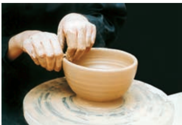
تصویر ۲۷- یکنواخت کردن لبه کاسه