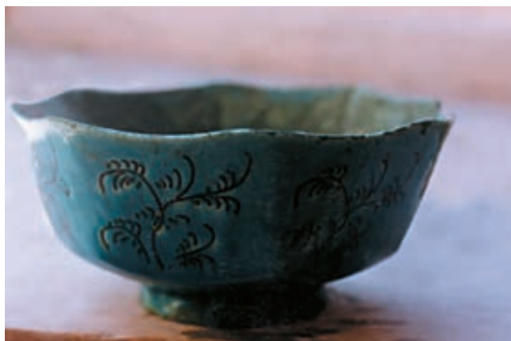
تصویر ۷- کاسه هشت‌ترک با لبه هلالی که با روش قالبی تزیین شده - کارگاه سفالگری عبادی در نطنز

در این روش، قالب مورد استفاده، دارای فضایی به شکل ظرفی است که در سطح داخلی آن نقوش به صورت منفی کنده شده است. این قالب‌ها در گذشته از جنس سفال، سنگ و چوب ساخته می‌شد، ولی امروزه شکل گچی آن رواج بیشتری دارد. بدنه خام داخل این قالب قرار گرفته و قالب بسته می‌شود. با بسته شدن قالب، فشار ملایمی بر بدنه وارد می‌آید که منجر به انتقال نقش بر سطح خارجی بدنه خام می‌شود. در گذشته برای ساخت ظروف