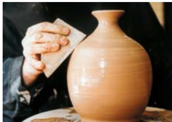
تصویر ۵۰- بریدن ناهمواری‌های سطح بدنه