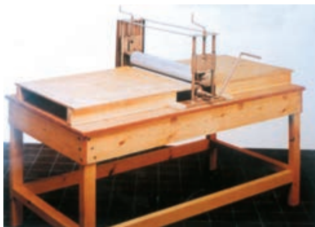
تصویر ۴- دستگاه غلتکی لوحه‌سازی قابل حمل و نقل Slab Roller دستگاهی برای تخت کردن خمیر برای استفاده در شکل‌دهی به روش مسطح