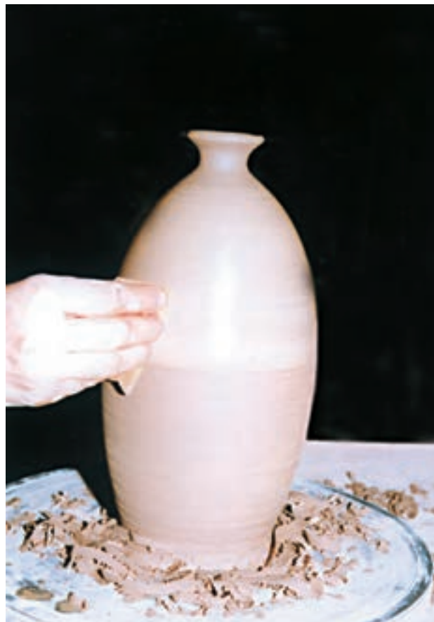
تصویر ۶۰- صاف کردن سطح بدنه با اسفنج