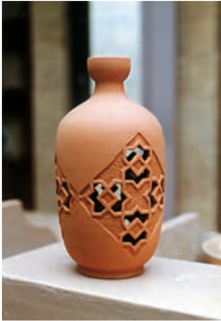
تصویر ۴- تزیین بدنه به روش نقش بریده (مشبک)