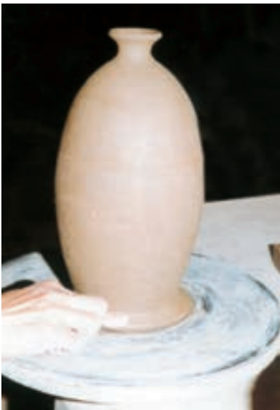
تصویر ۵۶ - محکم کردن محل تماس ظرف و سرچرخ