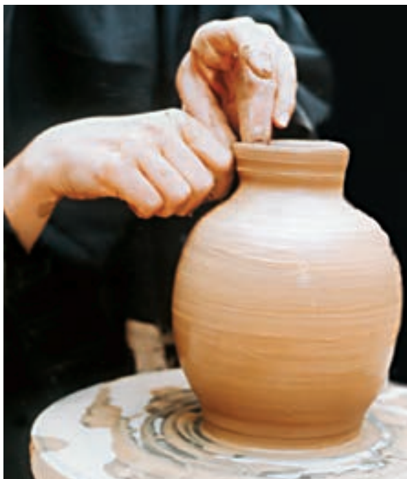
تصویر ۴۳- ساخت گردن ظرف

۲-۴ ساخت گردن: روش ساخت گردن ظرف با توجه به ارتفاع آن، متفاوت است. برای کوزه‌هایی با گردن کوتاه، بعد از اینکه دهانه ظرف به اندازه کافی جمع شد، دو انگشت را داخل دهانه ظرف قرار داده و دست دیگر را در حالی که انگشت اشاره