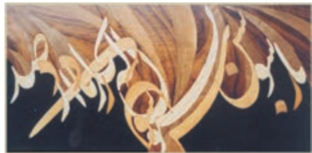
تصویر ۱۶-۱-۱- یک تابلو معرق معاصر

دستی چوبی گفته می شود که براساس طرح اولیه قطعات بخش تزینی که عمدتاً چوبی هستند آماده و سپس این قطعات براساس همان طرح به وسیله روشهایی مثل چسبانیدن و میخ کوبی به روی زیرساخت الحاق می شوند. معرق چوب از زیرمجموعه های این گروه است و گرچه شیوه های مختلفی دارد ولی در یک تعریف کلی و کوتاه می توان گفت: عبارت است از برش قطعاتی از لایه های نازک عمدتاً چوبی هم ضخامت براساس طرح و سپس چسباندن یا تعبیه آنها به روی زیرساخت در جای خود براساس همان طرح (تصویر ۱۶-۱-۱).