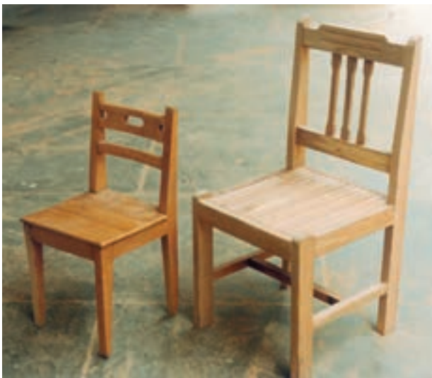
تصویر ۱-۱-۱- محصولات درودگری - دو نمونه صندلی با تزئینات جزئی

۱- درودگری: فن ساخت وسایل یا زیر ساختهای کاربردی یا کاربردی تزئینی است. وسایل چوبی از قبیل میز، صندلی، کمد، جعبه، در و ... محصولات درودگری هستند (تصویر ۱-۱-۱).