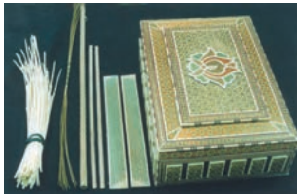
تصویر ۱۹-۱-۱- یک محصول خاتم کاری جدید به همراه مصالح اولیه و نمونه‌های گل پیچیده شده و چند نمونه لایه خاتم.

مشابه بدست آورد. خاتم مثلث که امروزه متداول‌تر است به شیوه‌ای به نام (گل‌بندی) اجرا می‌شود به این نحو که در مرحله اول منشورهایی مثلث‌القاعده از جنس چوب، فلز و استخوان آماده می‌شود. در مرحله دوم، این منشورها براساس طرح هندسی مورد نظر از پهلو کنار هم چسبانیده می‌شوند تا شش ضلعیها و مثلثهای بزرگ‌تری موسوم به «گل» و «توگلو» پدید آید (به این کار گل‌بندی گویند)، بر اثر کنار هم چسباندن گلها و توگلوها از پهلو به هم، مکعب مستطیل بزرگی پدید می‌آید که نقش هندسی در رأس آن پیداست و به آن «قامه» می‌گویند. حال با برش مقطعی قامه، لایه خاتم بدست می‌آید که در مرحله سوم خاتم کاری می‌توان این لایه‌ها را به‌روی زیرساخت مورد نظر چسباند (تصویر ۱۹-۱-۱).