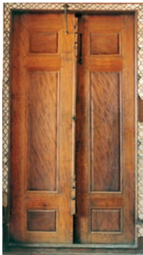
تصویر ۷-۱-۱- یک در قاب تنگه

تصویر ۶-۱-۱- گره چینی آلت و لقط در پایین یک در از جمله رشته‌های زیرمجموعه این فن می‌توان به «قاب تنگه» اشاره نمود که چیزی بین گره چینی آلت و لقط و درودگری است و در آن یک وسیله کاربردی به قابهایی تقسیم می‌شود و سپس درون این قابها با صفحات چوبی پُر می‌شود (تصویر ۷-۱-۱).