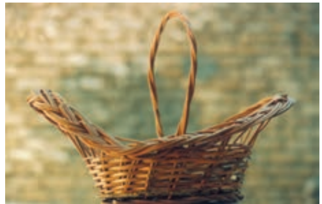
تصویر ۱۵-۱-۱- یک نمونه ظرف ساده سبدهافی

سبد بافی نیز که به وسیله بافت شاخه های باریک چوبی و مروار و خیزران و غیره انجام می شود جزو این گروه است (تصویر ۱۵-۱-۱).