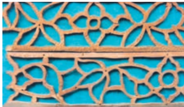
تصویر ۲-۱-۱- شبکه‌بری با نقش ختایی

از رشته‌های زیرمجموعهٔ شبکه‌بری می‌توان به پارچه‌بری اشاره نمود در این فن دو لایه چوب به‌طور مشابه شبکه‌بری می‌شوند و در بین آنها قطعاتی از شیشه رنگی نصب می‌گردد (تصویر ۳-۱-۱).