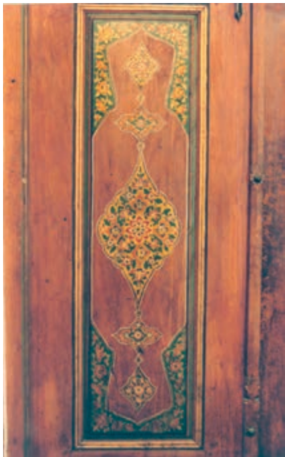
تصویر ۲۰-۱-۱- نقاشی و تذهیب در روی یک در چوبی

است. براساس همین اصل رشته‌های هنری چوبی به دو گروه کلی «الحاقی» و «غیرالحاقی» تقسیم می‌شوند، در رشته‌های غیرالحاقی قسمت تزئینی، خود بخشی از زیرساخت است (مثل منبت کاری) ولی در رشته‌های الحاقی قسمت تزئینی به‌روی زیرساخت اضافه می‌شود (مثل خاتم کاری). رشته‌های صنایع دستی چوبی غیرالحاقی عبارتند از: مشبک بری، پارچه‌بری، گره چینی مشبک، گره چینی شیشه‌دار، گره چینی آلت و لقطه، قاب تنکه، قواره‌بری، منبت کاری، خراطی، ابزارزنی، مجسمه‌سازی، مهرسازی، سبذبافی، حصیربافی، سازسازی.