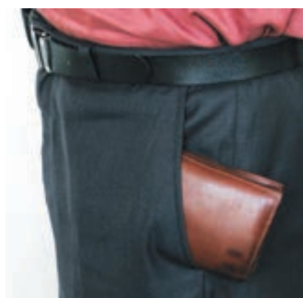
شکل ۱-۷- مراقبت از کیف خود

▲ هنگام خرید قطعات، قیمت‌ها را از چند محل سؤال کنید تا بتوانید قطعات را با بهترین کیفیت و مناسب‌ترین قیمت خریداری نمایید، در ضمن همواره در کلیه‌ی شرایط مراقب کیف پول خود باشید (شکل ۱-۷).