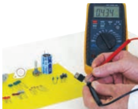
شکل ۲-۷- اطمینان از سالم بودن قطعات

▲ هنگام خرید قطعات از سالم بودن قطعات اطمینان حاصل کنید و هنگام نصب روی مدار چاپی، مجدداً آن‌ها را آزمایش کنید (شکل ۲-۷).