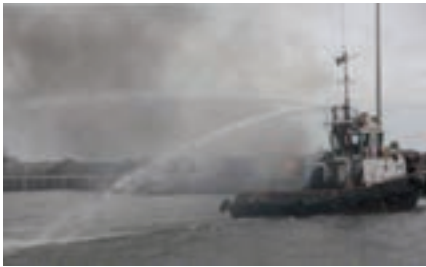
شکل ۱۱-۳ یک فروند یدک‌کش در حال استفاده از آتش‌خوارها جهت مبارزه با حریق شناور کنار اسکله

۳- جهت انتقال تیم‌های نجات، کنترل صدمات، جابه‌جایی و نجات مصدومین، انتقال تجهیزات برای کشتی‌های نیمه مغروق و نیازمند امداد در دریای طوفانی و موج.