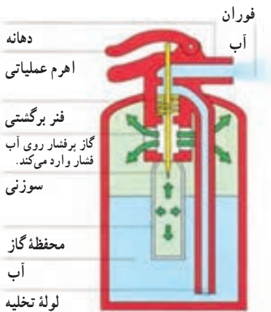
شکل ۳-۱- ساختمان خاموش‌کننده حاوی آب

آب: از این خاموش‌کننده‌ها برای مبارزه با آتش سوزی نوع A استفاده می‌شود و با استفاده از آن می‌توان آب را به دو صورت جت و مه‌پاش بر روی آتش پاشید. جهت تأمین فشار مورد نیاز برای تخلیه آب درون محفظه خاموش‌کننده، از گاز دی‌اکسید کربن استفاده می‌شود (شکل ۳-۱).