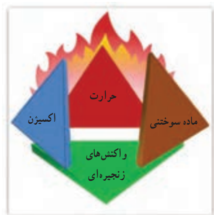
شکل ۱-۱- هرم آتش

وقوع هر آتش نیاز به زمینه‌های فیزیکی و شیمیایی محل وقوع آتش دارد. آتش با چهار عامل اکسیژن، مواد سوختنی، حرارت و واکنش‌های زنجیره‌ای، که به هرم آتش معروف است (شکل ۱-۲)، شکل می‌گیرد و در صورت حذف تنها یکی از آنها ادامه آتش ممکن نیست و هر کدام از عوامل مؤثر در ایجاد آتش خصوصیات مختلفی دارند.