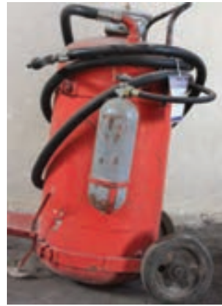
شکل ۷-۳- دو نمونه خاموش کننده جریخ دار بودر و گاز