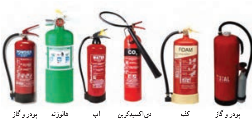
شکل ۳-۶- نمای ظاهری انواع خاموش‌کننده دستی