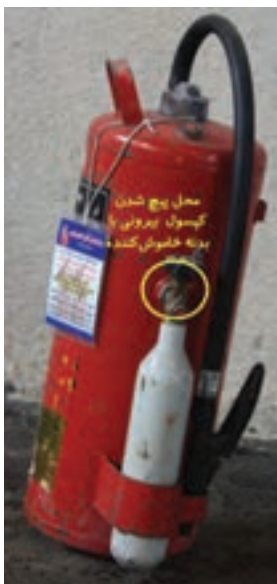
شکل ۵-۳- خاموش کننده دستی حاوی پودر و گاز فشنگ بیرون

۲- خاموش کننده‌های پودر و گاز فشنگ خارج: در این نوع خاموش کننده، فشنگ حاوی گاز دی‌اکسید کربن در خارج از بدنه قرار می‌گیرد و مجرای خروجی گاز فشنگ به بدنه خاموش کننده پیچ می‌شود (شکل ۵-۳).