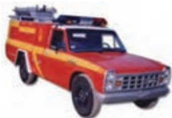
شکل ۹-۳- خودرو سبک و پیشرو آتش نشانی