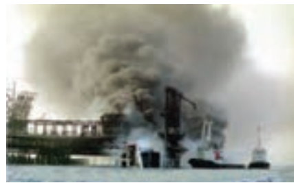
شکل ۱۰-۳ استفاده از یدک‌کش‌ها در دوران دفاع مقدس در مبارزه با حریق سکوها نفتی