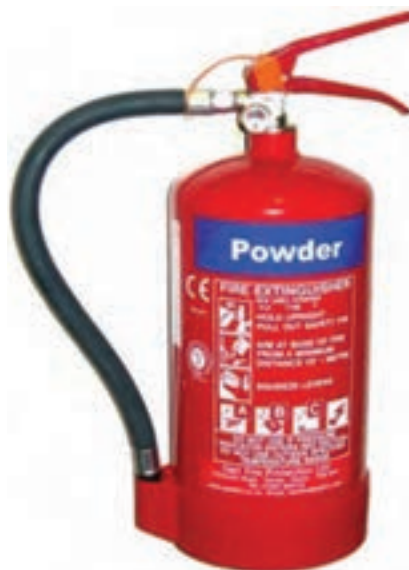
شکل ۴-۳- خاموش کننده دستی حاوی پودر و گاز فشنگ داخل