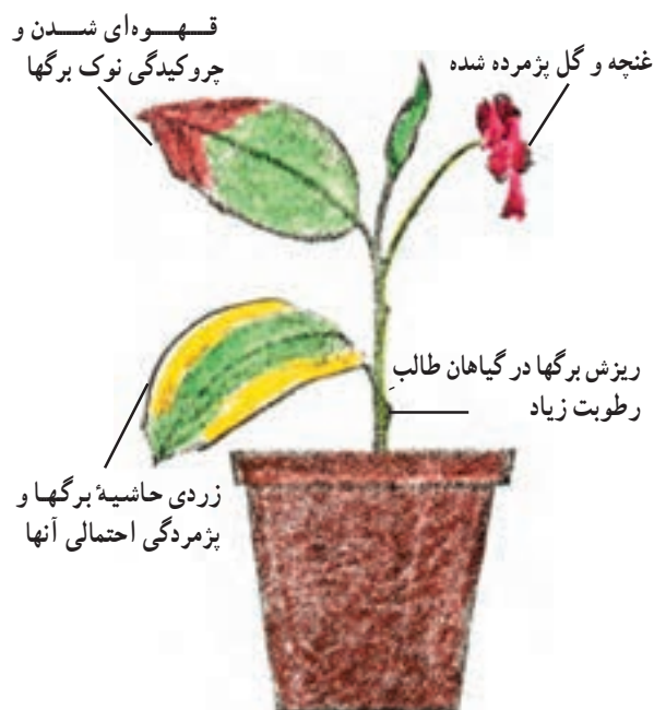
شکل ۵۳-۱ - علایم و خسارات کمبود در رطوبت نسبی هوا بر روی گیاهان آپارتمانی

– پاشیدن آب در هنگام عصر یا شب باعث می‌شود تا آب بر روی گیاه باقی بماند و تبخیر نشود و از تبادلات گیاه با محیط خارج جلوگیری کند.