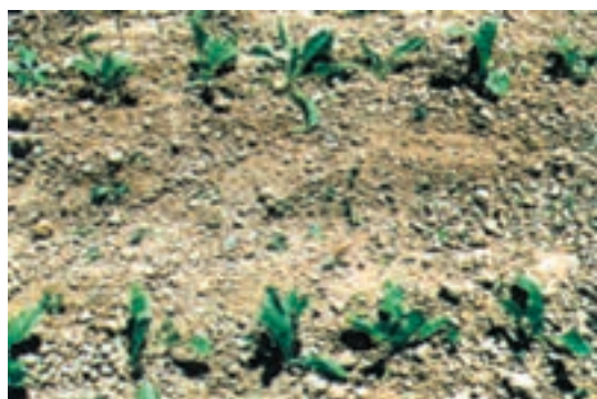
شکل ۱۷-۲- مزرعه چغندر قند بعد از عملیات تنک اولیه