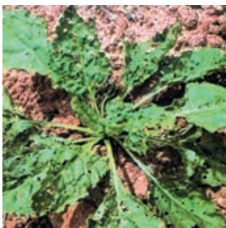
شکل ۱۲-۲- خسارت کک‌های نسل جدید