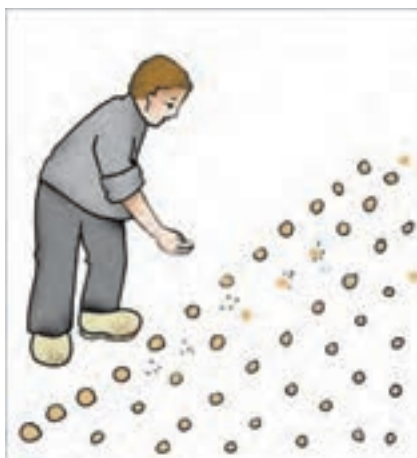
شکل ۱۰-۲- بذرکاری کپه‌ای