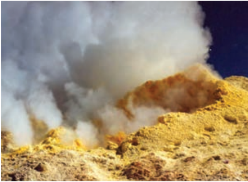
شکل ۱۱-۱- دهانه اصلی آتشفشان تفتان

شاید اینک پذیرفته باشید که برای زندگی بر روی کره زمین لازم است تا حدی با خصوصیات کره زمین در قالب درس زمین‌شناسی آشنا شوید.