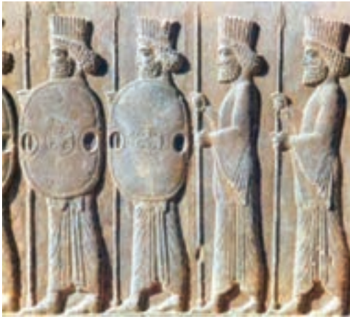
شکل ۱-۵- ادوات نظامی هخامنشیان

انواع ذخایر معدنی فلزی و غیرفلزی از دیگر ویژگی‌های بخش بیرونی پوسته زمین است که آگاهی نسبی از نحوه تشکیل آنها نیاز به کسب تخصص در رشته زمین‌شناسی دارد. توجه به ذخایر معدنی در ایران به هزاران سال قبل بازمی‌گردد. به عنوان مثال ایرانیان در زمان هخامنشیان با دسترسی به ذخایر سنگ آهن، از آن در ساخت وسایل و ابزار جنگی بهره جسته و بدین طریق از سرزمین پهناور ایران در مقابل هجوم بیگانگان محافظت کردند (شکل ۱-۵).