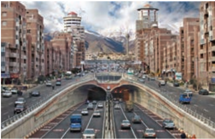
شکل ۹-۱- ورودی تونل توحید - تهران

امروزه جهت احداث انواع پروژه‌های عمرانی مانند سدها، نیروگاه‌ها، بزرگراه‌ها، بیمارستان‌ها، مکان‌یابی شهرک‌ها، مجتمع‌های تجاری و مسکونی، آسمانخراش‌ها و ... همه نیازمند شناخت جنس و ساختار تشکیل دهنده زمین بی آن است. پس برای در امان ماندن از پدیده‌های طبیعی مانند زمین‌لرزه، رانش زمین، سقوط سنگ و غیره باید خصوصیات زمین را بطور جدی بررسی کرد. امروزه اهمیت این موضوع تا آن حد است که حضور کارشناس زمین‌شناس در شهرداری‌ها و محیط زیست قطعی و اجتناب‌ناپذیر می‌باشد (شکل ۹-۱).