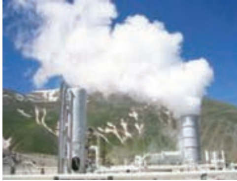
شکل ۷-۱- نیروگاه زمین گرمایی مشکین شهر - اردبیل

استفاده از مواد معدنی تنها محدود به همین موارد نمی گردد. اگر به اطرافمان خوب نگاه کنیم، مثلاً مدادی که با آن می نویسیم، عینکی که به کمک آن می بینیم، وسایلی که با آن زندگی می کنیم، داروهای که برای التیام دردهایمان از آن استفاده می کنیم و حتی خمیردندانی که هر روز از آن استفاده می کنیم، همه و همه در گروه موادی است که از زمین استخراج می شود.