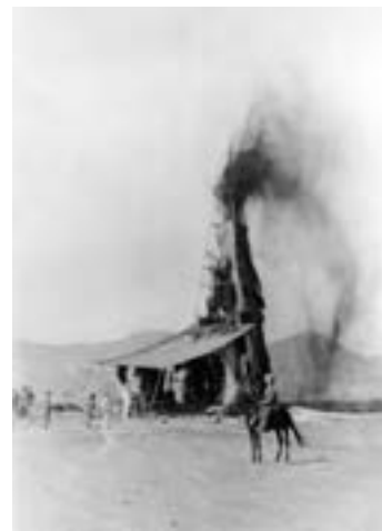
شکل ۸-۱- الف - فوران نفت از اولین چاه

نفت خاورمیانه در سال ۱۹۰۸م - مسجد سلیمان