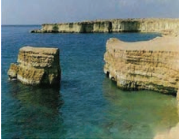
شکل ۳-۱- سواحل جنوبی ایران

کره خاکی تنها مکان مناسب برای سکونتگاه بشر بر روی سیاره زمین می باشد. خارجی ترین بخش زمین معمولاً از خاک تشکیل شده است. خاک محصول هوازدگی و فرسایش سنگ هاست و محل رویش گیاهان می باشد (شکل ۴-۱). پس غذای انسان و تعداد زیادی از موجودات زنده وابسته به خاک است.