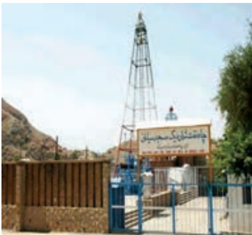
شکل ۸-۱- ب - موزه نفت در محل اولین چاه نفت خاورمیانه -

هیچ با خود اندیشیده اید، که اگر این معادن شناخته نشده بودند آیا زندگی بر روی کره زمین به این سادگی مقدور بود؟ خوشبختانه کشور ایران از جمله کشورهای معدنی جهان است که دارای معادن متعدد آهن، مس، سرب و روی، طلا و ... است. همچنین بیش از صدسال قبل تاکنون با کشف نفت در حوالی مسجدسلیمان اقتصاد کشورمان متوجه این نعمت خدادادی شده است (شکل ۸-۱- الف و ب). این قابلیت ها سبب گردیده تا ایران در بین کشورهای جهان، کشوری قدرتمند و تأثیرگذار باشد.