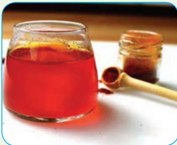
زعفران دم‌کرده و صاف شده