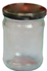
ظرف شیشه‌ای دردار