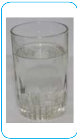
آب و قند

وقتی دو یا چند ماده را روی هم می‌ریزیم، گاهی مخلوط‌های شفاف‌ی مانند آب و نمک، آب و قند به‌دست می‌آوریم. اما گاهی مخلوط‌های شفاف به‌وجود نمی‌آیند. برای مثال، اگر ماست را با آب مخلوط کنیم، دوغ به‌دست می‌آید که شفاف نیست. این نوع مخلوط‌ها، محلول نیستند.