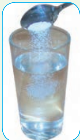
آب و نمک

در نمونه‌های زیر، مخلوط‌های یک‌نواخت را مشخص کنید. دلیل خود را بیان کنید.