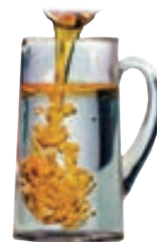
آب و روغن