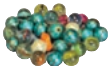
مهره و تیله