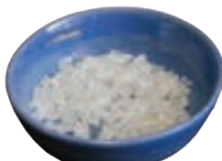
نبات خرد شده