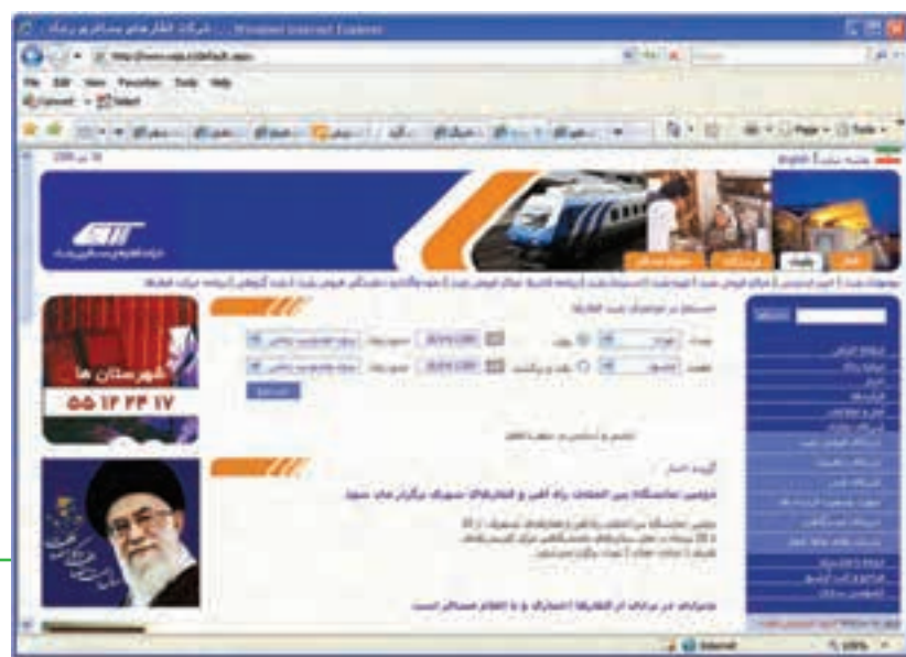
شکل ۸-۱۲ سایت شرکت قطارهای مسافری رجا

الف) در روش مستقیم، کاربر با مراجعه مستقیم به سایت سرویس‌دهنده خدمات سفر، به انجام امور مربوط مبادرت می‌کند. به عنوان مثال با مراجعه به سامانه قطارهای مسافرتی رجا به نشانی http://www.raja.ir از برنامه قطارها آگاهی یافته و می‌تواند با طی فرایندی چند مرحله‌ای، به رزرو و تهیه بلیط اقدام نماید (شکل ۸-۱۲).