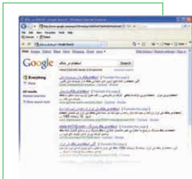
شکل ۲۰- جستجوی موضوع «استفاده از بانک»