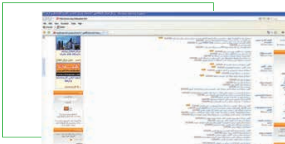
شکل ۲۲-۸ پورتال اخبار دانشگاهی

به عنوان نمونه آخر، پورتال اخبار دانشگاهی که به معرفی نیازهای استخدامی برای دانشجویان و فارغ التحصیلان می پردازد اشاره می کنیم. در این سایت که به نشانی www.unp.ir در دسترس است، آخرین اخبار دانشگاهی و پیوندهای مرتبط با استخدام ها درج می شود (شکل ۲۲-۸).