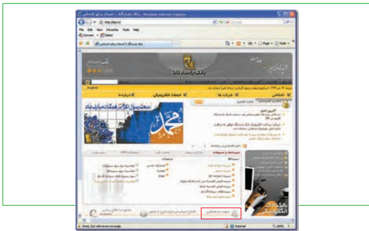
شکل ۸-۱۹ آگهی دعوت به همکاری در بانک پاسارگاد

ب) زمینه دیگر مرتبط با «کار» در شبکه اینترنت، موضوع استخدام است. بسیاری از شرکت‌های خصوصی یا ادارات دولتی، آگهی‌های مربوط به استخدام نیروی کار را در اینترنت منتشر می‌کنند. همانند خدمات دیگر، برای جست‌وجوی موارد استخدام نیز دو روش مستقیم و غیر مستقیم وجود دارد. در روش مستقیم، کاربر پایگاه‌های اینترنتی هر مرکز را به طور جداگانه، مستقل و با در دست داشتن نشانی وب سایت مرور می‌کند. این نشانی معمولاً در آگهی استخدام ذکر شده است یا از طریق موتورهای جست‌وجو قابل بازیابی است. این روش در مواردی کاربرد دارد که جویای کار می‌داند می‌خواهد به چه مرکزی مراجعه کند. شکل ۸-۱۹ آگهی دعوت به همکاری در بانک پاسارگاد را نشان می‌دهد.