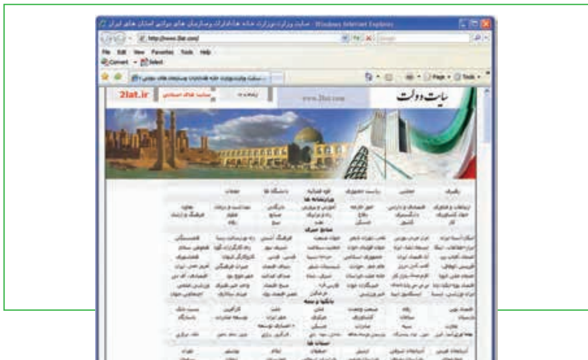
شکل ۵-۸ سایت دولت جمهوری اسلامی ایران

سطح اول «صفحه ورودی» یا «صفحه اصلی». دسترسی به صفحه ورودی یا اصلی باید بدون نیاز به اطلاع از زیرشاخه‌های سایت، قابل دسترسی باشد. مانند: http://www.2lat.com