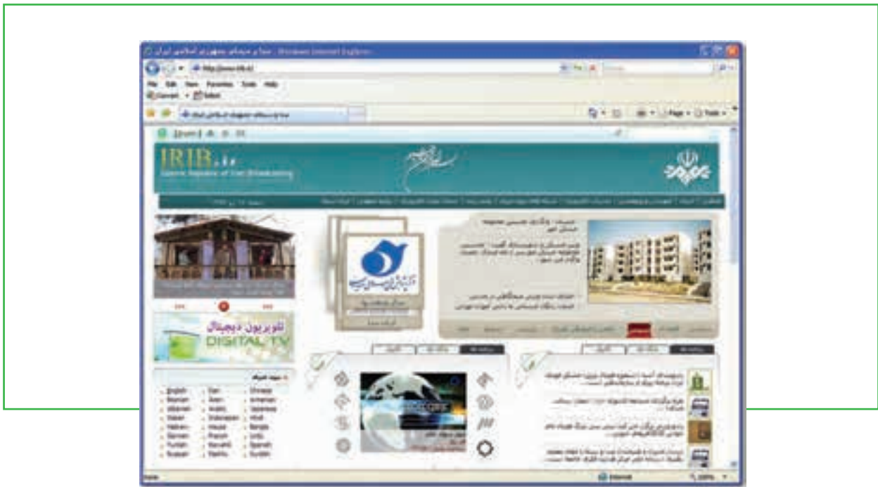
شکل ۸-۴ اخبار صدا و سیما جمهوری اسلامی ایران از طریق اینترنت

نکته دیگری که در مورد دریافت اخبار از طریق شبکه اینترنت باید به آن اشاره کرد، تماشای اخبار تلویزیونی از طریق اینترنت می‌باشد. یعنی کاربر می‌تواند با اتصال به اینترنت و ورود به سایت‌های شبکه‌های تلویزیونی، اخبار پخش شده از آنها را به صورت زنده یا ضبط شده تماشا کند و از این طریق از اخبار مورد نظر آگاهی یابد. البته این روش امروزه در مورد تمامی برنامه‌های تلویزیونی (و نه فقط اخبار) کاربرد دارد. مزیت این روش این است که خبرها را می‌توان به جای متنی، به صورت تصویری مشاهده کرد و در هر لحظه‌ای که کاربر به پایگاه اینترنتی مراجعه نماید، بر خلاف تلویزیون، خبرها در دسترس خواهد بود و امکان مرور دوباره نیز میسر است. (شکل ۸-۴).