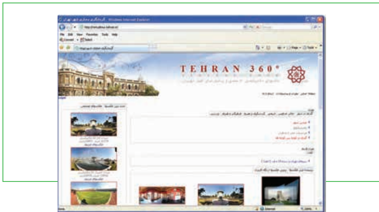
شکل ۸-۱۱ گردشگری مجازی شهر تهران - سایت شهرداری تهران

یا به شیوه غیر مستقیم از خدمات مربوط به اوقات فراغت استفاده نمود. در شکل ۸-۱۱ صفحه گردشگری مجازی تهران مربوط به سایت شهرداری تهران نشان داده شده است.