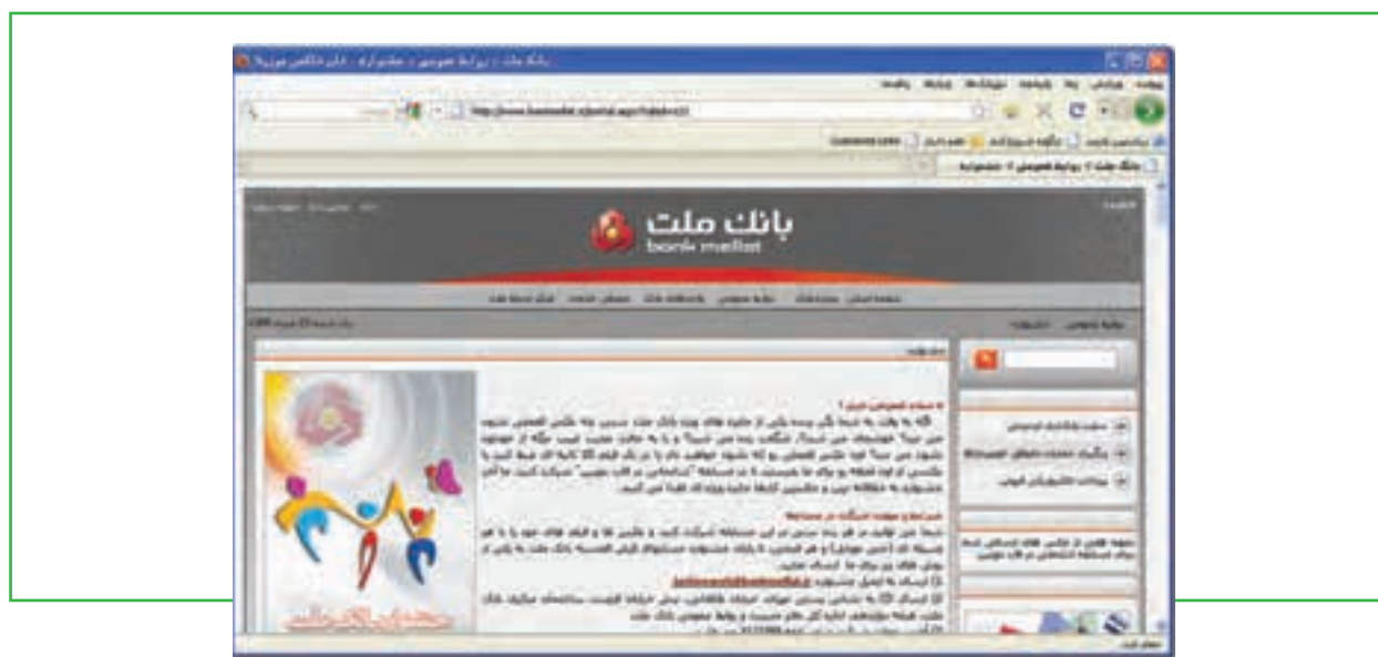
شکل ۸-۸ سایت اینترنتی بانک ملت

حالت دوم: شما آدرس سایت بانک ملت را نمی دانید. در نتیجه ابتدا وارد یک سایت موتور جست و جو شده و عنوان «بانک ملت» را جست و جو می کنید تا در صفحه نتایج، آدرس سایت بانک را پیدا کرده و سپس به آن سایت وارد شوید. پس از ورود به سایت، به دنبال پرداخت قبوض می گردید.