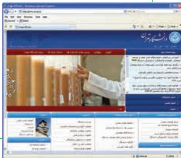
شکل ۸-۱۴ پایگاه اینترنتی دانشگاه تهران

الف) در روش مستقیم کاربر با در دست داشتن نشانی پایگاه اینترنتی از خدمات آموزشی مورد نظر استفاده می‌کند. این خدمات می‌تواند اطلاع‌رسانی در خصوص خدمات آموزشی حضوری باشد، مانند شکل ۸-۱۴ که پایگاه اینترنتی دانشگاه تهران را نشان می‌دهد. در این پایگاه اینترنتی، کاربر از آخرین اخبار مرتبط، کلاس‌ها، دانشکده‌ها، منابع علمی، اعضای هیأت علمی و ... اطلاع می‌یابد.