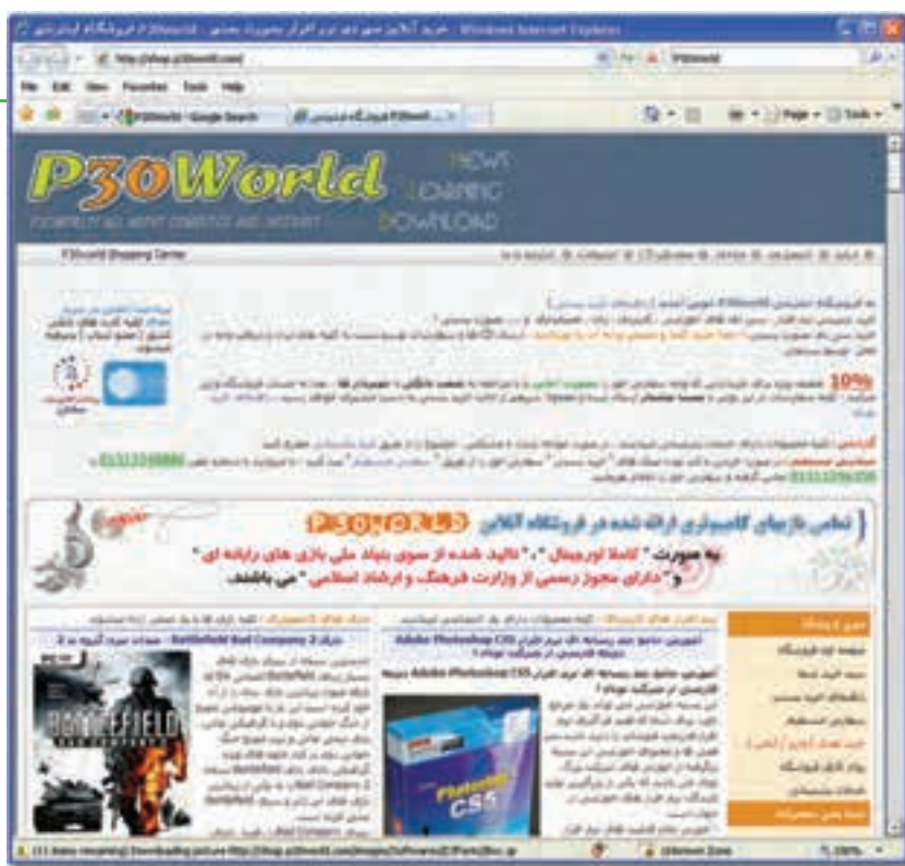
شکل ۲۵-۸ یک فروشگاه اینترنتی