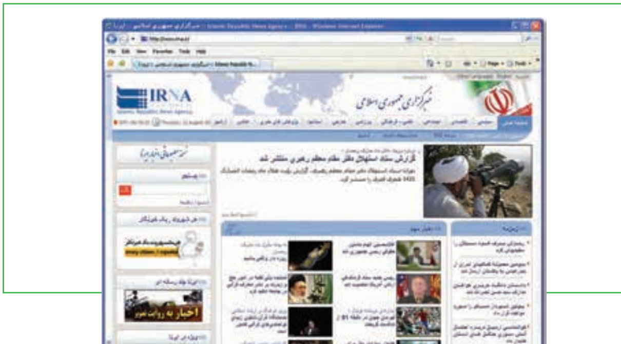
شکل ۸-۱ دسترسی مستقیم به سایت خبری

الف) روش مستقیم: در روش مستقیم، کاربر با تایپ آدرس سایت خبری مورد نظر در مرورگر به سایت وارد شده و از آخرین اخبار منطقه‌ای، کشوری و بین‌المللی آگاهی پیدا می‌کند. البته در این سایت‌ها اغلب آرشیو اخبار گذشته نیز قابل دسترسی است. برای مثال با تایپ آدرس http://www.irna.ir در مرورگر، به سایت خبرگزاری جمهوری اسلامی ایران وارد شده و می‌توان به مرور اخبار پرداخت (شکل ۸-۱).