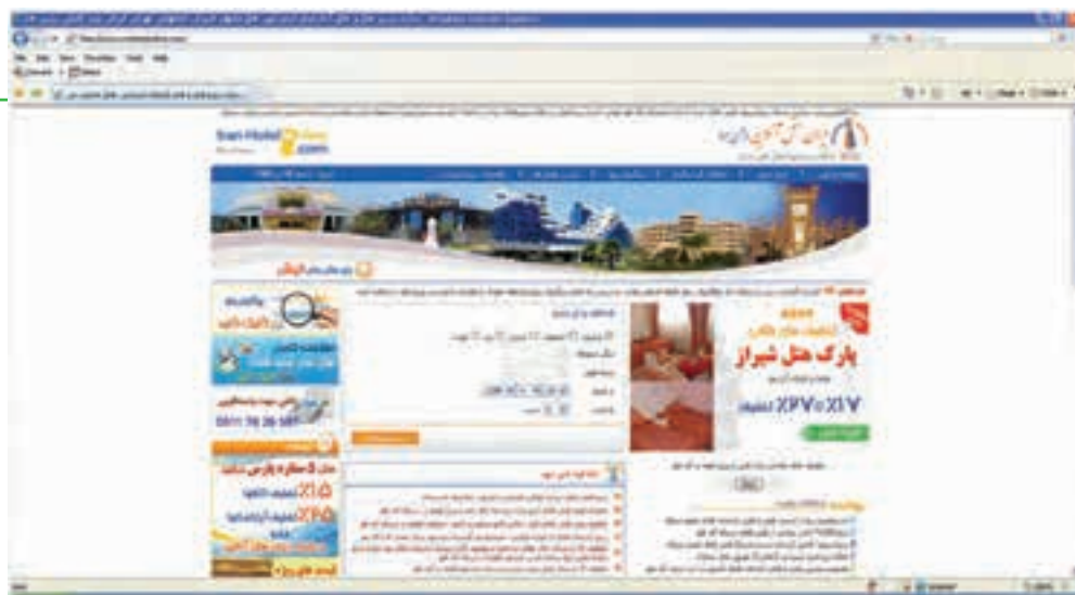
شکل ۸-۱۳ نمونه‌ای از یک نتیجه در روش غیر مستقیم

ب) در روش غیر مستقیم، کاربر با جست و جو در سایت‌های موتور جست و جو، اطلاعات لازم را در زمینه سفر خود کسب کرده و سپس به تهیه بلیط یا رزرو هتل اقدام می‌کند. این روش به خصوص در مسافرت‌های خارجی بسیار مفید است و امکان مقایسه‌ای خوبی برای تصمیم‌گیری فراهم می‌نماید. در شکل ۸-۱۳ نمونه‌ای از یک نتیجه جست و جو در رابطه با مسافرت آورده شده است. نکته بسیار مهم در این روش اطمینان و اعتماد به سایت سرویس دهنده می‌باشد.