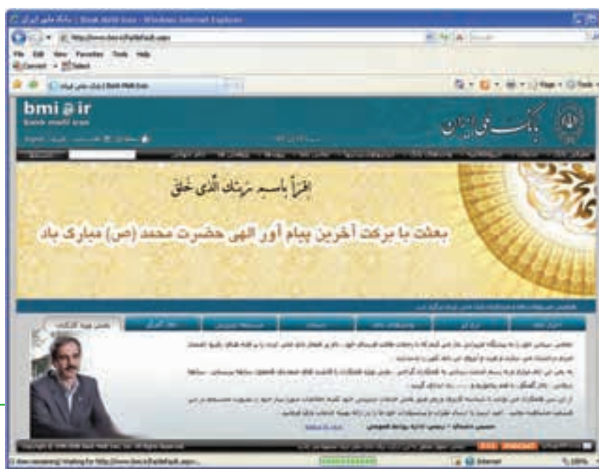
شکل ۸-۱۸ بخش مربوط به کارکنان در سایت بانک ملی ایران

الف) برخی سایت‌های مربوط به شرکت‌ها، سازمان‌ها و نهادها از طریق اینترنت نسبت به اطلاع‌رسانی به کارمندان‌شان اقدام می‌کنند. بسیاری از سایت‌های ادارات دولتی در حقیقت وظیفه‌ای جز اطلاع‌رسانی ندارند و مخاطبان آنها افرادی به جز پرسنل‌شان نیستند. به عنوان مثال در سایت بانک ملی ایران برای سرویس‌دهی به پرسنل بانک، در صفحه اصلی یک زیر بخش در نظر گرفته شده است. (شکل ۸-۱۸).