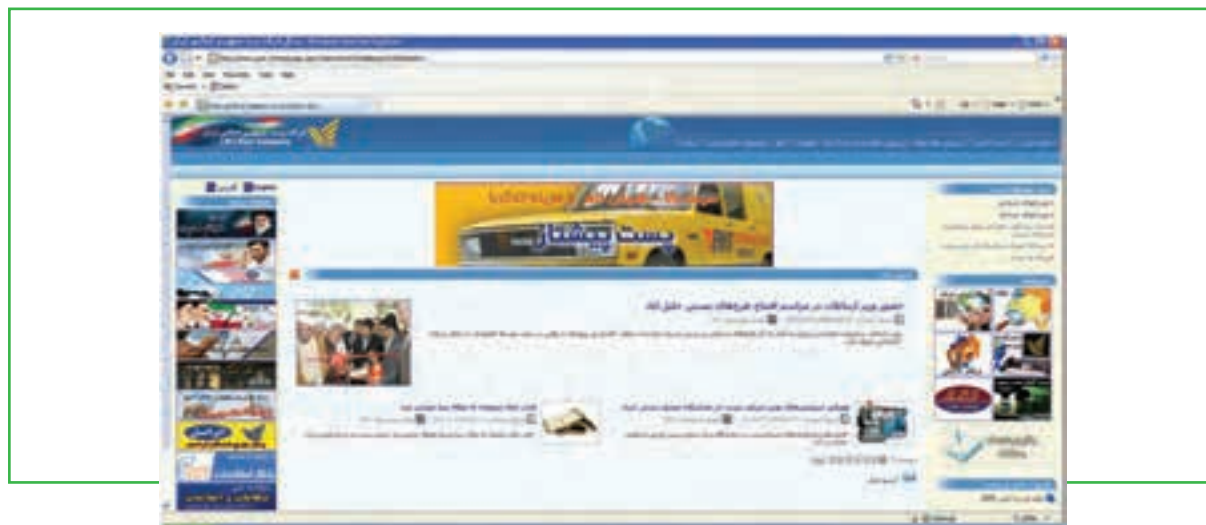
شکل ۸-۶ سایت دولتی شرکت پست جمهوری اسلامی ایران

(الف) در روش مستقیم، کاربر با تایپ آدرس سایت دولتی مورد نظر در مرورگر، به سایت وارد شده و خدمات مورد نیاز خود را در سایت بازیابی می‌کند. برای مثال با تایپ آدرس http://www.post.ir در مرورگر، به سایت شرکت پست جمهوری اسلامی ایران وارد شده و می‌توان خدمات لازم را دریافت نمود. (شکل ۸-۶)