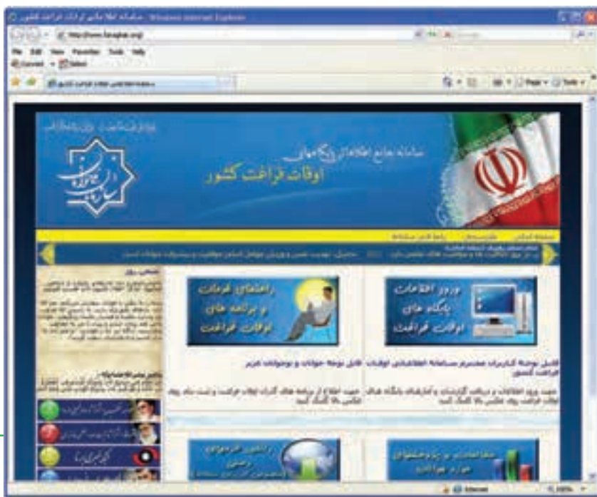
شکل ۱۰-۸ سامانه اطلاعاتی اوقات فراغت کشور