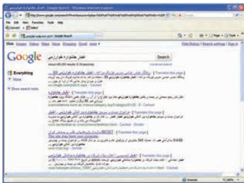
شکل ۸-۳ جست و جوی اخبار مربوط به جشنواره خوارزمی در سایت گوگل

با جست و جوی عناوین خبری در موتورهای جست و جو، همانند روش های معمول، سایت های حاوی عنوان به صورت نتیجه در اختیار کاربر قرار می گیرد. بدیهی است که در این روش، بسیاری از سایت های نتیجه سایت خبری نیستند، اما ممکن است بتوانند در مورد خبر مورد نظر، به شما کمک نمایند.