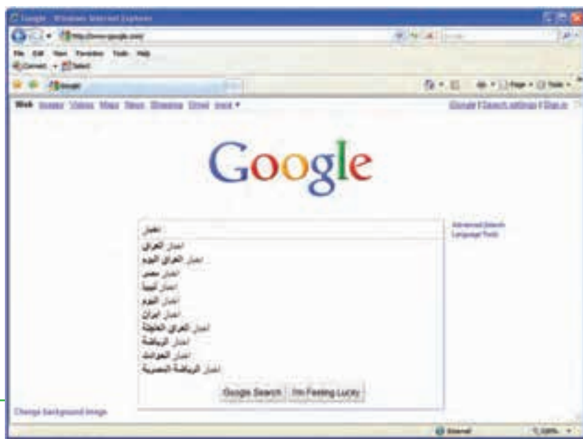
شکل ۸-۲ پیشنهاد های گوگل برای کلمه اخبار

با جست و جوی عناوین خبری در موتورهای جست و جو، همانند روش های معمول، سایت های حاوی عنوان به صورت نتیجه در اختیار کاربر قرار می گیرد. بدیهی است که در این روش، بسیاری از سایت های نتیجه سایت خبری نیستند، اما ممکن است بتوانند در مورد خبر مورد نظر، به شما کمک نمایند.