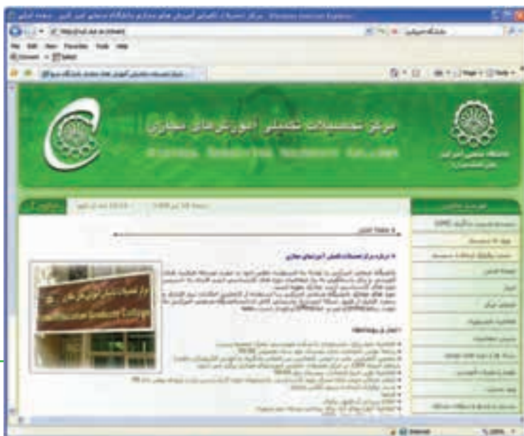
شکل ۸-۱۵ پایگاه اینترنتی مرکز آموزش‌های مجازی دانشگاه امیرکبیر

خدمات آموزشی می‌تواند به شکل مجازی یا غیر حضوری نیز ارائه شود. در این مدل شما باید با استفاده از یک نام کاربری و گذرواژه به سیستم آموزشی الکترونیکی (LMS) وارد شوید. (شکل‌های ۸-۱۵ و ۸-۱۶)