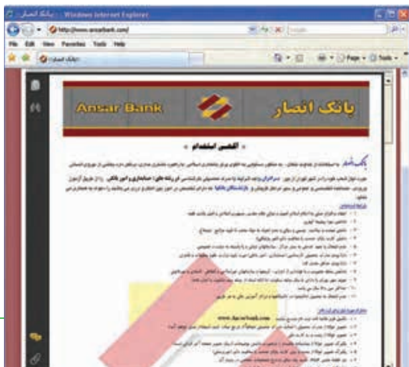
شکل ۲۱- آگهی استفاده از بانک

برخی از شرکت‌های آگهی دهنده در روزنامه‌ها یا اینترنت، از متقاضی می‌خواهند که رزومه خود را به آدرس پست الکترونیکی آنها ارسال کند. در این صورت کاربر باید رزومه مناسبی که در قالب صحیح نوشته شده تهیه کرده و آنرا به صورت ضمیمه پست الکترونیکی ارسال نماید.