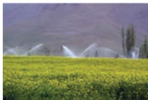
شکل ۱۲-۶- آبیاری بارانی در محلات