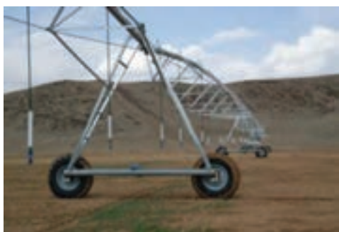
شکل ۱۳-۶- آبیاری به سبک سنتریبیود در امان آباد

۱۰- کشاورزی و دامداری: استان ما با برخورداری از آب هوای مناسب و موقعیت ترابری و اراضی حاصل خیز، ظرفیت مناسبی در دامداری و کشاورزی داراست.