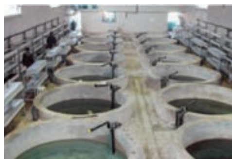
شکل ۱۴-۶- پرورش ماهی به سبک مکانیزه در گارخانه