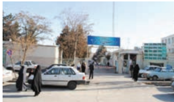
شکل ۱۰-۶- بیمارستان امام خمینی (ره) خمین