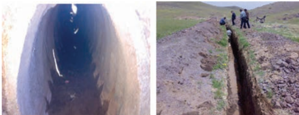
شکل ۳-۶- آبرسانی در ساوه

- در سال ۱۳۵۷ تعداد مشترکین آب شهری ۶۹۵۶۰ مشترک بوده است و تا سال ۱۳۸۸ با توسعه خدمات شهری به ۲۱۴۳۳۴ مشترک رسیده است که به طور متوسطه سالانه ۳/۶ درصد رشد داشته است.