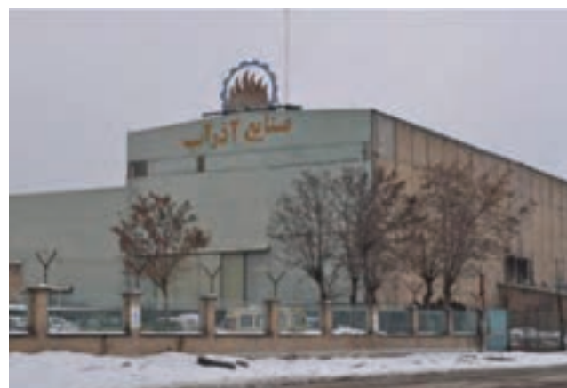
شکل ۱۸-۶- شرکت آذرآب اراک

۱۲- بازرگانی: استان مرکزی چهارمین قطب صنعتی کشور است و محصولات تولیدی آن به داخل و خارج کشور صادر