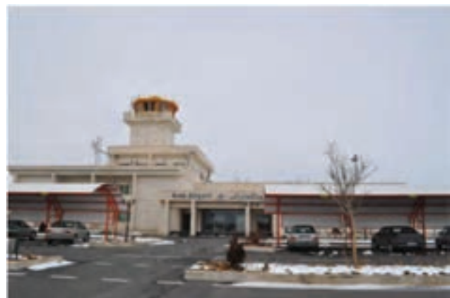
شکل ۱-۶- فرودگاه شهر اراک

۲- پست و مخابرات: گسترش زیرساخت‌های مخابراتی در مراکز شهری و روستایی، زمینه توسعه را در استان با دیگر بخش‌ها همگن کرده است. به طوری که در سال ۱۳۵۷ تعداد تلفن‌های ثابت ۱۹۲۵۰ شماره بوده و در سال ۱۳۸۸ به ۴۹۵۲۹۲ شماره افزایش یافته است. همچنین با افزایش تلفن‌های همراه و ایجاد فیبر نوری، زمینه تقویت ارتباطات گسترش یافته است. بیش از ۶۶