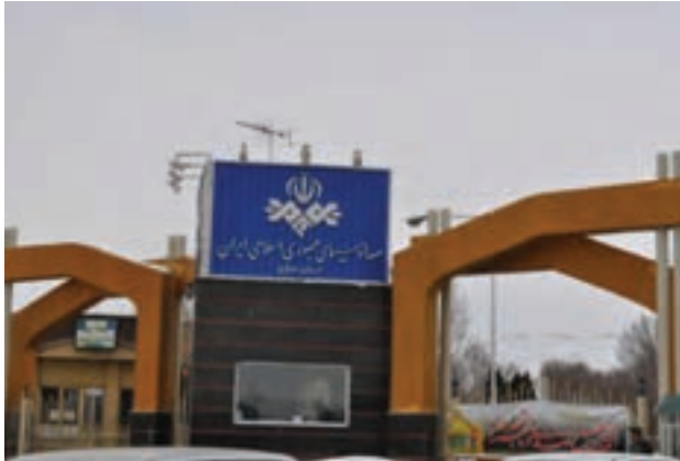
شکل ۵-۶- صدا و سیما استان مرکزی

– صدا و سیما استان امکان استفاده از ۸ شبکه تلویزیونی را با پوشش مناسبی برای تمام شهرها و روستاهای استان فراهم کرده است و شبکه استانی «آفتاب» ۸۲ درصد از جمعیت استان را پوشش می‌دهد.