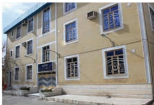
شکل ۶-۶- مرکز آموزش نیروی انسانی

۶- آموزش عالی: استان مرکزی به دلیل پیشینه تاریخی، دینی، فرهنگی، سیاسی و علمی؛ و موقعیت مناسب جغرافیایی، همچنین مجاورت با مراکز علمی و برخوردار از جوانان مستعد و فراهم بودن زیرساخت‌های صنعتی و کشاورزی، زمینه توسعه مراکز دانشگاهی را داراست. در این استان برای تربیت نیروی انسانی متخصص در مقاطع کاردانی، کارشناسی، کارشناسی ارشد و دکترای حرفه‌ای؛ مراکز دانشگاهی از یک مرکز به ۶۵ مرکز (دولتی، آزاد اسلامی، پیام نور، جامع علمی - کاربردی و غیرانتفاعی) افزایش یافته است. رشته‌های دانشگاهی در استان مرکزی به ۷۶۲ رشته و اعضای هیئت علمی و غیرهیأت علمی به ۴۹۶۱ نفر رسیده است.