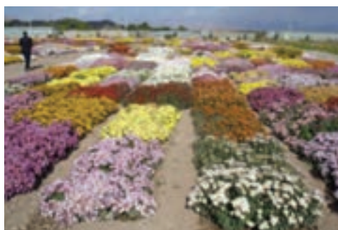
شکل ۱۵-۶- پرورش گل در محلات