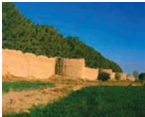
شکل ۲۸-۱۲- قلعه باغ شهرمود