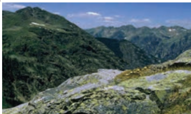
شکل ۱۲-۲۳- قلّه میلاد شاسکوه شهرستان زیرکوه