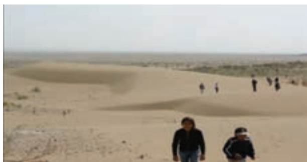
شکل ۱۲-۲۴- کویر همت آباد شهرستان زیرکوه