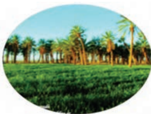
شکل ۴۱-۱۲- نخستان های دهسلم