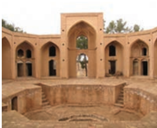
شکل ۳۵-۱۲- مدرسة علياى فردوس