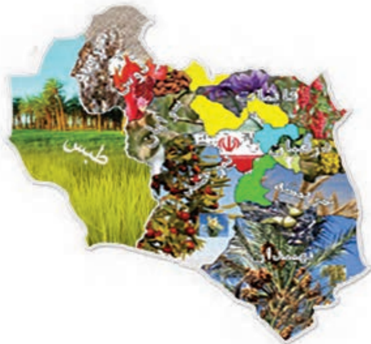
شکل ۲-۱۳- نقشه پراکندگی محصولات کشاورزی استان

استان ما دارای ۱۳۲۶۳۹ هکتار اراضی زیر کشت محصولات زراعی با تولید ۵۷۰۴۱۲ تن و ۴۶۸۸۸ هکتار سطح زیر کشت محصولات باغی با تولید ۶۱۸۹۳ تن است. همچنین از لحاظ دام، استان دارای ۳۴۱۹۳۷۷ واحد دامی می باشد که علاوه بر تولید نیاز استان، به سایر استان های همجوار نیز تولیدات آن ارسال می شود.