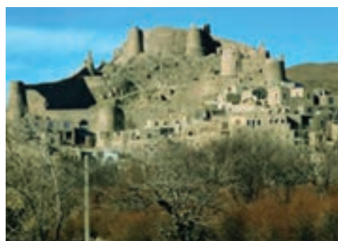
شکل ۱۷-۱۲- قلعه فورگ در میان