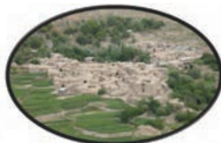
شکل ۱۵-۱۲- روستای آرک شهر خوسف

این منطقه در شهرستان در میان در ۷۰ کیلومتر محور بیرجند - در میان - زیرکوه واقع شده است و یکی از قدیمی ترین نقاط استان خراسان جنوبی محسوب می شود. اهمیت آن بیشتر از لحاظ جاذبه های تاریخی و فرهنگی است؛ هرچند دارای مناطق ییلاقی با درختان و باغات سرسبز می باشد و روستاهای هدف گردشگری در میان و فورگ در مسیر جاده اسدیه به سریشنه و بیرجند واقع شده است.