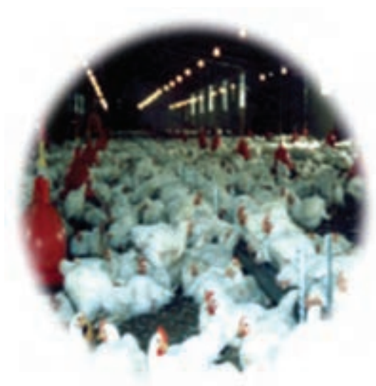
شکل ۴-۱۳- توانمندی‌های اقتصادی در بخش پرورش دام و طیور