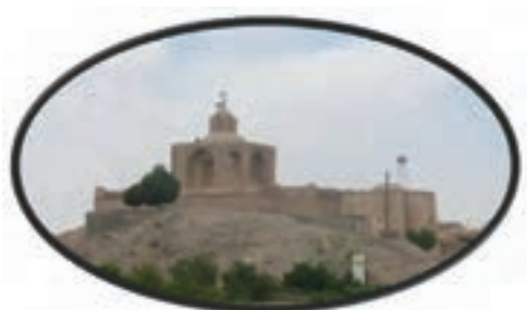
شکل ۱۶-۱۲- آرامگاه ابن حسام در شهر خوسف