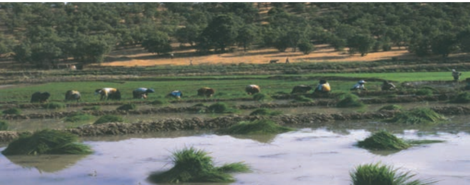
شکل ۲-۶ - شهرستان دنا، روستای کریک