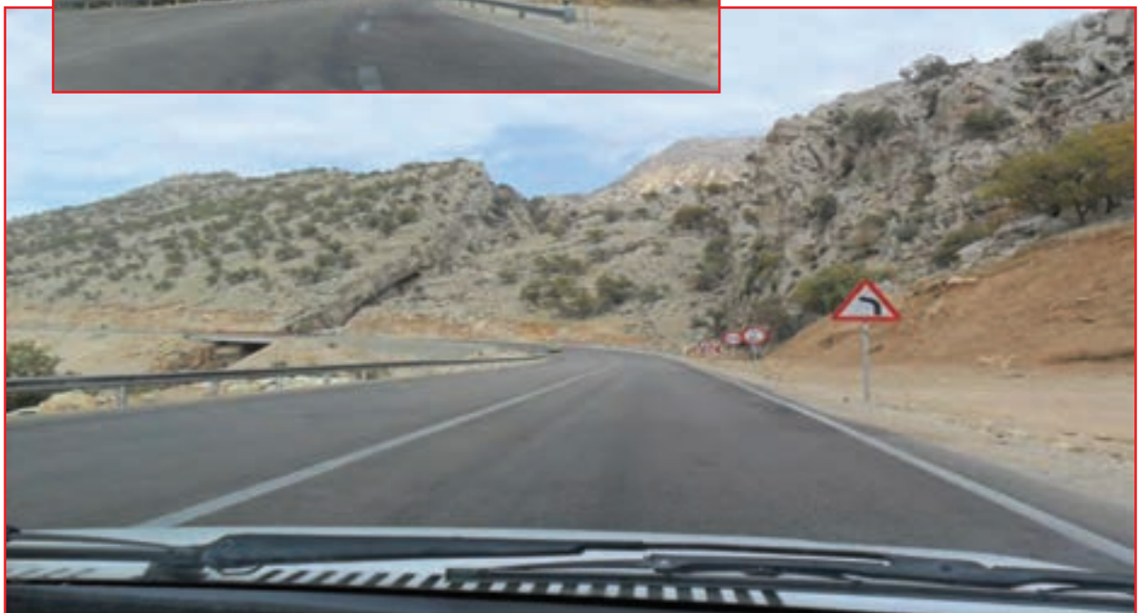
شکل ۲۰-۵- راه‌های ارتباطی استان