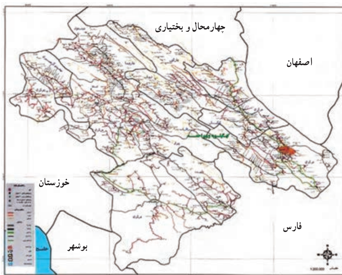
شکل ۲۱-۵- نقشه راه‌های استان