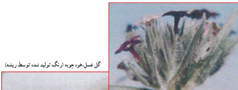
گل عسل، هوه چوبه (رنگ تولید شده توسط ریشه)