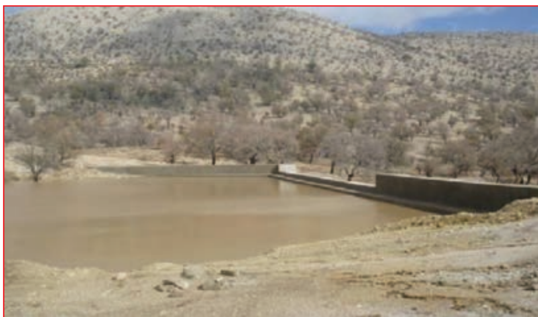
شکل ۱۶-۵- توانمندی‌های حوزه آبخیزداری استان در مهار آب