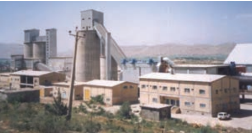
شکل ۲۲- ۵