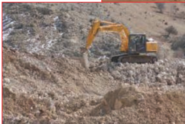
معدن سنگ آهک