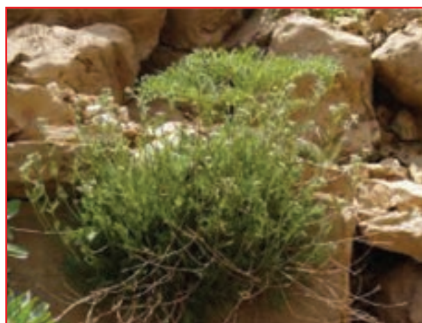
درمنه (آویشن مه)

شکل ۱۸-۵: چند نمونه از گیاهان دارویی و صنعتی استان