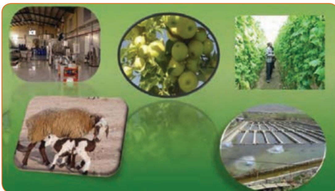
شکل ۱۵-۵. بخشی از توانمندی‌های اقتصادی استان

بخش کشاورزی در استان می‌تواند در تولید اشتغال و امنیت غذایی کشور نقش مهمی داشته باشد. استان کهگیلویه و بویراحمد در سال زراعی ۸۸-۱۳۸۷ حدود ۲۶۲۰۰۰ هکتار اراضی زراعی آبی و دیمی را به خود اختصاص داده است و سطح زیر کشت گندم آبی و دیم به ترتیب به ۲۵۱۱۰ و ۸۰۰۰ هکتار رسیده است. از نظر تولید حبوبات با ۵۹۶۲ تن دارای رتبه ۱۱ و از نظر تولید محصولات باغی این استان در زمینه تولید گردو در کشور رتبه دوم و از نظر تولید سیب درختی در رتبه نهم قرار دارد. این استان در تولید جو رتبه هشتم کشور را داراست.