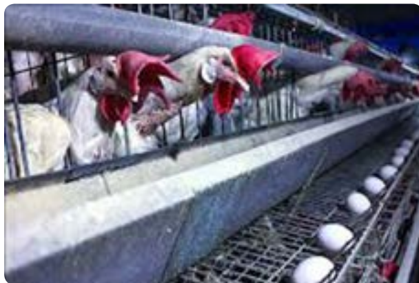
شکل ۵-۱۳- واحدهای مرغداری و گاوداری صنعتی

پرورش شتر، اسب، شترمرغ، بلدرچین و ... از دیگر فعالیت‌های دام و طیور است که در سال‌های اخیر مورد توجه قرار گرفته است.