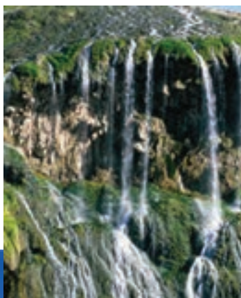
شکل ۸-۵- غار، روستای ده شیخ در بخش پاتاوه

۳- آبشارها: آبشارهای معروف استان عبارت‌اند از: آبشار یاسوج، آب نهر کاکان، آبشار شهنیز، آبشار تنگ تامرادی و آبشار بهرام بیگی در شهرستان بویراحمد، آبشار کمر دوغ و آبشار خیمه و کوه دیوک در کهگیلویه و آبشار مفید، آبشار منج و آبشار کوه گل، آبشار آب سیا (چاگل) در شهرستان دنا، آبشار طسوج در چرام، آبشار شادگان در شهرستان باشت، آبشار رودبال، آبشار هرجون و آبشار کیوان لیستر در شهرستان گچساران.