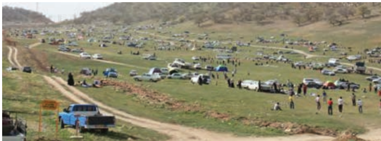
شکل ۱۱-۵- سرنجل کل یاسوج