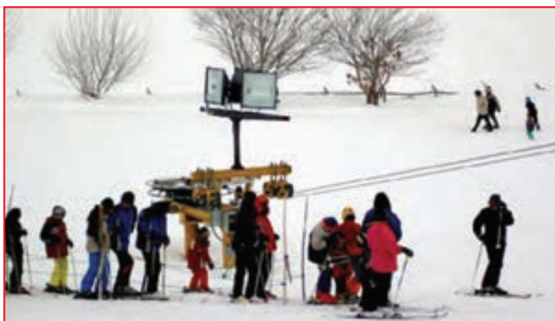
شکل ۱۲-۵- پیست اسکی کاکان