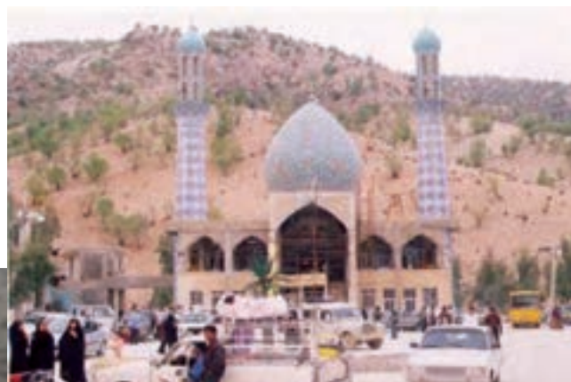
شکل ۲- ۵- امامزاده سید محمد