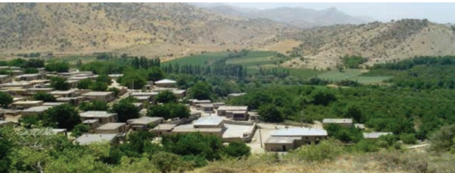
شکل ۱۳-۵- روستاهای هدف گردشگری