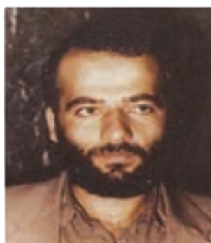
شهید مجتبی استکی