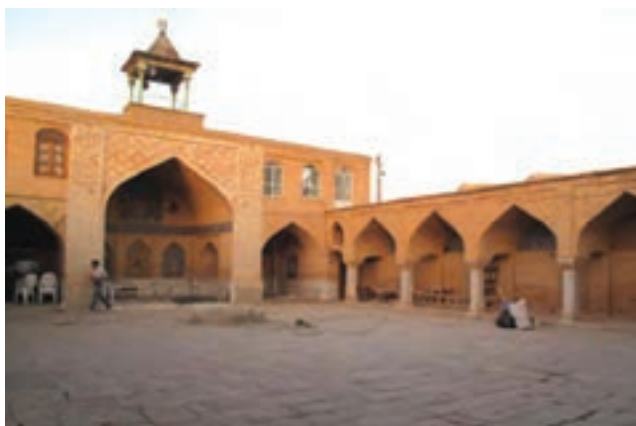
تصویر ۱۱-۱۰ مسجد جامع چالستر

از اواخر قرن دوم هجری حکام محلی چهارمحال و بختیاری تابع خلفای عباسی شدند و از قرن سوم هجری به بعد است که عنوان «بلاد اللور» به استان‌های کنونی لرستان، ایلام، چهارمحال و بختیاری، کهگیلویه و بویر احمد و بخش‌هایی از استان‌های فارس و خوزستان اطلاق شد.