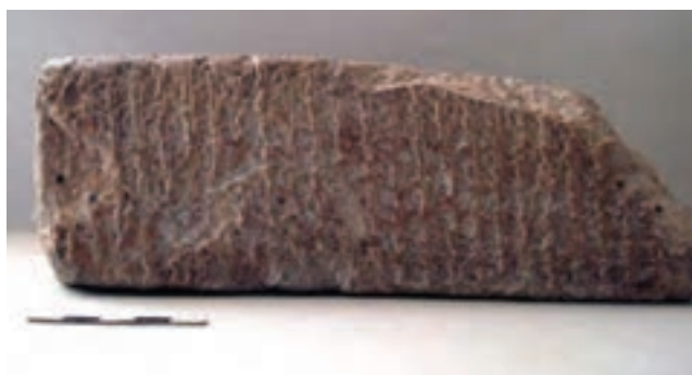
تصویر ۳-۱- آجر نوشته ایلامی کشف شده در شهرستان لردگان

محوطه‌های باستانی مربوط به هزار سال قبل به این سو نشان می‌دهند که، اندک‌اندک گروه‌های مهاجر آریایی این منطقه را مانند سایر مناطق ایران به اشغال خود درآورده و بعد از سرنگونی حکومت ایلام به دست آشوری‌ها، هخامنشیان با تأسیس امپراتوری خود وارث تمدن و فرهنگ ایلامی‌ها در منطقه شده‌اند. اگر چه اطلاعات ما از وضعیت استان در دوره هخامنشی محدود است، ولی آثار به دست آمده نشانگر حضور پررنگ هخامنشیان در منطقه چهارمحال و بختیاری است.