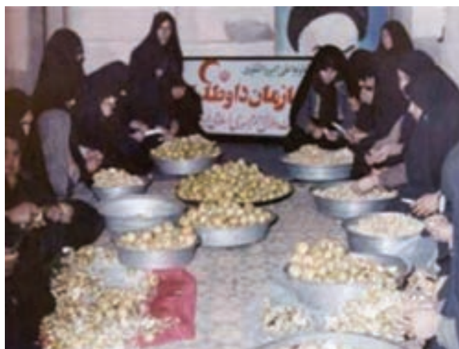
تصویر ۹-۱۱- اهدای کمک‌های مردم استان به جبهه (کارگاه همگام با جبهه)

رزمندگان استان ما از ابتدای جنگ تحمیلی در اغلب عملیات‌ها شرکت نموده و با تشکیل تیپ مستقل ۴۴ قمر بنی‌هاشم (قبل از عملیات محرم) فتوحات زیادی را کسب نمودند. در این میان فرهنگیان و دانش‌آموزان استان نقش بسیار مهمی داشتند و شهدای زیادی را تقدیم اسلام و انقلاب نمودند.