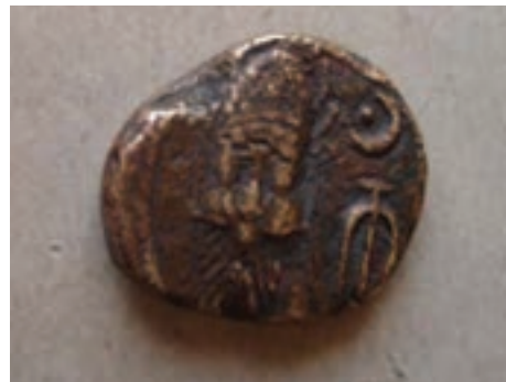
تصویر ۵-۱۰- سکه دوره الیمایی

احتمال می‌رود هم زمان با دولت سلوکیان، حکومت محلی «الیمایی» در بخش‌هایی از مناطق غربی منطقه با مرکزیت شهر ایذه تشکیل شده باشد. الیمایی‌ها با استفاده از نبود یک حکومت مرکزی مقتدر پس از سقوط هخامنشیان و نیز شیوه حکومت ملوک الطوائفی اشکانیان، بر قدرت خود افزودند؛ به‌طوری که نواحی جنوب خوزستان تا خلیج فارس را به اشغال خود در آورده و مستقلاً به ضرب سکه پرداختند. اگر چه با تشکیل دولت ساسانی به قدرت حکمرانان الیمایی پایان داده شد. نفوذ سیاسی - اجتماعی، تمدنی و فرهنگی ساسانیان در استان به قدری زیاد بوده که علاوه بر بقایای جاده‌ها و پل‌ها، تعداد زیادی اشیاء تاریخی از جمله سکه و مهر از این دوره بر جای مانده است. بردگوری‌ها نیز از دیرین آثار سنگی استان در دوران قبل از اسلام می‌باشند که در مناطق مختلف پراکنده‌اند.