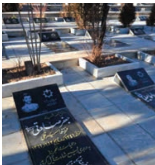
تصویر ۱-۳- گلزار شهدای شهرکرد

— آیا در مورد اتفاقاتی که در زمان انقلاب و جنگ تحمیلی در استان رخ داده، چیزی شنیده‌اید؟