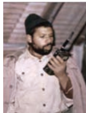
سردار شهید مرتضی اسماعیل زاده