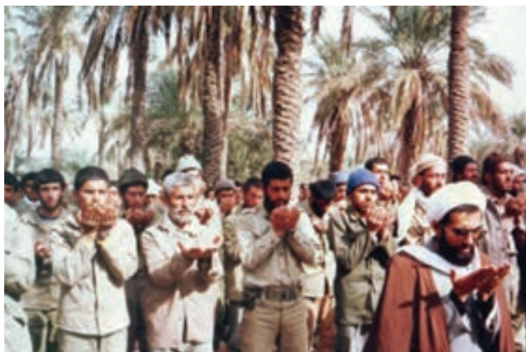
تصویر ۱-۱- رزمندگان استان در جبهه‌های حق علیه باطل

— آیا در مورد اتفاقاتی که در زمان انقلاب و جنگ تحمیلی در استان رخ داده، چیزی شنیده‌اید؟