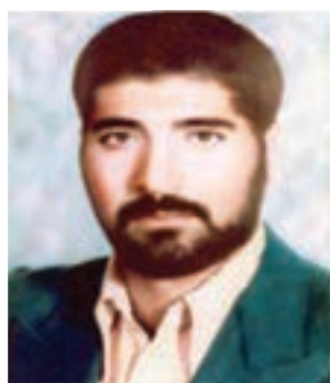
شهید امامقلی جعفرزاده