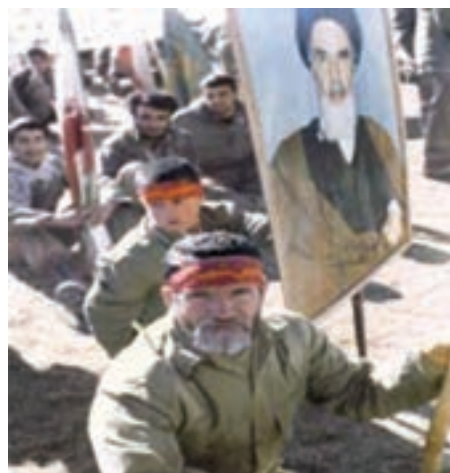
تصویر ۸-۱۱- اعزام رزمندگان اسلام به جبهه (در این نبرد، پیر و جوان، از ایران اسلامی دفاع می‌کردند)