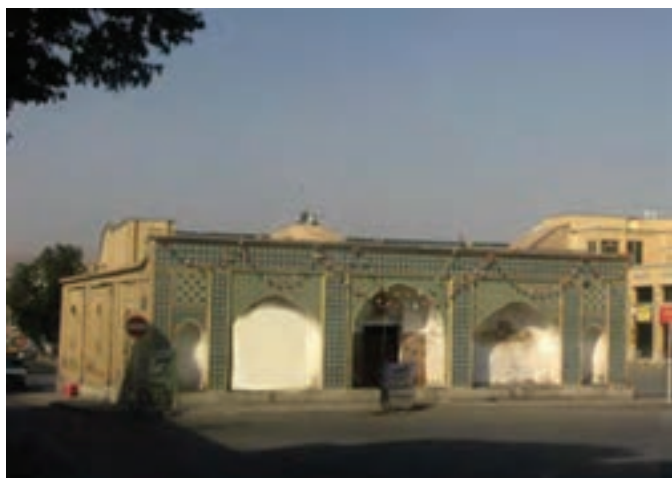
تصویر ۱۳-۱۰ مسجد اتابکان شهرکرد

بعد از تشکیل حکومت اتابکان لُر در سال ۵۵۰ هـ. ق. و قرار گرفتن منطقه چهارمحال و بختیاری در محدوده این حکومت و همجواری با مرکز حکومت آنها یعنی شهر ایذه، بر اهمیت منطقه افزوده شد. اتابکان لُر با ایجاد ثبات و امنیت در منطقه، اقدامات عمرانی متعددی انجام دادند که راه سازی – راه های مالرو – ساخت پل ها، احداث کاروان سراها و مساجد از مهم ترین اقدامات آنان است. دوران اتابکان شاخص ترین دوره اسلامی منطقه است، از همین رو آثار متعددی از این دوره در منطقه چهارمحال و بختیاری شناسایی شده است. از قرن ششم هجری در دوره اتابکان لُر «ایالت جبال» به «عراق عجم» تغییر نام داد؛ بنابراین، استان ما در قلمرو این عنوان قرار گرفت. با انقراض حکومت «اتابکان لُر» در سال ۸۲۸ هـ. ق. توسط تیموریان این منطقه همچنان اهمیت خود را در وقایع دولت تیموریان حفظ کرد.