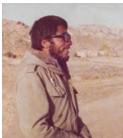
سردار شهید سهراب نوروزی