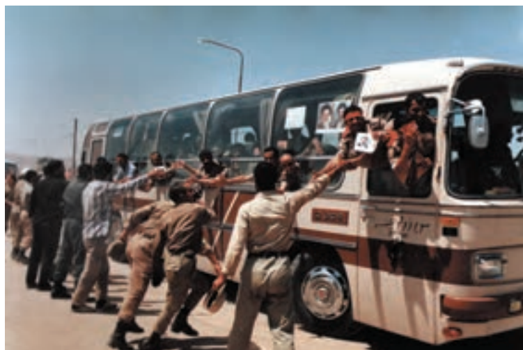
تصویر ۱۰-۱۱- ورود آزادگان به کشور