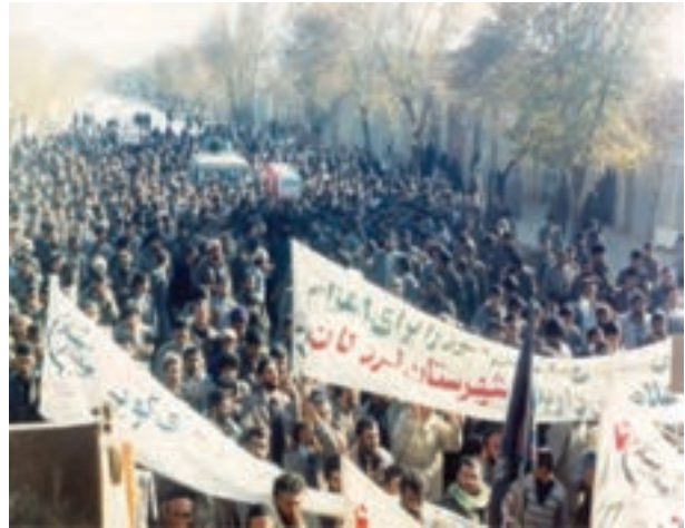
تصویر ۶-۱۱- اعزام رزمندگان اسلام از استان به جبهه‌های نبرد حق علیه باطل

روستاهای شیخ شبان و هرچگان و شهر وردنجان به دلیل تعداد زیاد شهدا نسبت به جمعیت به عنوان روستاهای نمونه کشور محسوب شده‌اند. به عنوان مثال، روستای شیخ شبان با داشتن حدود ۲۵۰۰ نفر جمعیت در زمان جنگ، حدود ۱۰۰۰ نفر رزمنده در جبهه‌ها داشته است که از این تعداد حدود ۸۰ نفر به فیض شهادت نایل آمده‌اند.