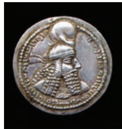
تصویر ۷-۱۰- سکه دوره ساسانی