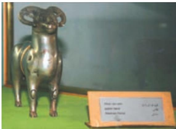
تصویر ۹-۱۰- مجسمه بازمانده از دوره ساسانی

احتمال می‌رود هم زمان با دولت سلوکیان، حکومت محلی «الیمایی» در بخش‌هایی از مناطق غربی منطقه با مرکزیت شهر ایذه تشکیل شده باشد. الیمایی‌ها با استفاده از نبود یک حکومت مرکزی مقتدر پس از سقوط هخامنشیان و نیز شیوه حکومت ملوک الطوائفی اشکانیان، بر قدرت خود افزودند؛ به‌طوری که نواحی جنوب خوزستان تا خلیج فارس را به اشغال خود در آورده و مستقلاً به ضرب سکه پرداختند. اگر چه با تشکیل دولت ساسانی به قدرت حکمرانان الیمایی پایان داده شد. نفوذ سیاسی - اجتماعی، تمدنی و فرهنگی ساسانیان در استان به قدری زیاد بوده که علاوه بر بقایای جاده‌ها و پل‌ها، تعداد زیادی اشیاء تاریخی از جمله سکه و مهر از این دوره بر جای مانده است. بردگوری‌ها نیز از دیرین آثار سنگی استان در دوران قبل از اسلام می‌باشند که در مناطق مختلف پراکنده‌اند.