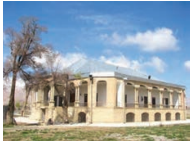
تصویر ۲۱-۱۰ قلعه سردار اسعد در جونقان