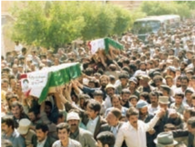
تصویر ۷-۱۱- تشییع پیکر شهدا در زمان جنگ تحمیلی