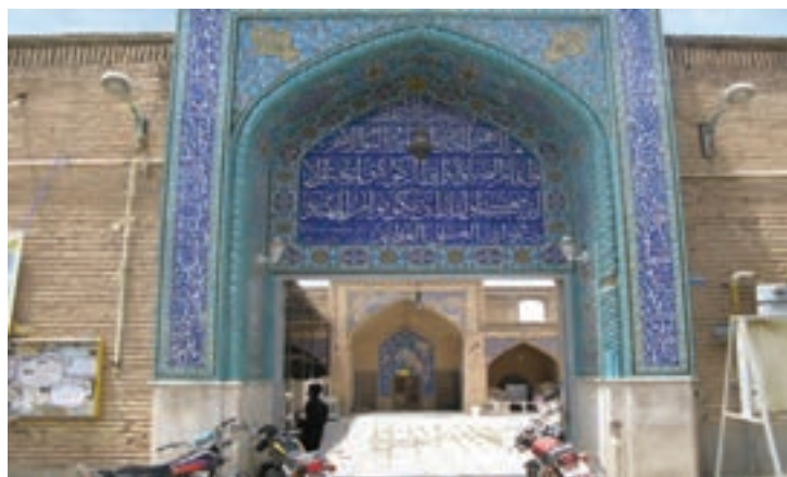
تصویر ۵-۱۱- مسجد جامع شهرکرد (یکی از مراکز تجمع و برگزاری سخنرانی‌های انقلابی در جریان انقلاب اسلامی)

الف) نقش استان در حراست از مرزهای ایران اسلامی همان‌طور که در درس دهم خواندیم، مردم چهارمحال و بختیاری در طول تاریخ همراه با دیگر هموطنان خود به پاسداری از کشور پرداخته‌اند. در این درس با نقش استان در زمان انقلاب اسلامی و جنگ تحمیلی عراق علیه ایران و نیز بعضی شخصیت‌ها و سرداران دفاع مقدس آشنا می‌شوید.