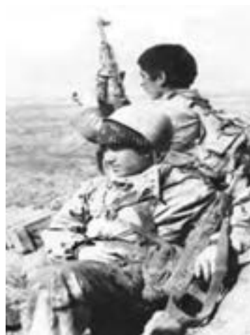
تصویر ۱۱-۱۲- دانش آموزان شهید صحراگرد و خالدي