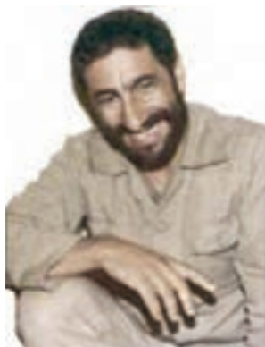
سردار شهید محمدعلی شاه مرادی