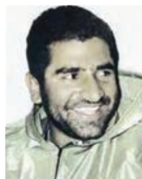
سردار شهید ایرج آقا بزرگی نافچی