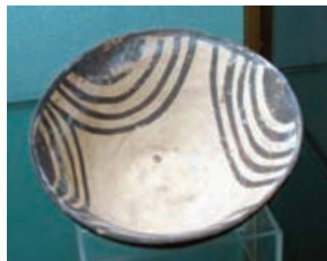
تصویر ۲-۱۰ آثار دوره پیش از تاریخ استان