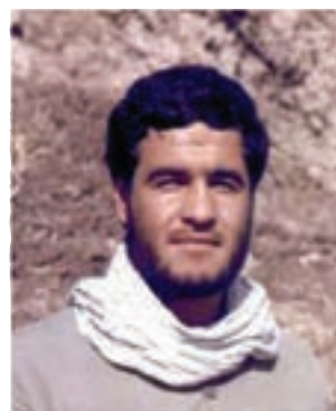
سردار شهید جمشید براتیور