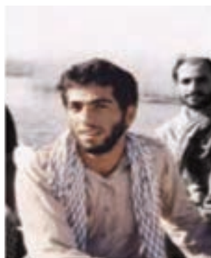
امیر سرتیپ شهید کریم بیاتی