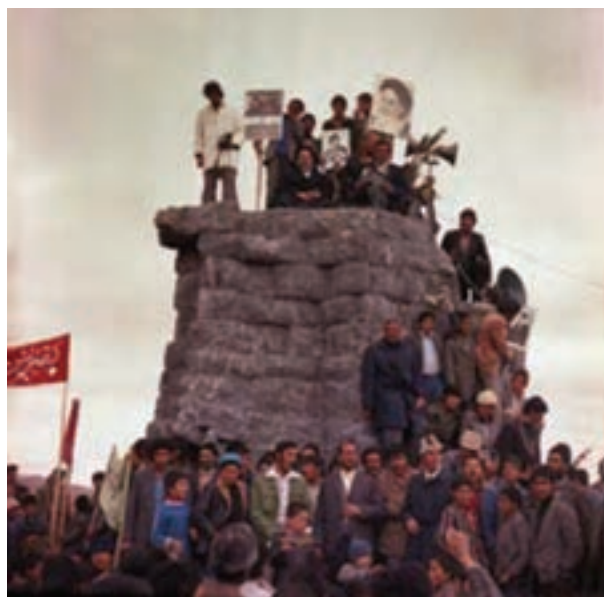
تصویر ۲۴-۱۰- سقوط نماد نظام شاهنشاهی در بروجن

در هر حال حکومت پهلوی اگر چه با اجرای الگوی توسعه غربی در حوزه اقتصادی و ایجاد طبقه متوسط جدید در حوزه اجتماعی و تضعیف و تخریب فرهنگ دینی و حاکم نمودن فرهنگ غربی در ایران، اهداف خاصی را دنبال می‌کرد؛ ولی در استان چهارمحال و بختیاری به دلیل ریشه‌های قومی و مذهبی و اثرپذیری مردم از روحانیت و شعائر مذهبی، این سیاست نتوانست