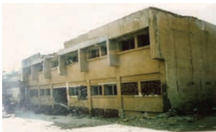
تصویر ۱-۲- بمباران شهرکرد توسط دشمن بعثی — (۱۳۶۶/۱۲/۲۰) — ساختمان مخابرات

مردم ولایت مدار و غیرتمند استان ما، با شروع انقلاب اسلامی با شجاعت در صحنه‌های مختلف حضور یافتند. آنها در هشت سال دفاع مقدس، با رشادت فراوان برای پاسداری از تمامیت ارضی کشور و اهداف انقلاب اسلامی از هیچ گونه فداکاری و ایثار دریغ نکردند.