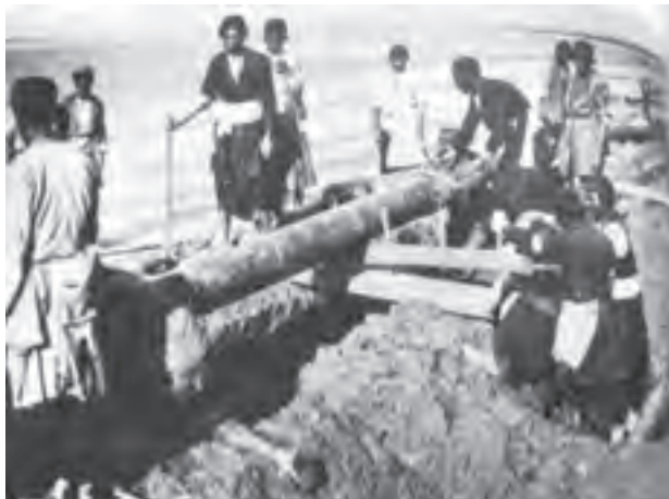
تصویر ۲۲-۱۰ بختیاری‌ها و نفت

از این پس خوانین بختیاری، موفق به دستیابی به مقامات و مناصب مهم دولتی و موقعیت‌های مناسب اجتماعی و اقتصادی شدند. حضور کمپانی «لینچ» در منطقه و قرارداد خوانین بختیاری با آنان برای احداث جاده‌ای کاروان رو که خوزستان را به اصفهان متصل می‌کرد؛ و نیز قرارداد انگلیسی‌ها در مورد نفت جنوب با خوانین بختیاری شرایط و موقعیت‌های مناسبی برای آنان فراهم آورد. کاخ قلعه‌های زیادی از این دوره در مناطق مختلف چهارمحال و بختیاری متعلق به خوانین بر جای مانده است.