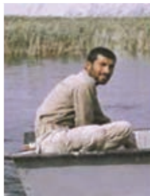
سردار شهید اردشیر غریب