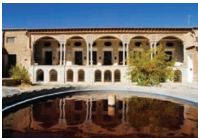
تصویر ۱۷-۱۰ قلعه ستوده در چالستر