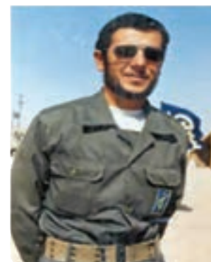
سردار شهید سید کمال فاضل