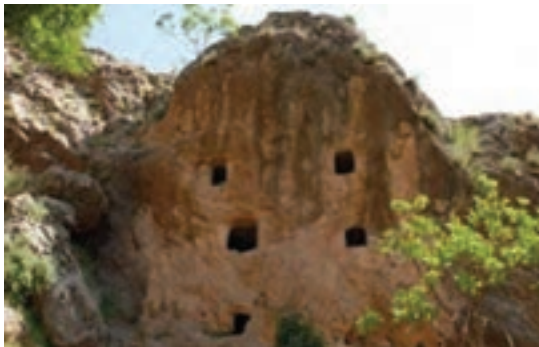
تصویر ۶-۱۰- بردگوری‌ها (اردل)

هم زمان با حکمرانی دولت‌های هخامنشیان، اشکانیان و ساسانیان، وجود مراتع غنی منطقه را به بیلاق و سکونتگاه تابستانی مهم جوامع کوچ روتبديل کرده بود که وجود ایل راه‌های باستانی و حجاری نقوش برجسته در کنار این راه‌ها به اهمیت فوق العاده مسیرهای ارتباطی که موجب فراهم شدن زمینه ارتباطات اجتماعی و تجاری بین تمدن‌های جنوب غربی ایران و فلات مرکزی شده است، اشاره دارند.