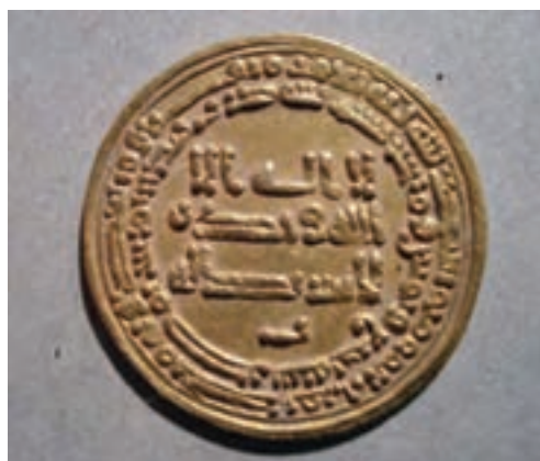
تصویر ۱۰-۱۱ سکه دوره اسلامی