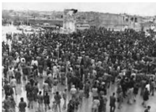
تصویر ۲۳-۱۰- سقوط نماد نظام شاهنشاهی در شهرکرد - دی ماه ۱۳۵۷

در دوره پهلوی، بختیاری‌ها که تمام منطقه را در دست داشتند، به تدریج نقش سیاسی خود را از دست می‌دهند؛ و تشکیلات سیاسی قبیله‌ای متلاشی می‌گردد؛ و با توجه به امنیت نسبی ایجاد شده و رویدادهایی چون اسکان اجباری عشایر – در دوره پهلوی اول – و انجام اصلاحات ارضی – در دوره پهلوی دوم – کوچ روی کم رونق و یکجانشینی گسترش می‌یابد.