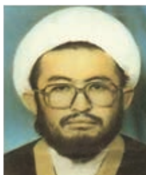
حجت الاسلام شهید عیسی توسلی