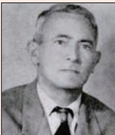
تصویر ۲۸-۱۰- حسین پژمان بختیاری

پژمان، شاعر، نویسنده، مترجم و پژوهشگر برجسته معاصر، در سال ۱۲۷۹ ه.ش. دیده به جهان گشود. پدرش علی مراد خان به همراه دیگر خوانین بختیاری در جریان مشروطه خواهی نقش فعال و نسبتاً مؤثری داشته است. مادر پژمان عالم تاج قائم مقامی، متخلص به ژاله از نوادگان قائم مقام فراهانی، وزیر و نویسنده مشهور عهد قاجار بود. پژمان پس از تحصیل و فراگیری زبان فرانسه ابتدا در وزارت جنگ و سپس در وزارت پست و تلگراف به کار مشغول شد. او پس از بازنشستگی به فعالیت‌های ادبی و شرکت در مجالس و معاشرت با اهل علم و ادب مشغول شد و آثار و اشعار گران‌بهای از خود به یادگار گذاشت. حسین پژمان سرانجام در سال ۱۳۵۳ ه.ش. چشم از جهان فرو بست. از آثار او به دیوان اشعار، کویر اندیشه و خاشاک می‌توان اشاره کرد.