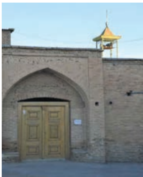
تصویر ۱۵-۱۰: مسجد جامع شهر کیان

همچنین در این زمان تعداد قابل توجهی از آرامنه در نقاط خوش آب و هوای چهارمحال اسکان داده می‌شوند. هسته اولیه بسیاری از شهرهای امروزی استان در دوره صفویه شکل گرفته است. در این زمان، مرکز حکومتی و دولتی منطقه در «قهرخ» - فرخ شهر - قرار داشت. از این دوره آثار و بناهای بسیاری بر جای مانده است. استان در دوران افشاریه: در دوره افشاریه منطقه چهارمحال و بختیاری به دلیل هم‌جواری با شهر بزرگ اصفهان و برخورداری از شرایط طبیعی خاص و به‌خصوص دارا بودن چمن‌زارها و چراگاه‌های وسیع و سرسبز، استقرار ایل بزرگ بختیاری و وجود خوانین و سرکردگان قدرتمند که در صدد دستیابی به قدرت بودند، اهمیت بسیاری داشته است.