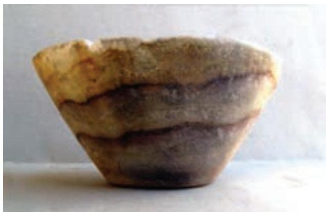
تصویر ۴-۱- ظرف سنگی کتیبه دار دوره هخامنشی