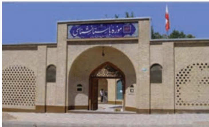
تصویر ۱-۱۰ موزه باستان‌شناسی شهرکرد

آیا می‌دانید استان چهارمحال و بختیاری، مانند دیگر نقاط کشور ما ایران دارای پیشینه غنی تمدنی و فرهنگی است؟ فکر می‌کنید پیشینه تاریخ و تمدن در استان به چه زمانی باز می‌گردد؟ شما در این درس با برخی از جنبه‌ها و آثار تاریخی و فرهنگی و میراث‌های ماندگار استان خود آشنا می‌شوید.