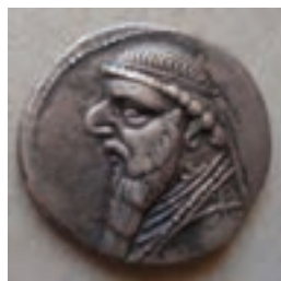
تصویر ۸-۱۰- سکه دوره اشکانی