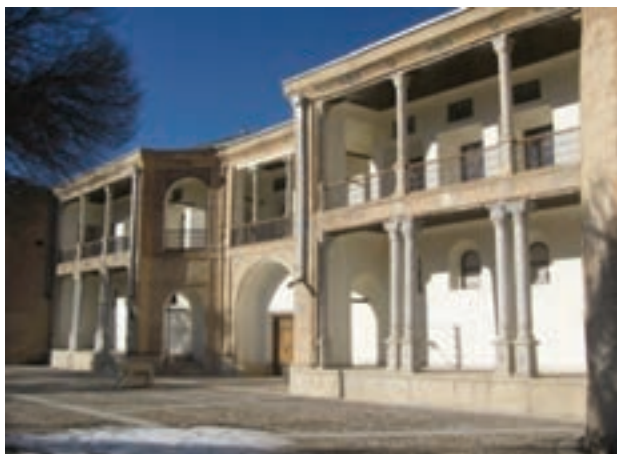
تصویر ۲۰-۱۰ قلعه امیر مفخم در دزک