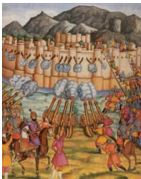
تصویر ۱۴-۱۰: فتح قلعه قندهار در دوره نادر شاه افشار

در این دوره با توجه به بروز شورش‌های مختلف علیه دولت مرکزی در منطقه بختیاری و ماهیت نظامی دولت نادر، منطقه چهارمحال و بختیاری بارها مورد تهاجم و لشکرکشی قوای نادرشاه افشار قرار گرفته است. مشارکت بختیاری‌ها در فتح قلعه قندهار توسط سپاهیان نادر یکی از وقایع مهم و ماندگار این دوران است. اداره امور «بختیاری» و کار جمع‌آوری مالیات و سربازگیری در دوران افشاریه، توسط حاکمانی که از سوی نادر به این مقام گمارده می‌شدند، صورت می‌گرفت.