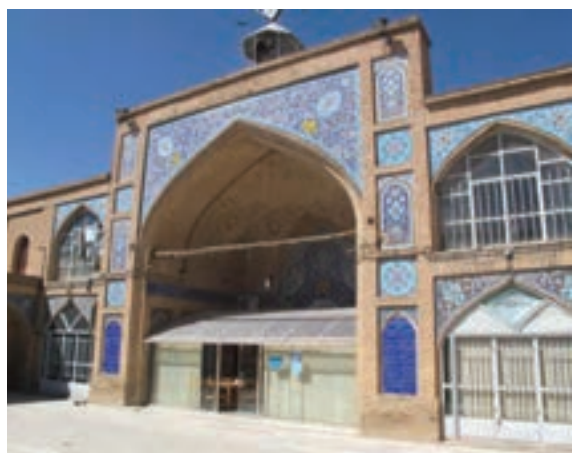
تصویر ۱۸-۱۰ مسجد جامع شهرکرد

یکی از وقایع مهم تاریخ استان در دوره قاجاریه، نقش مهم مردم استان در جریان اعاده مشروطیت (مشروطه دوم) و مقابله با استبداد محمدعلی شاهی بود. به دنبال تقاضاهای اعضای کمیته مشروطه خواهان اصفهان و علمای با نفوذی چون «حاج آقا نورالله