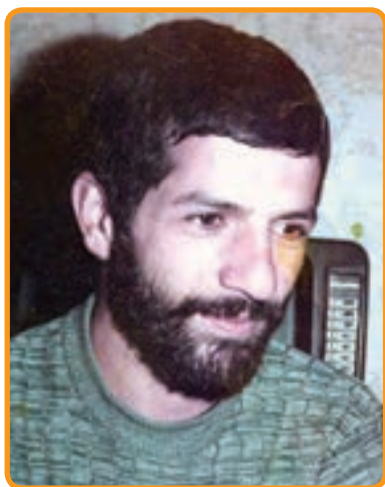
سردار شهید مهدی شرع بسند مسئول عملیات تیپ نبی اکرم (ص)