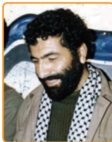
سردار شهید یداله کلهر قائم مقام لشکر ده حضرت سیدالشهداء (ع)