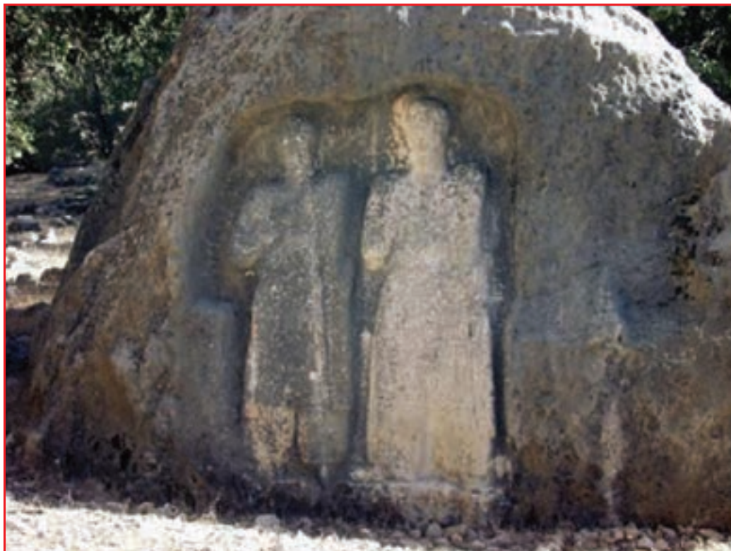
شکل ۴-۴- نقوش برجسته سروک