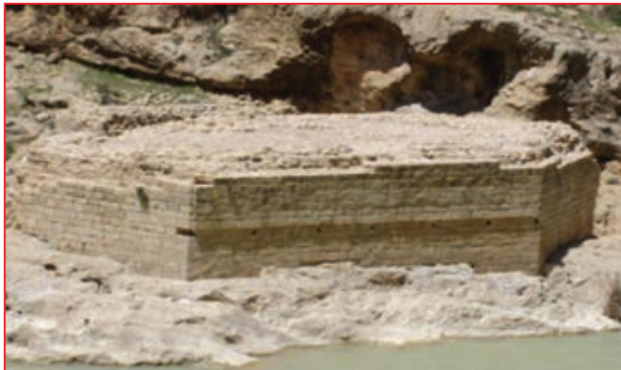
شکل ۳-۴- پایه پل تخت شاه نشین