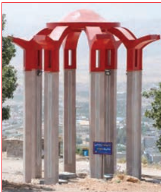
شکل ۹-۴- یادمان شهدای گمنام

تعداد شهدای استان: از افتخارات این استان در دفاع مقدس کسب مقام اول در اعزام نیرو از نظر جمعیت به جبهه‌های جنگ و اهداء ۱۸۰۰ شهید، ۳۳۰۰۰ رزمنده، ۱۳۰۰۰ جانباز، ۳۱۰ نفر آزاده، که ۲۷۰ نفر از شهدا پاسدار، ۳۰۰ نفر سرباز و بقیه بسیجی بوده‌اند.