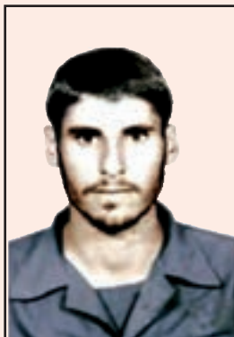
شهید خدامراد مرادی (چرام)