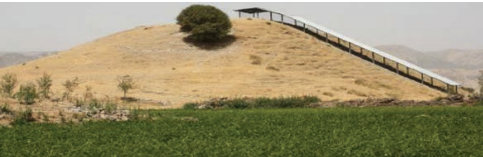
شکل ۱-۴- تل خسرو یاسوج

اهمیت استان کهگیلویه و بویراحمد محدود به آثار به جای مانده از دوران تاریخی نیست. بلکه با مطالعات باستان‌شناسی انجام گرفته در این استان، قدمت آن به دوران پارینه سنگی می‌رسد. دسترسی شکارگر در دوره‌های پارینه سنگی به منابع کوهستان و دشت از دلایل انتخاب این منطقه برای استقرار در این سرزمین بوده است. شرایط مساعد زیست محیطی در دشت‌های استان همچون دشت‌های دهدشت، کلاچو، سمغون و حاشیه رود مارون در شکل‌گیری استقرارهای آغازین دوره نوسنگی در این استان نقش اساسی داشته است. مهم‌ترین محوطه‌های شناسایی شده در استان از دوره نوسنگی عبارت‌اند از تل بردی، تپه بی‌بی زلیخایی، تل گل گندم کش، تل کوچک، گپ، تل شوولی. از دوره پیش از تاریخ آثار و شواهد بسیاری وجود دارد که بیشتر به شکل تپه و محوطه که از جمله می‌توان به تل خسرو، تپه ده و ده، محوطه موردراز، تل گهی، تل مهره‌ای، محوطه باغ بند، پناهگاه صخره‌ای دالو، محوطه تل مسجیدی، محوطه و قلعه سرپری، تل تویی، اشکفت شلی، تلی صراص، محوطه دلی باسیر، اشکفت بندی و محوطه کف برکه‌ای اشاره کرد. تپه‌های باستانی استان کهگیلویه و بویراحمد با توجه به سفال‌های به‌دست آمده از آنها یک جمله (تپه ده و ده) در شهرستان گچساران قدمتی برابر با هزاره سوم پیش از میلاد مسیح را نشان می‌دهد.