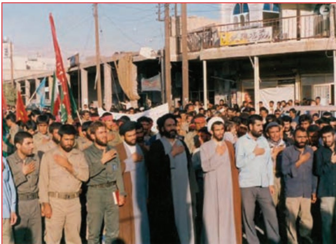
شکل ۶-۴- اعزام نیرو به جبهه‌های نبرد حق علیه باطل

استان ما به دلیل موقعیت جغرافیایی خود در طول تاریخ به سبب راه ارتباطی شمال و جنوب و موقعیت سوق الجیشی آن همچنین استعداد توان رزمی و نظامی (روحیه سلحشوری) مردم آن در حراست از میهن و مقابله با متجاوزان مورد توجه بوده است، اما پررنگ‌ترین جلوه پاسداری مربوط به دوران هشت سال دفاع مقدس است.