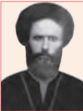
شکل ۱۷-۴- مرحوم آقا میرعلی صفدر تقوی

الف) مرحوم آقا میرعلی صفدر تقوی: در سال ۱۲۹۴-۱۲۹۳ در کهگیلویه متولد شد. پس از فوت پدرش (میرمحمد جعفر) مدتی در حوزه های علمی کازرون و شیراز به تحصیل علم پرداخت. سپس عازم نجف شد. ایشان در مدت تحصیل در حوزه علمی نجف با فقهای مشهوری همچون مرحوم آیت الله العظمی سید محمد کاظم یزدی صاحب عروة الوثقی و مرحوم آیت الله العظمی سید ابوالحسن اصفهانی صاحب وسیله النجات مراوده و مکاتبات داشته است که از مقام علمی ایشان حکایت می کند. بعد از بازگشت به کهگیلویه، مقام ممتاز علمی و تقوای وی باعث شد اعتماد عمومی مردم را به دست آورد. از وی سروده هایی با مضامین دینی و سیاسی به جا مانده است. وی سرانجام در ۱۵ صفر ۱۳۵۷ ه.ق مطابق با ۲۷ فروردین ۱۳۱۷ در سن ۶۳ سالگی در شهر سوق به رحمت خدا پیوست.