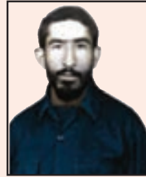
شهید نورالله یزدانپناه (لوداب)