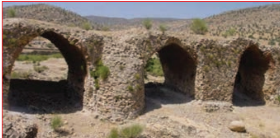
شکل ۲-۴- پل قدیمی پاتاوه از دوره هخامنشیان

با آمدن پارس‌ها به این نواحی و قدرت گرفتن شاهان اولیه هخامنشی، این منطقه خاستگاه تمدن هخامنشی نیز به حساب می‌آید. امپراتوری هخامنشی دارای ۲۳ استان (ساتراپ) بود که ساتراپ پارس یکی از آنها به شمار می‌رفته است. کهگیلویه و بویراحمد بخشی از ساتراپ پارس بوده است. پایه‌های پل هخامنشی در کنار شهر پاتاوه و پایه پل هخامنشی تخت شاه نشین و حماسه ملی آریو برزن این موضوع را تأیید می‌کند.