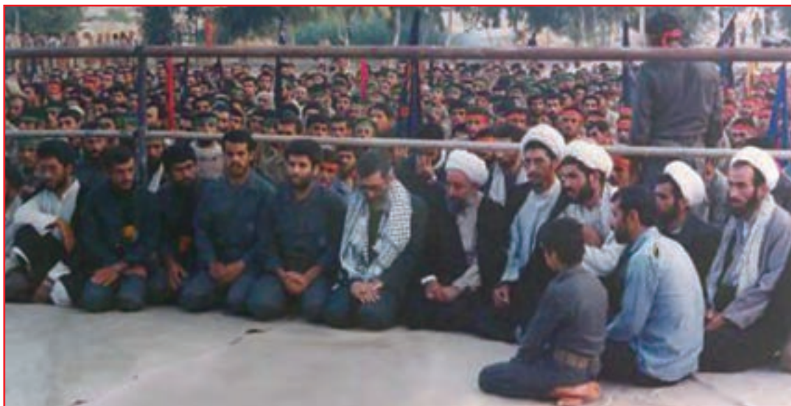
شکل ۸-۴- حضور رهبر معظم انقلاب در بین رزمندگان استان

تعداد شهدای استان: از افتخارات این استان در دفاع مقدس کسب مقام اول در اعزام نیرو از نظر جمعیت به جبهه‌های جنگ و اهداء ۱۸۰۰ شهید، ۳۳۰۰۰ رزمنده، ۱۳۰۰۰ جانباز، ۳۱۰ نفر آزاده، که ۲۷۰ نفر از شهدا پاسدار، ۳۰۰ نفر سرباز و بقیه بسیجی بوده‌اند.