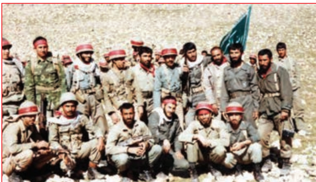
شکل ۷-۴- جمعی از رزمندگان استان

شرحی مختصر درباره حماسه و نقش استان در حماسه پد خندق: غیور مردان استان ما به طور مداوم همراه و همدوش سایر استان‌ها در مناطق جنگی در عملیات‌های متعددی شرکت نمودند، اما اوج حماسه این دلاور مردان گمنام در واپسین روزهای جنگ در پد خندق اتفاق افتاد. این حادثه تاریخی را جوانانی خلق کردند که در عملیات‌های مختلف افتخارات بی‌شماری نصیب اسلام و ایران نموده و در فاو تحسین جهانیان را برانگیختند و در کربلای ۴ و ۵ جزء نیروهای فاتح و نیز بیشترین موقعیت‌ها را در کردستان ایجاد کردند.