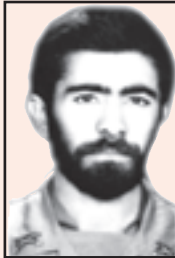
شهید امیر، همتعلی حسن زاده (ارتش)