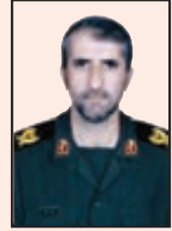
شهید گودرز نجفی (دنا)