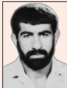
شهید امیر علیزاده (چرام)

شکل ۱۴-۴- بعضی از سرداران (فرماندهان هشت سال دفاع مقدس استان)