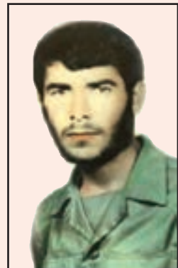
شهید عنایت الله بازگیر (دهدشت)