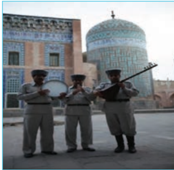
شکل ۲-۳- یک گروه عاشیق