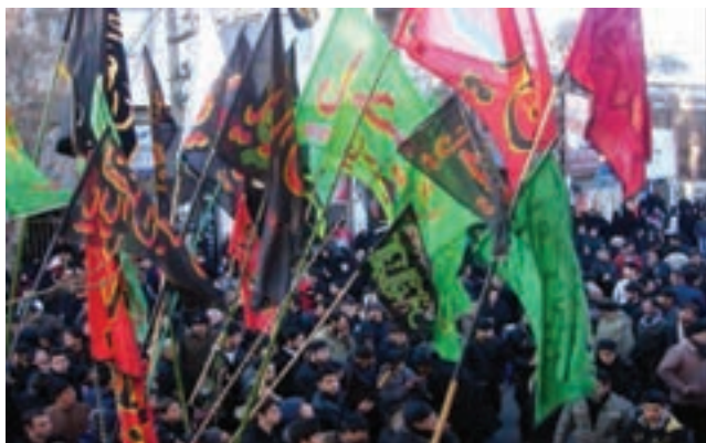
شکل ۳-۶- عزاداری در استان اردبیل

عزاداری ماه محرم : عزاداری ماه محرم در استان اردبیل با قدمت چندین صد ساله با برنامه زمان بندی خاصی از سالروز شهادت حضرت مسلم بن عقیل آغاز می گردد. قبل از فرا رسیدن ماه محرم اهالی محلات، مساجد را با پوشاندن پارچه های سیاهی که بر روی آنها اشعار حماسی و مرثیه ای نوشته شده آماده عزاداری می نمایند. با مراسم خاص تشت گذاری که بیانگر اعلان بیعت و وفاداری با آرمان های شهدای تشنه لب کربلاست، مردم به استقبال ماه محرم می روند.