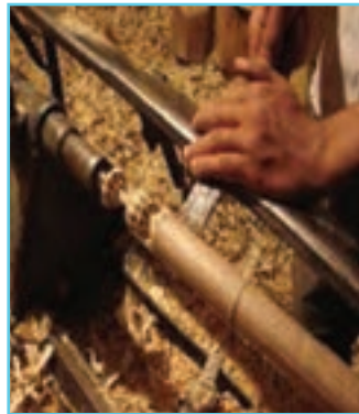
شکل ۱۶-۳ خراطی در استان اردبیل