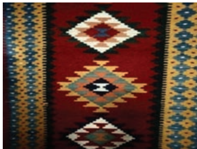
شکل ۱۳-۳- گلیم منطقه نمین