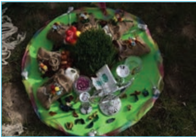
شکل ۱-۳ سفره هفت سین

استان اردبیل به عنوان قسمتی از سرزمین آذربایجان، با توجه به پیشینه کهن و غنی که از آن برخوردار است گنجینه‌هایی گرانبها از مراسم سنتی را در خود جای داده است. این آیین‌ها ریشه در باورهای عمیق دینی و الهی مردم این منطقه دارد. برخی از سنت‌ها از دوران قبل از اسلام وجود داشته و مردم آذربایجان با تطبیق آیین‌های سنتی با آموزه‌های اسلامی از آنها در زندگی‌شان بهره جسته‌اند. آیین‌هایی مانند چهارشنبه سوری، عید نوروز، شب چله و... که هنوز در استان اردبیل پا برجاست.