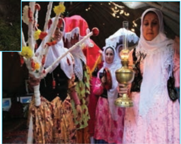
شکل ۲-۹ بردن بایراملیق برای عروس

الف) مراسم چهارشنبه سوری: در آموزه‌های ادیان الهی چهار عنصر آب، خاک، باد و آتش به عنوان عناصر اربعه تطهیرکننده ناپاکی‌ها شناخته می‌شود. به همین دلیل از دوران کهن چهار چهارشنبه آخر سال به نام یکی از این عناصر نام گذاری شده است. (اولین به نام یئل، دومین به نام توپراق، سومین به نام اُود و چهارمین به نام سو چهارشنبه سی نام گذاری شده بود.) امروزه تنها در شب آخرین چهارشنبه سال مراسم پریدن از روی آتش و در روز آخرین چهارشنبه در برخی نقاط استان از روی آب رد می‌شوند که به آن نئو اوستی گفته می‌شود.