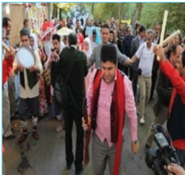
شکل ۱-۳- حضور عاشیق‌ها در مراسم‌های مختلف

داستان‌ها، حماسه‌ها و عاشقانه‌ها توسط «عاشیق‌های آذری» همراه موسیقی و ساز و آواز در سفرهای مختلف اجرا می‌شد. عاشیق‌ها در اکثر مراسم‌ها از عروسی گرفته تا تولد نوزاد از کوچ ایل گرفته تا جنگ و... حضور فعال داشتند بر همین اساس اشعار و آهنگ‌های متناسب با شرایط زمانی و مکانی ساخته و ارائه می‌کردند که از جمله توانایی‌های آنها سرودن اشعار فی‌البداهه در مقابل عاشیق دیگر می‌بود.