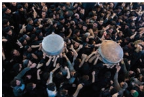
شکل ۳-۵- مراسم تشت گذاری در ماه محرم