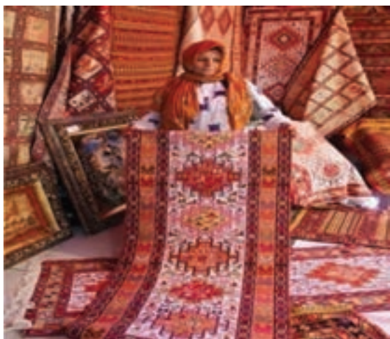
شکل ۱۴-۳- ورنی عشایر مغان

دستی ساخته شده که در هر واحد آن، ذوق و هنر و خلاقیت فکری صنعتگر سازنده به خوبی تجلی می یابد صنایع دستی گویند. این هنرها از دیرباز به عنوان یکی از شاخص های مهم علمی، هنری، فرهنگی و اجتماعی توسط استادان و هنرمندان چیره دست استان ما در زندگی مردم نقش پررنگی داشته است. با تغییرات اجتماعی به وجود آمده در شیوه های زندگی مردم بسیاری از این صنایع یا کاملاً از بین رفته و یا تنوع و شیوه تولیدشان تغییر کرده است. با این حال ورنی عشایر مغان و گلیم منطقه نمین مهر اصالت از سازمان فرهنگی هنری یونسکو دریافت کرده است. در استان اردبیل فعالیت های مربوط به صنایع دستی در بیش از ۶۰ رشته مختلف انجام می شود که به معرفی برخی از آنها پرداخته می شود :