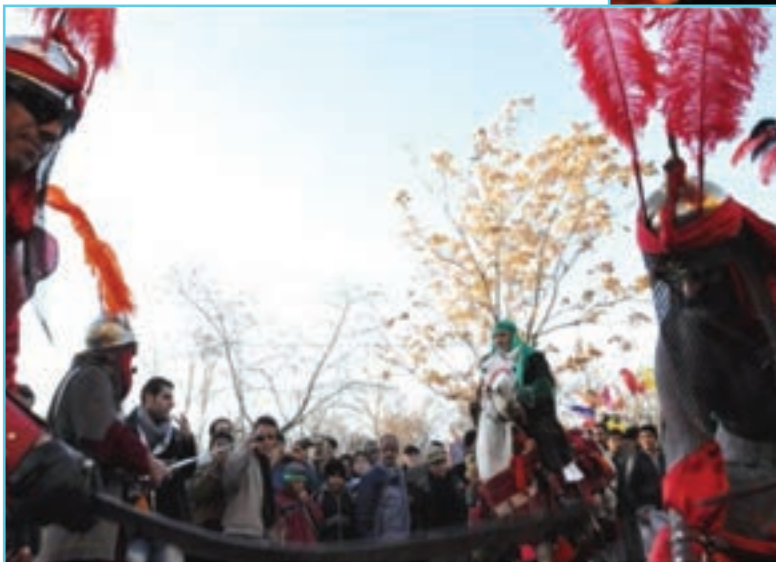
شکل ۸-۳- شبیه خوانی در عاشورای حسینی