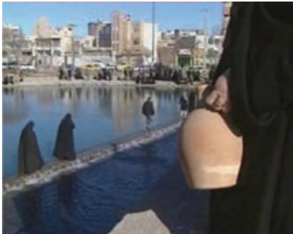
شکل ۱۲-۳- مراسم نثواوستی یا سواوستی (رد شدن از روی آب)

ب) عید نوروز: نوروز بایرامی یکی از اعیاد باستانی کهن ایرانی است که نه تنها پس از ورود اسلام از بین نرفته، بلکه با عجین شدن با آموزه‌های روشنگر دین مبین اسلام با شکوه بیشتری برگزار می‌گردد. در گذشته در منطقه ما آمدن عید نوروز توسط تکم‌چی‌ها که به عنوان سفیران یا پیک‌های آواز خوان شناخته می‌شدند به مردم نوید داده می‌شد.