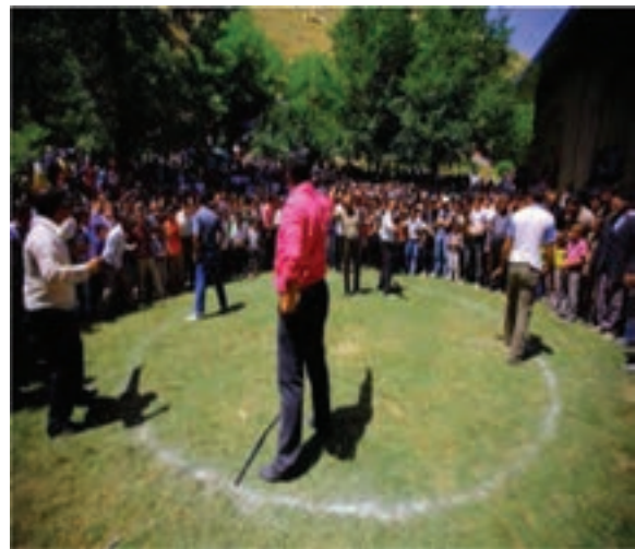
شکل ۳-۳. بازی محلی قیش قاپدی