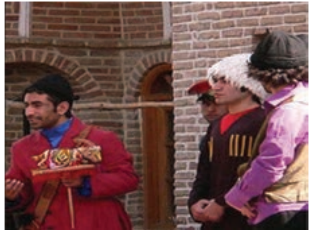
شکل ۱۱-۳- مراسم تکم‌گردانی