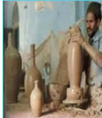
شکل ۱۵-۳ سفالگری در استان اردبیل