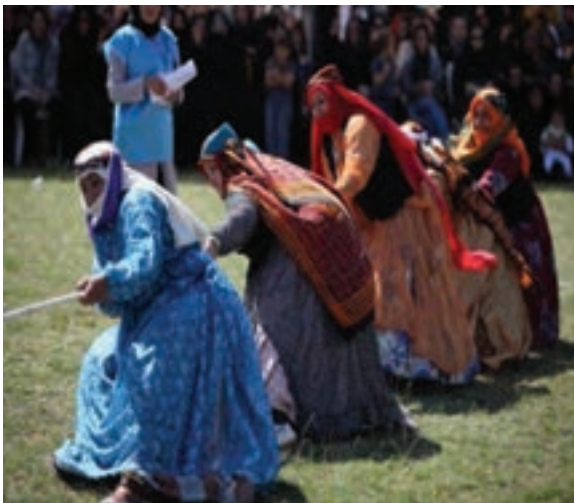
شکل ۳-۴. بازی محلی طناب کشی

از جمله بازی های محلی استان ما می توان به : قیش قاپدی (ربایش کمر بند) بش داش، چیلنگ آغاج، گیردکان، ال اوسته کیمین الی، آی ننه قوردی قوردی، گیزلین پاچ، گیرجنه، شاه وزیر، طناب کشی و ده ها بازی دیگر اشاره نمود.