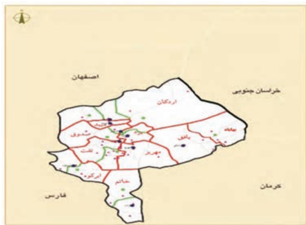
شکل ۴-۲- نقشه پراکندگی شهرها و روستاهای استان

هنری دارای شهرت جهانی بوده و هنوز هم به طور نسبی از کیفیت خوبی برخوردار است. شهر یزد دارای صنایع مدرن و پیشرفته، بیمارستان‌های مجهز و متعدد و نیروی انسانی متعهد و متخصص، دارای سرمایه‌های مادی و معنوی است که ضمن حفظ سنت گذشته این شهر را آباد و توانمند در مسیر توسعه، حفظ می‌کند.