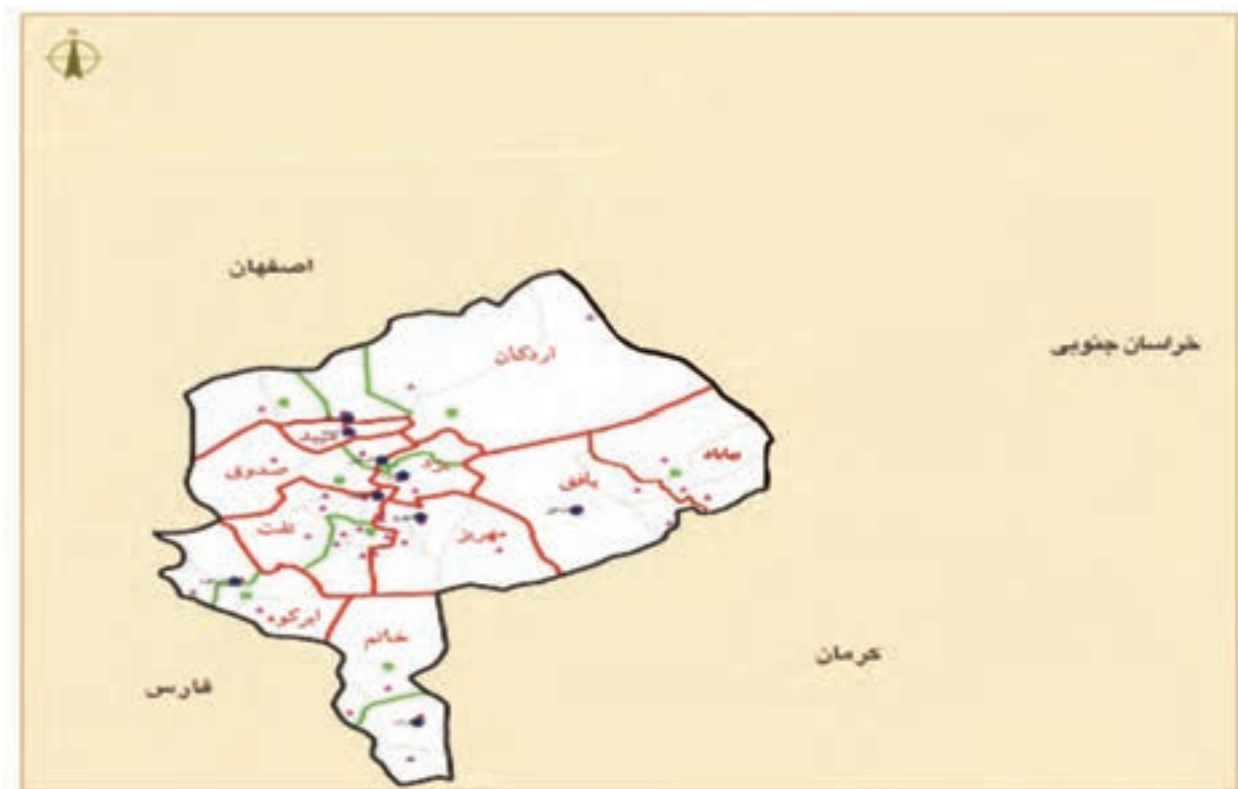
شکل ۱-۲- نقشه تقسیمات سیاسی استان

در اولین دوره قانون گذاری در سال ۱۲۸۵ هجری شمسی پس از نهضت مشروطیت قانون تشکیل ایالات و ولایات به تصویب رسید. در این دوره ایران به چهار ایالت و ۱۲ ولایت تقسیم شد که یزد یکی از ولایات بوده است. در تقسیمات کشوری سال ۱۳۱۶ هجری شمسی ایران به ۱۰ استان تقسیم شد که اصفهان و یزد شامل استان دهم بودند. در سال ۱۳۴۸ یزد به فرمانداری کل و در سال ۱۳۵۲ به استان تبدیل شد. با توجه به شکل ۱-۲ استان یزد در حال حاضر دارای ۱۰ شهرستان، ۲۰ شهر، ۱۸ بخش و ۴۵ دهستان می باشد.