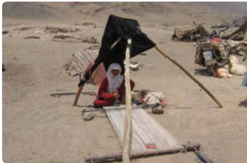
شکل ۶-۲- زندگی عشایری در استان

ج) زندگی کوچ نشینی : در استان یزد زندگی کوچ نشینی محدودی در مناطقی از جنوب استان مانند شهرستان خاتم دیده می‌شود. کوچ نشین‌های شهرستان خاتم از استان فارس در بعضی از فصول سال، به این منطقه کوچ می‌کنند.