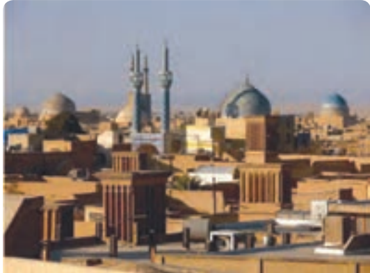
شکل ۳-۲- زندگی شهری

شیوه زندگی مردم هر منطقه تا حدودی تابع شرایط آب و هوایی است و اثر آن را در شهرسازی و معماری می‌توان یافت. قدمت تمدن و آبادی نشینی در این سرزمین از هزاره سوم پیش از میلاد فراتر می‌رود. در کشور ما ایران مردم به سه شیوه شهری - روستایی و کوچ‌نشینی زندگی می‌کنند. در این درس با شیوه‌های زندگی در استان یزد آشنا می‌شوید. الف) زندگی شهری: استقرار جمعیت در استان یزد با توجه به موقعیت ویژه جغرافیایی آن، مبارزه مستمر با بیابان، دشواری‌های طبیعی و همچنین تلاش بی‌امان برای دستیابی به آب بوده است و به همین دلیل این استان ضریب شهرنشینی بالاتری نسبت به کل کشور دارد. جمعیت استان یزد بر اساس سرشماری عمومی نفوس و مسکن در سال‌های ۱۳۷۵ و ۱۳۸۵ در جدول ۲-۲ آمده است.