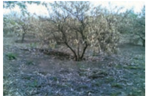
شکل ۶۹-۱- آثار سرمازدگی در باغات استان