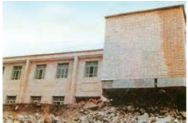
شکل ۱-۵۹- ساختمان دبستان روستای ناوه پس از زلزله