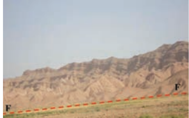
شکل ۶۲-۱- گسل امین آباد از گسل‌های فعال استان

سیل: بعد از زلزله، سیل مخرب‌ترین خطر طبیعی استان به حساب می‌آید. خراسان شمالی از نظر وقوع سیلاب در بین استان‌های کشور جایگاه دوم را دارد.