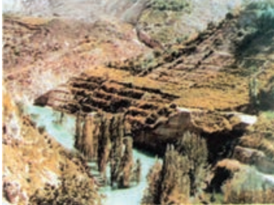
شکل ۶۸-۱- زمین لغزش در روستای اسطرخی شیروان