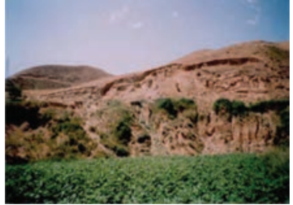
شکل ۶۷-۱- لغزش چرخشی در روستای اترآباد علیای بجنورد

سرمازدگی: به علت قرارگیری استان در مسیر اصلی ورود توده هوای سرد و خشک سیبری، در بعضی از سال‌ها، تشدید فعالیت زبانه‌آین توده‌هوا در اوایل پاییز (سرمازدگی زودرس) و اوایل بهار (سرمازدگی دیررس)، سبب سرمازدگی ناگهانی محصولات باغی و زراعی شده و خسارات زیادی را به کشاورزان استان وارد می‌کند.