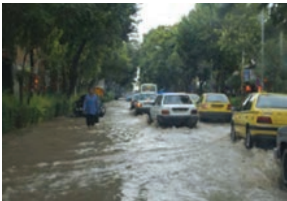
شکل ۶۵-۱- آب‌گرفتگی خیابان‌های شهر بجنورد در سیلاب سال ۱۳۸۷

علل وقوع سیلاب در استان منشأ طبیعی و انسانی دارد. از مهم‌ترین دلایل طبیعی آن می‌توان به ذوب ناگهانی برف و یخ در کوهستان‌ها، بارش‌های رگباری، کم شدن پوشش گیاهی و شیب زمین و از مهم‌ترین عوامل انسانی می‌توان به عدم اعمال مدیریت صحیح در حوضه‌های آبخیز، برداشت غیر اصولی مصالح رودخانه‌ای، تجاوز به حریم رودخانه‌ها، توسعه شهرها و روستاها در عرصه‌های سیل‌گیر اشاره نمود.