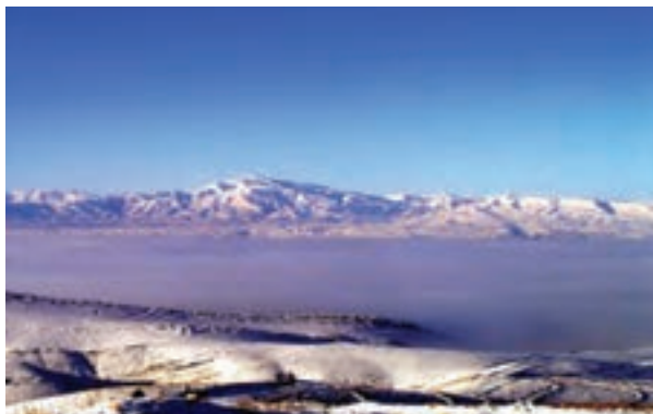
شکل ۷۱-۱ پدیده وارونگی دما در دشت بجنورد

جغرافیایی و محصور شدن برخی از شهرهای استان در میان کوه‌ها و پدیده وارونگی دما، باعث آلودگی هوای استان شده‌اند. در حال حاضر بیش از ۳۰۰ واحد صنعتی در استان مشغول فعالیت هستند. فعالیت این واحدها و شرایط طبیعی برخی از شهرهای استان سبب شده است این شهرها با مشکل آلودگی هوا مواجه شوند.