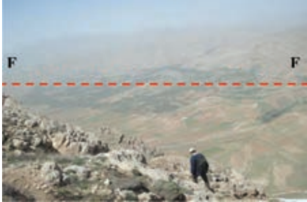
شکل ۶۳-۱- گسل سالوک از گسل‌های فعال استان

آخرین فعالیت گسل‌های استان مربوط به گسل امین آباد، در شمال غرب شهر اسفراین است که منجر به زمین لرزه‌ای با قدرت ۴/۵ درجه در مقیاس ریشتر شد. این زمین لرزه در نیمه شب جمعه ۱۸ آذرماه ۱۳۹۰ بر اثر فعال شدن قسمت شمال غربی این گسل رخ داد. این زلزله خسارات مالی و جانی نداشت ولی سبب ترس و وحشت مردم شد.