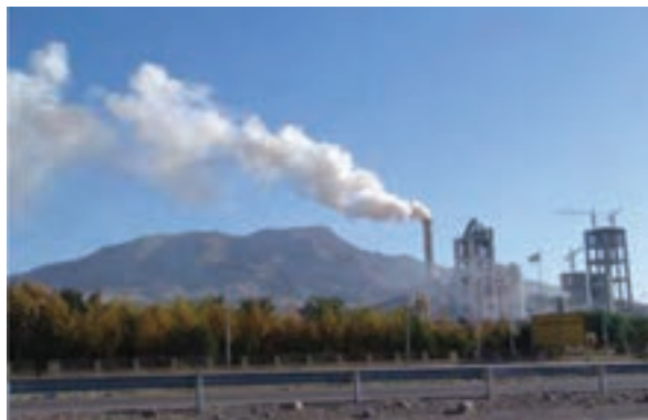
شکل ۷۰-۱ صنایع استان یکی از منابع آلودگی هوا

مسئولیت نظارت بر آلودگی هوا در استان بر عهده سازمان محیط زیست است. این سازمان جهت کاهش آلودگی هوا اقداماتی انجام داده است که از مهم‌ترین آنها می‌توان به موارد زیر اشاره نمود: