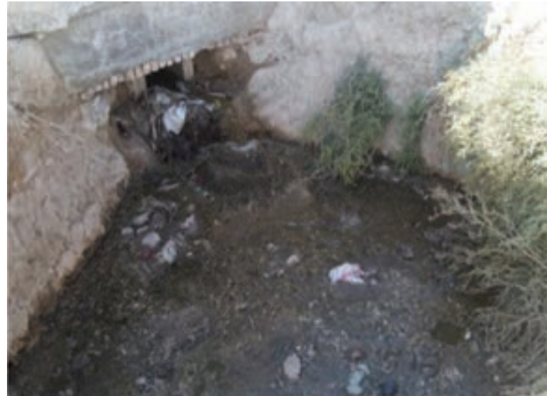
شکل ۳۹-۱- آلودگی آب رودها