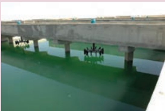
ب- تصفیه‌خانه لجن فعال در اراک

فرایند تصفیه لجن فعال: در این روش فاضلاب‌ها با استفاده از هوادهی و برگشت لجن به وسیله دستگاه‌های الکترومکانیکال تصفیه می‌شوند. زمان تصفیه فاضلاب در روش لجن فعال بین ۲ تا ۶ ساعت می‌باشد. این روش تصفیه در تمام شرایط آب و هوایی امکان‌پذیر است. فضای مورد نیاز برای ساخت تصفیه‌خانه لجن فعال کم است.