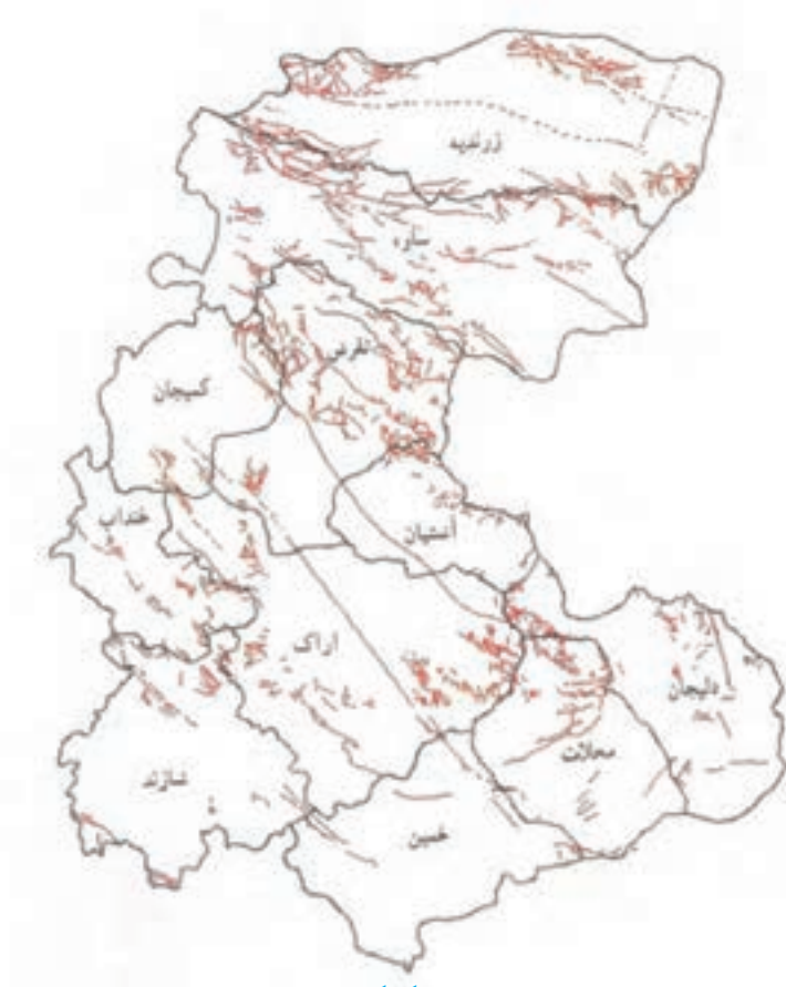
شکل ۳۴-۱- نقشه پراکندگی گسل‌های استان مرکزی