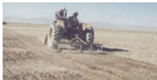
شکل ۲۹-۱- بذرکاری برای احیای مناطق بیابانی و کویری