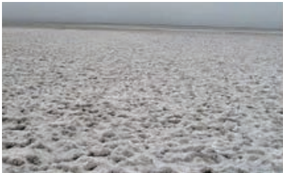
شکل ۳۳-۱- کویر میقان اراک