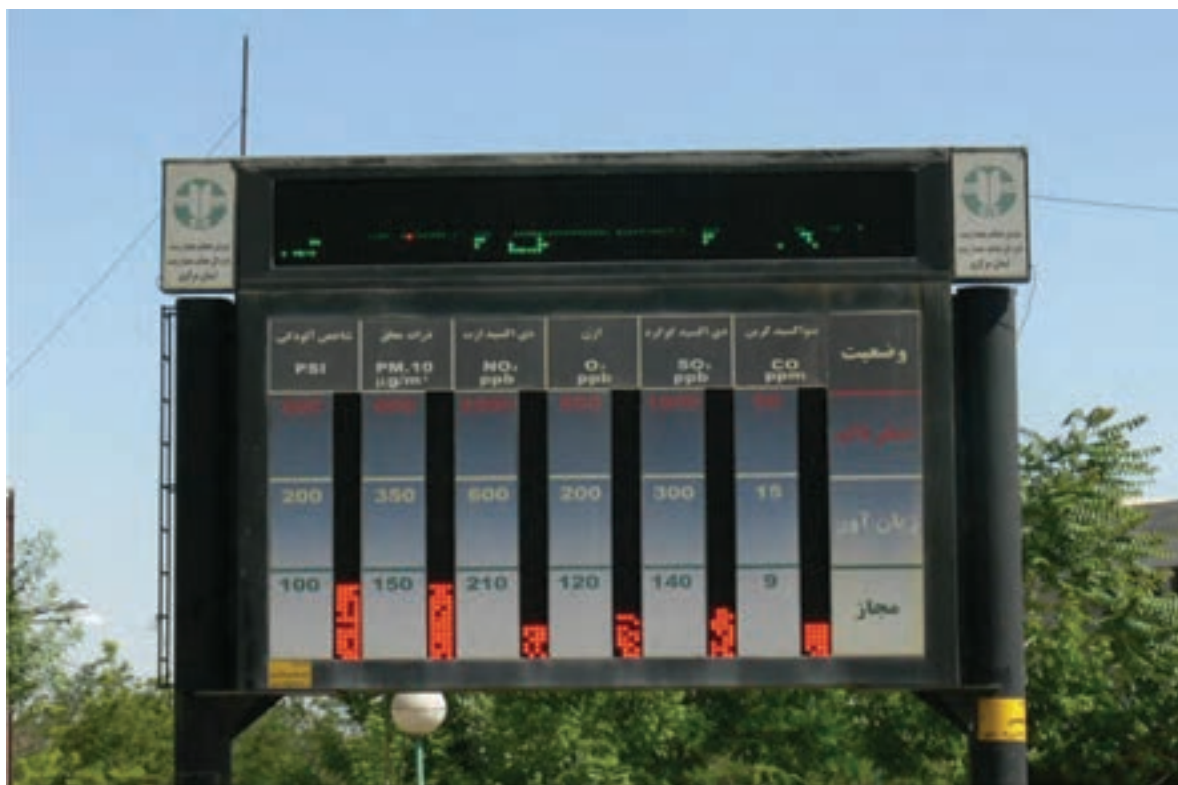
شکل ۳۸-۱- دستگاه نمایش دهنده آلودگی هوا در یکی از میدانی شهر اراک