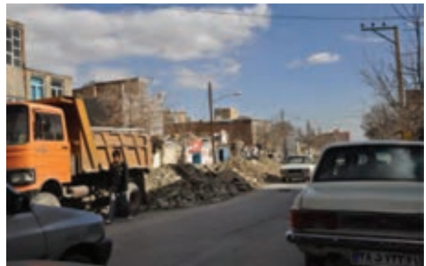
شکل ۴۱-۱- آلودگی بصری (یکی از محلات شهر اراک)