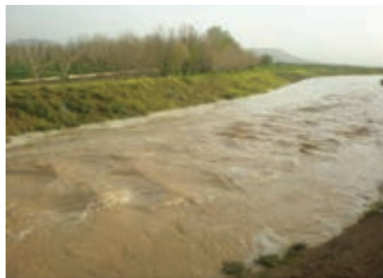
شکل ۳۵-۱- سیلاب در روستاهای اطراف اراک