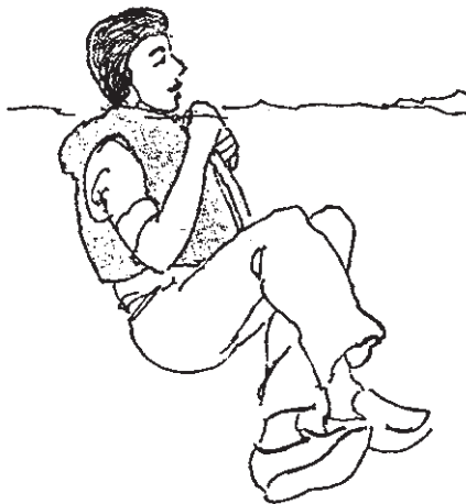
شکل ۲-۹- حالت بدن در موقع انتظار برای رسیدن کمک

۵-۱- خوردن قبل از شنا کردن: این پند قدیمی را همه شنیده اید که می گویند: بلافاصله بعد از خوردن غذا شنا نکنید. حداقل باید یک ساعت پس از خوردن غذا شنا کرد زیرا عدم رعایت این نکته ممکن است موجب گرفتگی عضلانی و نهایتاً غرق شدن گردد. پند یا نصیحت گفته شده به نظر معقول