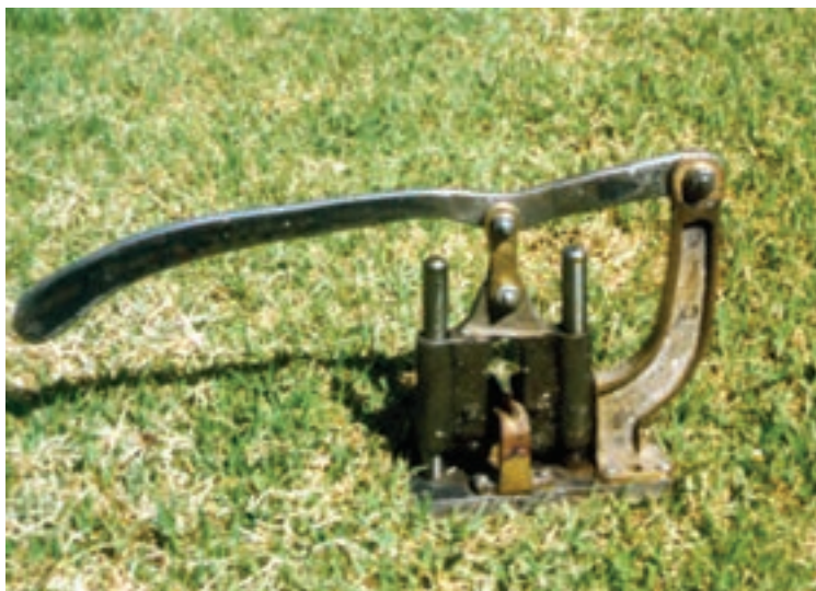
شکل ۱-۷- یک نوع دستگاه پیوندزنی