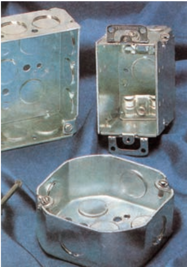
شکل ۹-۶- چند نوع جعبه تقسیم چهارگوش فلزی مخصوص لوله‌های فولادی