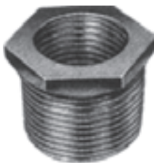
شکل ۴-۶ تبدیل

زانو: گاهی اوقات خم کردن لوله توسط لوله‌خم‌کن با توجه به موقعیت کار امکان‌پذیر نیست. بدین لحاظ از خم‌های آماده استفاده می‌شود و در نتیجه سرعت کار نیز بیش‌تر می‌شود. شکل ۵-۶ یک نمونه خم آماده را نشان می‌دهد.