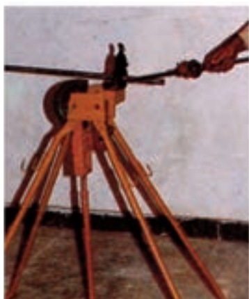
تمیز کردن نهایی کار