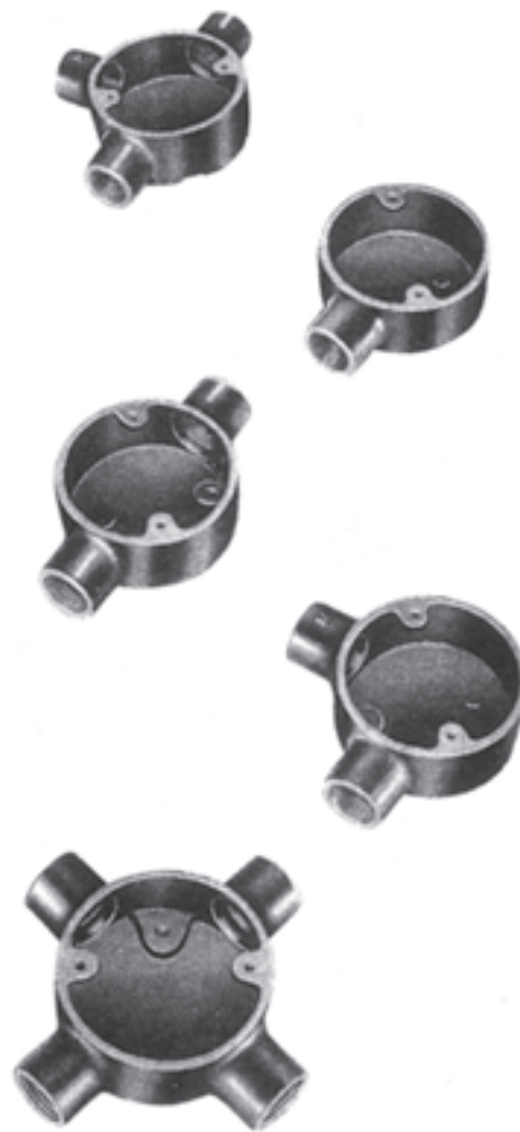
شکل ۷-۶- انواع جعبه تقسیم‌های گرد لوله‌های فولادی

ابتدا محل مورد نظر را روی لوله، با مداد یا کمان اره،