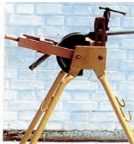
شکل ۱۲-۶ - مراحل مختلف خم کردن لوله فولادی

کمان‌اره علامت‌گذاری کرده و آن را به دو قسمت ۱ و ۱ تقسیم کنیم (شکل ۱۳-۶) و لوله را طوری درون خم‌کن قرار دهیم تا