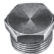
شکل ۸-۶- درپوش

جعبه تقسیم‌های چهارگوش: چون جعبه تقسیم‌های گرد حداکثر چهار راهه هستند، لذا در مسیری که تعداد لوله‌ها بیش‌تر باشد، از جعبه تقسیم چهارگوش استفاده می‌شود. سوراخ‌های این جعبه‌ها دارای رزوه نبوده و برای اتصال لوله به آن‌ها باید از بوشن و بوش برنجی استفاده کرد. شکل ۹-۶ چند نمونه جعبه تقسیم چهارگوش را نشان می‌دهد.