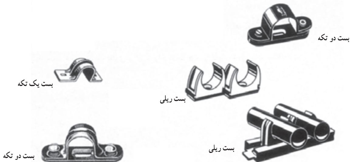
شکل ۱۴-۶- چند نمونه بست

می‌شوند. برای جلوگیری از جمع شدن آشغال در کناره‌ی دیوار و بالای لوله، بهتر است در لوله‌کشی فولادی از بست‌های دو تکه فلزی استفاده گردد. در شکل ۱۴-۶ چند نمونه بست نشان داده شده است.