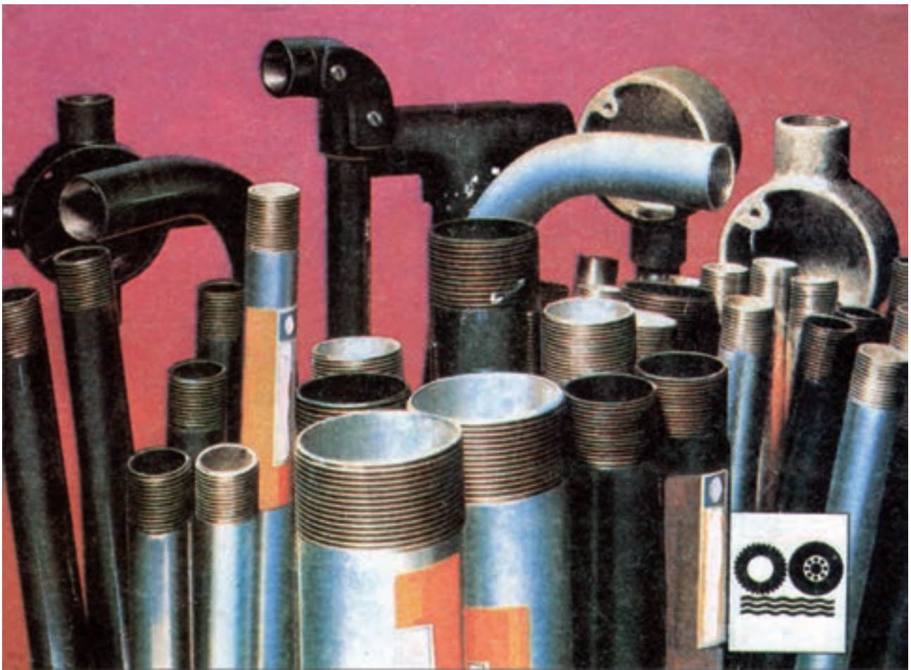
شکل ۱-۶- انواع لوله‌های فولادی سیاه و گالوانیزه