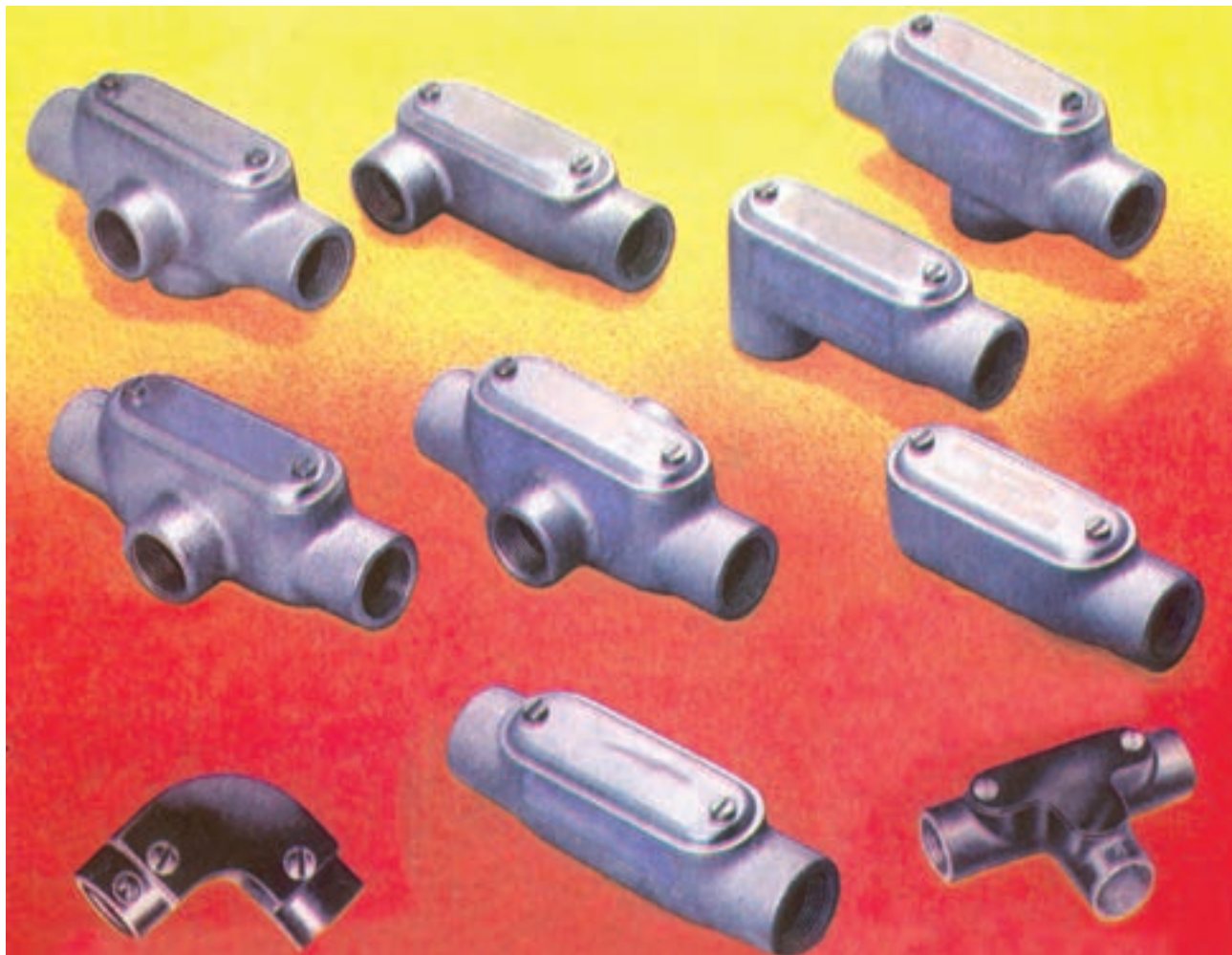
شکل ۶-۶ انواع اتصالات

وصاله های دردار: در مسیرهایی که طول لوله کاری زیاد بوده و یا بیش از دو خم در مسیر باشد (بیش تر از دو خم در یک