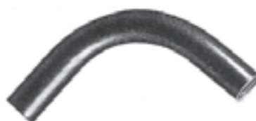
شکل ۶-۵ خم ۹۰ درجه ای آماده

مسیر عبور فنر را مشکل و یا غیر ممکن می کند) و یا گرفتن انشعاب لوله، از دو راهی، سه راهی و زانویی دردار استفاده می شود. باید توجه داشت که در این اتصالات به دلیل کمی حجم محفظه، عمل انشعاب گرفتن از سیم ها مجاز نبوده و فقط از آن ها به عنوان هدایت بهتر فنر و سهولت کار سیم کشی استفاده می شود. شکل ۶-۶ نمونه هایی از این اتصالات را نشان می دهد.