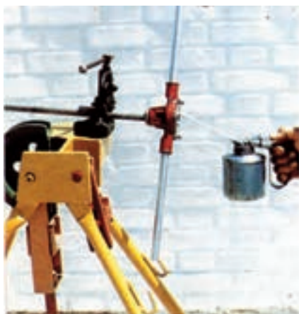
روغن زدن حین حدیده کاری