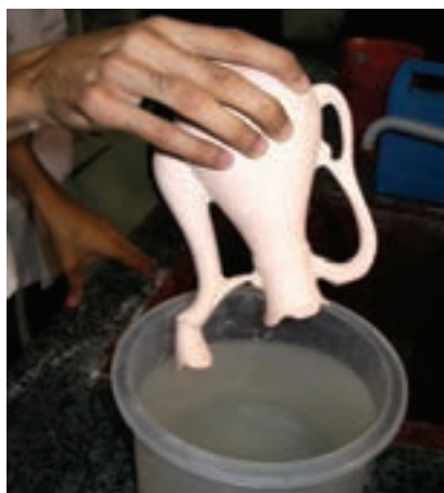
شکل ۶- ۲۶

تمامی قطعات را در صورتی که هوای فشرده در اختیار دارید کاملاً بادگیری کنید، و اگر چنین امکاناتی در اختیار ندارید با ابر خشک کلیه‌ی گرد و خاک‌های ناشی از ماندن طولانی در کارگاه یا ناشی از پرداخت کردن را تمیز کنید و بعد با کمک ابر نم‌دار تمامی سطوحی را، که نیاز به لعاب دارند، نم‌دار کنید (شکل ۵-۲۶).