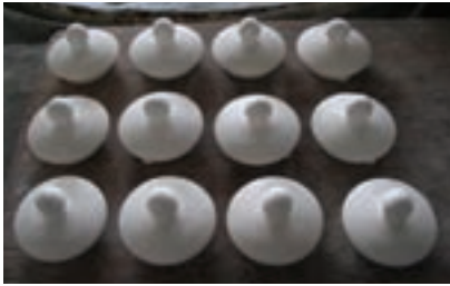
شکل ۳- ۲۶

- در مورد پخت در کوره نکات مربوط به خطر برق‌گرفتگی را رعایت کنید.