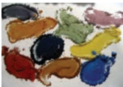
شکل ۲- ۲۶