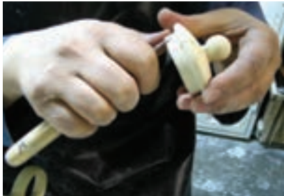
شکل ۴- ۲۶

را که تا این جلسه تولید کرده‌اید و در جلسات قبلی پخت بیسکویت شده‌اند، آماده کنید (شکل ۳-۲۶).