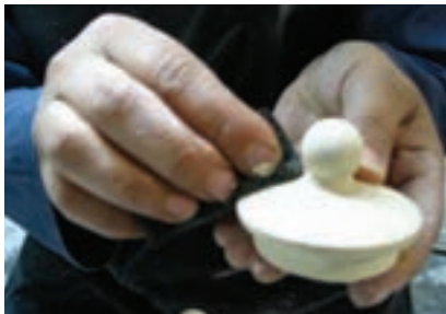
شکل ۵- ۲۶

کلیه‌ی قطعات را به کمک ابزارهای تراش و پرداخت کاملاً سمباده‌کاری کنید و برای آخرین بار کلیه‌ی ناصافی‌ها و زوائد اضافی را کاملاً پرداخت کنید (شکل ۴-۲۶).