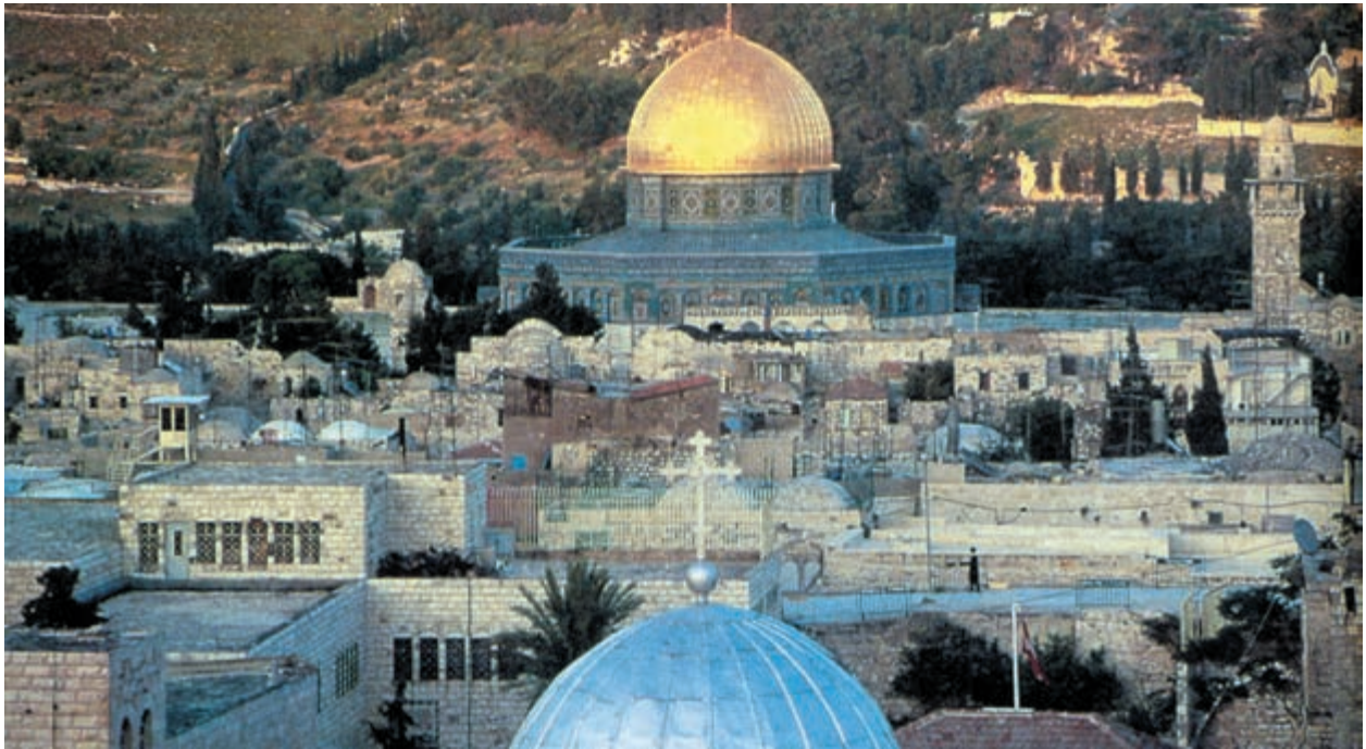
با فرمان پاپ اوربان دوم صلیبی‌ها برای تصرف بیت المقدس به حرکت درآمدند.

تصرف بیت المقدس و به دست آوردن اراضی فراوان موجب تشویق عده زیادی در حرکت به سوی شرق شده بود، ولی این بار فتودال‌ها نیز با شوالیه‌ها همراه شدند. بدین ترتیب جنگ دوم صلیبی آغاز شد؛ اما در این جنگ موفقیتی نصیب صلیبی‌ها نشد؛ زیرا از یکسو مسلمانان آماده شده بودند و از سوی دیگر فاتحان جنگ اول صلیبی از آمدن مهاجران جدید رضایتی نداشتند.