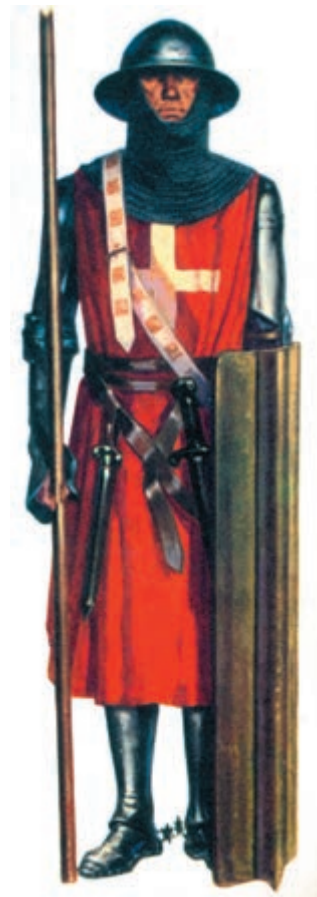
یک جنگجوی صلیبی