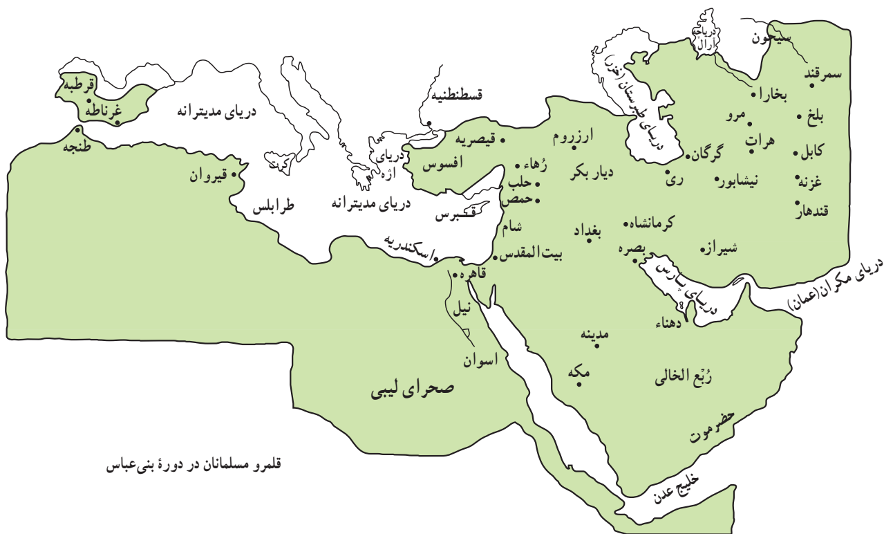
قلمرو مسلمانان در دوره بنی عباس

منصور در سال ۱۴۵ق پایتخت عباسی را از هاشمیه که به کوفه، مرکز هواداران تشیع نزدیک بود، به بغداد انتقال داد. او به یاری خاندان ایرانی برمکی دستگاه