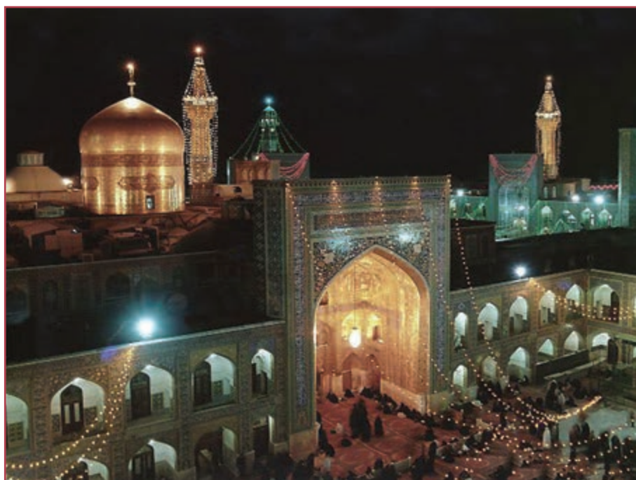
حرم حضرت امام رضا علیه السلام

۲- کسب مقبولیت برای خلافت عباسی به ویژه نزد علویان و سادات، از طریق مشارکت دادن امام در امور حکومتی و ممانعت از شکل‌گیری جنبش‌های آنان ۳- جلب پشتیبانی بیشتر ایرانیان؛ زیرا مردم ایران گرایش و ارادت خاصی به خاندان پیامبر صلی الله علیه و آله و اهل بیت علیهم السلام داشتند.