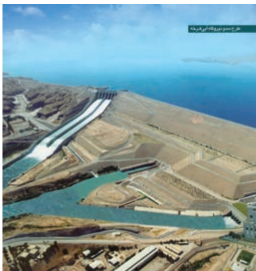
سد و نیروگاه آبی کرخه

به تولید کالاها و خدمات نمی‌انجامد اما باعث تقویت بنیه اقتصادی کشور می‌شود و برای به ثمر رسیدن سایر فعالیت‌های اقتصادی بسیار ضروری است. می‌دانیم که اگر آب نباشد، کشاورزی امکان‌پذیر نیست و بدون برق، صنعت معنایی ندارد. هم‌چنین جاده و خطوط آهن مناسب لازم است تا کالاهای تولید شده به سرعت به دست مصرف‌کنندگان برسد؛ بنابراین، هزینه‌های سرمایه‌گذاری زیربنایی که صرف ساخت و احداث جاده‌ها، خطوط راه آهن، شبکه‌های بزرگ آب‌رسانی، سدسازی، ساخت نیروگاه‌ها و کارهایی از این قبیل می‌شود، لازمه تحقق و بهره‌برداری مطلوب از فعالیت‌های اقتصادی است.