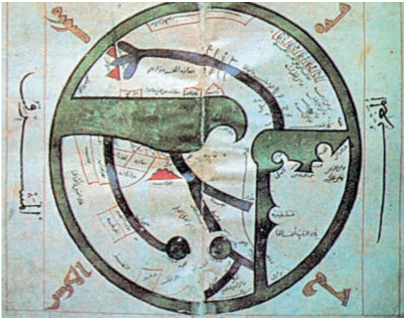
آسیای غربی و مدیترانه‌ی شرقی مطابق نقشه‌ی «ابن حوقل»