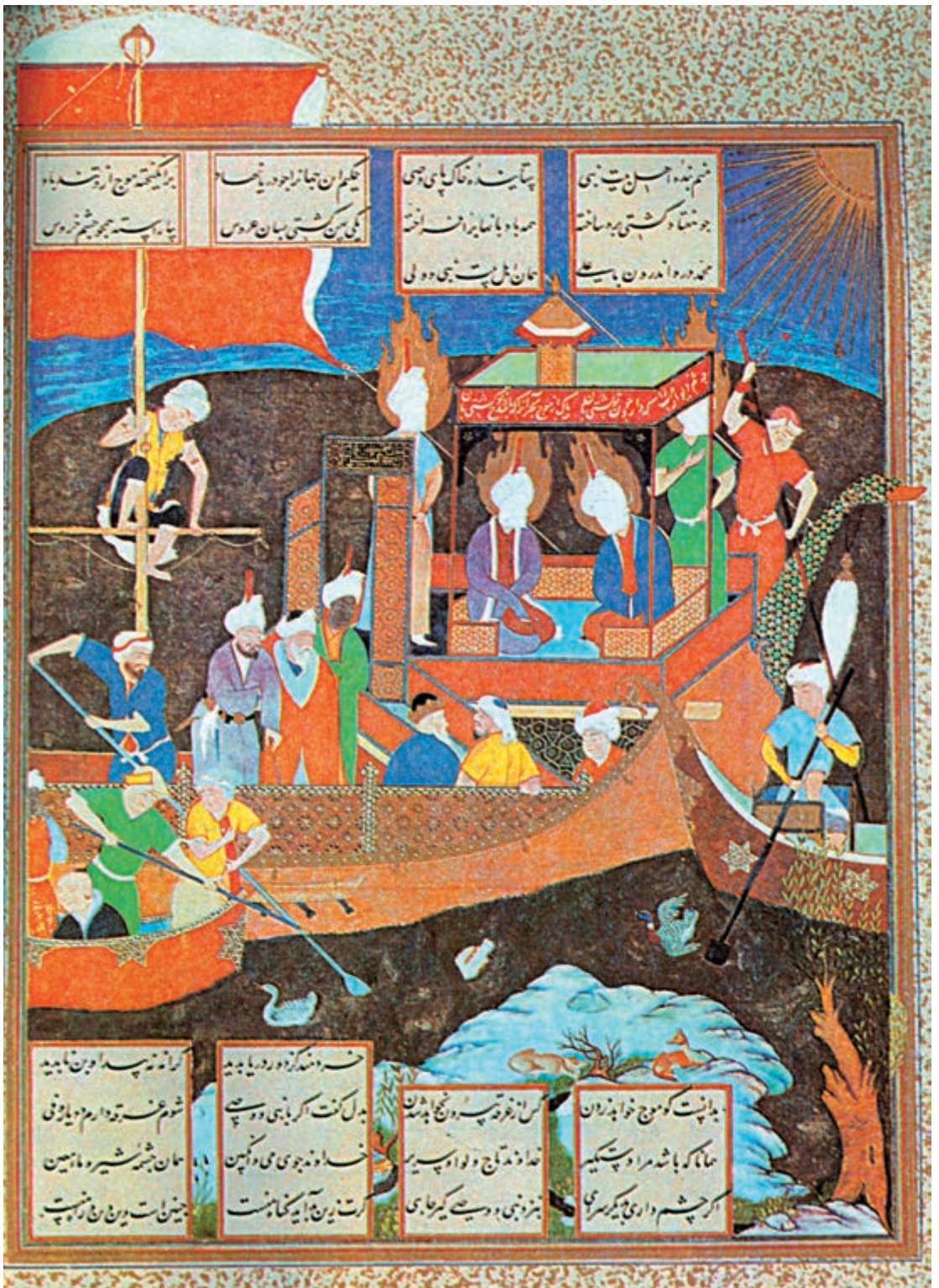
مینیا توری از شاهنامه‌ی تهماسبی (آغاز شاهنامه) کار میرزا علی پسر سلطان محمد، معاصر شاه تهماسب