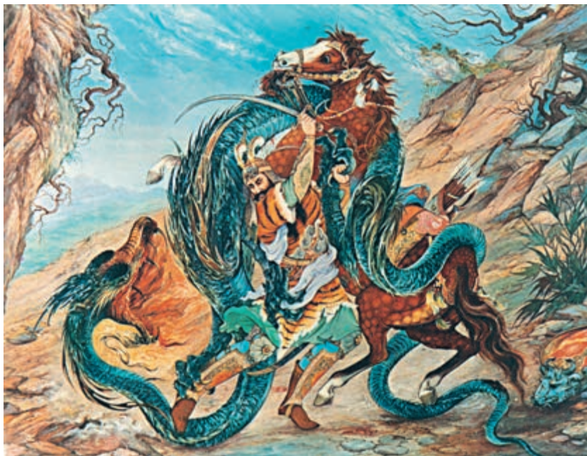
نبرد رستم با اژدها، خان سوم (کاری از استاد فرشچیان)

سامانیان مربوط می‌شد، بیش‌تر نویسندگان فارسی زبان به نوشتن به زبان فارسی تشویق می‌شدند؛ بنابراین، نثر هم در عصر سامانیان مانند نظم رو به ترقی گذاشت و به علت غلبه‌ی روح ایران دوستی و احساس نیاز به هویتی مستقل – به‌ویژه در خراسان آن روز – داستان‌ها و روایات زیادی مربوط به تاریخ گذشته‌ی ایران فراهم شد و سرانجام، در سال ۳۴۶ ه.ق. به امر ابومنصور محمد بن عبدالرزاق حاکم توس، به‌صورت مجموعه‌ای مستقل به زبان فارسی درآمد و به‌نام شاهنامه، به‌عنوان نخستین اثر مستقل نثر فارسی در اختیار همگان قرار گرفت. همین شاهنامه‌ی منشور بود که چند سال بعد، دقیقی توسی به امر منصور بن نوح سامانی نظم آن را بر عهده گرفت و بعد از کشته شدن او، فردوسی، شاعر بزرگ و همشهری وی با کوششی شگفت‌انگیز طی حدود سی سال، کار نظم شاهنامه را به پایان برد.