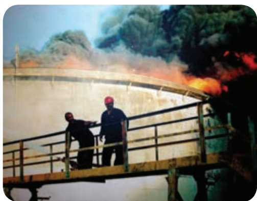
احتراق ناشی از مواد نفتی را در یک مخزن ذخیره سوخت

مایعات قابل اشتعال نظیر: نفت، گازوئیل، بنزین، الکل و روغن دسته دوم مواد قابل اشتعال را تشکیل می‌دهند که دارای درجه سوختن متوسط و تند می‌باشند. شکل (۶-۶) احتراق ناشی از مواد نفتی را در یک مخزن ذخیره سوخت نشان می‌دهد.