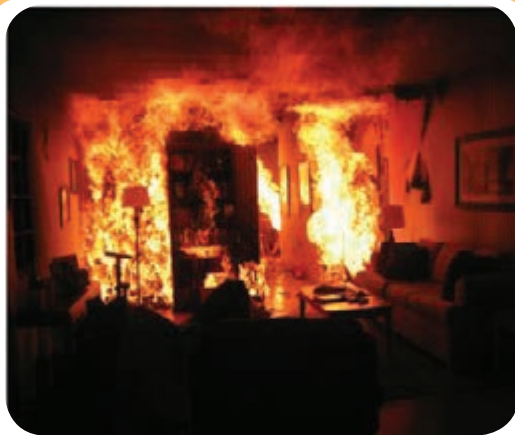
احتراق ناشی از مواد جامد قابل سوختن