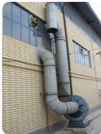
نمونه‌ای از سیستم تهویه موضعی در اتاق‌های مخصوص جوشکاری

به هر صورت با توجه به شرایط خاص جوشکاری بهتر است سیستم تهویه مصنوعی به نحوی طراحی و ساخته شود تا دودهایی را که از محل جوشکاری متصاعد می‌شوند، مطابق شکل (۳-۶) مکش کرده و از رسیدن آن به سروصورت جوشکار جلوگیری گردد.