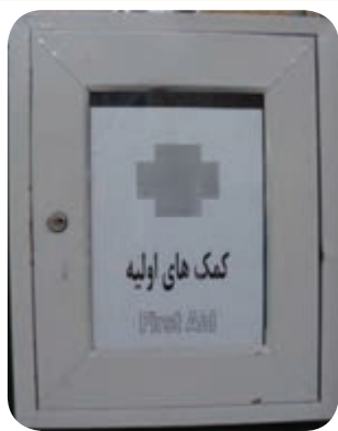
نمونه‌ای از جعبه کمک‌های اولیه

جعبه کمک‌های اولیه، جعبه یا کیفی است که حاوی ابزار، مواد و تجهیزاتی است که در صورت لزوم می‌توان به وسیله آن اقدام به ارائه خدمات پزشکی (کمک‌های اولیه) تا رسیدن عوامل اورژانس و یا رسیدن فرد مصدوم به مراکز درمانی کرد.