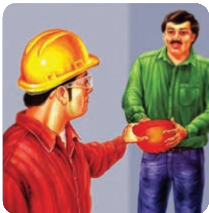
ایمنی را به هم‌دیگر یادآور شوید.

هر فرد بایستی در شناخت اصول و ضوابط ایمنی کوتاهی نکند. در همه مسائل به دانش خود اکتفا نکند و از اطلاعات افراد بهره‌مند شده و نیز روزبه‌روز دانش خود را در زمینه ایمنی افزایش دهد. تمام افراد متناسب با رده و سمت شغلی در ایجاد محیط ایمن و بهداشتی مسئول می‌باشند. در جداول (۵-۶ و ۶-۶) به بعضی از مهم‌ترین وظایف کارفرمایان و پرسنل کارفرما اشاره شده است.