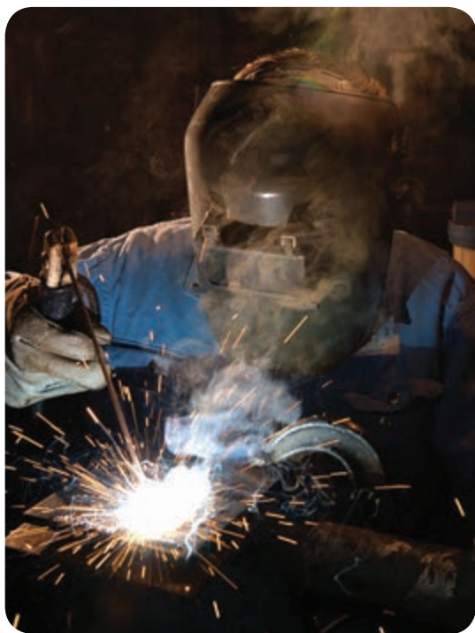
در هنگام جوشکاری دود و مواد مضر زیادی تولید می‌گردد

در حین فعالیت‌های جوشکاری و برشکاری به دلیل ایجاد دمای بالا در منطقه قوس و حوضچه مذاب مقدار زیادی دود، غبار، و گازهای سمی ناشی از سوختن اجزاء تشکیل دهنده پوشش الکتروود آن تولید می‌شود. هم‌چنین به دلیل بخار شدن مقدار کمی از مواد مذاب، بخارات فلزی تولید می‌گردد که برای سلامتی جوشکاران و افراد شاغل در کارگاه مضر می‌باشند (شکل ۶-۱).