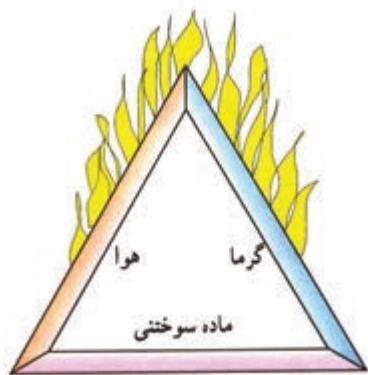
سه عامل اصلی برای ایجاد آتش