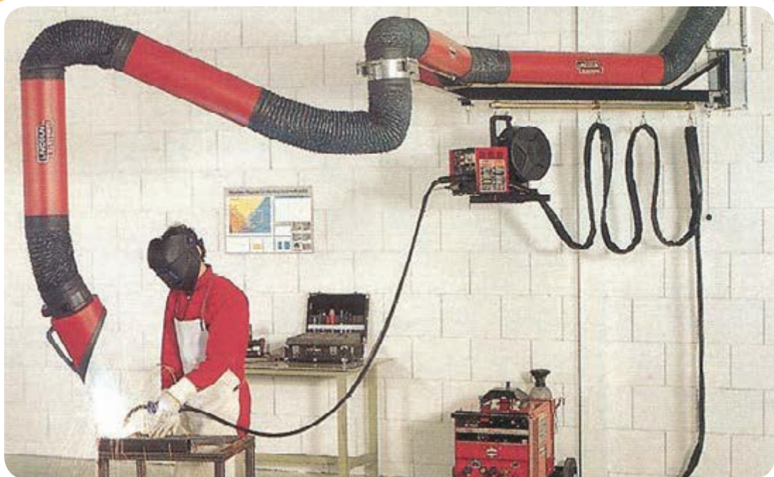
سیستم تهویه قابل انعطاف، دوده‌های متصاعد شده را مکش کرده و مانع از رسیدن آن به صورت جوشکار می‌شود.