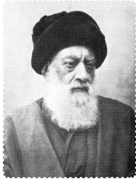
آیت الله طباطبایی

قیام شوند. در ادامه این جریان و هم‌زمان با سفر سوم مظفرالدین‌شاه به اروپا، عده‌ای از بازرگانان در حرم حضرت عبدالعظیم (ع) تحصن کردند. ۱