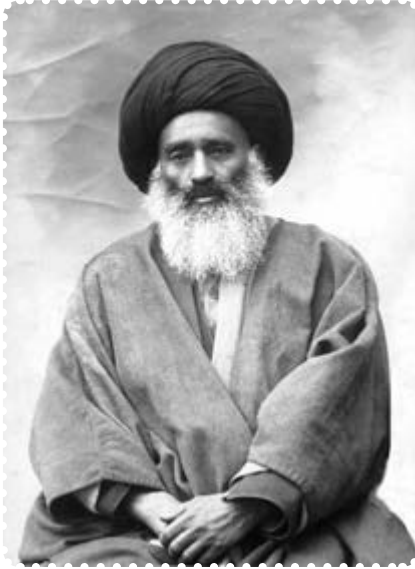
آیت الله بهبهانی