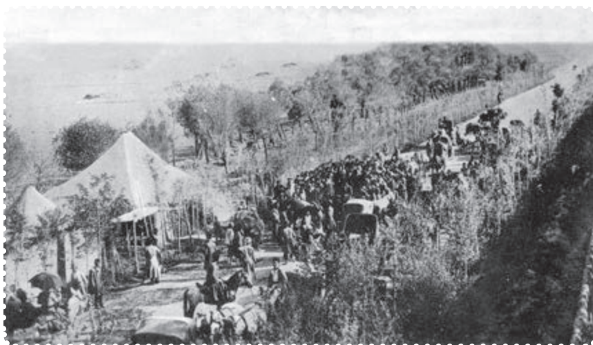
بازگشت علما از مهاجرت کبری

قانون اساسی، درگذشت. به این ترتیب، کشور استبداد زده ما، با بهره گیری از اندیشه های سیاسی عالمان بزرگ دینی، کوشش فرهیختگان جامعه و مجاهدت مردم، به حکومتی دست یافت که می بایست براساس قانون اداره می شد.