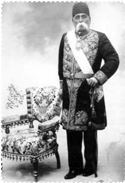
عبدالمجید میرزای عین الدوله

او از جانب شاه به امامت جمعه تهران منصوب شده بود و از وی و دربار، پشتیبانی می‌کرد.