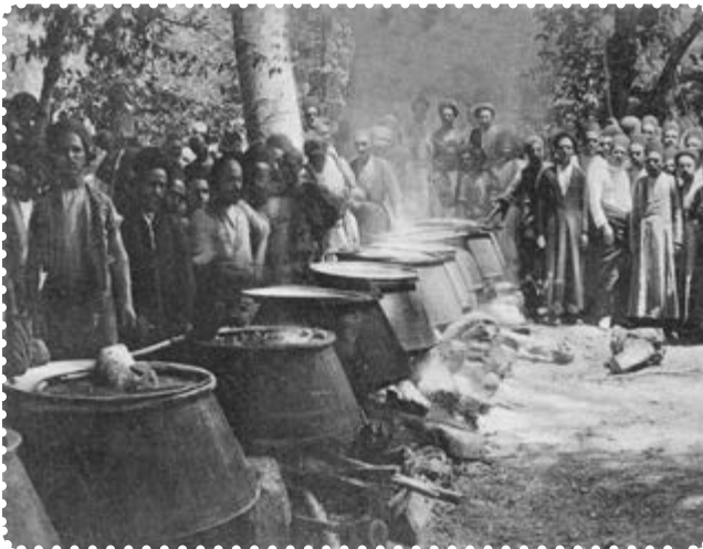
دیگ‌های غذا در سفارت انگلیس برای مشروطه‌خواهان

به موازات مهاجرت عدالت‌خواهان به قم، عده‌ای در باغ سفارت انگلیس گرد آمدند و