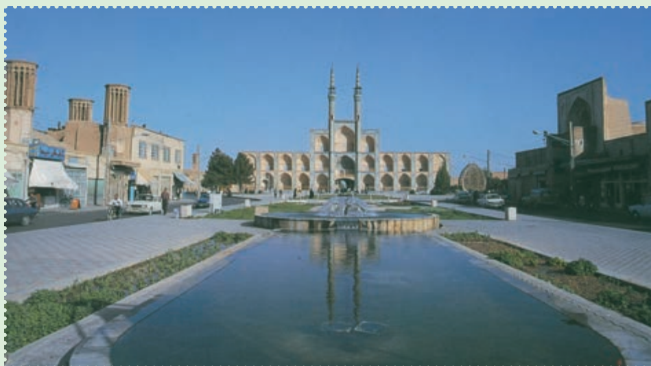
میدان تاریخی امیر چخماق در مرکز شهر یزد

پس از مرگ چنگیزخان، حدود یک قرن حکومت ایلخانان بر ایران تحمیل شد. ۱ اگرچه مغولان در عرصه نظامی گری بر ایران پیروز شدند، اما در عرصه فرهنگ و تمدن مغلوب ایران شدند. یویایی فرهنگ و تمدن ایران اسلامی، قوم مهاجم را در خود حل کرد. مغولان به تدریج دست از تندخویی کشیدند و اعتقادات خرافی خود را کنار گذاشتند. غازان خان، علاوه بر پذیرش آیین اسلام، تابعیت از خان بزرگ مغول را نیز کنار گذاشت و استقلال حکومت ایلخانی را کامل کرد. در این دوران، بزرگانی چون خواجه شمس الدین صاحب دیوان، خواجه نصیرالدین توسی، عطاملک جوینی، رشیدالدین فضل الله همدانی، مصلح الدین سعدی شیرازی و مولوی بلخی، با فعالیت های سیاسی، علمی و ادبی خود، علاوه بر مهارخوی ویرانگر مغولان، چراغ تمدن و فرهنگ ایران و اسلام را فروخته نگه داشتند. ۲ با آنکه مغولان در آغاز ویرانی های بسیاری به همراه آوردند، ولی بر اثر آشنایی با فرهنگ ایران و اسلام، از طریق آنان فرهنگ، هنر و تمدن ایران و اسلام رواج یافت. پس از پایان حکومت ایلخانان، حکومت های ملوک الطوائفی و محلی متعددی چون تیموریان، آل جلایر، آل مظفر، سربداران و آل کرت، اتابکان، قراقویونلوها و آق قویونلوها طی قرن های هشتم و نهم قمری بر ایران حکومت کردند، اما هیچ کدام نتوانستند یکپارچگی ایران را حفظ کنند. سرانجام در سال ۹۰۷ق، حکومت صفوی