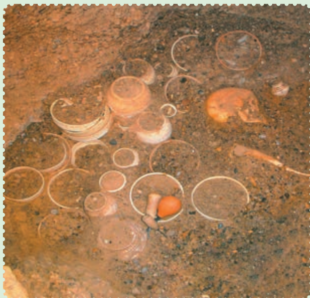
آثار یافت‌شده در شهر سوخته

نامیدند. اقوام آریایی ۱ شامل مادها، پارس‌ها و پارت‌ها بود که در غرب، جنوب و شمال شرقی فلات ایران ساکن شدند. اقوام ایرانی پس از استقرار و تثبیت موقعیت و مرزهای جغرافیایی خود، برای رفع نیازهای متقابل خویشتن با یکدیگر روابط مسالمت‌آمیزی داشتند و در هم‌گرایی عمومی به سر می‌بردند. پس از مدتی، زردشت که پیامبر ایران باستان است در میان ایرانیان ظهور کرد. او مردم را به پیروی از خدای یگانه که اهورامزدا نام داشت، دعوت کرد و مروج اندیشه، گفتار و کردار نیک بود. اعتقاد به سرای آخرت و جهان پس از مرگ، عقیده به آخرالزمان و ظهور یک منجی که حکومتی با عدل و داد و به دور از ناپاکی و ستم برپا خواهد کرد، از بنیان‌های استوار و اعتقادی ایرانیان بوده است که آن‌ها را از سایر ملل دوران باستان متمایز می‌ساخت. ۲