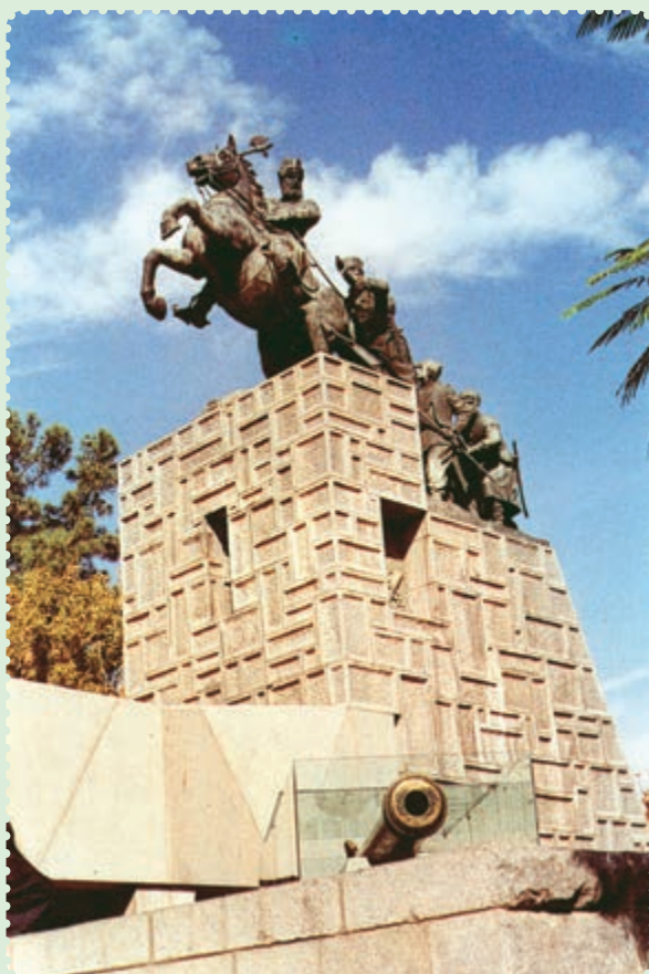
مجسمه و آرامگاه نادرشاه افشار در مشهد مقدس

توانست با شیوه حکومت داری توأم با ملاحظت، عدالت و رفاه نسبی، نام نیکی از خود بر جای بگذارد. ۱ وی تلاش کرد روابط خارجی ایران را که به دلیل هرج و مرج و نبود امنیت دچار اختلال شده بود، سامان بخشد، همچنین در برابر گسترش فعالیت‌های بازرگانی انگلستان در ایران ایستادگی کرد ۲ و از منافع نامشروع و استعماری این دولت جلوگیری به عمل آورد.