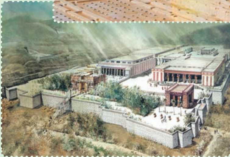
تخت جمشید و طرح خیالی آن

یافته است. ۱ برخی معتقدند، «ذوالقرنین» که در قرآن مجید ۲ به عنوان فرمانروایی نیک سیرت ستوده شده، همان کوروش پادشاه ایران است. ۳ با اینکه مؤسس دولت مقتدر هخامنشیان از سرزمین پارس