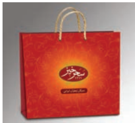
شکل ۴۹ - ۴ - طراحی ساک خرید و استفاده از تصویر در عطف ساک خرید (چند نمونه از طراحی ساک های خرید)