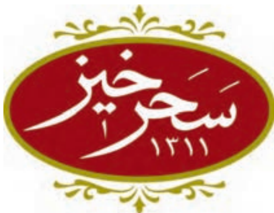
شکل ۲۵ - ۴ - کاربرد لوگوتایپ (عنوان محصول) به صورت طرح اصلی روی بسته

برای شروع این تمرین شناخت عناصری مانند رنگ و طرح و چیدمان محصول ... ضروری است. بنابراین در حین انجام کار عملی توسط هنرجویان هنرآموزان محترم می‌توانند اطلاعات زیر را در ضمن کار کارگاهی به هنرجویان خود منتقل نمایند.