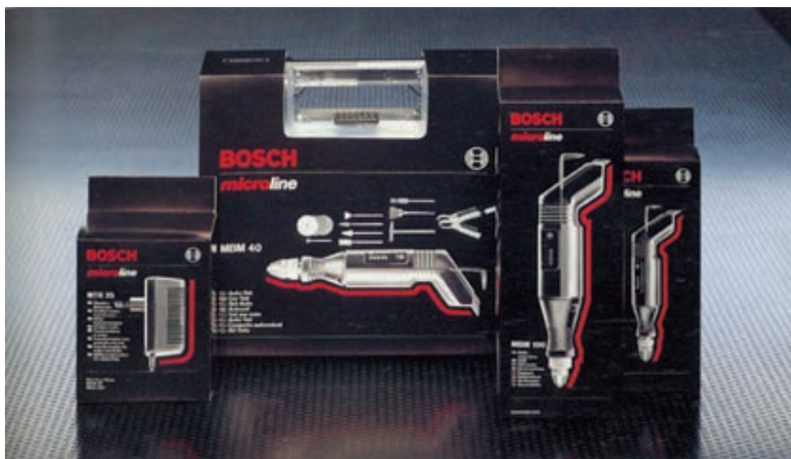
شکل ۴۱ - بسته‌بندی ابزار و لوازم صنعتی تفاوت در طراحی بسته‌بندی برای مخاطبین متفاوت