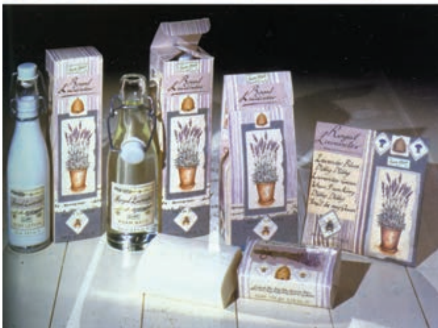
شکل ۲۹-۴- عکاسی از چیدمان محصولات و کاربردهای گوناگون (لوسیون - کرم - صابون و ...)