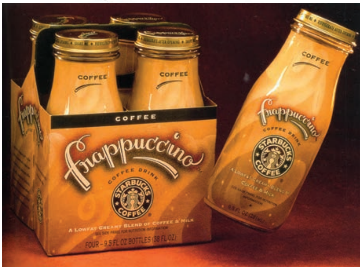
شکل ۲۶ - ۴ - به کارگیری ترکیب بندی مناسب عناصری مانند لوگو تاپ و نشانه و تلفیق آن‌ها برای رسیدن به طراحی موفق در « بسته بندی » ۲۰۹