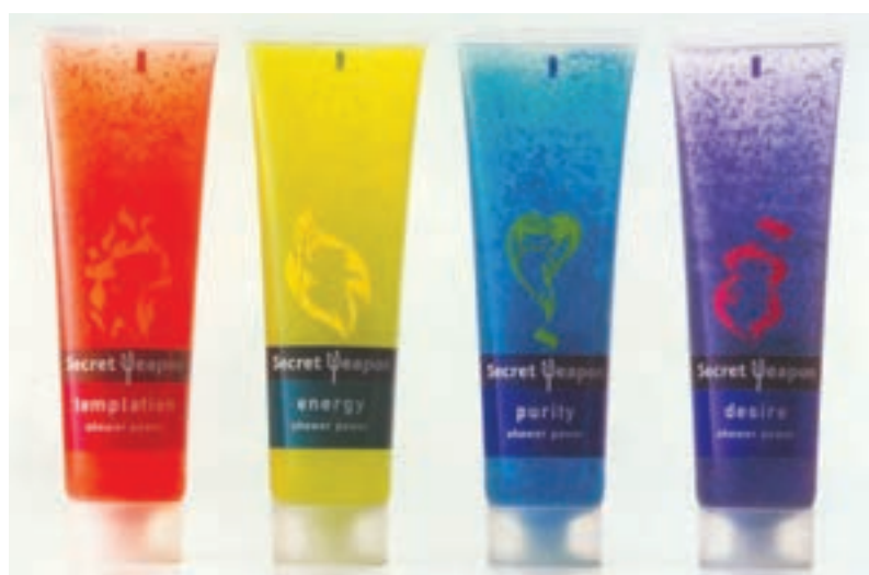
شکل ۴۶ - ۴ - تنوع رنگ در چاپ روی مواد پلاستیکی