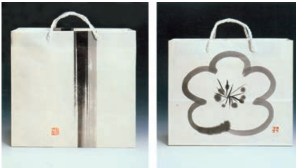
شکل ۴۸ - ۴ - طراحی ساک خرید