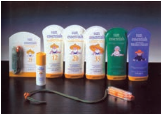
شکل ۲۸ - ۴ - تأثیرات عکاسی از چیدمان محصولات و جلوه‌های تبلیغی آن

یکی از جلوه‌های بصری در طراحی بسته‌بندی، در نظر گرفتن طراحی بسته در چیدمان انبوه و تبلیغات فروشگاهی می‌باشد که از جذابیت بصری خاصی برخوردار است. بسیاری از محصولات مانند روغن موتور اتومبیل، پاک‌کننده‌ها و شوینده‌های بهداشتی و ... به صورت تعداد زیادی که روی هم چیده شده، عرضه می‌گردند. در این صورت ممکن است هنگام طراحی روی جعبه یا طراحی لیبل (برچسب) لازم باشد که کاربرد محصول در چیدمان هنری عکاسی شود و تصویر مجموعه‌ای از این محصول با کاربردهای گوناگون در یک ترکیب‌بندی مطلوب مورد استفاده قرار گیرد. تشویق هنرجویان در کارگاه بسته‌بندی به عکس گرفتن از چند بسته‌بندی و رعایت مواردی مانند عمق میدان، نورپردازی و زاویه‌ی دید بسیار ضروری و مؤثر می‌باشد.