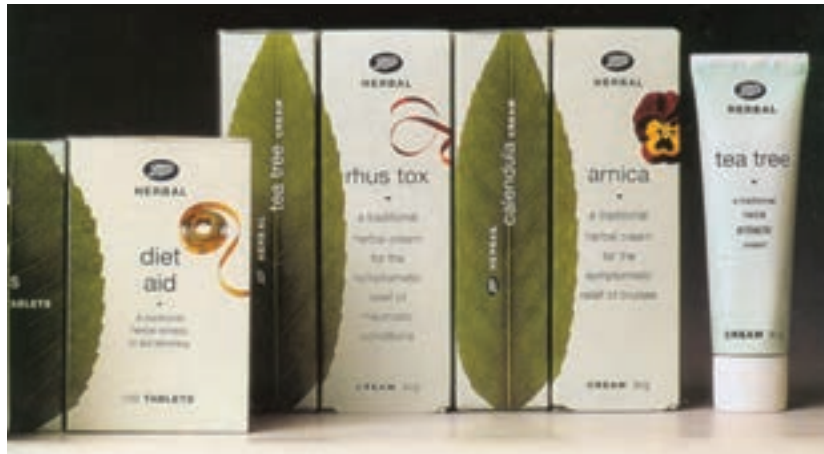
شکل ۳۲ - ۴ - به کارگیری ترندهایی خلاق و ابتکاری در طراحی جعبه به صورتی که در چیدمان انبوه جلوه‌ای جدید و نو ایجاد نمایند.