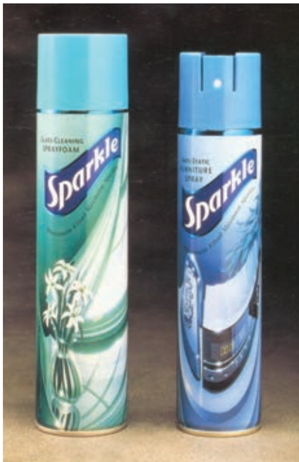
شکل ۴۴ – ۴ – چاپ روی فلز