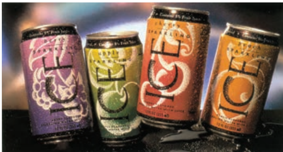
شکل ۳-۴ - عکاسی هنری از چیدمان محصول و جلوه‌های بصری بسته‌بندی آن