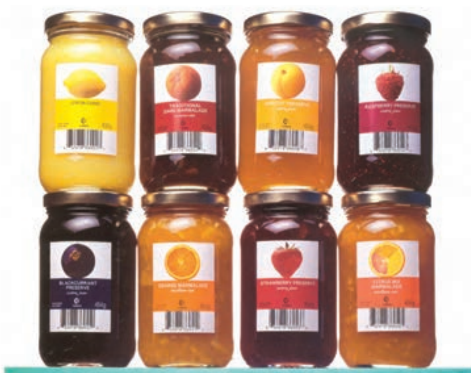
شکل ۳۱-۴ - چیدمان انبوه بسته‌ها و جلوه‌های بصری بسته‌بندی در این نوع از چیدمان (برچسب) - مارمالاد