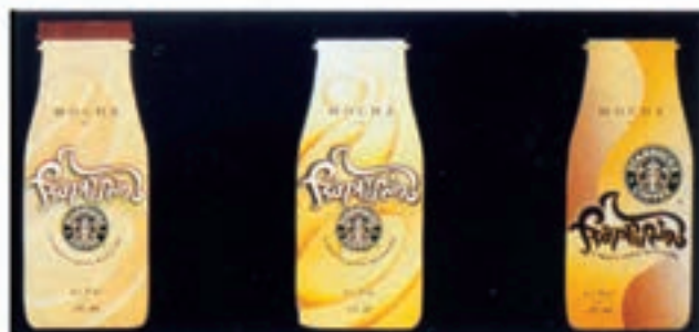
شکل ۲۴ - ۴ - بسته‌بندی مایعات با غلظت‌های متنوع و بسته‌های متفاوت