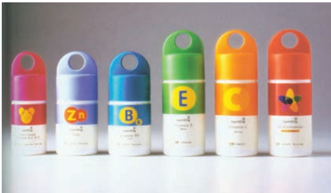
شکل ۳۸ - ۴ - به کارگیری تنوع رنگی در بسته بندی داروهایی که از طعم ها و مزه های متنوعی برخوردارند.