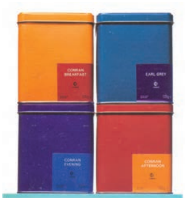
شکل ۴۳ – ۴ – طراحی بسته بندی روی قوطی فلزی برای مواد غذایی با طرحی ساده و رنگ های تخت و یکنواخت.