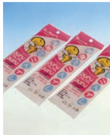
شکل ۴۰ - بسته‌بندی لوازم بهداشتی کودک