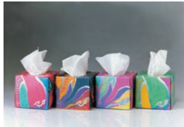
شکل ۲۷ - ۴ - عکاسی از محصول «گل‌پر» (دستمال کاغذی گل‌پر)

در طراحی بسته‌بندی، یکی از نکات مهم، رعایت سلیقه و روحیات مخاطبان است، مانند علائق مصرف‌کننده، محیط، اقلیم، سن، جنسیت و ... به‌طور مثال در طراحی بسته‌هایی که مورد مصرف کودکان است استفاده از رنگ‌های جذاب و شاد و تنوع فرم‌ها و نوع خاصی از تایپوگرافی عنوان و نام محصول مفیدتر به نظر می‌رسد، در حالی که این موارد ممکن است در مورد بسته‌بندی محصولاتی که مخاطبان عام دارد خیلی مناسب نباشد. همچنین است روحیه‌ی مصرف‌کننده و ارتباط آن با نوع کالای مصرفی، چنانچه در مورد طراحی و بسته‌بندی مواد غذایی کاربرد عناصر بصری کاملاً متفاوت است با مواد بهداشتی و آرایشی. در این زمینه مثال‌های متعددی را می‌توان ذکر نمود تا هنرجویان به کاربرد عناصر بصری با دقت و حوصله‌ی بیشتر توجه کرده و در اتودهای