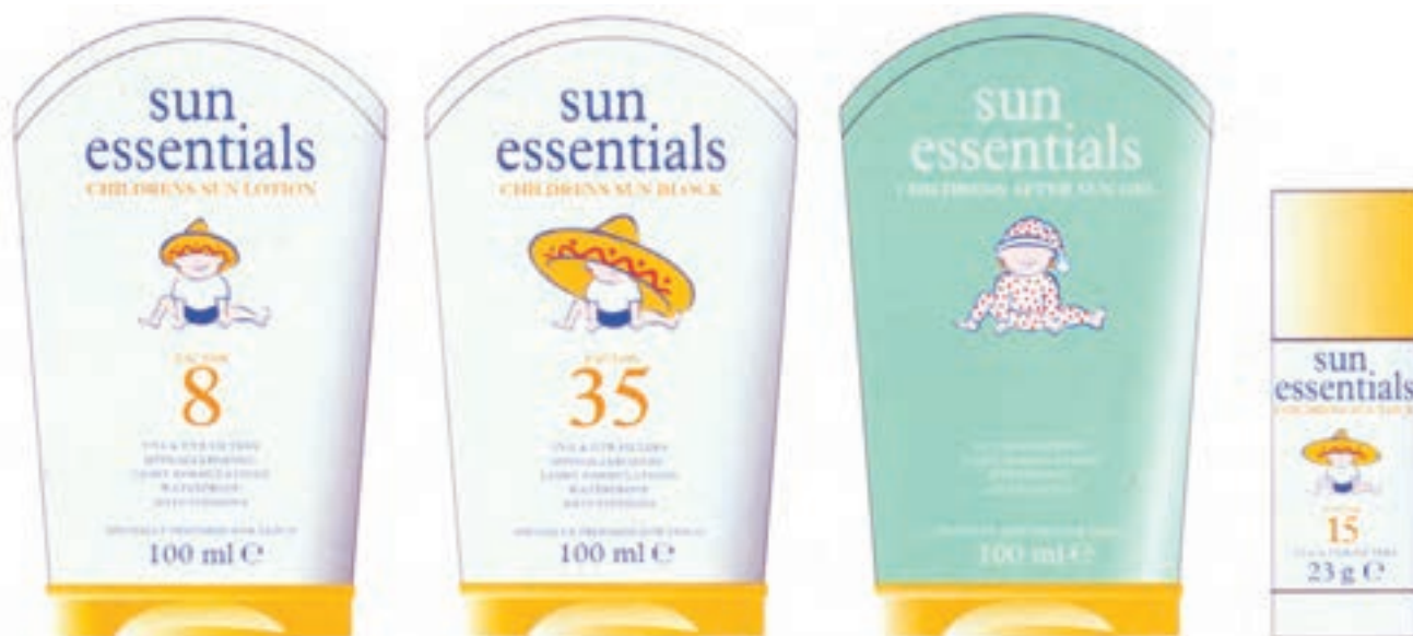
شکل ۳۹ - ۴ - طراحی برجسب کرم ضد آفتاب کودک (کاربرد رنگ در بسته بندی و رابطه ی آن با روحیه ی مخاطبین)