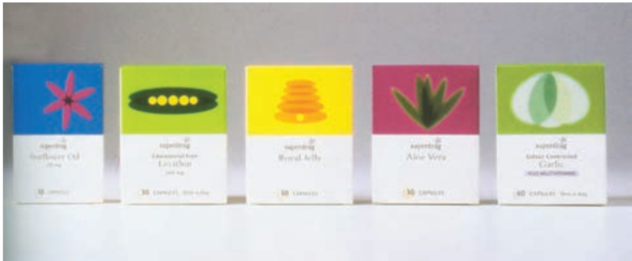
شکل ۳۷ – ۴ – کاربرد رنگ در بسته‌بندی داروها با توجه به طعم‌دهنده‌ها و اسانس‌ها

مخاطبان عام یا مخاطبان خاص از قبیل (بزرگسالان، کودکان، صنعتگران، بانوان، ...)