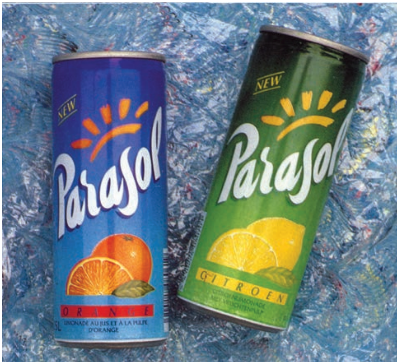
شکل ۴۵-۴- چاپ روی فلز