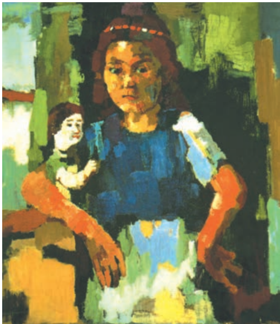
تصویر ۱۰-۳- اثر اُسکار کوکوشکا، رنگ روغن روی بوم

اُسکار کوکوشکا فقط به چهره نپرداخته، بلکه نیم تنه‌ای از یک دختر بچه با عروسکش را در کنار پنجره تصویر کرده است و نور را از سمت چپ به آن تابانده است، کوکوشکا نیز با وجود ساده کردن سطوح به کمک رنگ توانسته است حجم و فضایی را که دخترک ایستاده نشان دهد. گردش سبزه‌ها و همین‌طور رنگهای سفید، زرد، نارنجی و قهوه‌ای و سیاهها در تمام اثر، باعث احساس تعادل رنگی در چشم بیننده می‌شود.