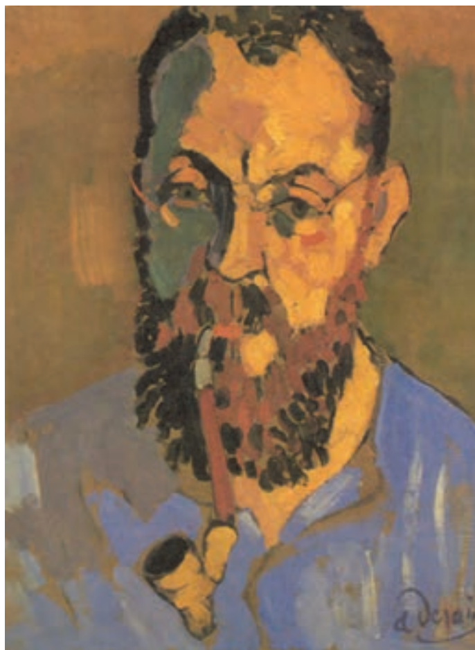
تصویر ۳-۹- اثر آندره ژرن، رنگ روغن روی بوم، (۳۵×۴۶ سانتی متر)

شما در نقاشی از طبیعت بی جان با قوانین ترکیب رنگهای اصلی و ثانویه آشنا شده و چگونگی به کارگیری این رنگها را در منظره، تجربه کرده اید. حال در این بخش، رنگها را به گونه ای به کار ببرید که نورپردازی و حجم نمایی از پیکره انسان را نشان دهند. شدت درخشش این رنگها می توانند در بیان احساس به شما کمک کنند. به دو اثری که در زیر می آید نگاه کنید. تصویر (۳-۹) اثر آندره ژرن و تصویر (۳-۱۰) اثر اسکار کوکوشکا است. ژرن با به کارگیری مجموعه رنگهای اصلی و ثانویه، چهره هانری ماتیس نقاش فرانسوی را در حین کشیدن پیمپ نقاشی کرده است. او ابتدا طرح خود را به سطوح کلی، بر اساس تابش نور از سمت راست تفکیک کرده است. برای بخش نور، از رنگهای زرد، قرمز، نارنجی و قهوه ای و برای سایه ها، از رنگهای سبز، بنفش و آبی سود جسته است. ژرن با اشاره های خفیف مثل نور عینک در سمت چپ چهره و سایه زیر چشم در بخش راست چهره، از دو قسمتی شدن چهره به نور و سایه جلوگیری کرده است. همین طور پیمپ که دارای رنگهای نارنجی و قهوه ای است در بنفش پیراهن باعث چرخش کلی رنگها و هماهنگی تصویر می شود. ژرن، با این که از رنگهای خالص و ثانویه استفاده کرده ولی شکل به کارگیری رنگها و نحوه قلم زدن او، به حجم پردازی چهره کمک کرده است. از طرفی این رنگها توانسته اند چهره ای حساس و نگران را به ما نشان دهند.