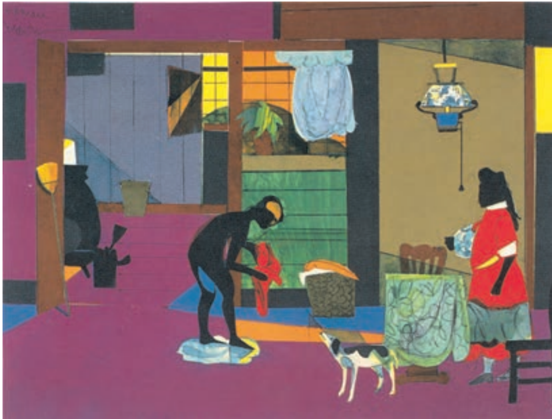
تصویر ۱۴-۳- اثر رُمار بردن ۱ ، کلاژ و ترکیب مواد، (۳۴/۹×۴۵/۱ سانتی‌متر)