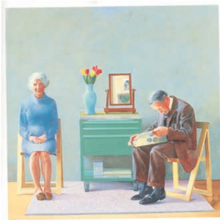
تصویر ۲۹-۳ اثر دیوید هاکنی ۱ ، رنگ روغن روی بوم، (۱۸۳×۱۸۳ سانتی‌متر)