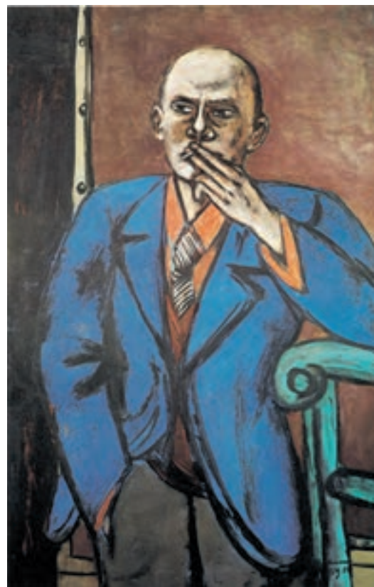
تصویر ۳-۱۱ – اثر ماکس بکمان، رنگ روغن روی بوم، (۱۴۰×۹۱/۴۴ سانتی‌متر)