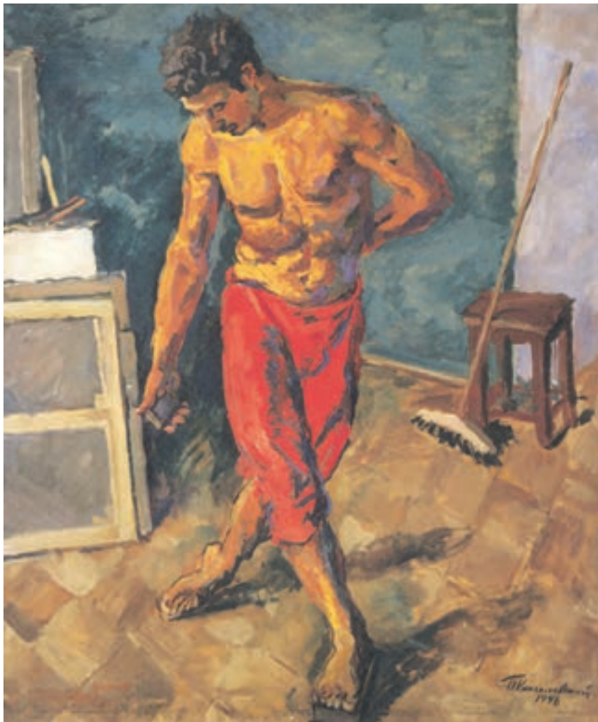
تصویر ۱۹-۳ – اثر پیوتر کانچالفسکی ۱ ، رنگ روغن روی بوم، (۱۷۱×۱۴۳ سانتی‌متر)

مطابق آنچه پیش‌تر گفته شد پیش‌تر طی طرحی از مدل خود که با توجه به نورپردازی و فضا سازی محیط در آن، رنگهای گرم بر آن حاکمیت دارند، تهیه کنید. برای مثال می‌توانید مدل خود را به کمک نور مصنوعی که غالباً رنگهای گرم تولید می‌کنند نورپردازی نمایید و لباس و رنگ اشیای پس‌زمینه را مطابق خواست خود تغییر دهید. بازتابهای نور حاصل از شعله شمع و آتش نیز رنگهای گرم ایجاد می‌کنند. اینک، به کمک مجموعه رنگهای گرم دایره رنگ و ترکیبات آن می‌توانید طرح خود را بازسازی کنید. از سطوح کلی نور و سایه و تیره و روشن رنگ بهره بگیرید و رفته رفته سطوح بزرگ را به کمک رنگهایی با سطوح کوچکتر، از یکدیگر تفکیک کنید به گونه‌ای که رفته رفته حجم اشیای شما آشکار شود. در اینجا نیز در ابتدا اگر محدوده کوچکتری از رنگهای گرم را انتخاب کنید و پس از دست یافتن به مهارت بیشتر رفته رفته رنگهای دیگر را به آن بیفزاید نتیجه بهتری حاصل خواهد شد (تصویر ۱۹-۳).