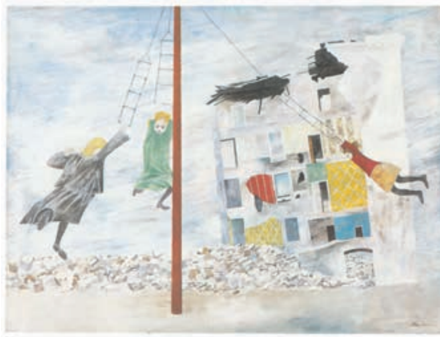
تصویر ۳۰-۳ اثر بن شان ۲ ، رنگ روغن روی بوم، (۱۰۱/۴×۷۵/۶ سانتی‌متر)