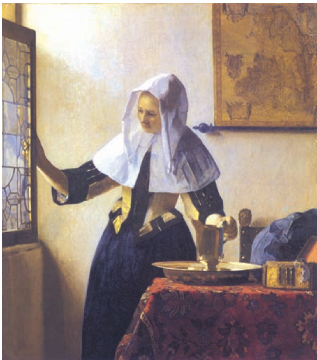
تصویر ۱-۳- اثر یان ورمیر ۱ ، رنگ روغن روی بوم، (۴۵/۷×۴۰/۶ سانتی متر)

سورا ۲ نقاش پست امپرسیونیست ۳ نیز، با استفاده از نورپردازی متمرکز در تصویر (۲-۳) توانسته است تیرگی و روشنیه‌های بسیار جذابی را در اثر خود ایجاد نماید. وی، استادانه، تغییر مایه سیاه و سفید را به منظور القای عمق فضایی اثرش به کار گرفته است. شما هم می‌توانید در این مرحله از تأکید بر جزئیات دوری کنید. با تار کردن چشمها، تفکیک نور و سایه کلی در کار میسر خواهد بود. این کار باعث می‌شود تا کمتر به جزئیات پردازید.