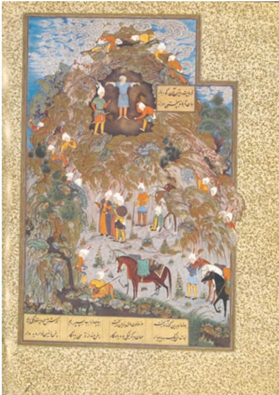
تصویر ۲۷-۳- اثر سلطان محمد، نسخه خطی شاهنامه طهماسبی، سده ۱۰ هجری