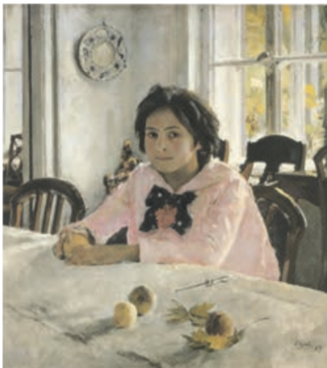
تصویر ۳-۲۵- اثر والننتین سِرف، رنگ روغن روی بوم، (۸۵×۹۱ سانتی‌متر)