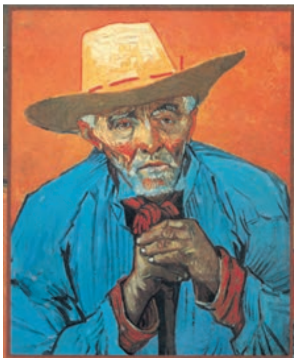
تصویر ۳-۱۲ – اثر ونسان ون گوگ، رنگ روغن روی بوم، (۶۹×۵۶ سانتی‌متر)

طرح نهایی خود را به کمک خطوط بر بوم نقاشی اجرا کنید. بهتر است در مرحلهٔ نخست سطوح کلی تیره و روشن را از هم مجزا کنید. برای بخشهایی که نور به پیکره تابیده از رنگهای زرد – قرمز و نارنجی استفاده کنید و در سایه‌ها می‌توانید از رنگهای آبی، سبز و بنفش استفاده کنید. در تصاویر (۳-۱۱) و (۳-۱۲) به کارگیری رنگهای اصلی و ثانویه در جهت بیان حالات روحی به خوبی دیده می‌شود.