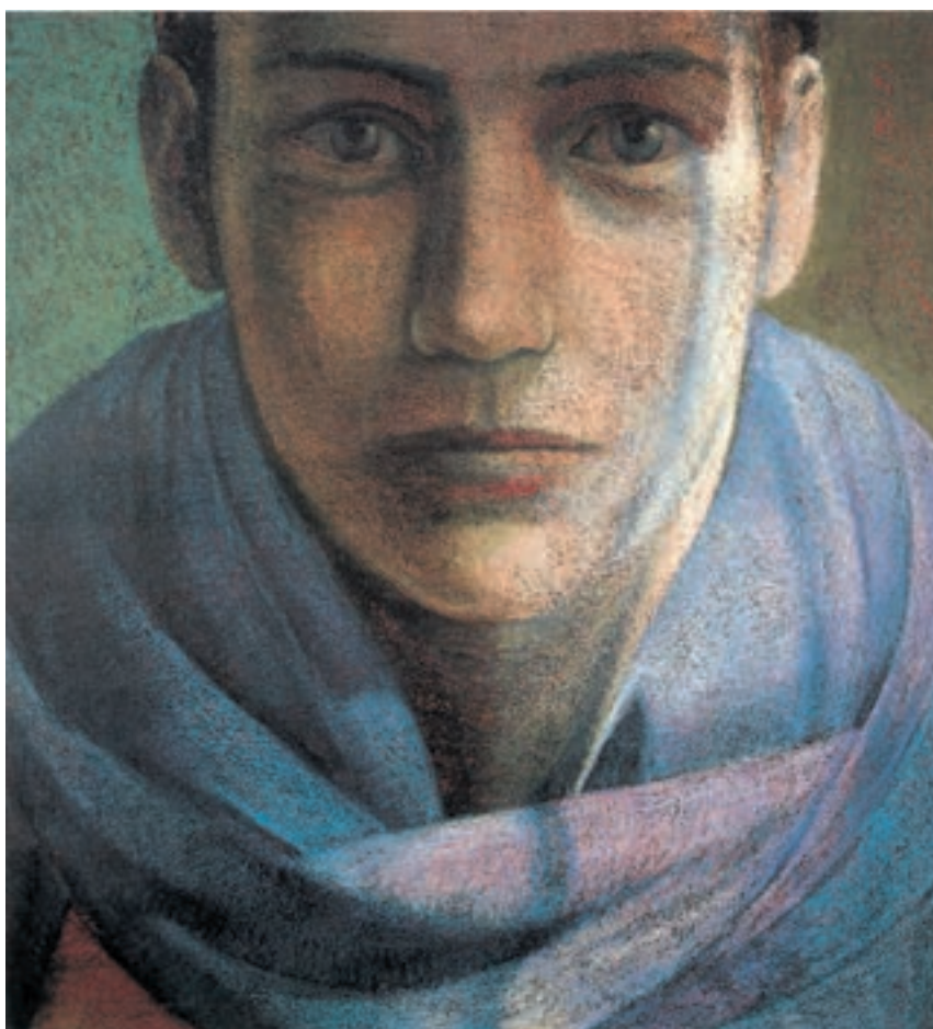
تصویر ۱۷-۳- اثر سوزان مور ۱ ، پاستل روغنی روی کاغذ، (۱۷۰×۱۸۸ سانتی‌متر)