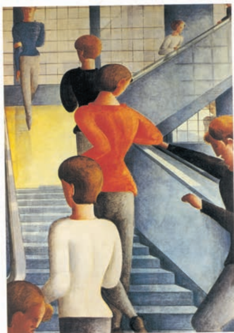
تصویر ۳-۲۸- اثر اسکار شلمر ۱ ، رنگ روغن روی بوم، (۱۱۴/۳×۱۶۲/۳ سانتی‌متر)

طرح خود را به کمک یک جفت رنگ مکمل مناسب با موضوع و خاکستریهای رنگی حاصل از ترکیب آنها، رنگ آمیزی کنید. در مرحله نخست، از یک جفت رنگ مکمل استفاده کنید تا بر تمامی خاکستریهای رنگی مسلط شوید. رفته رفته می‌توانید جفت مکملهایی دیگر به آن اضافه کنید. استفاده از ترکیبهای بیشتر نیاز به تجربه عملی بیشتر شما در این زمینه دارد. (تصاویر ۳-۲۸، ۳-۲۹ و ۳-۳۰) نمونه‌هایی از به کارگیری خاکستریهای حاصل از ترکیب مکملها می‌باشند.