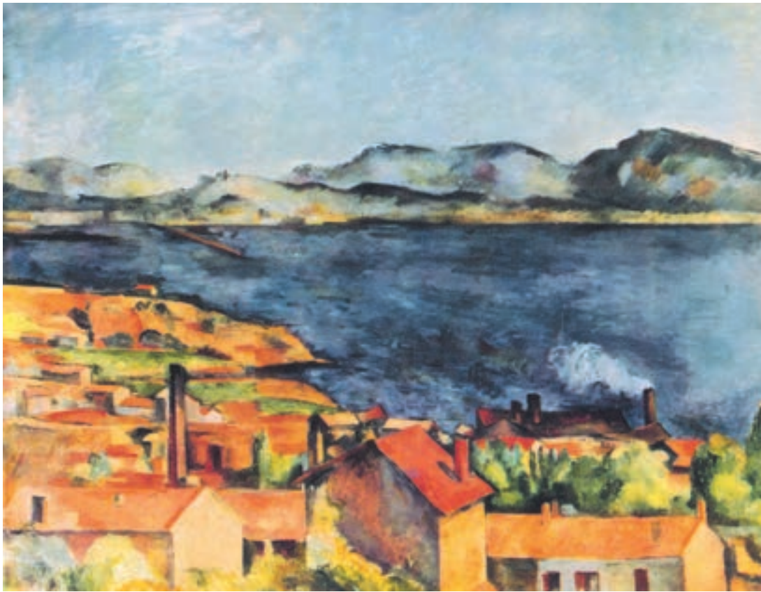
تصویر ۳۲-۲ اثر پل سزان، رنگ روغن روی بوم، (۸۰×۹۷/۷ سانتی‌متر)