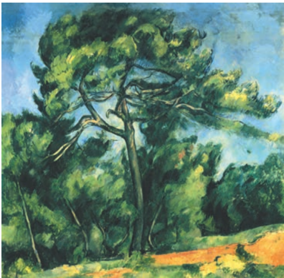
تصویر ۲-۳۰- اثر پل سزان، رنگ روغن روی بوم، (۸۵×۹۲ سانتی‌متر)

سزان نیز در تابلو نقاشی موسوم به «کاج بزرگ» تصویر (۲-۳۰) مجموعه‌ای از رنگهای سرد را به کار گرفته است و با وجود رنگهای گرم بخش پایین اثر و لکه‌های گرمی که در سطح نقاشی دیده می‌شود، حاکمیت با رنگهای سرد است و رنگهای گرم بخش پایین تابلو به عمق نمایی اثر کمک کرده است چرا که جلوتر از رنگهای دیگر دیده می‌شود، تصویر (۲-۳۱) نیز به گروه دیگری از رنگهای سرد اشاره دارد.