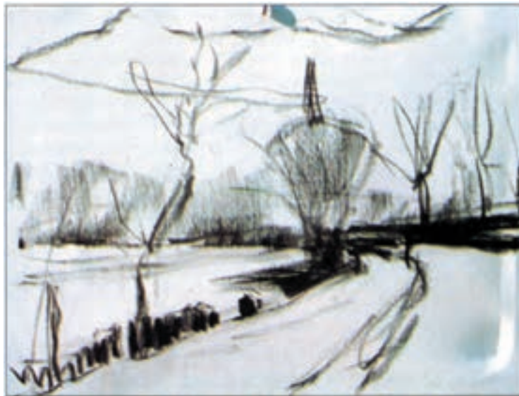
تصویر ۲-۳۵- اثر خوزه پارامون

از موضوع خود، یک پیش طرح ساده با رعایت اصول ترکیب بندی، تهیه کنید. تا حد امکان از توجه به جزئیات در طرح اولیهٔ خود بپرهیزید. تصویر (۲-۳۵) مثال بسیار خوبی برای یک طرح اولیه از طبیعت است.