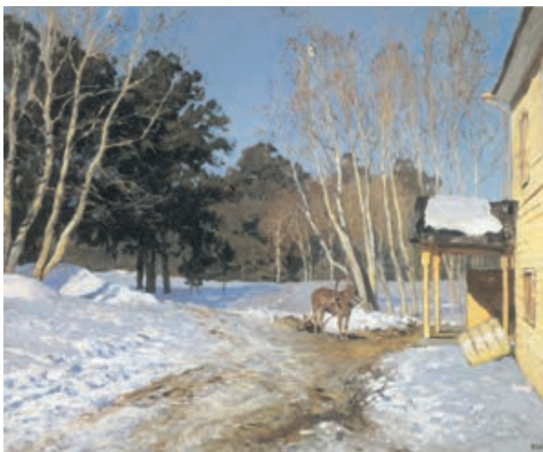
تصویر ۲-۳۹- اثر ایزاک لویتان، رنگ روغن روی بوم، (۶۰×۷۵ سانتی متر)

در مرحله بعد با به کارگیری قوانین حاکم بر رنگهای مکمل و خاکستریهای رنگی حاصل از ترکیب آنها، ترکیبی متعادل و هماهنگ به وجود آورید (تصاویر ۲-۳۹، ۲-۴۰، ۲-۴۱ و ۲-۴۲).