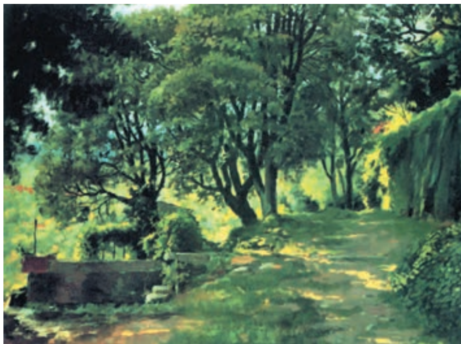
تصویر ۲۸-۲- اثر خوزه پارامون، رنگ روغن روی بوم، حاکمیت رنگ سرد

شما می توانید همانند تمرین قبل عمل کنید. منتهی این بار از مجموعه رنگهای خالص سرد در کنار رنگهای ترکیبی سرد بهره بگیرید. حتی مناطق گرم شما در نقاشی نیز با اندکی رنگ سرد ترکیب می شود (تصاویر ۲۸-۲ و ۲۹-۲).