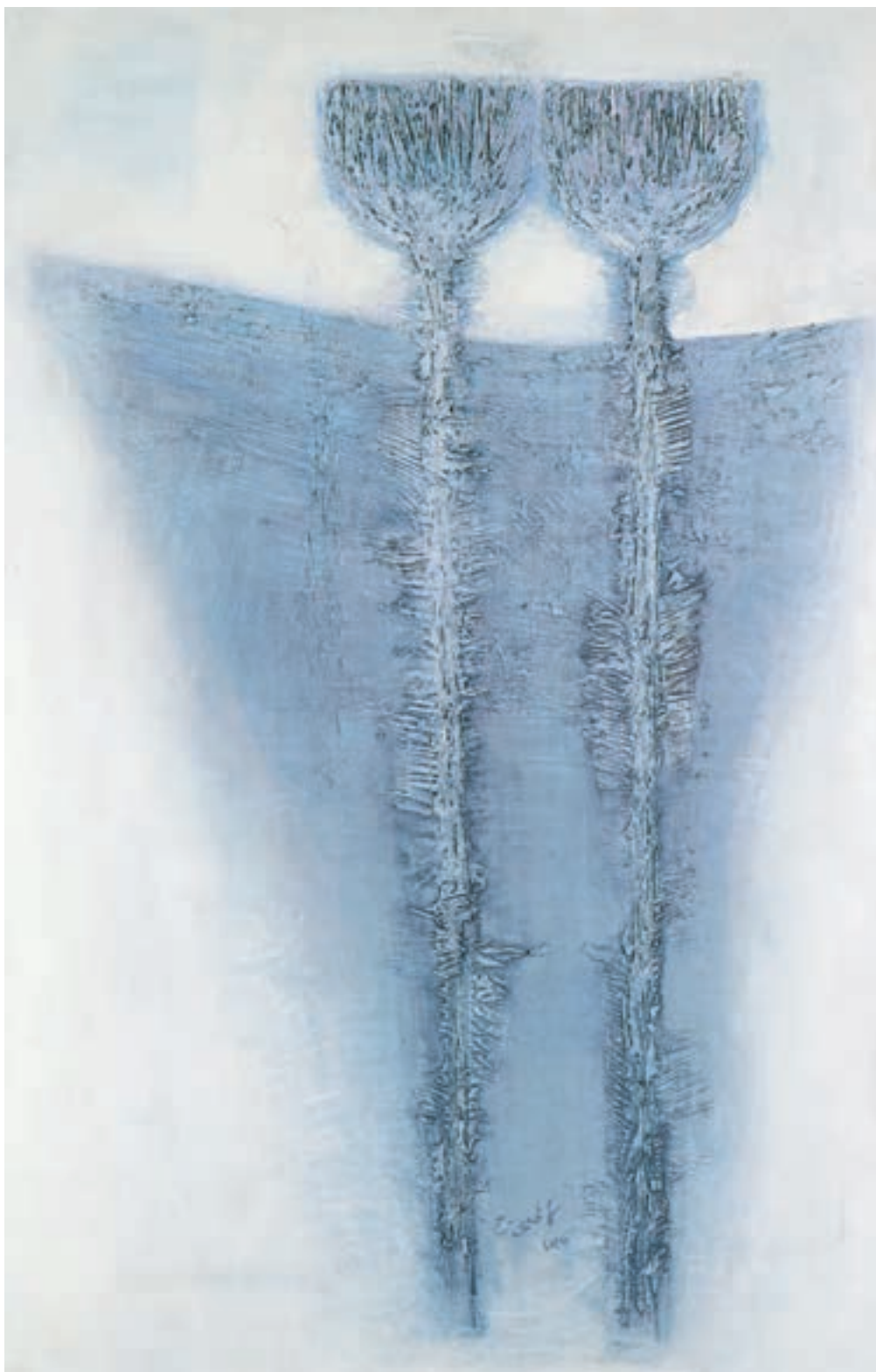
تصویر ۴۲-۲- اثر حسین کاظمی، رنگ روغن روی بوم، (۹۰×۱۴۰ سانتی متر)