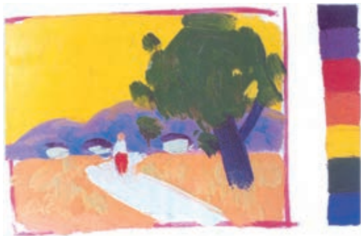
تصویر ۱۴-۲- رنگهای اصلی و ثانویه – گرم

پیش طرح رنگی زیر، می تواند نمونه بسیار ساده ای برای شروع کار شما باشد. بسیاری از نقاشان، کار رنگ را با یک پیش طرح رنگی کلی آغاز می کنند. گاه، این گونه پیش طرحها به تعداد زیادی تهیه می شوند. این اتوهای سریع از منظره، شما را برای انجام مراحل پیچیده تر آماده می سازد. تصویر (۱۴-۲) نقاش، با استفاده از طیف رنگهای گرم به فضا سازی کلی کار پرداخته است. او، آسمان را که غالباً آبی ست در هنگام ظهر با رنگ زرد و در نهایت درخشش نشان داده است. کوهها در دوردست با رنگ بنفش و در سایه ها، آبی به کار گرفته شده است. رنگ زمین که غالباً رنگ گرم است با نارنجی پوشانیده شده است و درخت، در بخش جلوی کار، با رنگ سبز خودنمایی می کند. در تصویر (۱۵-۲) نقاش، همان موضوع را با دسته رنگهای اصلی و ثانویه در ساعت دیگری از روز کار کرده است. آسمان در اینجا با آبی پوشانیده شده است و وسعت سطوح به کار گرفته شده و حاکمیت رنگهای سرد را