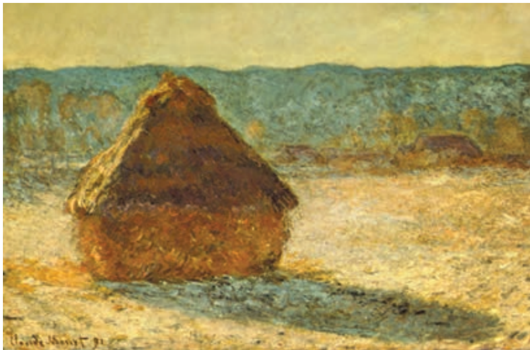
تصویر ۲-۲۲- اثر کلود مُنه، رنگ روغن روی بوم، (۸۹×۶۵ سانتی‌متر)

البته، همان‌طور که اشاره شد در بعضی از ساعات روز نیز رنگهای سرد و یا گرم غلبه می‌یابند. مُنه نقاش امپرسیونیست، در برخی از آثار خود از یک موضوع با زاویهٔ واحد در ساعات مختلف روز نقاشی کشیده و با دقت خاصی، رنگهای هر ساعت را مورد توجه قرار داده است. او سایه‌ها را نه با خاکستری و سیاه بلکه با کمک مکملهای رنگی نشان داده است (تصاویر ۲-۲۲ و ۲-۲۳).