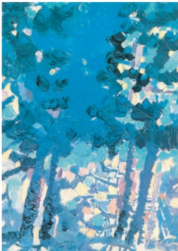
تصویر ۳۱-۲- اثر احمد اسفندیاری، ۱ رنگ روغن روی بوم، (۵۰×۷۰ سانتی‌متر)