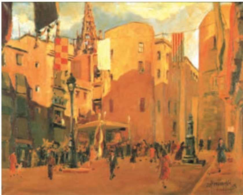
تصویر ۲۴-۲- اثر خوزه پارامون، رنگ روغن روی بوم، حاکمیت رنگ گرم

برای اجرای این تمرین، شما می‌توانید از رنگهای خالص گرم دایره رنگ در کنار رنگهای ترکیبی گرم استفاده کنید. اما چنانچه در منظره شما سایه و یا تیرگی وجود داشته باشد می‌توانید به رنگهای گرم خود اندکی رنگ سرد بیفزایید. مثلاً داخل قرمز و یا نارنجی و ... اندکی سبز، آبی و یا بنفش اضافه کنید. در نتیجه رنگی به دست می‌آید که در عین گرمی، نسبت به رنگهای دیگر شما سردتر است. به تصویر (۲۴-۲) نگاه کنید. نقاش در قسمت پایین سمت چپ، مجموعه‌ای از رنگها را برای نمایش تیرگی و سایه به کار برده که از ترکیبهای سبز و بنفش و قرمز به دست آمده است و لی غالب رنگهای نقاشی، تمایل به گرمی دارند. تصویر (۲۵-۲) مجموعه رنگهای گرم به کار رفته در نقاشی را نشان می‌دهد.