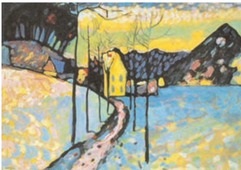
تصویر ۱۷-۲- اثر واسیلی کاندینسکی ۱ ، رنگ روغن روی چوب، (۷۱/۵×۹۷/۵ سانتی‌متر)