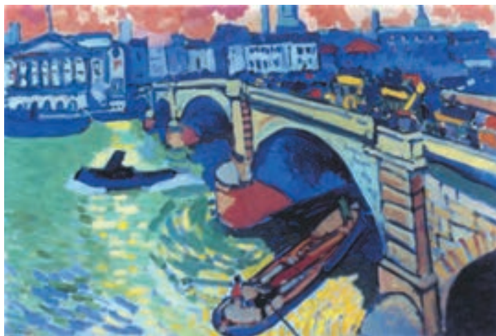
تصویر ۱۶-۲- اثر آندره دُرن، رنگ روغن روی بوم، (۶۶×۹۹ سانتی‌متر)

در تصویر (۱۶-۲) پل لندن اثر دُرن ۱ را با به‌کارگیری رنگهای اصلی و ثانویه به وضوح می‌بینید. نقاش به‌زیبایی، سطح تابلو را از عقب به جلو، به سطوح اصلی تقسیم‌بندی نموده و به کمک خط افق در نیمه بالایی تابلو، آسمان را از سطوح خانه‌ها جدا کرده است. او سپس، عناصر ساختمان را قرار داده و بعد از آن، رودخانه و پل و در نهایت، قایقها را طراحی کرده است. نقاش، از رنگهای آبی و سبز و بنفش در عناصر ساختمانی استفاده کرده و گاه، رنگهایش را به کمک سفید روشن نموده است. رنگ آب در نگاه اول سبز به نظر می‌رسد، اما نقاش، انعکاس نورهای خورشید را که در آسمان دور دست با نارنجی و زرد همراه است در پیش‌زمینه کار با ضربه قلمهای کوچک به روی رنگ سبز رودخانه، به زیبایی به کار برده است. او در سایه‌ها غالباً از آبی و بنفش استفاده کرده و بدین ترتیب، هماهنگی لازم را میان رنگهای سراسری تابلو برقرار نموده است. تصویر (۱۷-۲) نیز نمونه مفید دیگری برای این تمرین است.