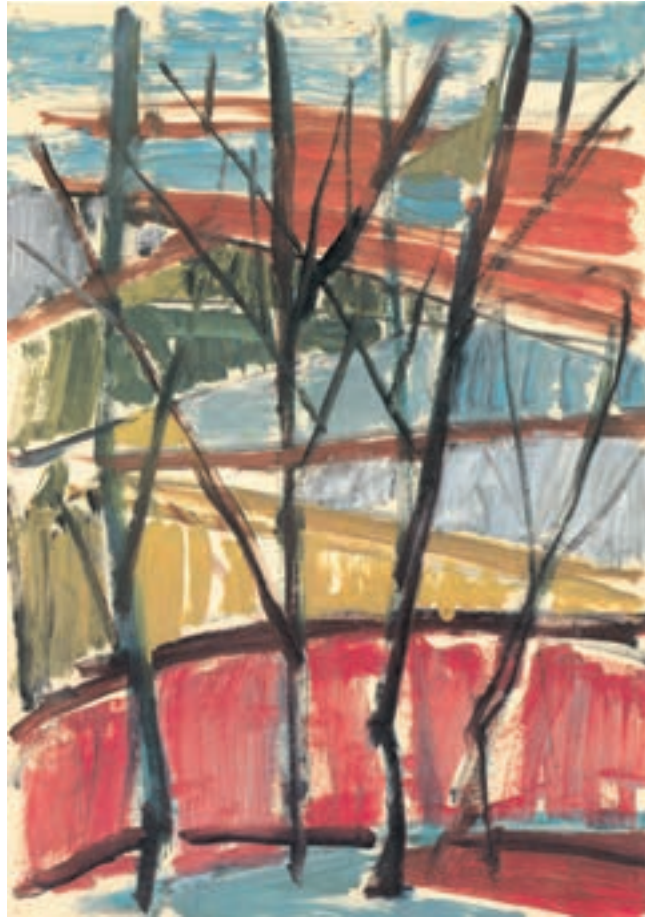
تصویر ۴۰-۲ اثر شکوه ریاضی ۱ ، رنگ روغن روی کاغذ، (۵۰×۳۵ سانتی متر)