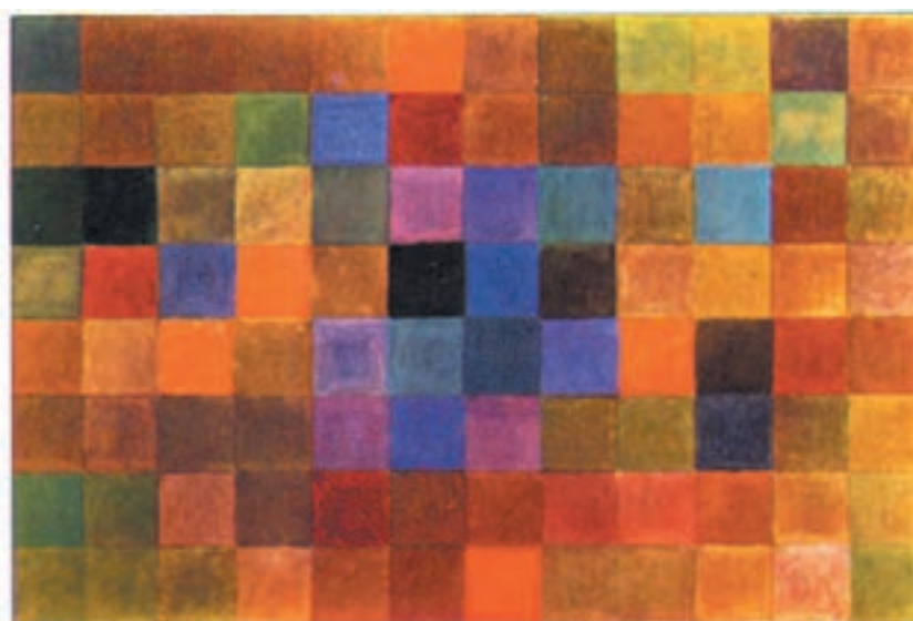
تصویر ۲۰-۲- پاییز