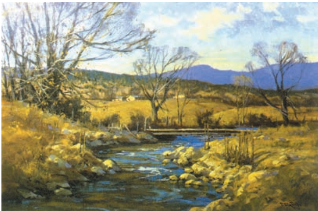
تصویر ۳۳-۲- اثر استریسیک ۱ ، رنگ روغن روی بوم، (۳۰×۴۱ سانتی‌متر)