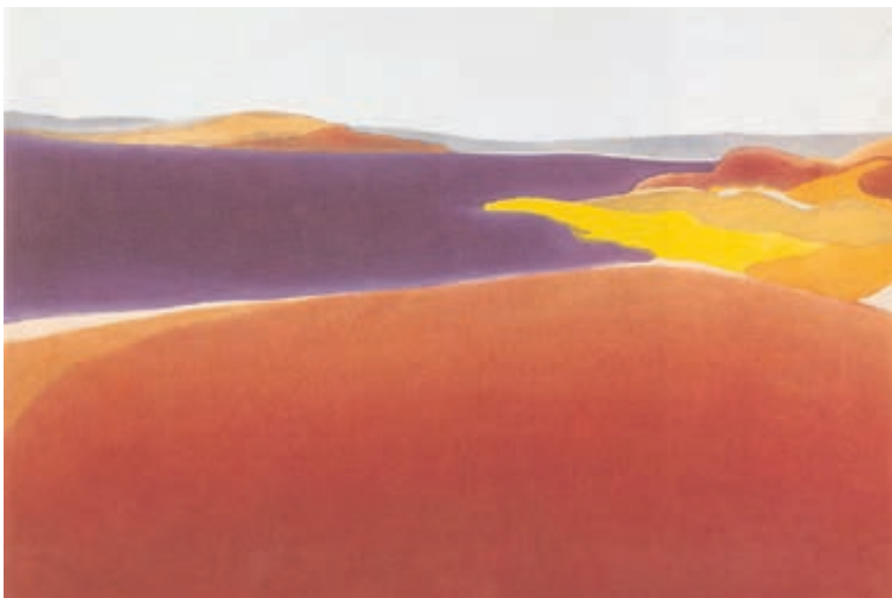
تصویر ۲۷-۲- اثر الیزابت آزرن ۱ ، اکریلیک روی بوم، (۱۰۲/۶×۱۰۱/۶ سانتی متر)