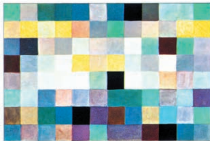
تصویر ۲۱-۲- زمستان