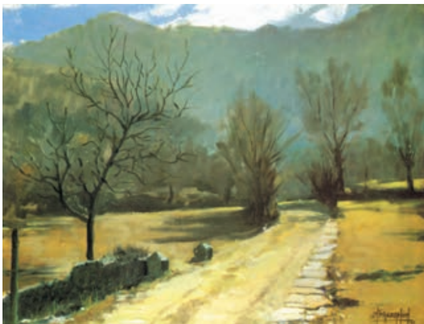
تصویر ۲-۳۸- اثر خوزه پارامون، رنگ روغن روی بوم