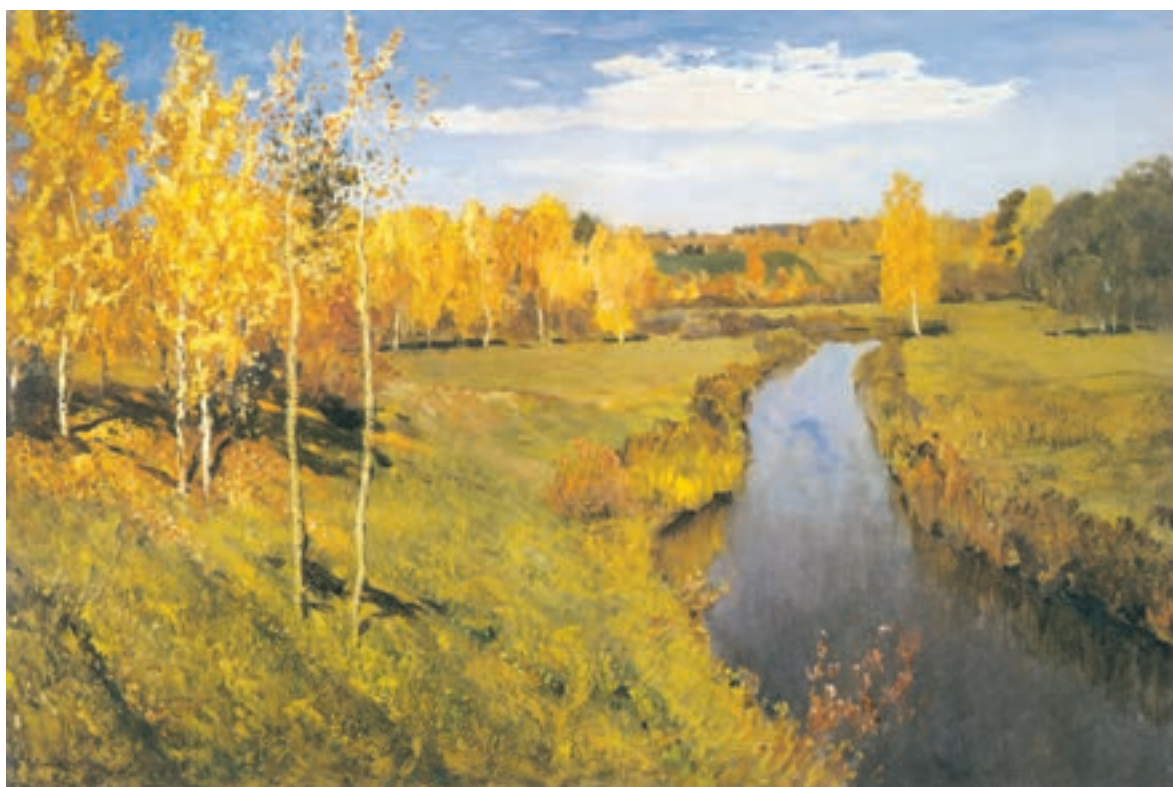
تصویر ۲-۲۶ - اثر ایزاک لویتان، رنگ روغن روی بوم، (۸۲×۱۲۶ سانتی‌متر)

در تصویر (۲-۲۶) پاییز طلایی اثر ایزاک لویتان، با وجود رنگهای آبی، حاکمیت بارنگهای گرم و به خصوص زرد است. تصویر (۲-۲۷) نیز حاکمیت رنگ گرم را نشان می‌دهد.