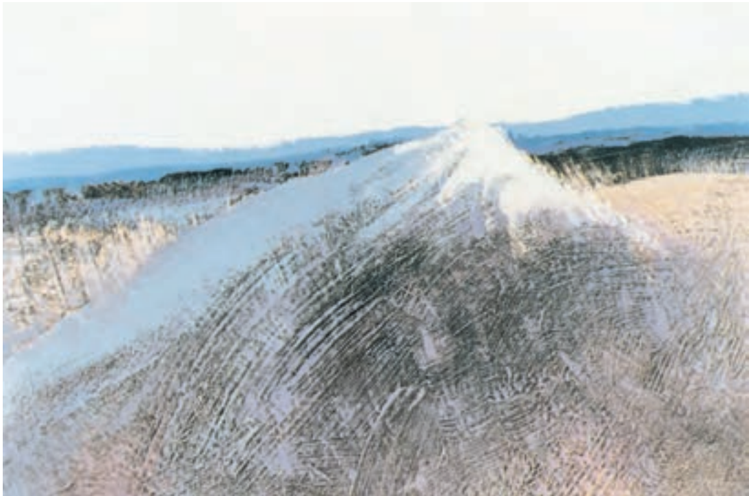
تصویر ۶-۲- اثر حسین کاظمی، رنگ روغن روی بوم، (۱۰۰×۱۵۰ سانتی‌متر)