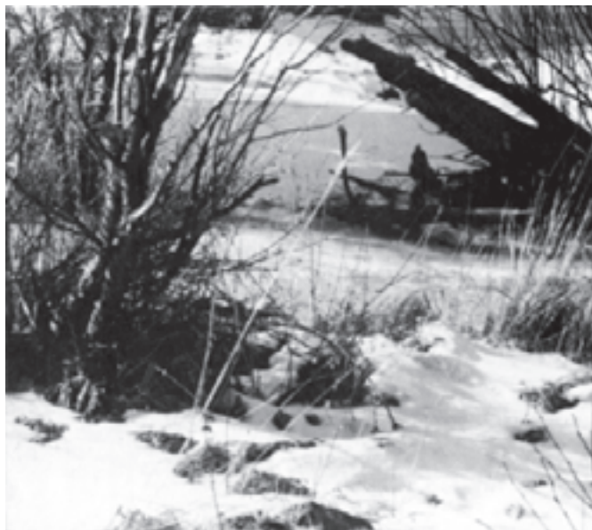
تصویر ۲-۷- عکس از منظره، اثر زاہد

تقسیم کادر به این ترتیب، از کل به جزء صورت می‌گیرد و شما در سطح زمین، عناصر دیگر تابلو را قرار خواهید داد که به تدریج به چشم بیننده نزدیک می‌شوند. از جمله کوهها و در جلو آن احتمالاً، درختان و عناصر دیگر را می‌توانید تعیین وضعیت کنید. توجه به دوری و نزدیکی، پرسپکتیو خطی، وضوح و عدم وضوح عناصر تابلوی شما را به تدریج کامل و کاملتر می‌کند. در این مرحله، همیشه از کلیات شروع کنید و از تأکید بر یک جزء، جداً پرهیزید. در تصاویر (۲-۷) عکس از منظره و (۲-۸) پیش طرح از همان منظره، ملاحظه می‌کنید که در پیش طرح هنرمند چگونه از نمایش جزئیات صرف‌نظر کرده است.