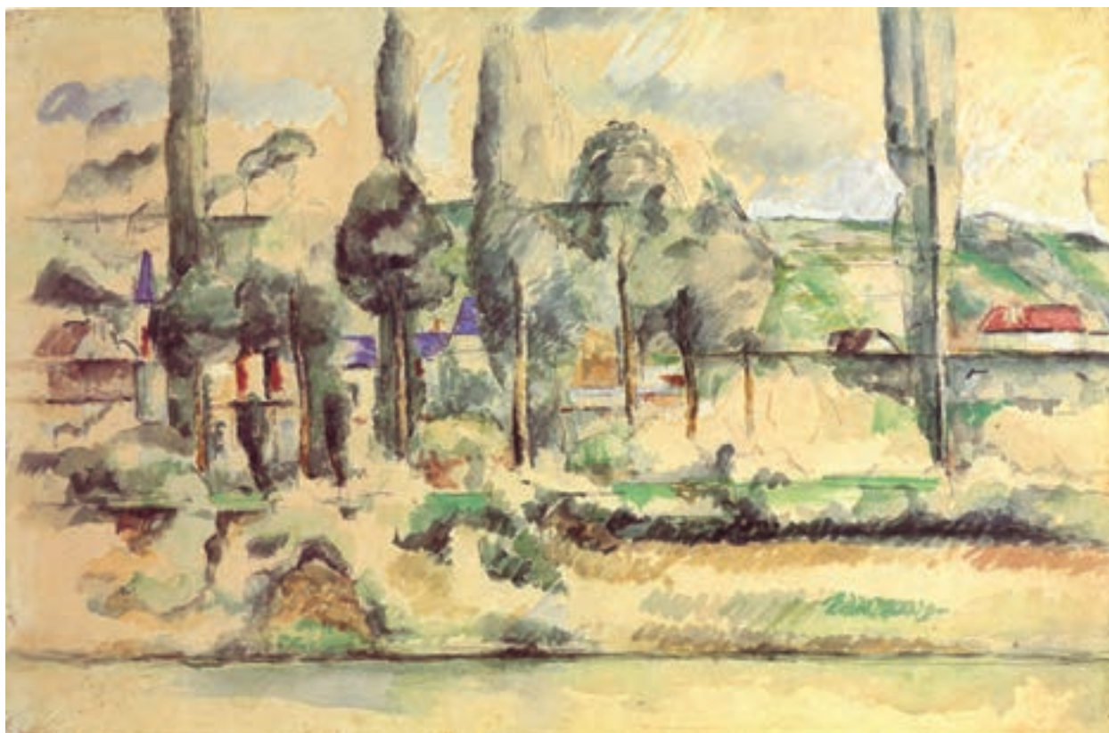
تصویر ۱۱-۲- اثر پل سزان، آبرنگ روی مقوا