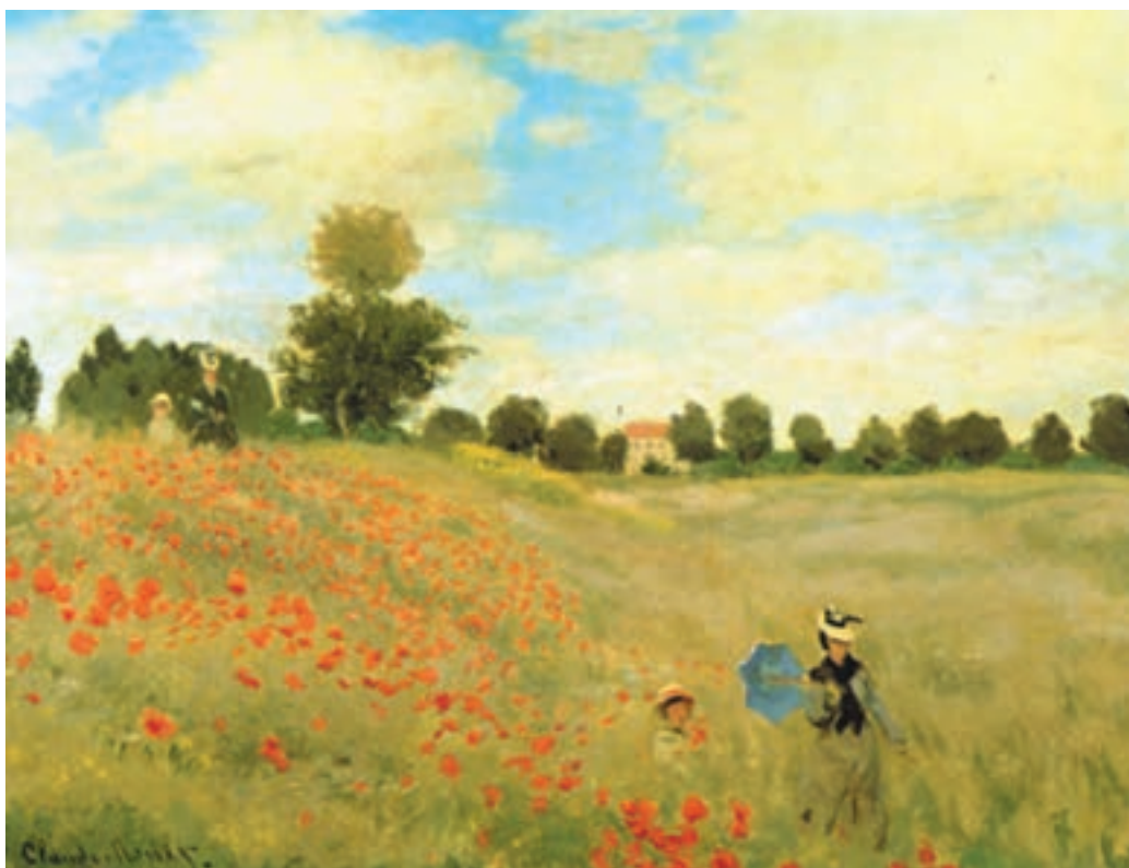
تصویر ۳-۲- اثر کلود مَنه، رنگ روغن روی بوم، (۴۹/۵×۶۴ سانتی‌متر)