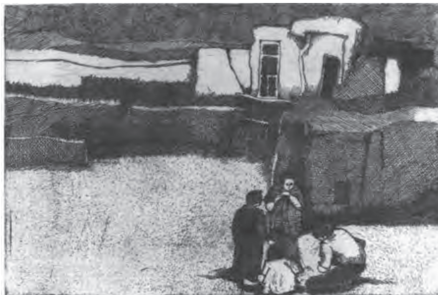
تصویر ۳۳- ناهید حقیقت - حکاکی روی فلز- ۱۵/۱×۲۲/۷ سانتی متر- ۱۹۷۳ م. (برگرفته از کتاب چاپ دستی تکنیک کالوگرافی)