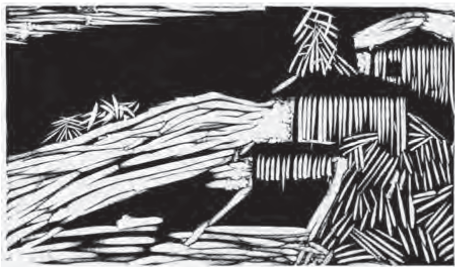
تصویر ۳۵- مینا نوری - حکاکی روی لینولئوم - ۱۳/۵×۲۳/۵ سانتی متر- ۱۳۵۲ شمسی .