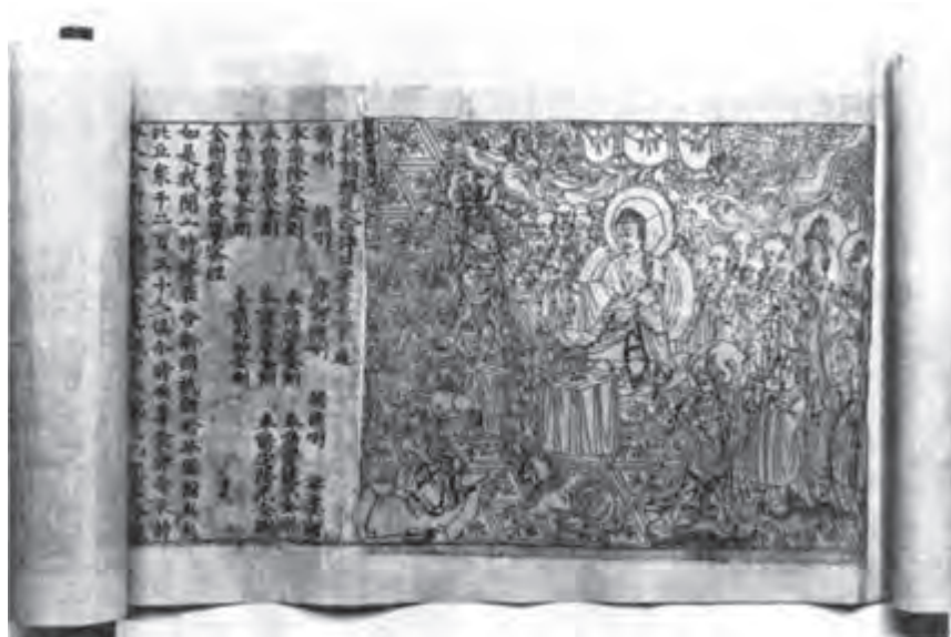
تصویر ۶- دیاموند ساترا- اثر چاپی از باسمة چوبی حکاکی شده - چین - ۸۶۸ میلادی.