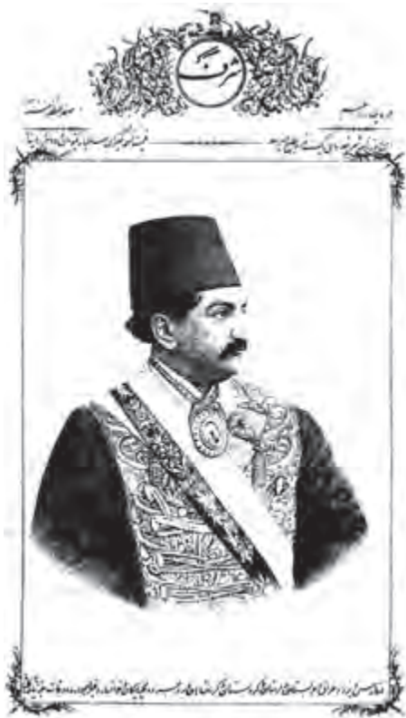
تصویر ۲۷- چهره ابوتراب غفاری - صفحه اول روزنامه شرف - لیتوگرافی - ۱۳۰۱ هجری. به خط نستعلیق با استفاده از حاشیه‌های تزئینی.

در حدود هفده سال بعد (در سال ۱۲۵۰ قمری) با ورود دستگاه‌های چاپ سنگی (لیتوگرافی ۱ )، برای مدت نزدیک به ربع قرن این شیوه چاپی مورد استفاده قرار گرفت. نخستین چاپخانه مجهز به دستگاه‌های لیتوگرافی نیز نخستین بار در تبریز دایر شد و نخستین کتابی که چاپ کرد، قرآن بود. همچنین در این دوره نخستین مطبوعات ایرانی به روش لیتوگرافی چاپ و منتشر شدند.