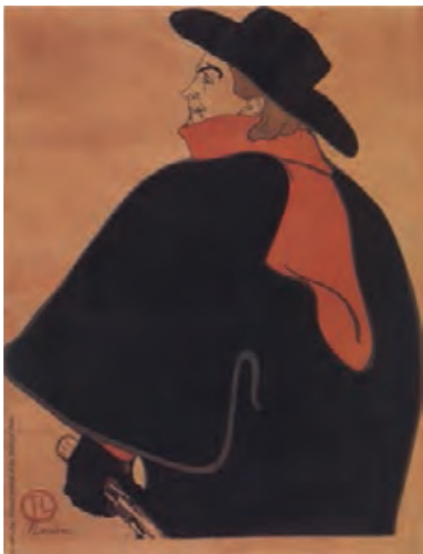
تصویر ۱۵- تولوز لوترک - لیتوگرافی - ۱۲۷/۳×۹۵ سانتی‌متر - ۱۸۹۳ م.

روش «لیتوگرافی» در قرن هیجدهم میلادی توسط «آلویس زنفلدر» ۱ به وجود آمد که بعدها به فراگیرترین شکل چاپ در سده‌های نوزدهم و بیستم تبدیل شد و پس از طی مراحل در شکل صنعتی شده خود به نام «چاپ افست» ۲ معروف گردید. در سده نوزدهم و بیستم روش لیتوگرافی بسیار مورد توجه هنرمندان بود و «فرانسیسکو گویا» ۳ «تولوز لوترک» ۴ «ماتیس» ۵ «پیکاسو» و دیگران آثار ارزشمندی را در این زمینه به وجود آورده‌اند (تصویر ۱۴ و ۱۵).