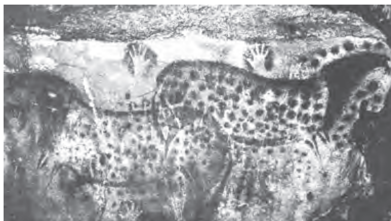
تصویر ۱- اسب‌های خالدار و نقش منفی دست. بش‌مرل، حدود ۱۰ تا ۱۵ هزار سال پیش از میلاد، ۳۴۰ سانتی متر طول، ولایت لوت، فرانسه.

دوران غارنشینی: در آثار بر جای مانده از دوران غارنشینی، دو گونه تصویر چاپ مانند به دست آمده است که در یکی از آنها اثر دست به صورت مثبت و در دیگری به صورت منفی بر دیواره غار نقش بسته است. در اولی با آغشته کردن دست به ماده رنگین و انتقال آن به سطح دیوار و در دومی با قرار دادن دست بر دیواره و پاشیدن رنگ به اطراف آن نقش دست بر جای مانده است (تصویر ۱).