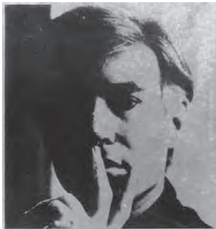
تصویر ۲۰- اندی وار هول - سیلک اسکرین روی کاغذ نقره‌ای - ۵۸/۷×۵۸/۵ سانتی‌متر- ۱۹۶۷ م.