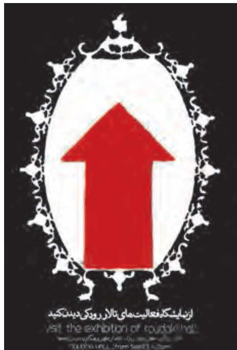
تصویر ۲۸- صادق بیرانی - سیلک اسکرین - دهه ۴۰ شمسی.