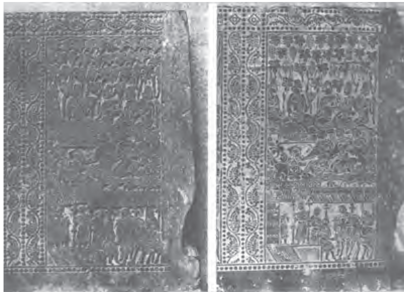
تصویر ۳- نقش برجسته چینی و نقش چاپی آن - سلسله تانگ - ۶۱۸ تا ۹۰۷ م.