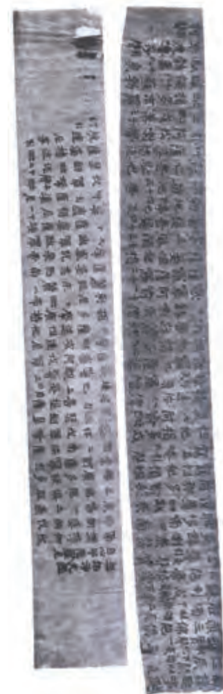
تصویر ۵- طلسم ها و سرودهای بودایی - ژاپن - ۷۷۰ م.

نخستین بول کاغذی نیز در سده نهم میلادی در چین طراحی و چاپ شد. همچنین در سده های نهم و دهم، کتاب های طوماری جای خود را به کتاب های آکاردئون (دارای ورق های تاخورد) داد و در سده دهم و یازدهم کتاب های دوخته شده پدید آمد. چاپ کارت های بازی نیز شکل دیگری از طراحی گرافیک و چاپ اولیه بود که در چین رواج پیدا کرد. حروف متحرک اولیه در قرن یازدهم ابتدا در چین و سپس در کره به وجود آمد. چاپ در دنیای غرب: قدیمی ترین نمونه چاپ، پارچه ای است مربوط به سده ششم میلادی و به سبک شرقی، که با استفاده از قالب های چوبی اجرا شده و از داخل یک گور در اروپای شمالی به دست آمده است. در شرایطی که در سرزمین چین (و کشورهای مجاور) قرن ها از پیدایش و رواج چاپ می گذشت، روش استفاده از قالب چوبی بر روی کاغذ، در قرن سیزدهم از چین به اروپا منتقل شد. این آثار چاپی با متون مذهبی و تصاویر قدیسان همراه بود که به تدریج به چاپ کتاب های کلیشه ای انجامید (تصویر ۷). قبل از این دوره کتاب ها با دست نوشته می شد و نقاشان و تذهیب کاران آنها را مصور و مزین می ساختند.