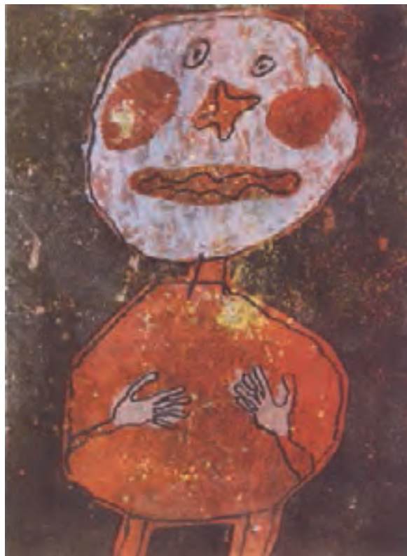
تصویر ۱۴- زن دو بوفه - لیتوگرافی - ۵۲×۳۷/۹ سانتی‌متر - ۱۹۶۲ م.

از سوی دیگر چاپ به وسیلهٔ باسمه‌های چوبی، در طول سده‌های هفده تا نوزده میلادی در ژاپن به اوج خود رسیده بود و هنرمندان بسیاری از جمله «هوکوسای» ۶ و در سده نوزدهم آثار ماندگاری در این زمینه به وجود آورده است. به دنبال آشنایی هنرمندان اروپایی با حکاک‌های چوبی ژاپنی در نیمهٔ دوم سده نوزدهم حکاک‌های چوب نیز دوباره رونق گرفت و هنرمندانی چون «پل گوگن» ۷ ، «ادوارد مونش» ۸ ، «موریس اشرا» ۹ و دیگران آثاری را در این زمینه ایجاد کردند (تصاویر ۱۶ و ۱۷ و ۱۸ و ۱۹).