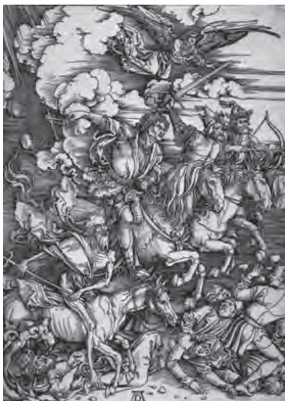
تصویر ۹- آلبرشت دورر- چهار سوار سرنوشت (از کتاب مکاشفات یوحنا)- حکاکی روی چوب- ۱۶۹۸ م.