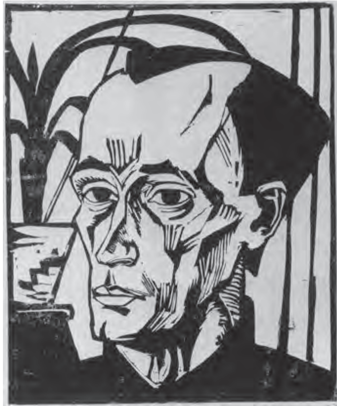
تصویر ۱۹- اریک هکل - حکاکی روی چوب - ۳۶/۵×۲۹/۸ سانتی‌متر - ۱۹۱۷ م.

ثبت اختراع چاپ «سیلک اسکرین» در قرن بیستم میلادی به نام «ساموئل سیمون» ۱ انگلیسی باعث شد عمل چاپ که تا ابتدای سده بیستم بیشتر روی صفحات کاغذی تخت (یا پارچه) انجام می‌گرفت، روی انواع سطوح با جنسیت‌های مختلف و شکل‌های گوناگون ممکن شود.