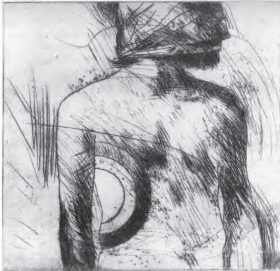
تصویر ۳۲- نیکزاد نجومی - حکاکی روی فلز- ۲۲/۳×۲۲/۳ سانتی متر- ۱۹۷۶ م. (برگرفته از کتاب چاپ دستی تکنیک کالوگرافی)