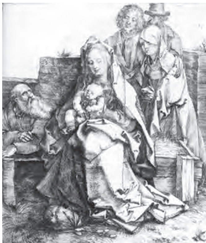
تصویر ۸- آلبرشت دورر- حکاکی روی فلز (شیوه درای پوینت)