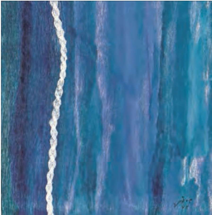
تصویر ۳۴- مینا نوری - مونوپرینت - ۱۹/۵×۱۹/۵ سانتی متر- ۱۳۷۳ شمسی .