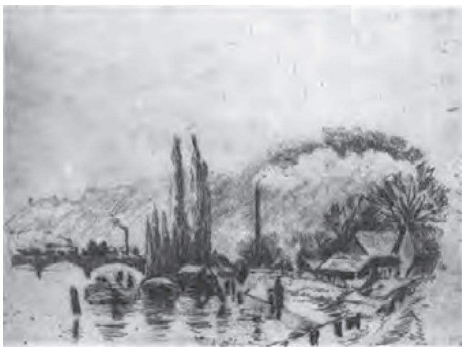
تصویر ۱۳- کامیل پیسارو - حکاکی روی فلز (شیوهٔ اچینگ و درای پوینت) - ۱۲/۸×۱۷/۵ سانتی متر - ۱۸۸۵ م.