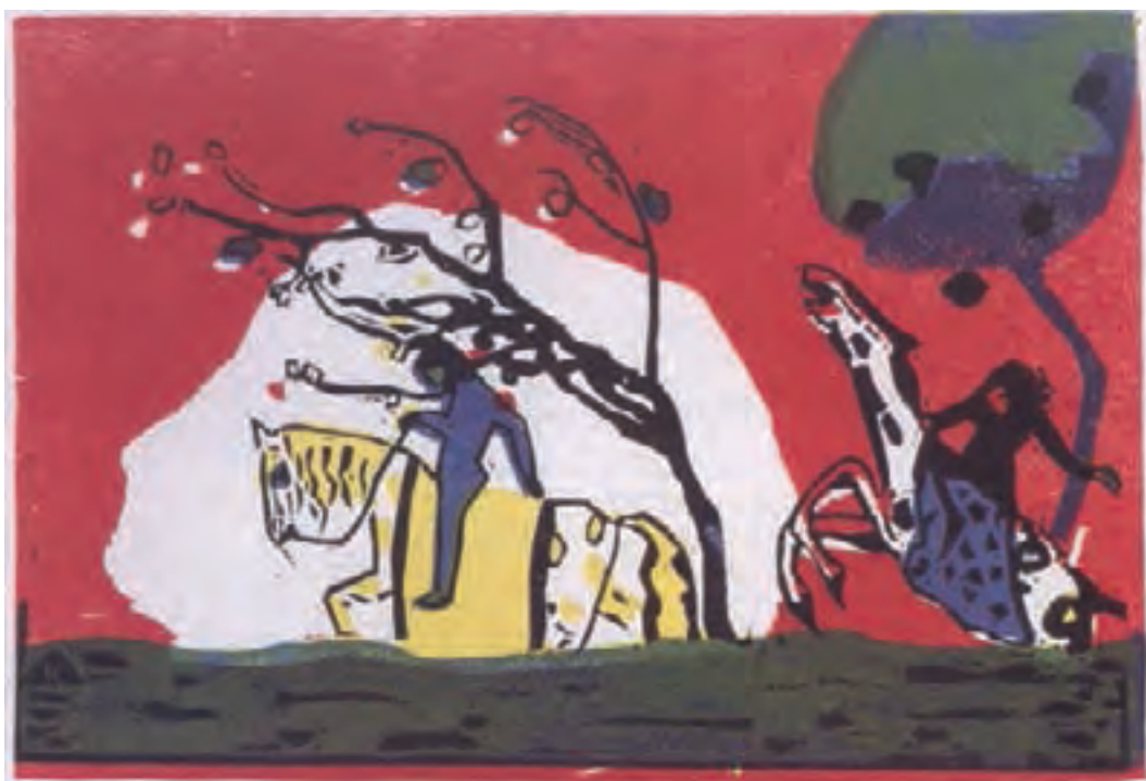
تصویر ۱۸- واسیلی کاندینسکی - حکاکی روی چوب - ۲۸/۵×۲۸/۴ سانتی متر - ۱۹۱۳ م.