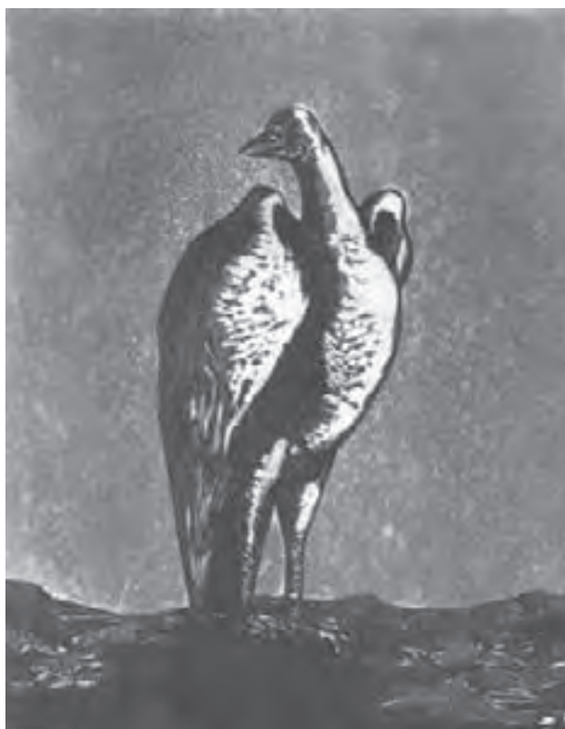
تصویر ۳۱- بهمن محمص - حکاکی روی فلز- ۳۰×۲۴ سانتی‌متر- ۱۹۷۰ م.