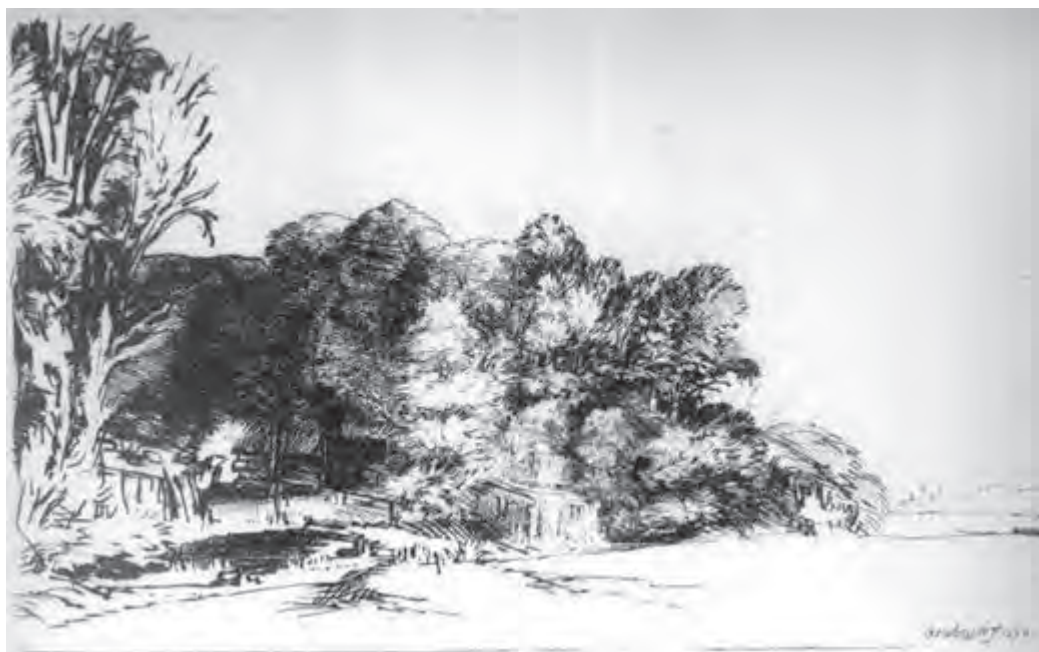
تصویر ۱۰- رامبراند- حکاکی روی فلز (شیوه درای پوینت)- ۲۱×۱۲/۵ سانتی متر- ۱۶۵۲ م.