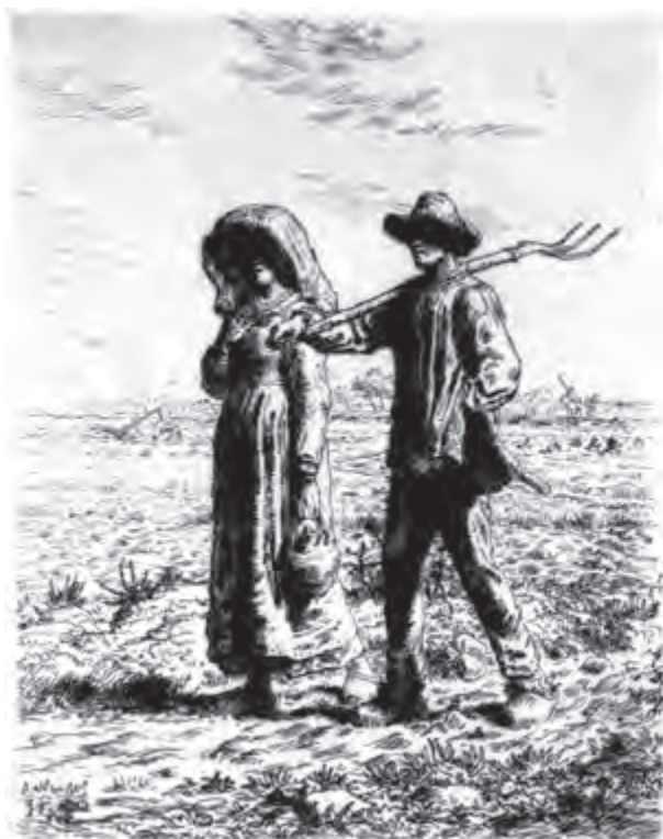
تصویر ۱۲- فرانسوا میله - حکاکی روی فلز (شیوهٔ اچینگ) - ۳۸/۶×۳۰/۵ سانتی متر - ۱۸۶۳ م.