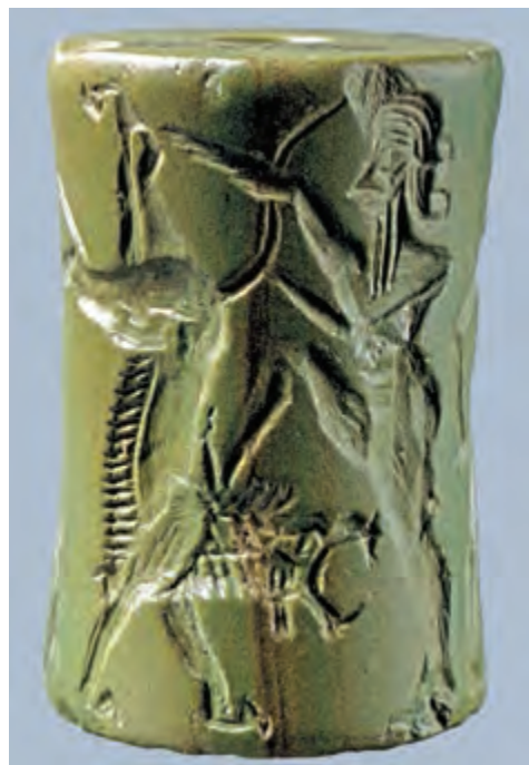
تصویر ۲- مهر استوانه‌ای و اثر نقش آن بر لوحه گلی. بین‌النهرین، ۲۳۵۰ تا ۲۱۵۰ پیش از میلاد.