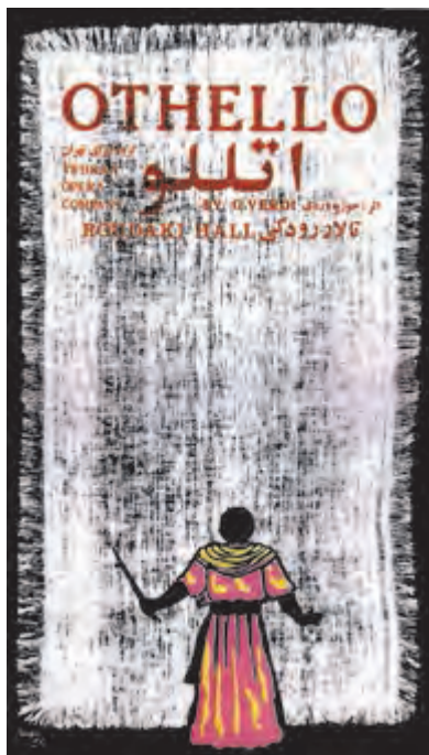
تصویر ۲۹- بهزاد حاتم - سیلک اسکرین - ۱۳۵۴ شمسی.

در کنار چاپ ماشینی، چاپ دستی همواره راه خود را پیموده است، که از این میان باید به ورود چاپ سیلک اسکرین (سری گرافی) در دهه چهل اشاره کرد. هنرمندان در شاخه گرافیک از این روش در خلق پوسته‌های خود به‌ویژه در موضوعات فرهنگی بهره بسیاری بردند (تصویر ۲۸ و ۲۹).