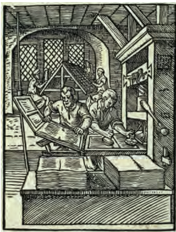
تصویر ۷- صفحه‌ای از یک کتاب کلیشه‌ای - چاپ شده با کلیشه‌جویی حکاکی شده.

اختراع چاپ با حروف متحرک فلزی در قرن پانزدهم میلادی به‌وسیله یوهان گوتنبرگ ۱ آلمانی نقطه عطفی در تاریخ چاپ شد که با طی کردن قرن‌ها به صنعت رسانه‌ای قدرتمندی تبدیل گشت. در فاصله سده‌های پانزدهم تا نوزدهم میلادی استفاده از لوحه‌های فلزی خیلی زود جای خود را در مصور کردن کتاب‌های چاپی باز کرد و تقریباً جای قالب‌های چوبی را گرفت. آبرشت دورر نقاش آلمانی در سال‌های پایانی سده پانزدهم و ابتدای سده شانزدهم میلادی آثار ماندگاری در هر دو زمینه خلق کرده است (تصویر ۸ و ۹). «رامبراند» ۲ (سده هفدهم) و «فرانسیسکو گویا» ۳ (اواخر سده هیجدهم و اوایل سده نوزدهم) و همچنین نقاشان قرن نوزدهم و بیستم چون، (ادوارد مانه) ۴ (کته کولویتس) ۵ ، (واسیلی کاندینسکی) ۶ ، (هنری ماتیس) ۷ ، «پابلو پیکاسو» ۸ و دیگران آثار با ارزشی با تکنیک حکاکی روی فلز از خود به یادگار گذاشته‌اند (تصاویر ۱۰ و ۱۱ و ۱۲ و ۱۳).