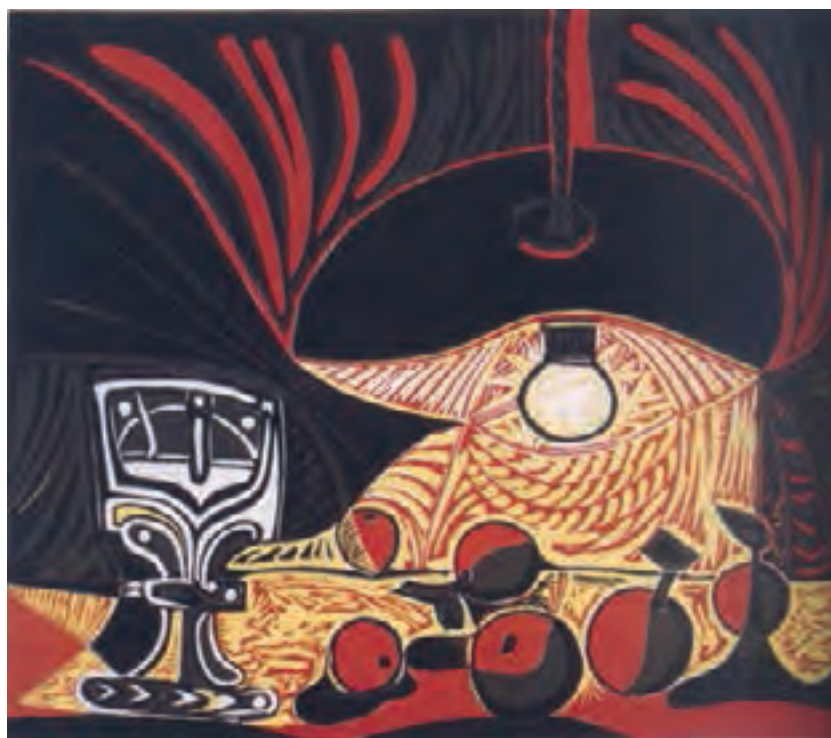
تصویر ۲۲- پابلو پیکاسو- حکاکی روی لینولوم - ۶۲×۷۵/۳ سانتی‌متر- ۱۸۵۷ م.