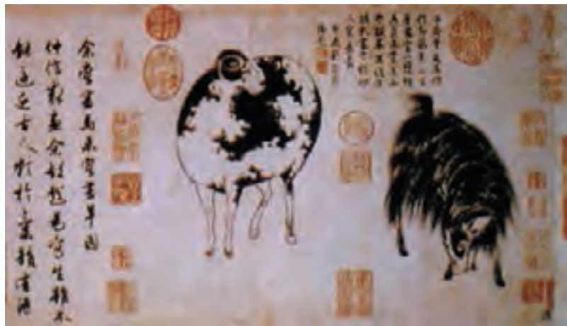
تصویر ۴- نقاشی گوسفند و بز - دوره یوانگ چومنگفو - سده ۱۴ م.

روش دوم با استفاده از مهرهای حک شده‌ای به نام «انگ» انجام می‌شده است.