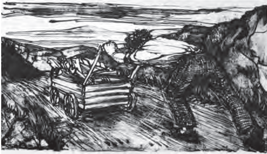
تصویر ۳۷- نیلا امیر ابراهیمی - لیتوگرافی - ۲۷×۱۴/۵ سانتی متر - ۱۳۵۶ شمسی.