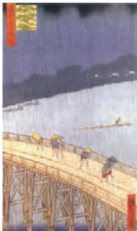
تصویر ۱۶- آندو توکیتارو هیروشیچ (هیروشیگه) - رگبار روی پل اوهایسی - حکاکی روی چوب - ۱۸۵۷ م.