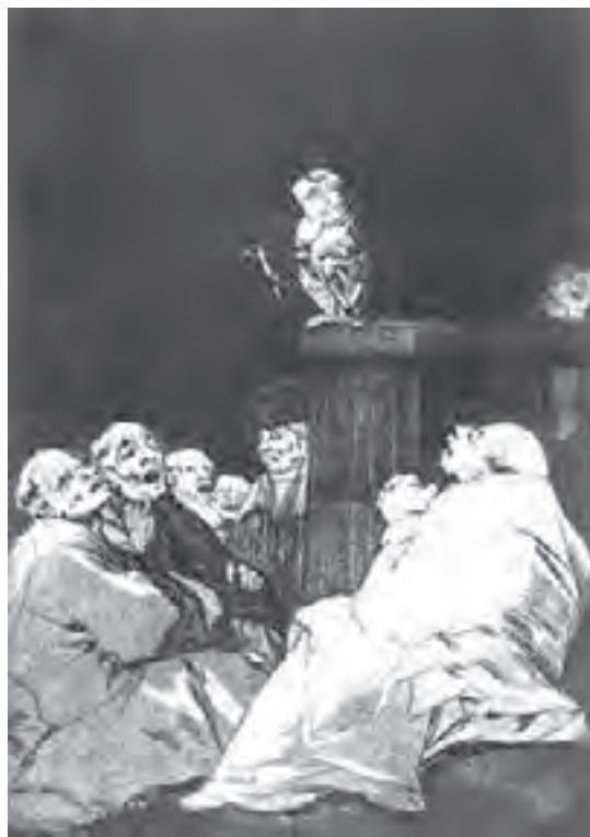
تصویر ۱۱- فرانسیسکو گویا - حکاکی روی فلز - ۱۳/۶×۱۹ سانتی متر - ۱۷۹۹ م.