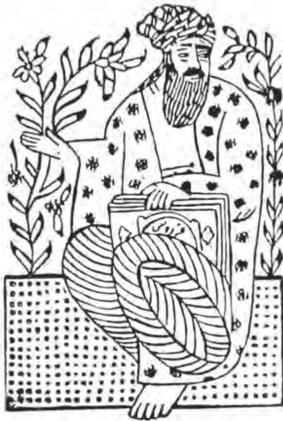
تصویر ۲۳ - نقش فردوسی - حاشیه کتاب چاپ شده با قالب قلمکار - دوره تیموری.

وجود نقش‌های چاپ‌شده بر حاشیه بعضی از کتاب‌های دوره تیموری نیز، نشان از استفاده از قالب‌های چوبی در سده دهم هجری دارد (تصویر ۲۳).