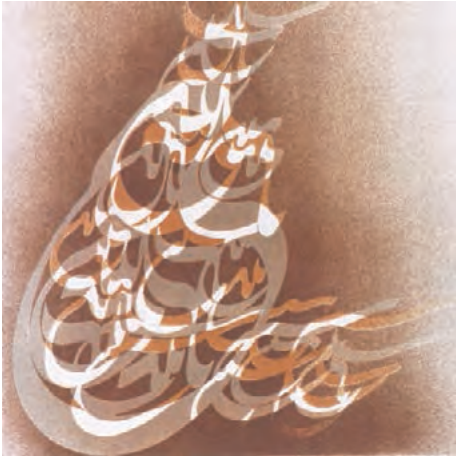
تصویر ۳۶- فرامرز پیلارام - لیتوگرافی - ۱۹۷۲ م.