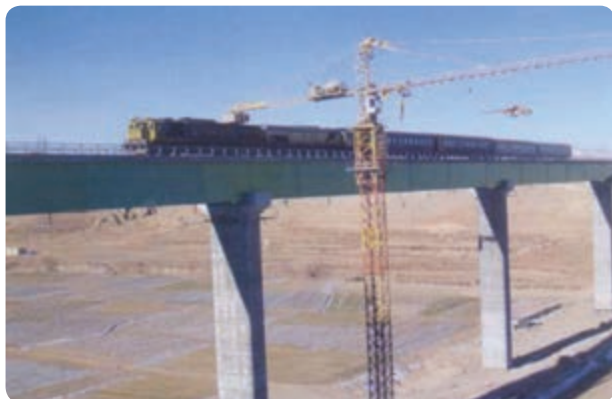
شکل ۴۱-۶ پل ایزده خواست