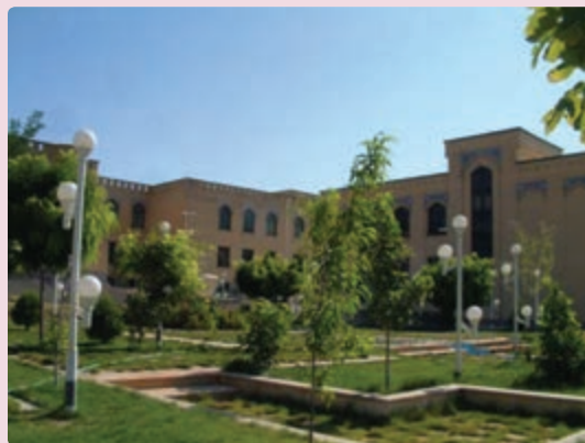
شکل ۳۵- دانشگاه آزاد شیراز

علمی و آموزشی: یکی از ابعاد توسعه همه‌جانبه استان علاوه بر گسترش سوادآموزی، رشد فعالیت علمی و آموزشی در دانشگاه‌ها و توسعه مراکز آموزشی در مقاطع گوناگون تحصیلی در استان فارس بوده است. میزان باسوادی در استان فارس از 49/5 درصد سال 1355 به 87 درصد در سال 1385 افزایش یافته که بیانگر تحول قابل ملاحظه‌ای در سوادآموزی است.