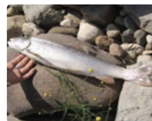
شکل ۱۳-۶ ماهی سرد آبی (اول)