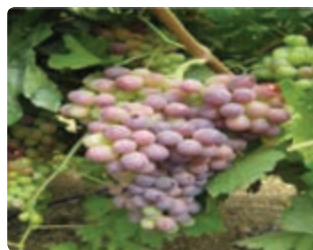
شکل ۵-۶ انگور دیم (اول)