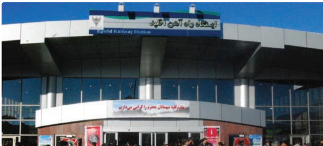
شکل ۲۸-۶- ایستگاه راه آهن اقلید

اگر بخواهیم پرافتخارترین طرح عمرانی استان فارس را در سال‌های اخیر نام ببریم، بی شک راه‌اندازی قطار شیراز - اصفهان است که کلیه مراحل مطالعه - برنامه‌ریزی و اجرای آن در زمان جمهوری اسلامی انجام شده است.