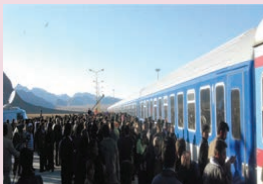
شکل ۴۲-۶ ایستگاه راه آهن