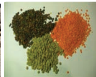
شکل ۱۲-۶ حبوبات آبی (اول)