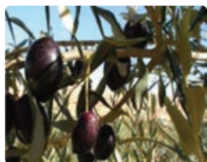
شکل ۱۱-۶ زیتون (اول)