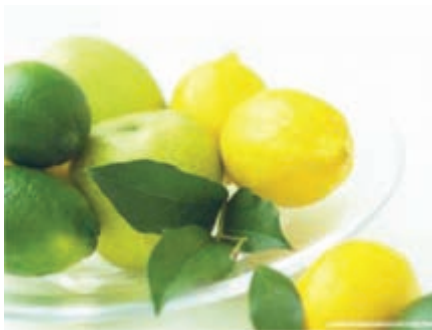
شکل ۱۷-۶ مرکبات (دوم)