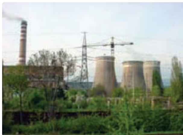
شکل ۳۳- سیکل ترکیبی