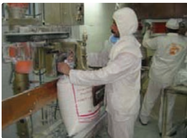
شکل ۳۴- صنایع غذایی بیضا