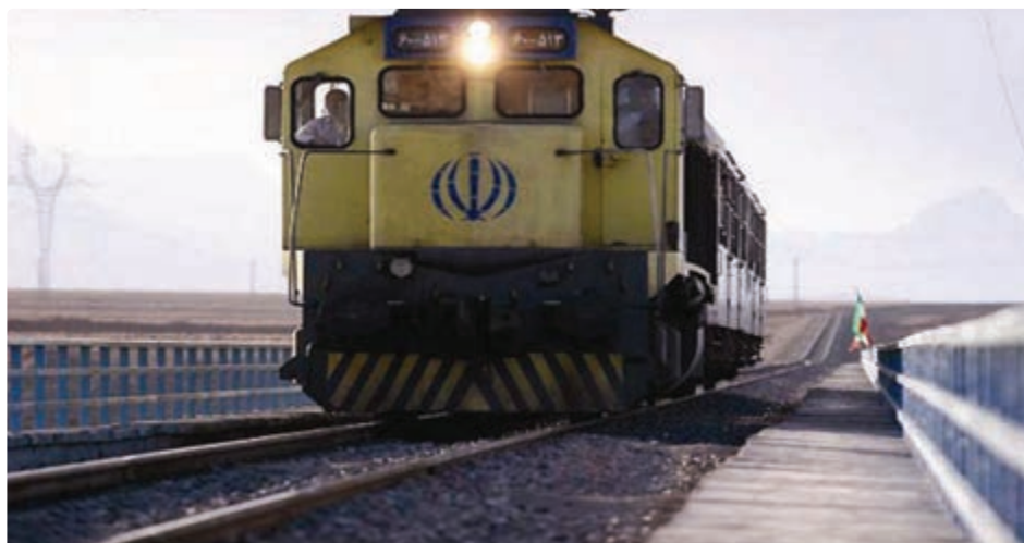
شکل ۳-۶ حمل و نقل و ارتباطات