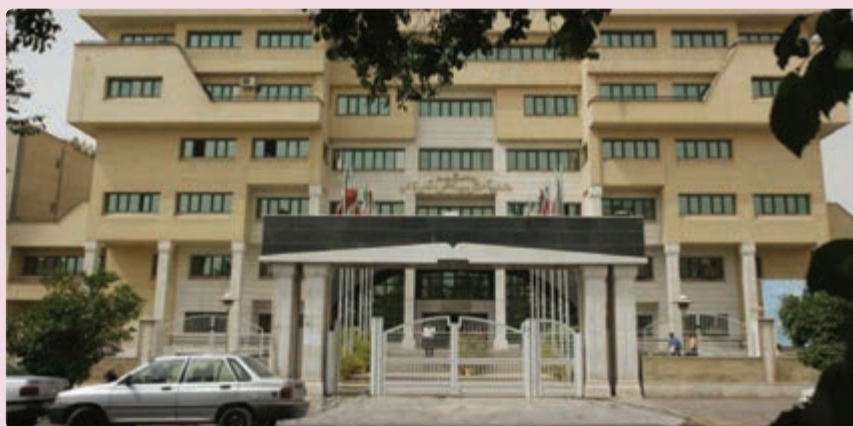
شکل ۳۷- اداره کل آموزش و پرورش استان فارس

از نظر مراکز آموزش عالی نیز تعداد دانشجویان استان در سال 1357 تنها 6470 نفر بوده است که این تعداد در سال 87-1386 به 174,000 دانشجوی دانشگاه دولتی و آزاد اسلامی افزایش یافته است. تأسیس دانشگاه صنعتی شیراز و تبدیل آن به دو بخش دانشگاه شیراز و دانشگاه علوم پزشکی، تأسیس دانشگاه دولتی در فسا، جهرم و ... تأسیس 13 آموزشکده فنی در نقاط مختلف استان، تأسیس دانشگاه مجازی شیراز و تأسیس دوره دکتری در رشته‌های مختلف در دانشگاه شیراز، بخشی از اهداف علمی استان بوده است.