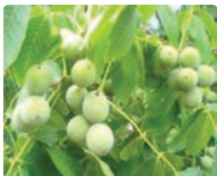
شکل ۱۴-۶ گردو (دوم)