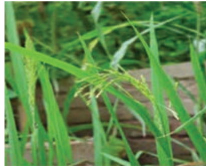
شکل ۱۶-۶ شلتوک (دوم)