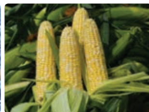
شکل ۸-۶ ذرت دانه‌ای (اول)