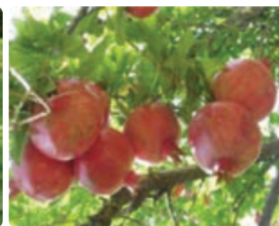
شکل ۴-۶ انار (اول)