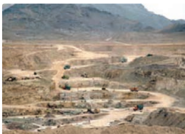
شکل ۳۱- کانی غیرفلزی