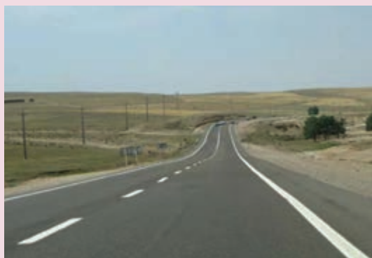
شکل ۴۳-۶ راه های بین شهری

در بخش انرژی کارهای بزرگی در استان فارس شروع شده که علاوه بر گسترش واحدهای تولیدی مجتمع پتروشیمی شیراز پالایشگاه گاز پارسیان که از آن به عنوان نقطه اتکا از کشور یاد می شود، کشف منابع جدید نیز در زمینه نفت در مناطق مختلف استان صورت گرفته است و امید می رود در زمینه صنعت نفت استان فارس قدم های بزرگی در آینده برداشته شود.