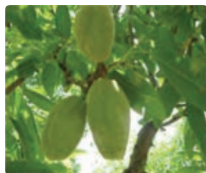
شکل ۷-۶ بادام (اول)