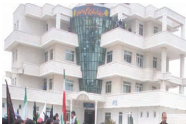
شکل ۲۷-۶- ساختمان فرودگاه لار

براساس آمارهای موجود طول شبکه راه‌های اصلی استان که در سال ۱۳۵۷ برابر ۱۲۲۱ کیلومتر بوده در سال ۱۳۸۶ به حدود ۲۲۲۹ کیلومتر افزایش یافته که ۵۶۹ کیلومتر آن بزرگراه است. تعداد فرودگاه‌های استان نیز که پیش از انقلاب اسلامی تنها به فرودگاه شیراز محدود می‌شد، امروز به شش فرودگاه فعال افزایش یافته است (آیا اسامی این فرودگاه‌ها را می‌دانید؟).