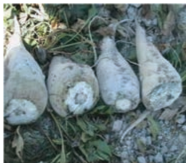
شکل ۱۸-۶ چغندر قند (سوم)