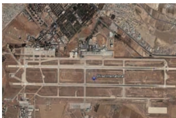
شکل ۲۶-۶- فرودگاه شیراز