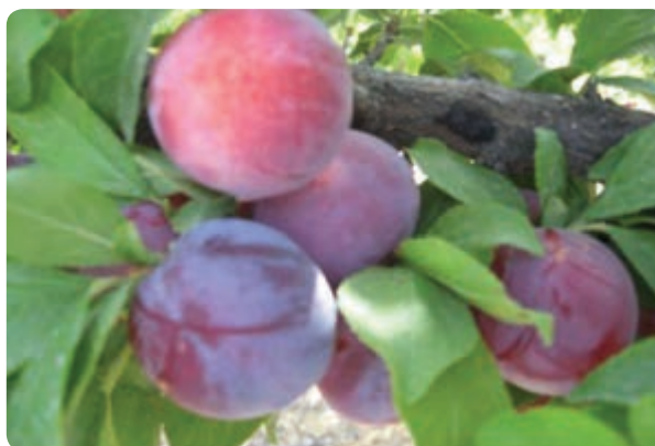
شکل ۴۰-۶ باغداری