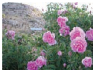
شکل ۱۰-۶ گل محمدی (اول)