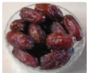
شکل ۱۵-۶ خرما (دوم)