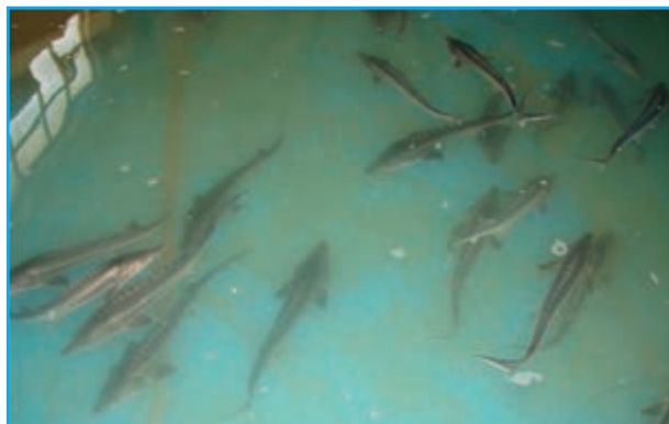
شکل ۷-۱۳ پرورش ماهی