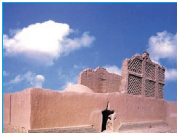
شکل ۳-۱۲- آسباد

۲- ساختمان دادگستری : این بنا در مرکز شهر زاهدان و در دو طبقه ساخته شده است.