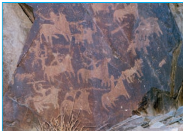
شکل ۱۵-۱۲- سنگ نگاره‌ها

۲- قلعه کنت : این قلعه در شهرستان سیب و سوران در دهستان کنت بخش هیدوچ واقع شده است.