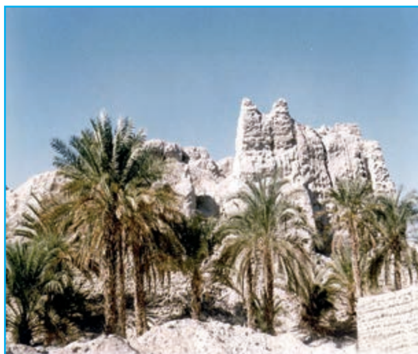
شکل ۱۸-۱۲- قلعه نیک شهر