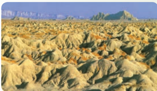
شکل ۳۰-۱۲ کوه‌های مینیاتوری (تپه‌های بدلدنی)

۳- تپه‌های مینیاتوری چابهار (تپه‌های بدلدنی): این تپه‌ها از دیدنی‌های حیرت‌انگیز چابهار است که به موازات ساحل از منطقه کچو تا نزدیک خلیج گواتر امتداد دارد.