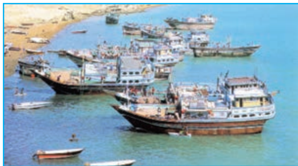
شکل ۱۰-۱۳ لنج‌های صیادی