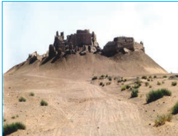
شکل ۱۱-۱۲- قلعه بمپور