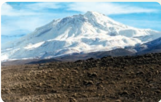
شکل ۲۵-۱۲- کوه تفتان

۲- درخت کهنسال روستای دهپایید : این درخت در نزدیکی شهرستان خاش و در روستای دهپایید قرار دارد. این سرو کهنسال ۱۲۰۰ سال قدمت دارد و دارای تنه ای پهن و شاخ و برگ انبوه است.