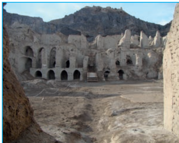
شکل ۲-۱۲- کوه خواجه