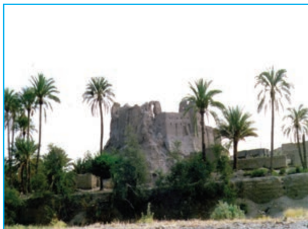
شکل ۹-۱۲- قلعه ایرندگان