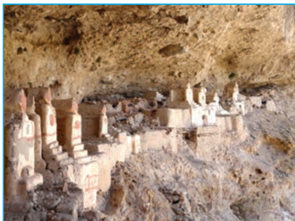
شکل ۸-۱۲- قبرستان هفتاد ملا