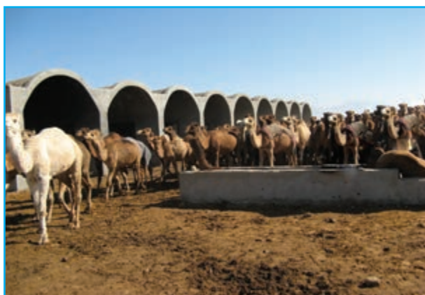
شکل ۶-۱۳- پرورش شتر

از عمده محصولات دامی استان می‌توان به تولید انواع گوشت قرمز، تخم‌مرغ، شیر و سایر تولیدات دامی اشاره کرد. این تولیدات در برخی صنایع دیگر نظیر واحدهای بسته‌بندی گوشت و سایر کارخانجات وابسته مورد استفاده قرار می‌گیرند.