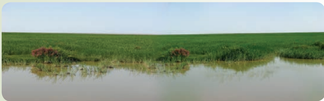
شکل ۲۲-۱۲- دریاچه هامون

۱- دریاچه هامون: بزرگ‌ترین پهنه آب شیرین ایران و زیستگاه انواع پرندگان مهاجر از جمله فلامینگو، پلیکان، درنا، کفچه، انواع اردک، غاز، قو، چنگر(چور) و طاووسک است.