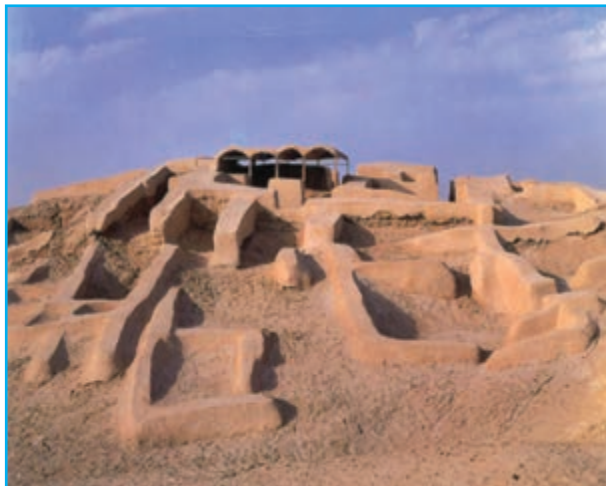
شکل ۱-۱۲- شهر سوخته