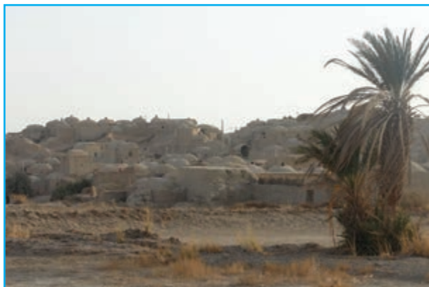
شکل ۴-۱۲- روستای قلعه نو