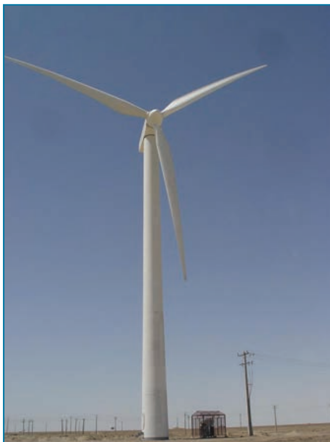
شکل ۱۶-۱۳- نیروگاه بادی