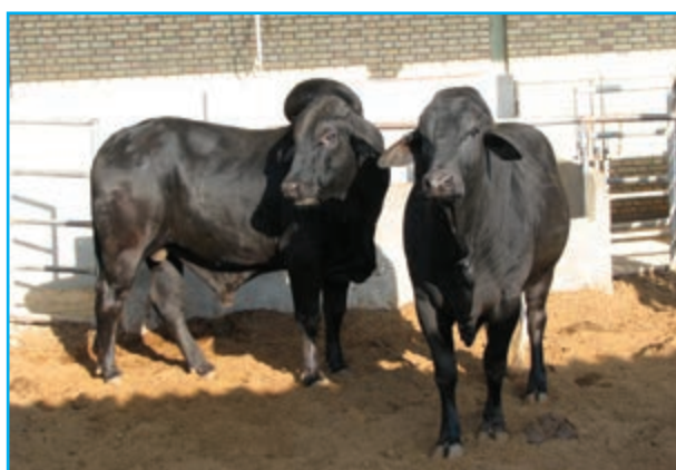
شکل ۵-۱۳- پرورش گاو سیستانی