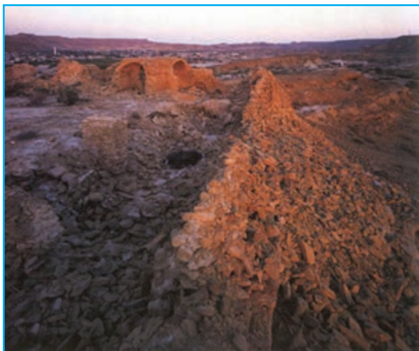
شکل ۲۱-۱۲- قلعه تاریخی تیس