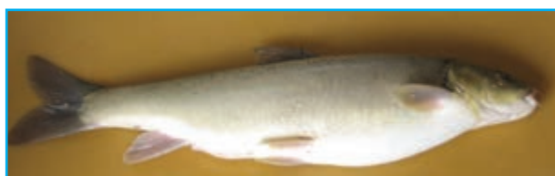
شکل ۸-۱۳ ماهی شیزوتراکس