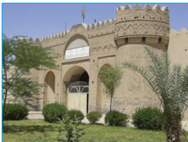
شکل ۱۲-۱۲- قلعه ناصری