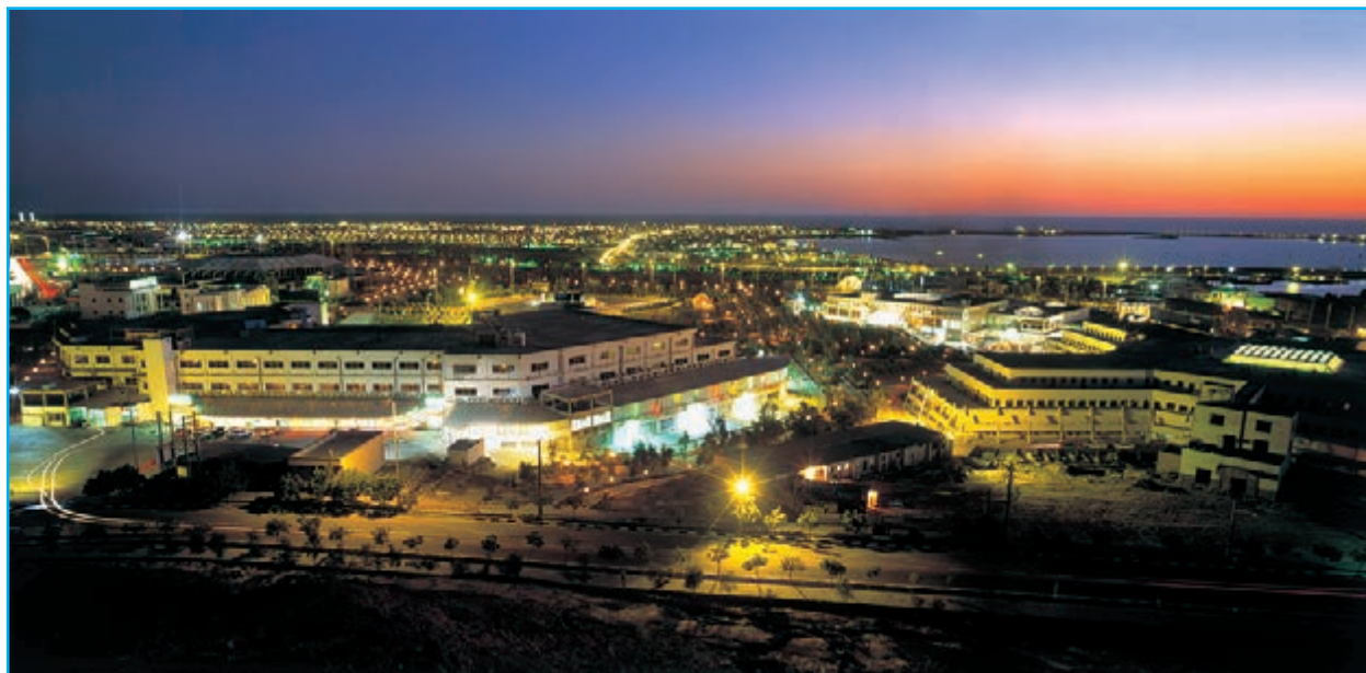
شکل ۳۲-۱۲ منطقه آزاد تجاری و صنعتی چابهار

یکی از نقاط دیدنی و تجاری استان که در سال‌های اخیر در زمینه گردشگری رونق یافته منطقه آزاد تجاری و صنعتی چابهار است و از لحاظ تجاری (صادرات، واردات، ترانزیت کالا) و صنعتی (تولید و بسته‌بندی کالا) اهمیت فراوانی دارد. این منطقه با ایجاد مراکز خدماتی و رفاهی همچون هتل‌ها، رستوران‌ها، پلاژها و مراکز تفریحی یکی از ارکان گردشگری استان محسوب می‌شود.