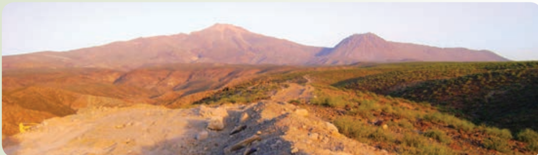
شکل ۲۶-۱۲- کوه بزمان

۱- کوه آتشفشانی (خاموش) بزمان معروف به کوه خضر: این کوه در شمال چالۀ جازموریان با ارتفاع ۳۵۰۳ متر از سطح دریا قرار گرفته است که چالۀ لوت را از چالۀ جازموریان جدا می‌کند. این کوه بعد از تفتان بزرگ‌ترین قله استان است.