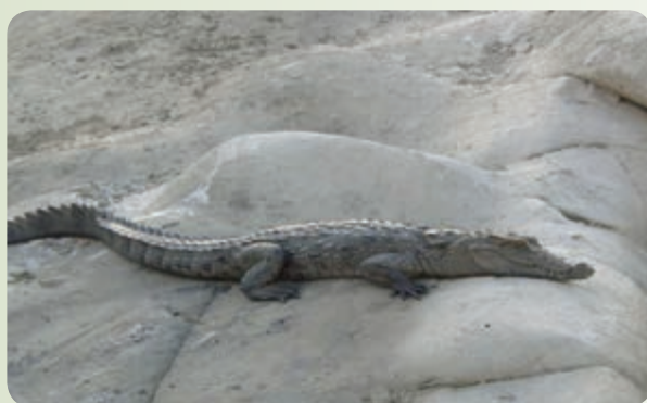
شکل ۲۸-۱۲- تمساح پوزه کوتاه

جانور باقی مانده‌ای از نسل کروکودیل‌هاست که مردم محلی به آن «گاندو» می‌گویند.