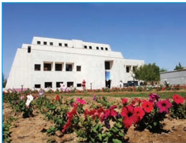
شکل ۶-۱۲- موزه بزرگ زاهدان

۳- تلگراف خانه حرمک : این اثر در روستای حرمک از توابع بخش مرکزی در شمال زاهدان واقع شده است.