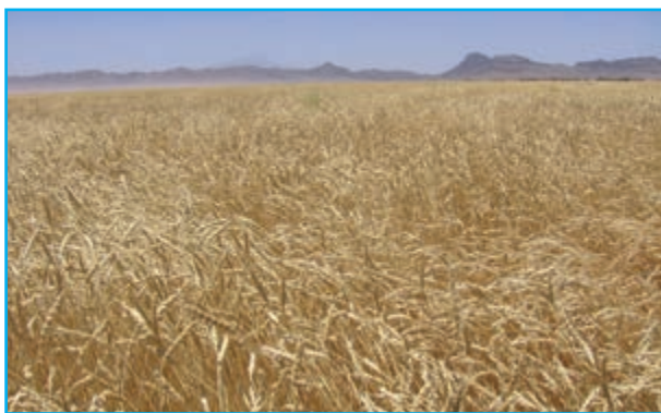
شکل ۱-۱۳- مزرعه گندم