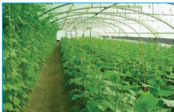
شکل ۴-۱۳- محصولات گلخانه‌ای استان