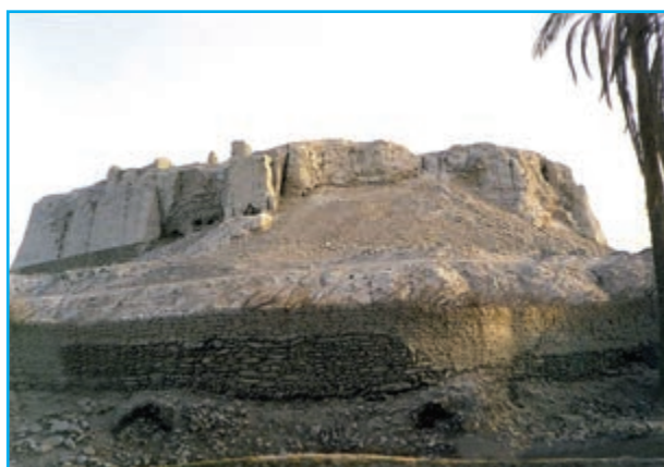
شکل ۱۹-۱۲- قلعه قصر قند