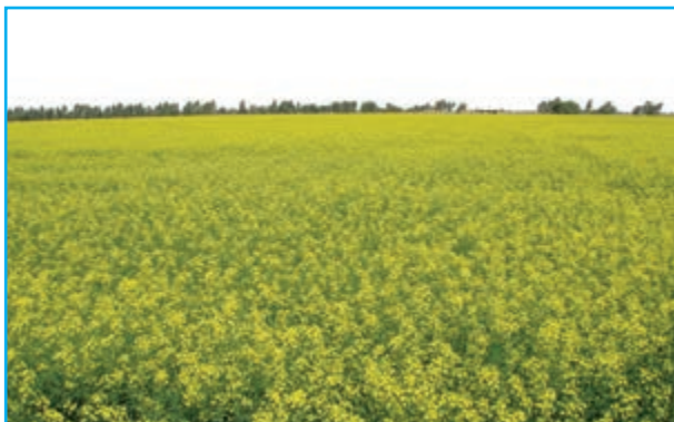
شکل ۲-۱۳- مزارع کلزا