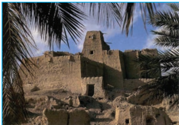
شکل ۱۴-۱۲- قلعه کنت