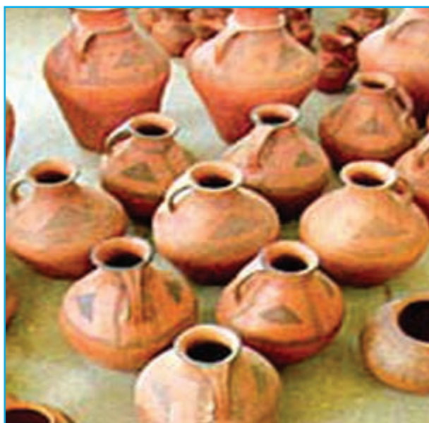
شکل ۱۶-۱۲- سفال کلپورگان