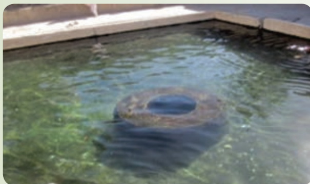
شکل ۲۷-۱۲- چشمه آب‌گرم بزمان