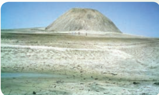
شکل ۳۱-۱۲ گل‌فشان

گل‌فشان‌ها معمولاً به صورت گنبد یا مخروطی شکل و در برخی جاها به صورت حوضچه‌های مملو از آب و گل مشاهده می‌شوند، ابعاد آنها متفاوت است. گل‌فشان‌ها به علت گازهای هیدروکربور یا بخار آب درجه حرارت زیادی دارند و از اعماق زمین به بالا می‌آیند.