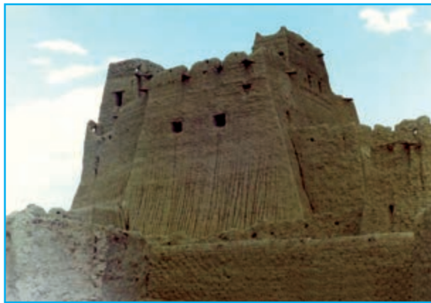
شکل ۱۳-۱۲- قلعه سب