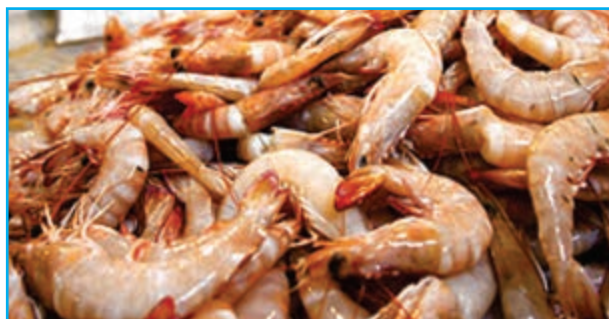
شکل ۹-۱۳ صید میگو