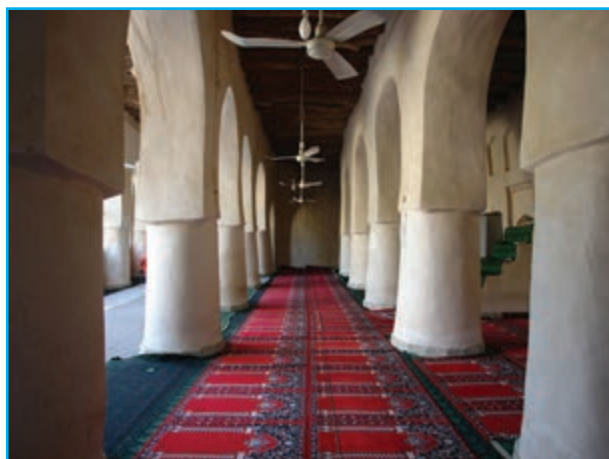
شکل ۱۷-۱۲- مسجد جامع دزک

فاصله این شهرستان تا زاهدان حدود ۳۲۷ کیلومتر است. برخی از جاذبه‌های فرهنگی - تاریخی این شهرستان عبارت‌اند از: مسجد جامع دزک، سفال‌کلپورگان و سنگ‌نگاره‌ها در این شهرستان واقع شده است.