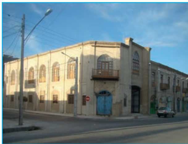
شکل ۷-۱۲- ساختمان دادگستری قدیم