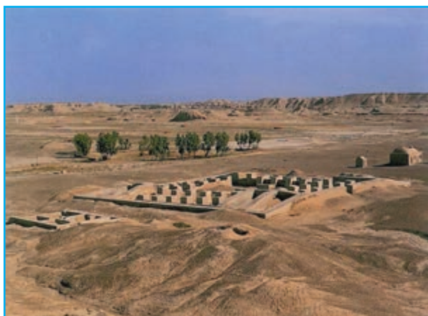
شکل ۵-۱۲- دهانه غلامان