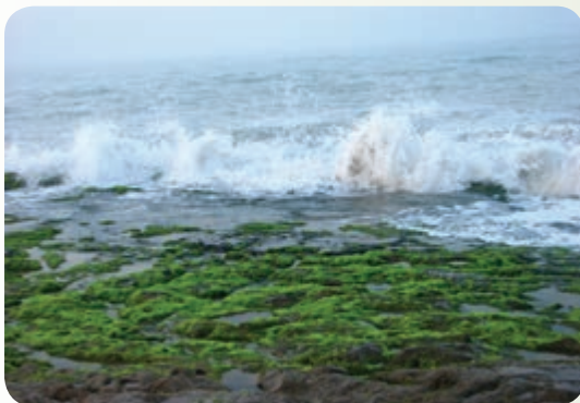
شکل ۲۹-۱۲ ساحل چابهار

منطقه جنگلی بیرگ زابلی : قسمت اعظم این منطقه در شهرستان زابلی واقع شده است. پوشش گیاهی منطقه شامل زیتون وحشی، بادام کوهی و بنه است و حیواناتی همچون سمور سنگی، خرس سیاه، قوچ، میش، کل و بز در این منطقه زندگی می‌کنند.