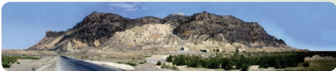
شکل ۲۳-۱۲- کوه خواجه زابل