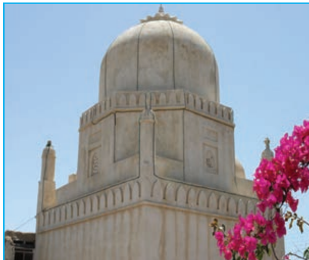
شکل ۲۰-۱۲- مقبره سید غلام رسول