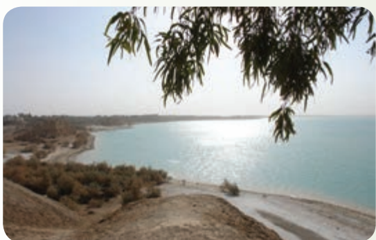
شکل ۲۴-۱۲- چاه نیمه ها

۳- چاه نیمه ها : در جنوب شرقی زابل در کنار روستای قلعه نو (شهرستان زهک) چاله های طبیعی بزرگی وجود دارد که آب رودخانه هیرمند به وسیله کانالی به آن سرریز می شود و به صورت دریاچه مصنوعی در آمده است.