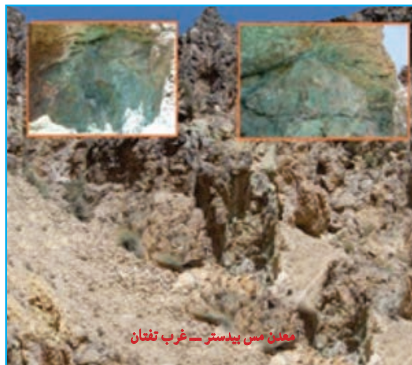
شکل ۱۲-۱۳. معادن سنگ و مس