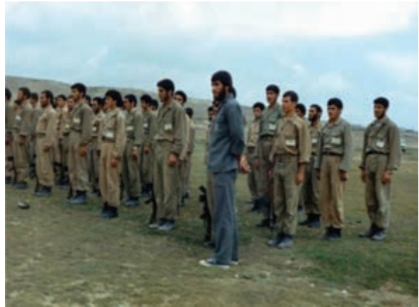
شکل ۱۹-۴ شهید شاپور برزگر (نفر اول)