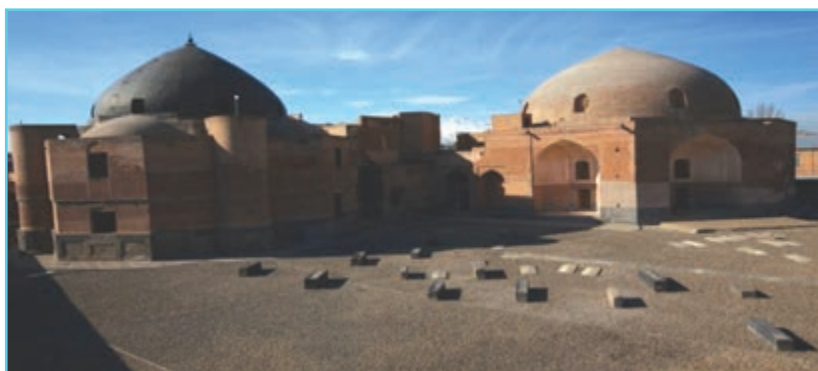
شکل ۴-۵- خانقاه شیخ صفی‌الدین در اردبیل

در دوره ایلخانان به دلیل رشد و گسترش تصوف، خانقاه‌های زیادی در نواحی مختلف ایران بنا شدند که مهم‌ترین آنها خانقاه شیخ صفی‌الدین در اردبیل بود. بزرگی مقام شیخ صفی‌الدین در عرفان باعث شد که اردبیل کعبه آمل و قبله صوفیان شود. علاوه بر مردم، حاکمان و بزرگان نیز احترام خاصی به شیخ صفی‌الدین و فرزندان آنها می‌گذاشتند، به طوری که معروف است امیر تیمور لنگ در ملاقات با شیخ خواجه علی در اردبیل هزاران اسیر عثمانی را به درخواست ایشان آزاد کرد.