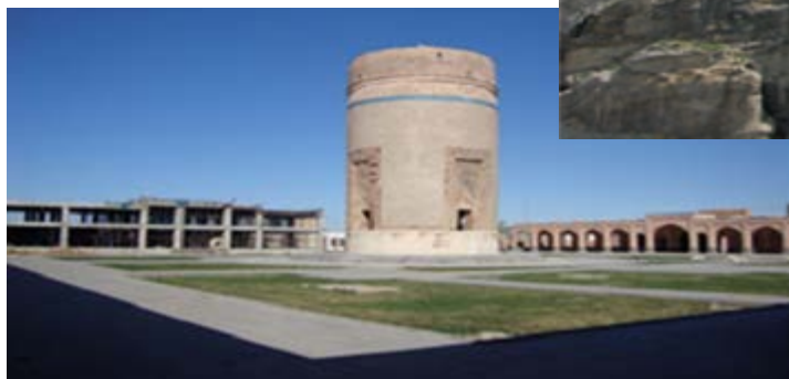
شکل ۱۱-۴ - بقعه شیخ حیدر مشکین شهر

خیابان در دوره صفویه رونق بیشتری داشته است. در زمان شیخ حیدر که حاکم و والی این شهر بوده به دلیل تلاش وی برای رونق و آبادانی آن اهمیتی فوق العاده یافت. در دوره قاجار به ویژه در جنگ های ایران و روسیه این شهر از مراکز بسیار مهم برای استقرار سپاه عباس میرزای ولیعهد بوده است. در سال ۱۲۷۵ ه. ق. لشکریان روس پس از جنگ سختی با توپ و تفنگ و تجهیزات کامل شهر را به مدت ۶ ماه محاصره کرده و پس از سرکوب ایلات شاهسون که به شدت مقاومت می کردند، اموال مردم به عنوان غرامت توسط روس ها به یغما رفت.