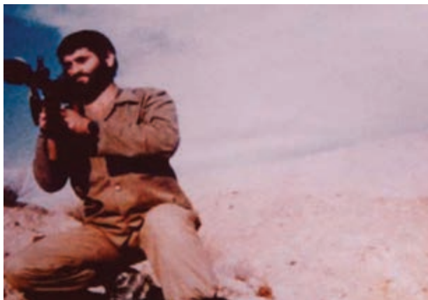
شکل ۲۲-۴- شهید بنام علی محمدزاده