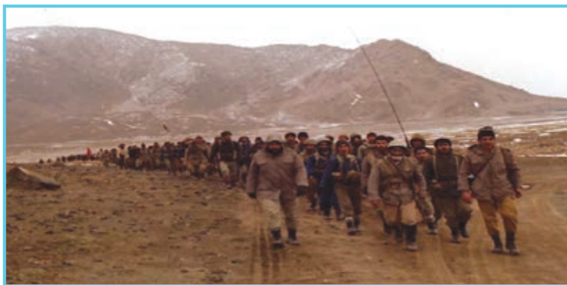
شکل ۱۴-۴- رزمندگان اسلام در جبهه

در طول ۸ سال دفاع مقدس مردم غیرتمند اردبیل در تمامی مراحل جنگ حضور فعال داشتند. از ابتدا تا پایان دفاع مقدس با اعزام ده‌ها هزار نیرو به جبهه‌های نبرد و شرکت در عملیات‌های مختلف حضور مؤثر داشتند. سپاه اردبیل از فعال‌ترین یگان‌ها در طول هشت سال دفاع مقدس بود که در حدود ۳۵۰۰۰ نفر نیرو به جبهه اعزام کرد. دومین یگان