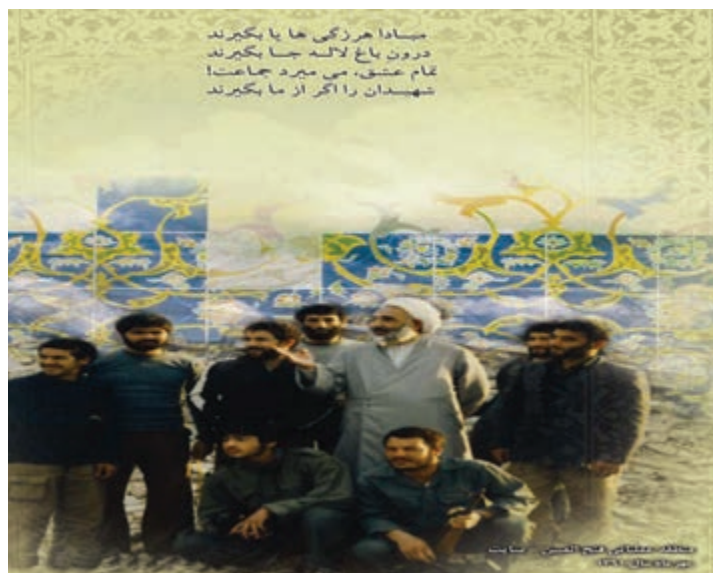
شکل ۱۵-۴ دیدار رزمندگان اردبیل با آیت الله مروج امام جمعه فقید اردبیل

نام یک یا چند شهید دفاع مقدس را در محل زندگی‌تان (روستا - شهر) شناسایی کنید و دربارهٔ چگونگی شهادت آنها تحقیق کرده و گزارشی از آن در کلاس ارائه دهید.