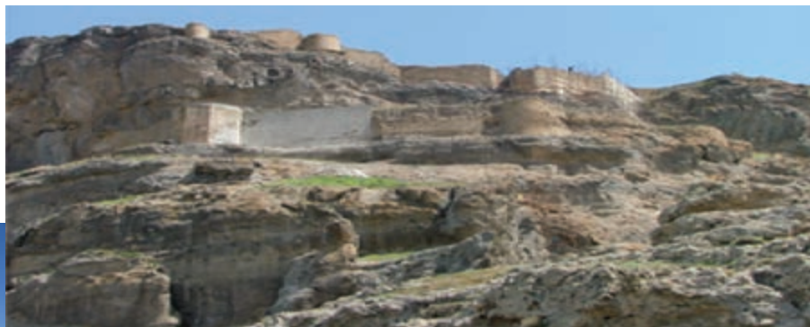
شکل ۱۰-۴ - قلعه قهقهه در مشکین شهر