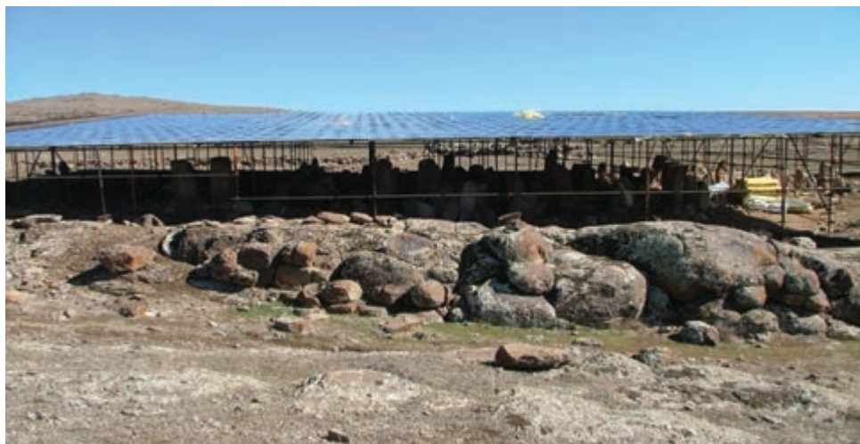
شکل ۱-۴- شهر یری در مشکین شهر مربوط به دوره پیش از تاریخ

با توجه به مدارک موجود باستان‌شناسی، می‌توان گفت منطقه اردبیل حداقل از هزاره ششم قبل از میلاد مسکون بوده است؛ چرا که سراسر منطقه از تپه‌های باستانی یا به عبارت دیگر مناطقی استقرار که روزگاری دژ یا شهرک یا روستا بودند پوشیده شده است مانند شهر یری در مشکین شهر، قلعه اولتان در پارس آباد و بوینی یوغون (دژ بهمن) در نیر.