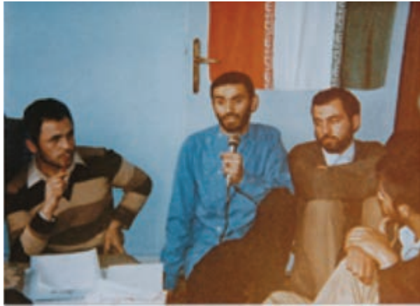
شکل ۲۰-۴ شهید داور یسری (نفر دوم از سمت چپ)