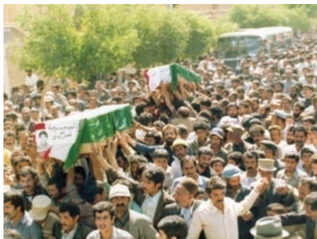
تصویر ۷-۱۱- تشییع پیکر شهدا در زمان جنگ تحمیلی