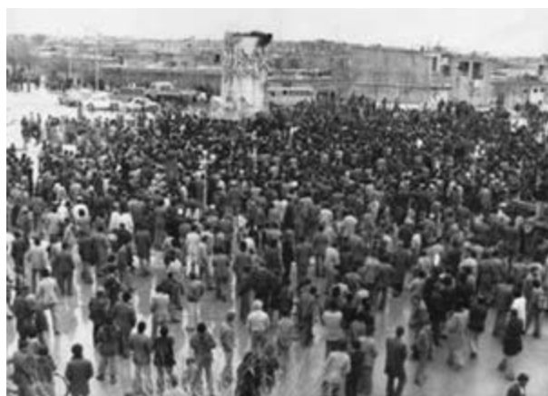
تصویر ۲۳-۱۰- سقوط نماد نظام شاهنشاهی در شهرکرد - دی ماه ۱۳۵۷

در دوره پهلوی، بختیاری‌ها که تمام منطقه را در دست داشتند، به تدریج نقش سیاسی خود را از دست می‌دهند؛ و تشکیلات سیاسی قبیله‌ای متلاشی می‌گردد؛ و با توجه به امنیت نسبی ایجاد شده و رویدادهایی چون اسکان اجباری عشایر – در دوره پهلوی اول – و انجام اصلاحات ارضی – در دوره پهلوی دوم – کوچ روی کم رونق و یکجانشینی گسترش می‌یابد.