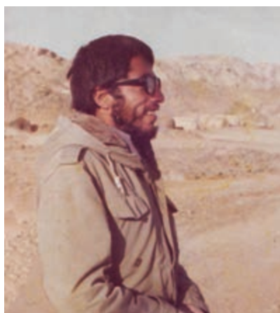
سردار شهید سهراب نوروزی