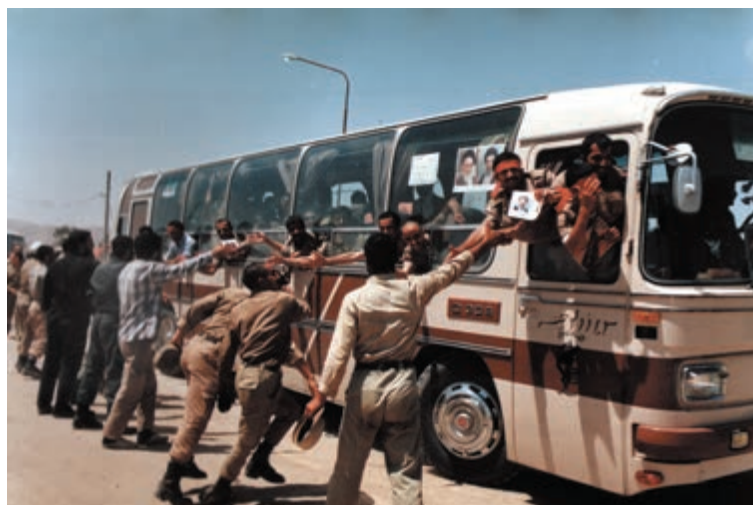
تصویر ۱۰-۱۱- ورود آزادگان به کشور