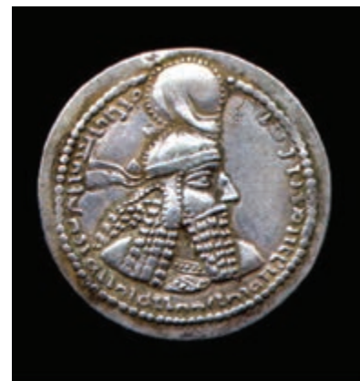
تصویر ۷-۱۰- سکه دوره ساسانی