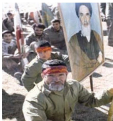
تصویر ۸-۱۱- اعزام رزمندگان اسلام به جبهه (در این نبرد، پیر و جوان، از ایران اسلامی دفاع می‌کردند)