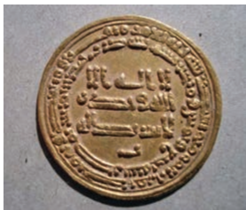
تصویر ۱۰-۱۰- سکه دوره اسلامی