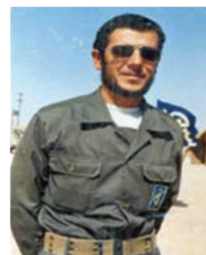
سردار شهید سید کمال فاضل