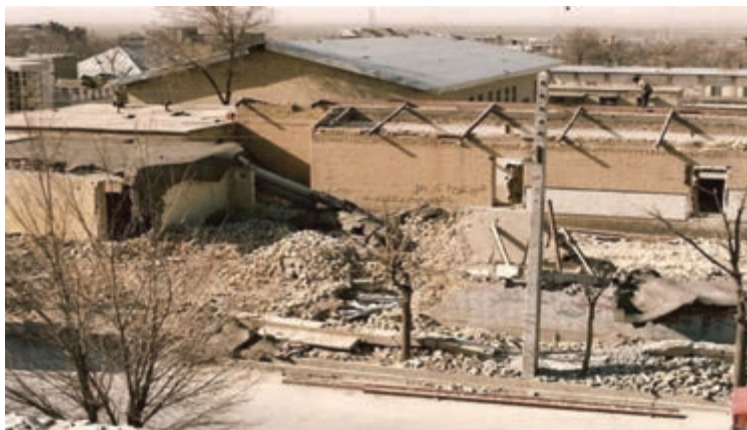
تصویر ۱۱-۱۱- بمباران شهرکرد توسط جنگنده‌های دشمن یعنی در تاریخ ۱۳۶۶/۱۲/۲۰

از آنجایی که مردم استان با تمام توان از رزمندگان اسلام حمایت می نمودند، دشمن یعنی برای شکستن مقاومت آنها، حملات وحشیانه‌ای به شهرکرد انجام داد که در اثر این حملات تعداد ۸۴ نفر از هم استانی‌های ما به درجه رفیع شهادت نایل آمدند.