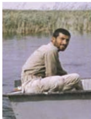
سردار شهید اردشیر غریب