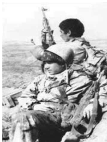
تصویر ۱۱-۱۲- دانش آموزان شهید صحرانورد و خالدي