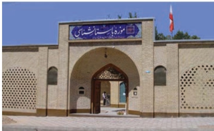
تصویر ۱-۱۰ - موزه باستان‌شناسی شهرکرد

آیا می‌دانید استان چهارمحال و بختیاری، مانند دیگر نقاط کشور ما ایران دارای پیشینه غنی تمدنی و فرهنگی است؟ فکر می‌کنید پیشینه تاریخ و تمدن در استان به چه زمانی باز می‌گردد؟ شما در این درس با برخی از جنبه‌ها و آثار تاریخی و فرهنگی و میراث‌های ماندگار استان خود آشنا می‌شوید.