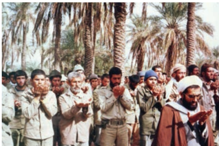
تصویر ۱-۱- رزمندگان استان در جبهه‌های حق علیه باطل

— آیا در مورد اتفاقاتی که در زمان انقلاب و جنگ تحمیلی در استان رخ داده، چیزی شنیده‌اید؟