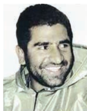
سردار شهید ایرج آقا بزرگی نافچی