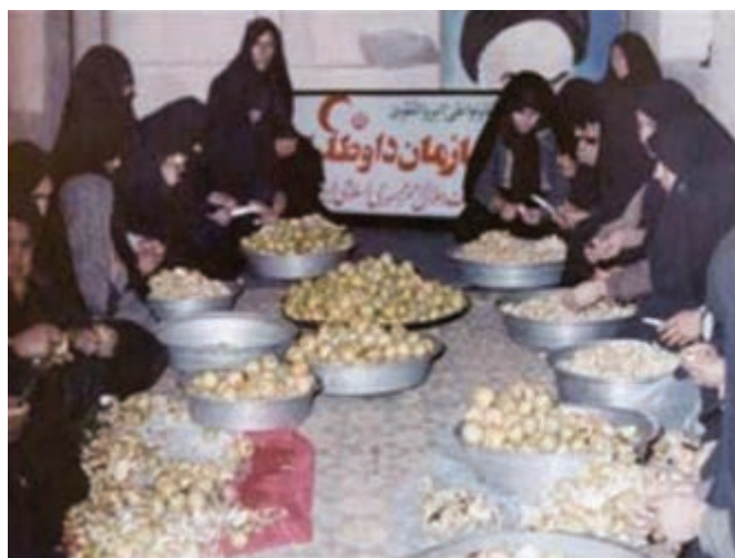
تصویر ۹-۱۱- اهدای کمک‌های مردم استان به جبهه (کارگاه همگام با جبهه)

رزمندگان استان ما از ابتدای جنگ تحمیلی در اغلب عملیات‌ها شرکت نموده و با تشکیل تیپ مستقل ۴۴ قمر بنی‌هاشم (قبل از عملیات محرم) فتوحات زیادی را کسب نمودند. در این میان فرهنگیان و دانش‌آموزان استان نقش بسیار مهمی داشتند و شهدای زیادی را تقدیم اسلام و انقلاب نمودند.