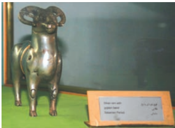
تصویر ۹-۱۰- مجسمه بازمانده از دوره ساسانی

احتمال می‌رود هم زمان با دولت سلوکیان، حکومت محلی «الیمایی» در بخش‌هایی از مناطق غربی منطقه با مرکزیت شهر ایذه تشکیل شده باشد. الیمایی‌ها با استفاده از نبود یک حکومت مرکزی مقتدر پس از سقوط هخامنشیان و نیز شیوه حکومت ملوک الطوائفی اشکانیان، بر قدرت خود افزودند؛ به‌طوری که نواحی جنوب خوزستان تا خلیج فارس را به اشغال خود در آورده و مستقلاً به ضرب سکه پرداختند. اگر چه با تشکیل دولت ساسانی به قدرت حکمرانان الیمایی پایان داده شد. نفوذ سیاسی - اجتماعی، تمدنی و فرهنگی ساسانیان در استان به قدری زیاد بوده که علاوه بر بقایای جاده‌ها و پل‌ها، تعداد زیادی اشیاء تاریخی از جمله سکه و مهر از این دوره بر جای مانده است. بردگوری‌ها نیز از دیرین آثار سنگی استان در دوران قبل از اسلام می‌باشند که در مناطق مختلف پراکنده‌اند.