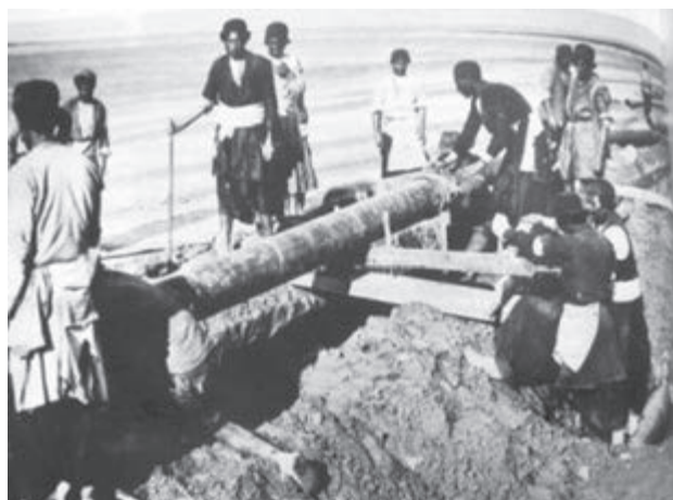
تصویر ۲۲-۱۰. بختیاری‌ها و نفت

از این پس خوانین بختیاری، موفق به دستیابی به مقامات و مناصب مهم دولتی و موقعیت‌های مناسب اجتماعی و اقتصادی شدند. حضور کمپانی «لینچ» در منطقه و قرارداد خوانین بختیاری با آنان برای احداث جاده‌ای کاروان رو که خوزستان را به اصفهان متصل می‌کرد؛ و نیز قرارداد انگلیسی‌ها در مورد نفت جنوب با خوانین بختیاری شرایط و موقعیت‌های مناسبی برای آنان فراهم آورد. کاخ قلعه‌های زیادی از این دوره در مناطق مختلف چهارمحال و بختیاری متعلق به خوانین بر جای مانده است.