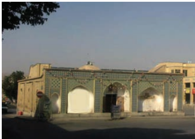
تصویر ۱۳-۱۰ مسجد اتابکان شهرکرد

بعد از تشکیل حکومت اتابکان لُر در سال ۵۵۰ هـ. ق. و قرار گرفتن منطقه چهارمحال و بختیاری در محدوده این حکومت و همجواری با مرکز حکومت آنها یعنی شهر ایذه، بر اهمیت منطقه افزوده شد. اتابکان لُر با ایجاد ثبات و امنیت در منطقه، اقدامات عمرانی متعددی انجام دادند که راه سازی – راه های مالرو – ساخت پل ها، احداث کاروان سراها و مساجد از مهم ترین اقدامات آنان است. دوران اتابکان شاخص ترین دوره اسلامی منطقه است، از همین رو آثار متعددی از این دوره در منطقه چهارمحال و بختیاری شناسایی شده است. از قرن ششم هجری در دوره اتابکان لُر «ایالت جبال» به «عراق عجم» تغییر نام داد؛ بنابراین، استان ما در قلمرو این عنوان قرار گرفت. با انقراض حکومت «اتابکان لُر» در سال ۸۲۸ هـ. ق. توسط تیموریان این منطقه همچنان اهمیت خود را در وقایع دولت تیموریان حفظ کرد.