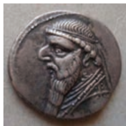
تصویر ۸-۱۰- سکه دوره اشکانی