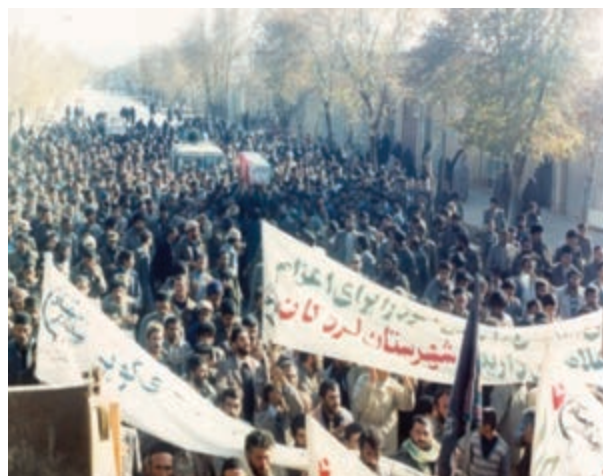
تصویر ۶-۱۱- اعزام رزمندگان اسلام از استان به جبهه‌های نبرد حق علیه باطل

روستاهای شیخ شبان و هرچگان و شهر وردنجان به دلیل تعداد زیاد شهدا نسبت به جمعیت به عنوان روستاهای نمونه کشور محسوب شده‌اند. به عنوان مثال، روستای شیخ شبان با داشتن حدود ۲۵۰۰ نفر جمعیت در زمان جنگ، حدود ۱۰۰۰ نفر رزمنده در جبهه‌ها داشته است که از این تعداد حدود ۸۰ نفر به فیض شهادت نایل آمده‌اند.