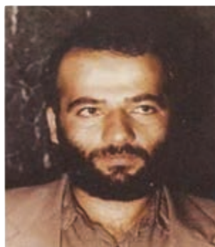
شهید مجتبی استکی