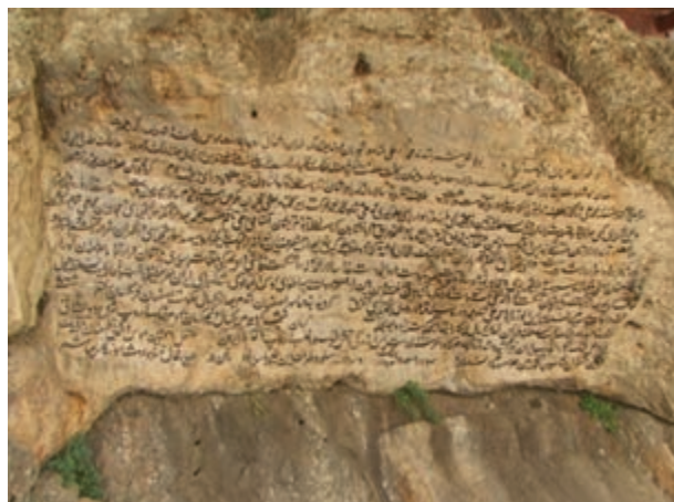
تصویر ۱۹-۱۰- سنگ نوشته مشروطه در پیرغار ده چشمه