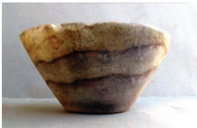
تصویر ۴-۱- ظرف سنگی کتیبه دار دوره هخامنشی