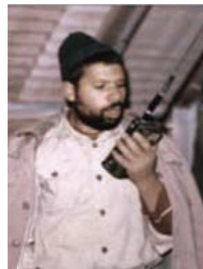
سردار شهید مرتضی اسماعیل زاده