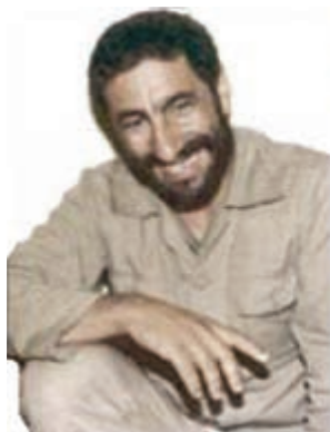
سردار شهید محمدعلی شاه مرادی