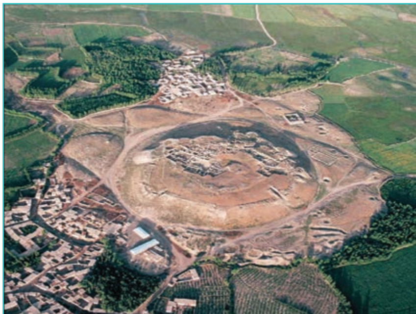
شکل ۱۰-۴ تپه حسنلو- دشت سلدوز نقده

از آثار به دست آمده از هزاره اول ق.م می توان به تپه حسنلو در دشت سلدوز که یکی از مراکز حکومتی متعلق به این دوره است، اشاره نمود. در این تپه ۱۰ طبقه فرهنگی - تاریخی شناسایی شده است که طبقه چهارم آن معماری عظیمی مشتمل بر تالارها، بناهای مذهبی، فضاهای باز اجتماعی با اشیای ذی قیمت که مهم ترین آنها جام حسنلو می باشد، به دست آمده است. این جام از شهرت جهانی برخوردار است و در بدنه آن موضوعاتی درباره باورهای مذهبی متعلق به ساکنان زاگرس حک شده است.