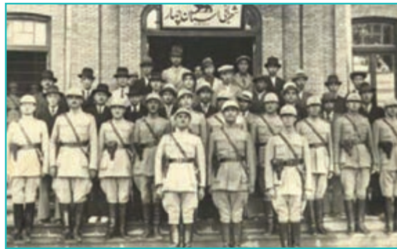
شکل ۲۸-۴- ساختمان شهربانی

در جنگ جهانی دوم در زمان محمد رضا شاه در سال ۱۳۲۰ نیروهای شوروی وارد استان‌های شمال ایران از جمله آذربایجان شدند. این نیروها در آغاز ماه مه ۱۹۴۶ میلادی (۲۱ آذرماه ۱۳۲۵) به دنبال طرح مسئله آذربایجان در سازمان ملل متحد که به شکاف رسمی بین متفقین منجر شد، آذربایجان را تخلیه کردند.