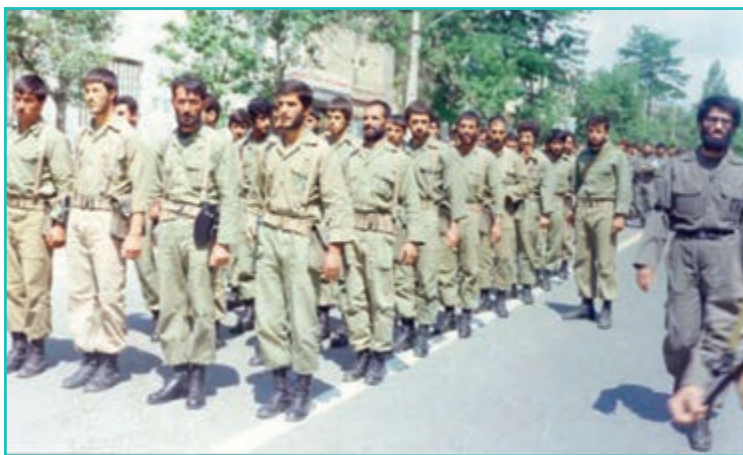
شکل ۳۲-۴- شهید مهدی امینی و حضور نیروهای بسیجی در برقراری امنیت داخلی استان

پس از پیروزی انقلاب اسلامی علی‌رغم تلاش‌های استکبار جهانی در برهم زدن وحدت و ایجاد اغتشاش و بی‌ثباتی در منطقه، مردم استان با هوشیاری تمام و با حفظ وحدت و یکپارچگی توانستند توطئه‌های دشمنان را خنثی کنند و در این راه سرداران بزرگواری همچون شهید امینی، شهید بروجردی، شهید کاوه و... با نثار جان خود موجبات ثبات و امنیت را در استان فراهم کردند.