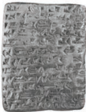
شکل ۱۶-۴ لوح گل پخته بسطام (قره ضیاءالدین ۶۴۵-۶۸۰ پیش از میلاد)

اشپوئینی، منوآ، آرگشتی، رؤسای اول و رؤسای دوم از جمله امپراطوران اورارتو بوده اند. شهر دژ بسطام بزرگ ترین شهر شناخته شده از اورارتو در شمال غرب ایران است و به استناد کتیبه میخی مکشوفه از آن توسط رؤسای دوم ساخته شده است (و آثار اورارتو در جمهوری آذربایجان، ارمنستان، ترکیه، شمال عراق، شرق سوریه و شمال غرب ایران و به خصوص در سطح استان پراکنده است). این آثار در استان آذربایجان غربی شامل شهر دژها، قلاع، مقابر صخره‌ای، یادمان‌های کوهی (کتیبه) و یا برافراشته به خط میخی اورارتوی و یا دو