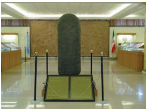
شکل ۱۴-۴ کتیبه کله شین اشنویه

بانی دولت اورارتو، آرامو بود و امپراتوری این دولت توسط ساردوری اول تأسیس شد. مرکزیت این دولت ابتدا آراشکو بود. ساردوری اول مرکز این دولت را به نزدیکی وان منتقل کرد و آن را توشیا نامید.