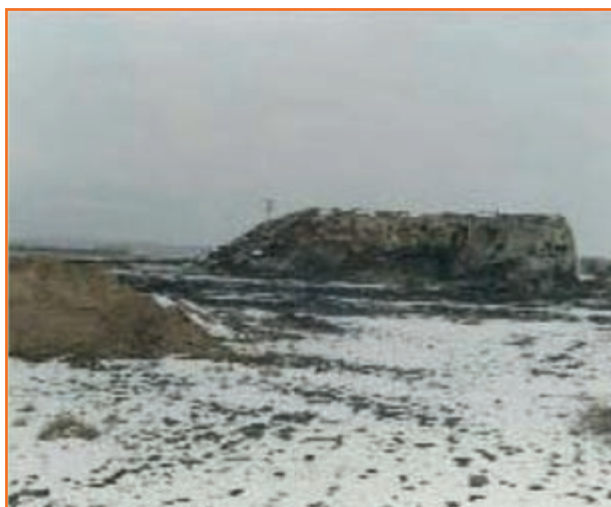
شکل ۲-۴- وضعیت فعلی اهرنجان سلماس