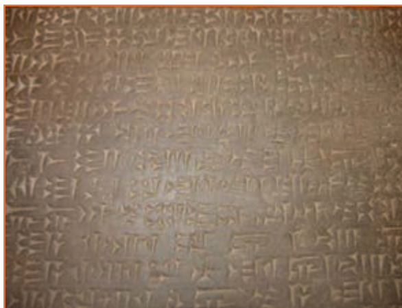
شکل ۱۵-۴ خط میخی مربوط به دوره اورارتو - محمودآباد ارومیه