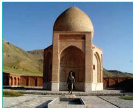
شکل ۲۵-۴- مقبره سید صدرالدین - چالدران