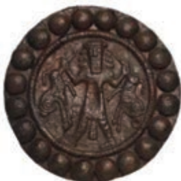
شکل ۴-۷- پلاک مفرغی مکشوفه از گوی تپه (نیمه دوم هزاره دوم پیش از میلاد)