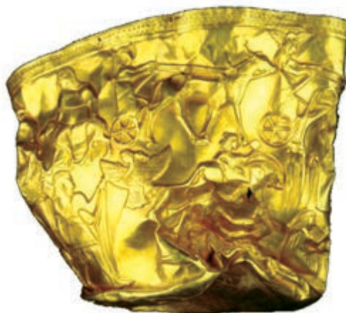
شکل ۱۲-۴ اشیای مکشوفه از حسنلو نقده (نیمه نخست هزاره اول پیش از میلاد)