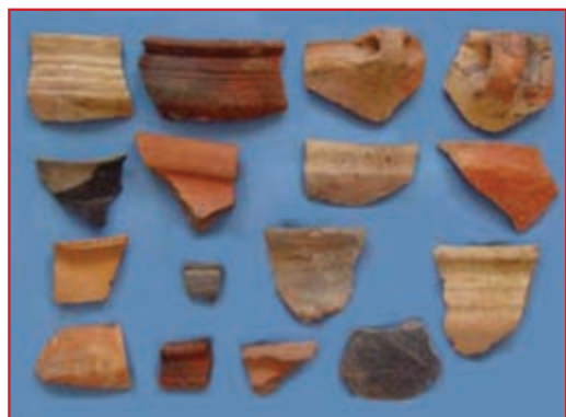
شکل ۴-۴- نمونه ای از سفال های تپه گیجلر ارومیه

۱- حوزه فرهنگی ماوراءالقفقاز (کورا- ارس): در این دوره مهاجران زیادی از این بخش به شمال غرب کشور وارد می شوند و به تعداد سکونت گاه ها و مراکز جمعیتی استان افزوده می شود. از مهم ترین مراکز سکونتگاهی این حوزه می توان به: سهراهی دوز داغی (خوی) تپه گیجلر (ارومیه) یا نخجوان تپه در روستای باغستان ارومیه گوی تپه (ارومیه) و هفتوان (سلماس) اشاره کرد.