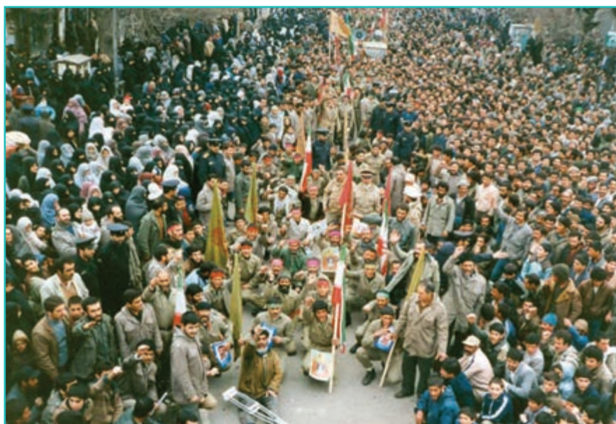
شکل ۳۱-۴- اعزام نیروهای مردمی استان به جبهه‌های حق علیه باطل

۱- نقش رزمندگان و مردم استان آذربایجان غربی در دفاع از مرزهای مشترک به طول ۲۰۰ کیلومتر رزمندگان و مردم قهرمان آذربایجان غربی و دیگر نقاط کشور، در طول دوران دفاع مقدس عملیات‌های غرورآفرین و