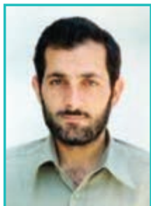
شکل ۳۵-۴- شهید مهدی باکری

شهرستان میاندوآب دیده به جهان گشود، تحصیلات متوسطه را در ارومیه به پایان رسانید و سپس برای ادامه تحصیل در رشته مهندسی مکانیک روانه تبریز شد و در دانشگاه فعالیت‌های سیاسی و مذهبی داشت که پس از پیروزی انقلاب اسلامی به عضویت سپاه درآمد و نقش مؤثری در امنیت و ثبات منطقه در اوایل انقلاب به عهده داشت. همزمان با خدمت در سپاه ۹ ماه به عنوان شهردار ارومیه و مدتی مسئول جهاد سازندگی استان بود. با شروع جنگ به جبهه‌های نبرد شتافت و در عملیات فتح‌المبین به عنوان معاون تیپ نجف اشرف مشغول نبرد گردید و چندین بار از ناحیه چشم و سینه و کمر زخمی شد. به خاطر درایت و رشادت‌ها و صفا و خلوص زیادش به فرماندهی لشکر (۳۱ عاشورا) منسوب گردید و حماسه بیادماندنی زیادی را آفرید در عملیات خیبر برادر و معاون او حمید به جمع شهدا پیوست و خود نیز یک سال بعد ۶۳/۱۱/۱۵ در عملیات بدر به درجه رفیع شهادت نائل گشت.