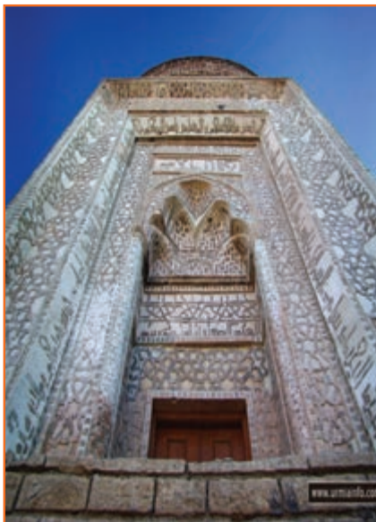
شکل ۲۴-۴- نمای از سه گنبد ارومیه