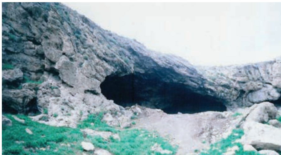
شکل ۱-۴- غار تتمدان - کنار رودخانه نازلو (نازلوچای)

در این دوران آب و هوای استان گرم و بارانی و پیرامون آن جنگل و پر از مرداب و حیوانات وحشی بوده است. انسان‌ها در این دوران در غارهای طبیعی نزدیک رودخانه‌ها می‌زیستند و از طریق شکار امرار معاش می‌کردند و ابزارآلات سنگی را از سنگ چخماق می‌ساختند و حیوانات بزرگ از جمله گوزن، آهو و... را شکار می‌کردند. مدارک فرهنگی این غارنشینان به استناد ابزارهای سنگی به دست آمده به فرهنگ (لوآ لو آژین جدید) معروف است.