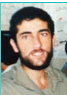
شکل ۳۷-۴- شهید حمید باکری

در شهرستان ارومیه دیده به جهان گشود او نیز چون برادرش از هوش سرشاری برخوردار بود و با وجود یک سال فاصله سنی در تمام امورات مطیع برادرش بود. در سال ۱۳۵۵ به ترکیه و از آنجا به سوریه رفت تا دوره چریکی ببیند. بعد از آن برای تحصیل به آلمان رفت اما با مهاجرت امام خمینی «ره» به پاریس عزیمت نمود با شروع جنگ تحمیلی عازم جبهه‌ها شد و فرماندهی خط مقدم ایستگاه ۷ آبادان را عهده‌دار شد. او در عملیات بیت المقدس نقش مؤثری در گشودن درهای محکم دشمن هنگام ورود به خرمشهر ایفا نمود، سرانجام به عنوان جانشین لشکر ۳۱ عاشورا همراه با برادرش مهدی باکری حماسه آفرینی نمود. در عملیات خیبر همراه با نخستین گروه پیشتاز قبل از آغاز عملیات مخفیانه در خاک دشمن پیاده شد و با بی سیم خبر تصرف پل مجنون را اطلاع داد،