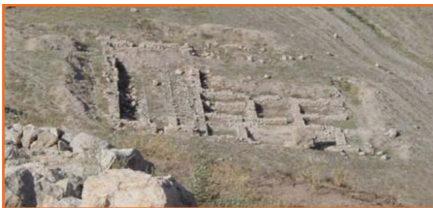
شکل ۱۷-۴ دژ بسطام - قره ضیاءالدین

زبان میخی، اورارتویی و آشوری، معابد کوهستانی است. اورارتوها در فنون نظامی، ایجاد سد، احداث کانال و قنات، باغداری، سفالگری و فلزکاری بسیار توانا بوده اند.