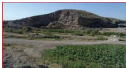
شکل ۴-۵- نمایی از شمال تپه گیجلر ارومیه