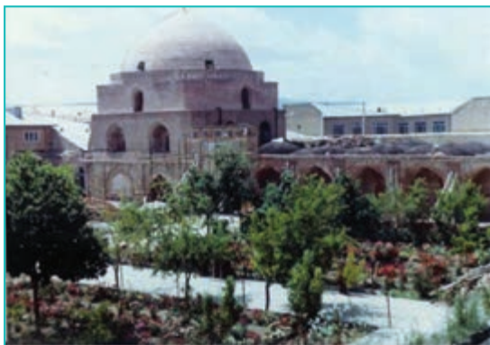
شکل ۲۱-۴- مسجد جامع ارومیه - دوره سلجوقی

سلسله‌های ایرانی بعد از اسلام مانند طاهریان، صفاریان، سامانیان و غزنویان که از شرق ایران برخاسته بودند و حکومت‌های مستقلی را تشکیل داده بودند، هیچ‌گاه نتوانستند قلمرو خود را به آذربایجان برسانند. در این مدت که از سال ۲۰۵ هـ. ق تأسیس سلسله طاهریان شروع و تا سال ۴۲۹ هـ. ق آغاز حکومت سلجوقیان بود، حکومت‌های محلی متعددی قدرت را در آذربایجان به دست گرفتند.