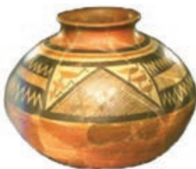
شکل ۴-۶- ظروف سفالی تپه هفتوان سلماس (هزاره دوم پیش از میلاد)