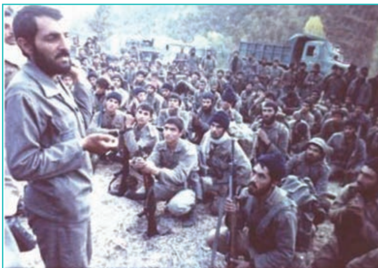
شکل ۳۳-۴- شهید مهدی باکری و نیروهای بسیجی حاضر در جبهه‌های حق علیه باطل

مردم سلحشور و غیرتمند استان همانند سایر هموطنان علاوه بر دفاع از مرزهای استان با حضور در جبهه‌های جنوب و غرب کشور و تقدیم شهدای گرانقدر دین خود را به میهن عزیز ادا کردند و با حضور داوطلبانه خود به یاری مردم سایر استان‌های ایران از قبیل خوزستان، ایلام، کرمانشاه و کردستان شتافتند و در کنار دیگر هموطنان دشمن یعنی را از خاک ایران بیرون کردند. سرداران و فرماندهان سلحشوری همچون شهید مهدی باکری (فرمانده لشکر ۳۱ عاشورا) شهید حمید باکری (معاون لشکر ۳۱ عاشورا) ضمن هدایت رزمندگان