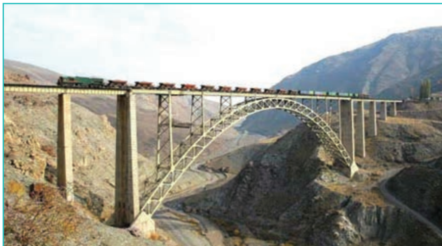
شکل ۲۷-۴. پل هوایی بر روی رود قطور (قطورچای) - خوی

پس از سال ۱۳۰۰ شمسی با روی کار آمدن رضا شاه پهلوی تغییر و تحولات بسیاری در ساختارهای اقتصادی، اجتماعی و شهری کشور صورت گرفت که منجر به ایجاد تشکیلات اداری در درون شهرهای استان و کشور شد.