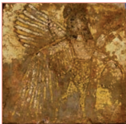
شکل ۹-۴- تصویر انسان بالدار بر روی آجر