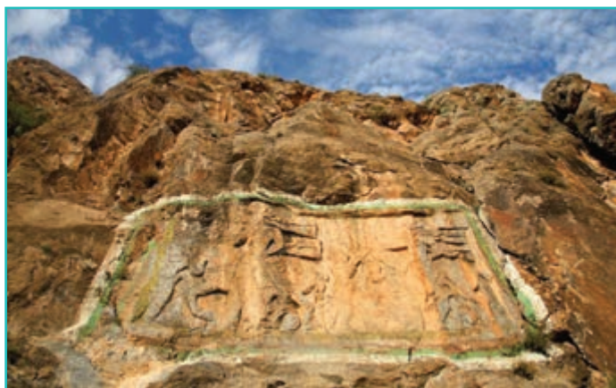
شکل ۲۰-۴- نقش برجسته خان تختی سلماس - دوره ساسانیان

پس از شکل‌گیری حکومت‌های ماد، هخامنشیان و اشکانیان نوبت به ساسانیان رسید. ساسانیان بنیانگذار اولین سلسله مذهبی در ایران بودند. در این دوره، استان آذربایجان غربی به دلیل وجود یکی از سه آتشکده مهم ساسانیان یعنی بنای آذرگشسب در تخت سلیمان تکاب از اهمیت زیادی برخوردار بوده است. تخت سلیمان مجموعه‌ای از کاخ‌ها و بناهای مذهبی است و همگی پیرامون یک دریاچه کوچک پرآب به وجود آمده‌اند. تخت سلیمان دارای برج و بارو دو دروازه است و آتشکده آذرگشسب که در آن آتشکده شاهی و سپاهیان نگهداری می‌شده داخل این مجموعه واقع شده است. از دیگر آثار مهم این دوره می‌توان به نقش برجسته خان تختی در سلماس که تصویری از دو سوارکار است، اشاره کرد. عده‌ای از محققین این نقش برجسته را متعلق به اردشیر و پسرش شاپور اول می‌دانند. کلیسای آشوری مار سرکیس واقع در دامنه‌های کوه سیر ارومیه از دیگر آثار مهم این دوره است.