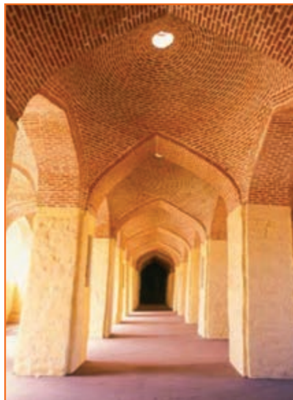
شکل ۲۳-۴- نمای از داخل مسجد جامع ارومیه

میان سپاهیان شاه اسماعیل صفوی و سلطان سلیم عثمانی شد. بنای یادبود سید صدرالدین شیرازی وزیر اعظم شاه اسماعیل صفوی و شهدای جنگ چالدران در نزدیکی سیه چشمه گواهی بر این ادعاست. از دیگر آثار مهم دوره صفوی می‌توان به بازار شهر خوی، قلعه مرزی بردوک (در سرو ارومیه که دارای فضاهای تدافعی، مسجد و آب‌انبار است)، سدسنگی تازه شهر سلماس، سد قورومیش در نزدیکی بوکان اشاره کرد. پس از سقوط دولت صفویه آذربایجان به دست دولت عثمانی افتاد. دیری نپایید که نادر شاه افشار آذربایجان را از تصرف دولت عثمانی بیرون آورد و در دشت مغان در سال ۱۱۴۸ هـ. ق (۱۷۳۵ میلادی) تاجگذاری کرد.