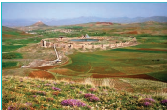
شکل ۱۹-۴- مجموعه تخت سلیمان و کوه زندان - تکاب