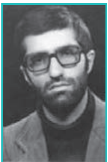
شکل ۳۶-۴- شهید مهدی امینی

شد پس از طی تحصیلات متوسطه در سال ۱۳۵۰ وارد دانشگاه علم و صنعت تهران شد. در رشته مهندسی ساختمان تحصیل خود را به پایان رساند وی مبارزات انقلابی خود را از دوران دانشجویی آغاز کرد. پس از پیروزی انقلاب و با شروع جنگ تحمیلی عازم جبهه‌های جنوب شده و دوش به دوش سردارانی چون باکری و ... در آبادان در جبهه‌های جنگ مشغول نبرد شد. در بهمن ۱۳۵۹ با دعوت سپاه به ارومیه بازگشت و فرماندهی عملیات این شهر را به عهده گرفت و با صلاحیت و درایت تمام در جهت اعتلای ثبات و امنیت استان به درجه رفیع شهادت نائل آمد.