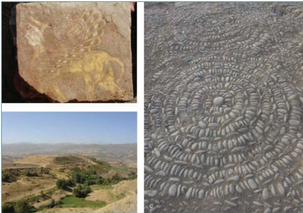
شکل ۱۳-۴ تپه ربط سردشت و آثار مربوط به آن

یکی دیگر از مراکز حکومتی متعلق به سده هفتم و هشتم ق. م (که فعلاً نام آن مشخص نیست) در منطقه جنوب غربی استان در ربط از توابع سردشت بوده است. از این محل خطوط میخی منقوش روی آجر به دست آمده است.