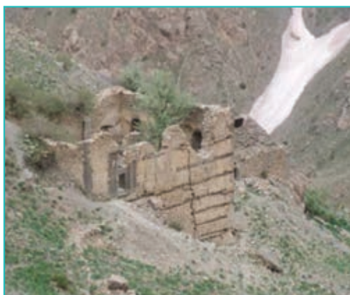
شکل ۲۶-۴- قلعه بردوک - سرو ارومیه

میان سپاهیان شاه اسماعیل صفوی و سلطان سلیم عثمانی شد. بنای یادبود سید صدرالدین شیرازی وزیر اعظم شاه اسماعیل صفوی و شهدای جنگ چالدران در نزدیکی سیه چشمه گواهی بر این ادعاست. از دیگر آثار مهم دوره صفوی می‌توان به بازار شهر خوی، قلعه مرزی بردوک (در سرو ارومیه که دارای فضاهای تدافعی، مسجد و آب‌انبار است)، سدسنگی تازه شهر سلماس، سد قورومیش در نزدیکی بوکان اشاره کرد. پس از سقوط دولت صفویه آذربایجان به دست دولت عثمانی افتاد. دیری نپایید که نادر شاه افشار آذربایجان را از تصرف دولت عثمانی بیرون آورد و در دشت مغان در سال ۱۱۴۸ هـ. ق (۱۷۳۵ میلادی) تاجگذاری کرد.