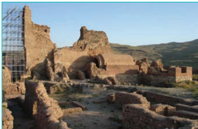
شکل ۱۸-۴- مجموعه تخت سلیمان - تکاب