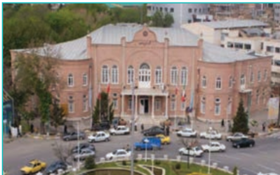
شکل ۲۹-۴- ساختمان شهرداری