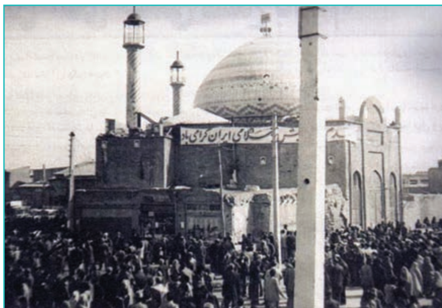
شکل ۳۰-۴- مسجد اعظم ارومیه و حضور گسترده مردم در انقلاب

در جنگ جهانی دوم در زمان محمد رضا شاه در سال ۱۳۲۰ نیروهای شوروی وارد استان‌های شمال ایران از جمله آذربایجان شدند. این نیروها در آغاز ماه مه ۱۹۴۶ میلادی (۲۱ آذرماه ۱۳۲۵) به دنبال طرح مسئله آذربایجان در سازمان ملل متحد که به شکاف رسمی بین متفقین منجر شد، آذربایجان را تخلیه کردند.