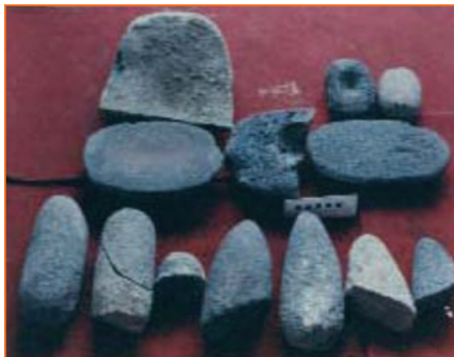
شکل ۳-۴- ابزار سنگی مکشوفه از اهرنجان سلماس

مردم این روستاها کشاورز و دامدار بوده‌اند و ظروفی سفالی می‌ساخته‌اند که در آن خمیره‌های گل و گیاه و کاه به طور ناقص پخته می‌شده است. این ظروف در دو نوع ساده یا منقوش ساخته شده، موضوع نقش‌های آن خطوط ساده هندسی بوده است. در این روستاها ابزارهای سنگی زیادی به دست آمده است که شامل تیغه‌های بلند و ابزارهای سنگی کوچک و بزرگ دیگر است که همه از جنس اُبسیدین می‌باشند.