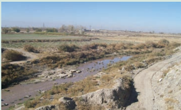
شکل ۶۳-۱- بخشی از مسیر کشف رود در حاشیه شهر مشهد

رودخانه کشف رود که در گذشته مظهر پاکی و به دریا معروف بود، اکنون با ورود فاضلاب‌های انسانی و صنعتی حاشیه شهر مشهد به این رودخانه، تبدیل به یکی از مهم‌ترین مظاهر آلودگی زیست محیطی منطقه شده است. فاضلاب‌های صنعتی حاصل بخشی از فعالیت‌های شهرک صنعتی، واحدهای آبکاری، صنایع پوست و چرم، واحدهای قالیشویی و فاضلاب‌های خانگی مسیر رودخانه هستند که به‌طور غیر قانونی به بستر آن وارد شده و باعث آلودگی شدید آب شده‌اند. متأسفانه برخی کشاورزان منطقه در حاشیه این رودخانه آلوده برای آبیاری زمین‌های کشاورزی به ویژه صیفی کاری استفاده می‌کنند و محصولات حاصل از این شیوه نادرست آبیاری در نهایت وارد بازار مصرف و به خصوص شهر مشهد می‌شود.