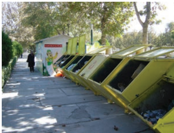
شکل ۶۴-۱- ایستگاه‌های ثابت جمع‌آوری زباله مشهد

بازیافت زباله باعث کاهش آلودگی‌های زیست محیطی، حفظ منابع و ذخایر زیرزمینی، کاهش وابستگی به خارج در زمینه کالا و مواد اولیه و به‌طور کلی جلوگیری از اتلاف منابع و سرمایه‌های ملی می‌شود.