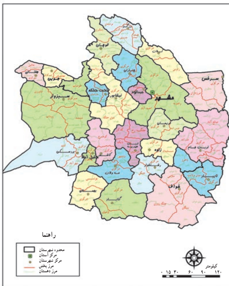
شکل ۱-۲ نقشه تقسیمات سیاسی استان خراسان رضوی

خراسان که عظمت آن در تاریخ این مرز و بوم از سابقه‌ای دیرینه برخوردار است، به سبب موقعیت جغرافیایی، تاریخی و فرهنگی خود همواره در ادوار تاریخی از بخش‌های اصلی ایران زمین محسوب و به‌عنوان بزرگترین استان شرقی از آن نام برده شده است. امروزه استان خراسان رضوی بخش اصلی خراسان بزرگ را شامل می‌شود که وجود نگین ولایت و امامت به آن تقدسی خاص بخشیده است. بر اساس آخرین تقسیمات سیاسی استان خراسان رضوی شامل ۲۷ شهرستان، ۶۹ بخش، ۱۶۳ دهستان و ۷۲ شهر می‌باشد.