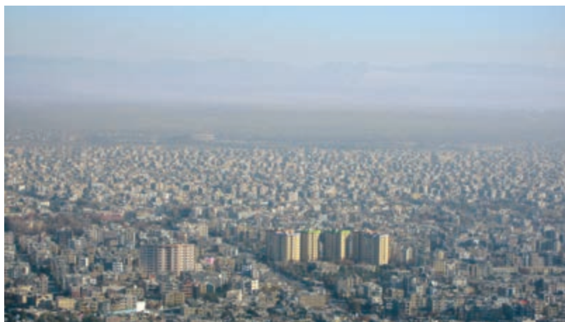
شکل ۶۱-۱- نمایی از آلودگی هوا در شهر مشهد

آلودگی هوا بیشتر در شهرها و به ویژه مشهد مطرح است، زیرا بیش از ۵۰ درصد جمعیت استان را در خود جای داده است. منابع آلودگی هوای شهرها عبارتند از: الف) منابع ایستا: واحدهای صنعتی، کارگاهها، مناطق مسکونی و تجاری.