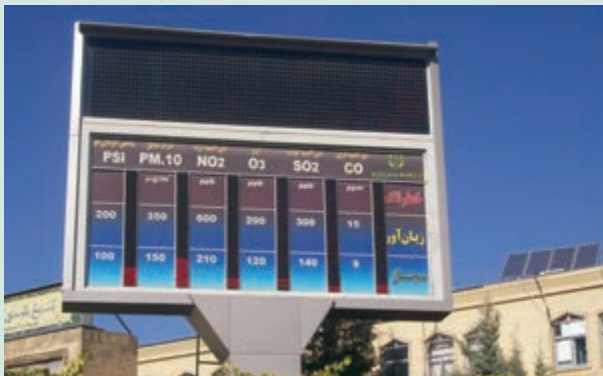
شکل ۶۲-۱- ایستگاه پایش کیفیت هوا- صدف (ترافیکی)- بلوار وکیل آباد- جمعه ۱۳۸۹/۹/۲۶

آلاینده هایی که در هوای شهر از طریق سوخت خودروها و سایر موارد تولید می شوند بیشتر شامل: منواکسید کربن CO، دی اکسید نیتروژن NO 2 ، دی اکسید گوگرد SO 2 ، ازن O 3 و ذرات معلق (Dust) است. اداره کل حفاظت محیط زیست در سطح شهر از طریق ۱۲ ایستگاه پایش کیفیت هوا اقدام به جمع آوری اطلاعات از گازها و ذرات معلق در هوای شهر می نماید. شکل ۶۲-۱ برخی از این آلاینده ها را نشان می دهد.