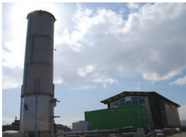
شکل ۶۵-۱- نیروگاه بیوگاز مشهد با تولید ۶۰۰ کیلو وات ساعت برق

مؤثرترین راه کاهش مضرات و هزینه‌های دفع زباله، جداسازی در مبدأ است که از آلودگی ناشی از مخلوط شدن و فعل و انفعالات شیمیایی پیشگیری می‌نماید و تبدیل آن به محصولات جدید و قابل استفاده را در بر دارد. البته این امر نیازمند مشارکت وسیع شهروندان است. تولید روزانه ۱۸۰۰ تن زباله در شهر مشهد و هزینه‌های سنگین مالی و زیست محیطی برای دفن و یاسوزاندن آن باعث شده است که بازیافت، تولید کود (کمپوست) و احداث کارخانه‌های پیو گاز و... در استان مورد توجه قرار گیرد.