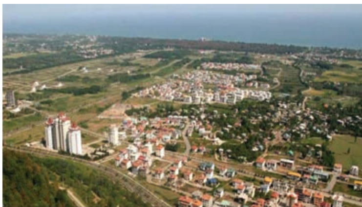
شکل ۵-۲- مسکن شهری