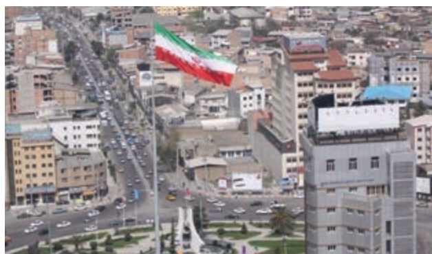
شکل ۹-۲- میدان ساری

به نظر شما اثرات مثبت و منفی مهاجرت به استان مازندران چیست؟