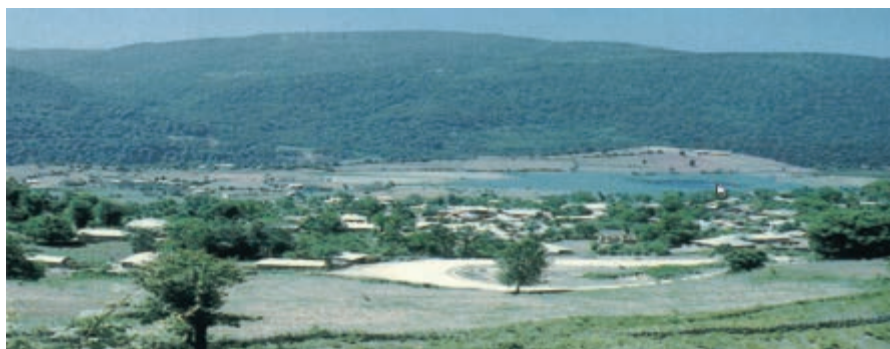
شکل ۲-۲- روستای پراکنده

امروزه دو نوع شیوه زندگی در استان مازندران وجود دارد: زندگی روستایی، زندگی شهری. زندگی روستایی: شکل‌گیری و نوع زندگی روستایی در استان تحت تأثیر عواملی از قبیل: آب و هوا، پوشش گیاهی، خاک، شرایط زیستی و فرهنگی، فعالیت‌های اقتصادی و توانمندی‌های محیط اطراف می‌باشد. مسکن از نظر شکل، از نوع پراکنده است که علت آن وجود آب و هوای مساعد، آب فراوان و خاک مناسب می‌باشد.