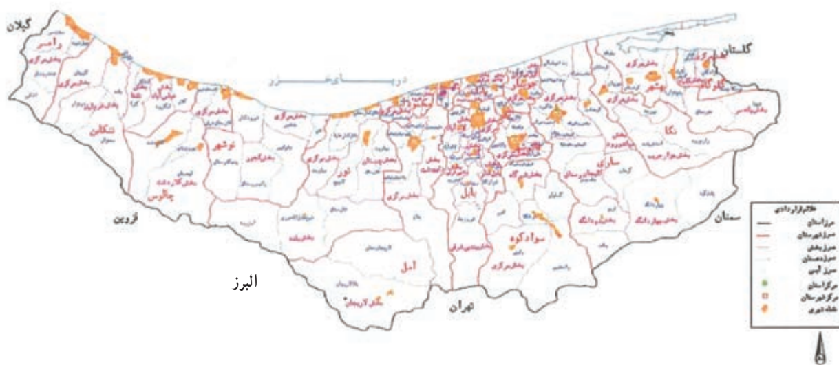
شکل ۱-۲- نقشه تقسیمات سیاسی استان مازندران سال ۱۳۸۷

استان مازندران بر اساس آخرین تقسیمات کشوری دارای ۱۹ شهرستان به نام‌های آمل، بابل، بابلسر، بهشهر، تنکابن، عباس آباد، جویبار، چالوس، رامسر، ساری، سوادکوه، قائم شهر، گلوگاه، محمود آباد، نکا، نور، نوشهر، فریدونکنار و میاندورود، ۵۲ شهر، ۴۶ بخش و ۱۱۷ دهستان می‌باشد.