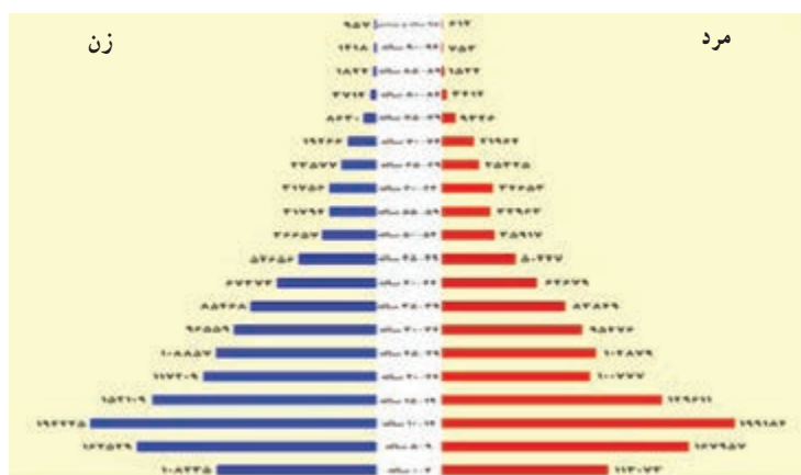
شکل ۲-۷- هرم سنی جمعیت ۱۳۷۵