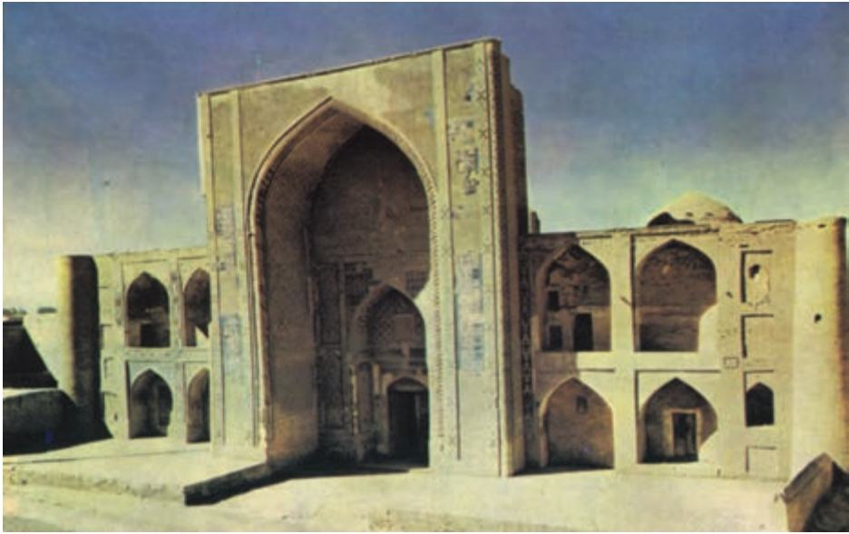
بخارا - مدرسه الغ بیگ - سال ۱۴۹۷ م

خالی دل مرا تو ز تاب و توان مردان شیر ژبان میان نیتان نهفته است پنداشتی که ریشه پیوند من گست در سینه ام هزار خراسان نهفته است