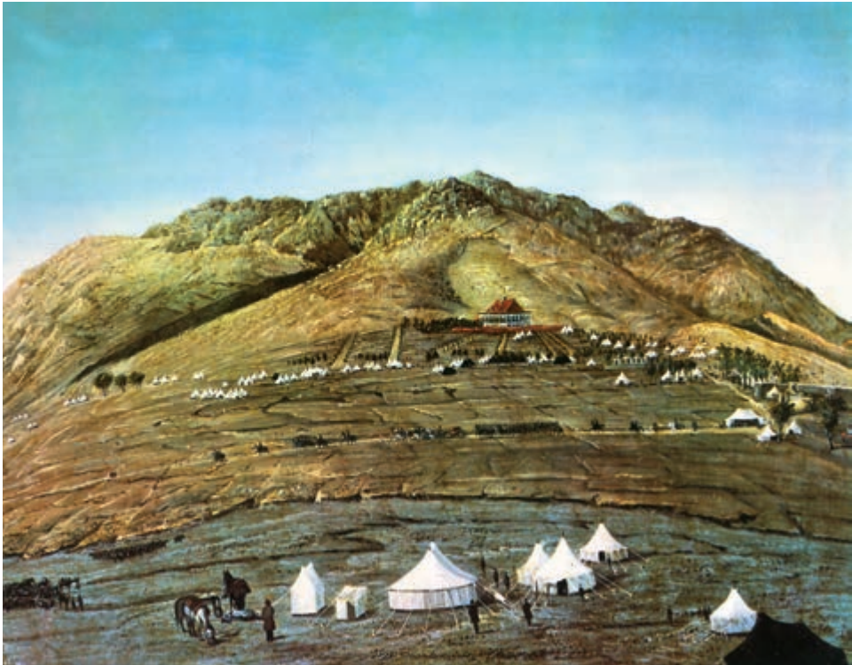
منظره سرخه حصار معماری قصر ناصریه، سال ۱۳۰۳ قمری، رنگ و روغن، اثر استاد کمال الملک